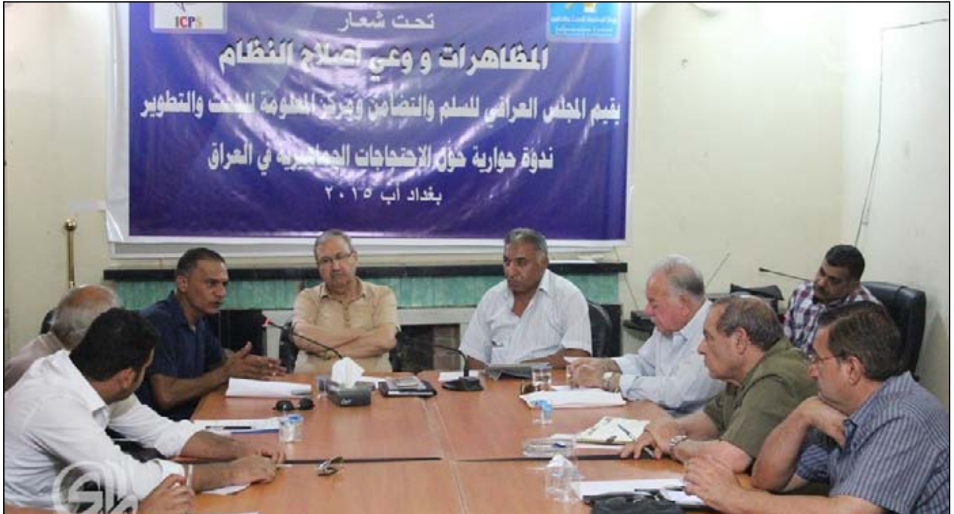
ناشطون يعدون إصلاحات الحكومة والبرلمان ترقيعية

الدولة بنحو رصين ونزيه". وطالب الناشط، بضرورة "إصلاح السلطة القضائية وإقالة رئيسها مدحت المحمود، وتغيير قضاة محاكم الاستئناف جميعاً، وإنهاء مبدأ المحاصصة في السلطة التنفيذية، وحل مجالس المحافظات الحالية وسحب امتيازاتها ومخصصاتها وحماياتها"، مؤكداً أن "التظاهرات سستمر وقد تأخذ مساحاً زمنية متباعدة لمتابعة تنفيذ مطالبها". التحالف المدني الديمقراطي: القضاء على المحاصصة يبدأ من رأس السلطة التنفيذية على صعيد متصل قال رئيس التحالف المدني الديمقراطي، علي الرفيعي، في حديث إلى (المدى برس)، إن "ورقتي الإصلاح الحكومية والبرلمانية جاءتا لتلبييا بعض مطالب المتظاهرين"، عاداً أن "الإصلاحات ينبغي أن تركز على تقنيت نظام المحاصصة الذي يتجلى في مجلسي الوزراء و النواب، وتتبعه الأحزاب المهيمنة على السلطة". وأضاف الرفيعي، أن "المحاصصة تعد