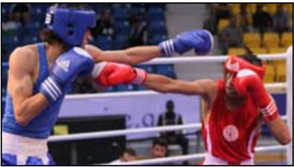
تقاؤل ملاكبنا بتحقيق الانجاز في بطولة آسيا