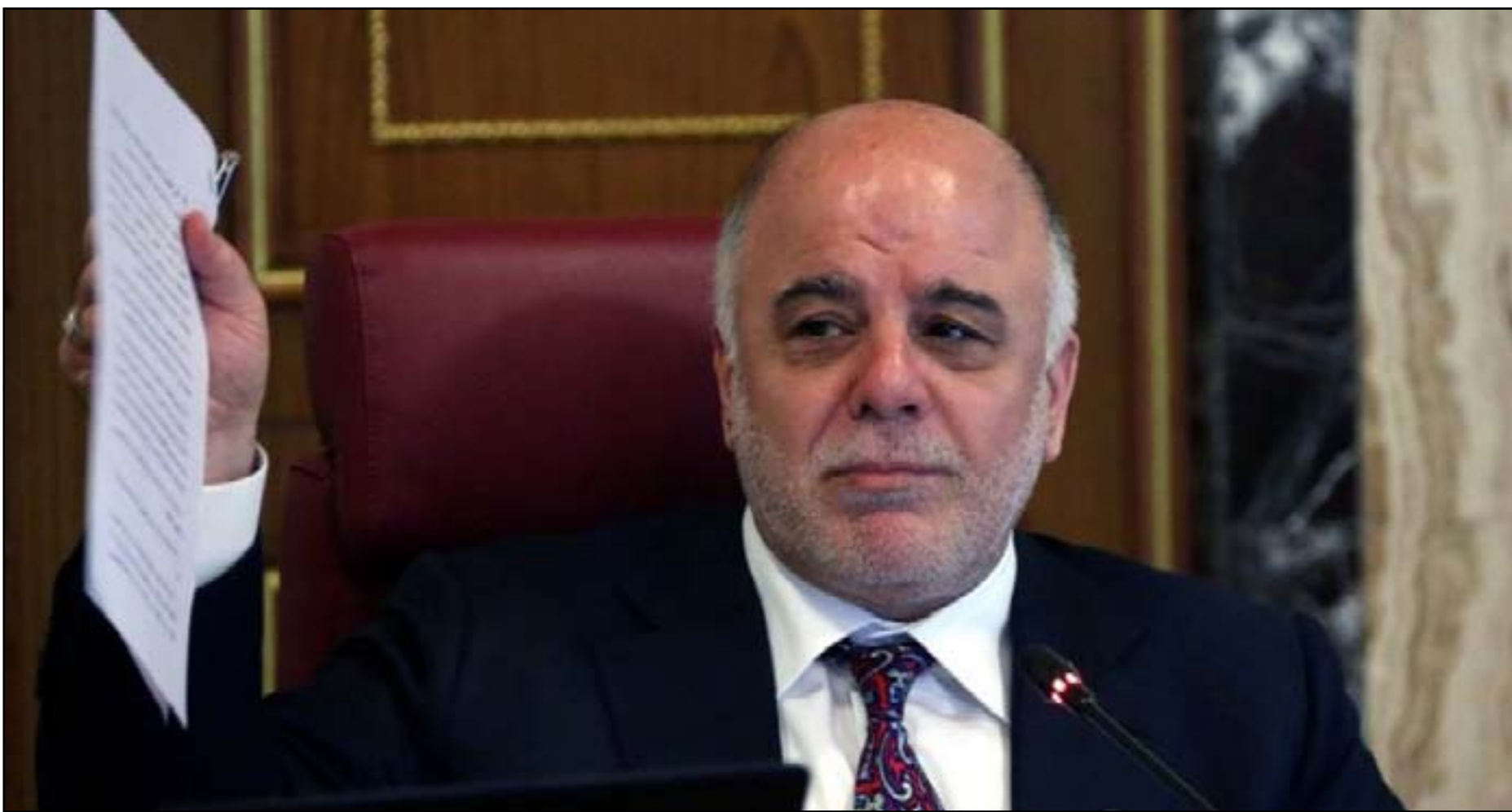
العبادي يحمل ورقة الإصلاحات..أرشيف

ويقدر مسؤولون انه بسبب الفساد فقدت خزائن الحكومة منذ العام ٢٠٠٣ ما بين ٣٠٠ الى ٣٥٠ مليار دولار، وكان العراق وفقاً لتقرير مؤشر الشفافية الدولية للفساد في العام الماضي، قد تبديل قائمة اكثر عشر دول فسادا في العالم باحتلاله المرتبة ١٧٠ من مجموع ١٧٥ دولة. وبينت الصحيفة انه "إضافة الى تقديم الرشي للحصول على وظائف حكومية فإن المواطنين وجدوا انه من الضروري ان تدفع رشاشاً لتمشية اي معاملة حكومية وتخطيطها النظام