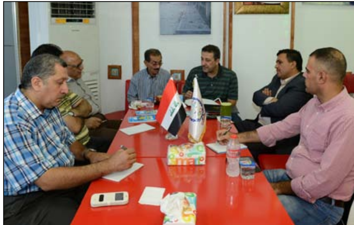
جانب من اجتماع اتحاد القادة مع اتحاد الصحافة الرياضية

تواصل اتحاد إعداد القادة الرياضيين واتحاد الصحافة الرياضية الى صيغة نهائية مسودة تشريع تعديل جديد لقانون الرياضيين الإبطال والرواد يسمح بضم رواد وشهداء الصحافة الرياضية والصحفيين الرياضيين وشمولهم بالمخ والامتيازات. وجاء ذلك خلال الجلسة الحوارية التي ضيف فيها اتحاد القادة، اللجنة التي تم تشكيلها وضمت عدداً من الزملاء الصحفيين والخبراء والقانونيين للتحضير لمسودة