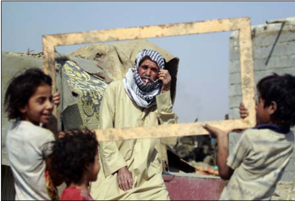
عائلة عراقية تعيش في مكب للنفايات على اطراف مدينة الديوانية.