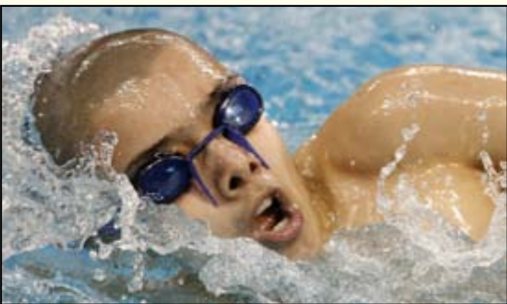
تأهب منتخب السباحة للدخول في معسكر صيني

في اطار اتفاقية التعاون الموقعة بين اللجنة الاولمبية ونظيرتها الصينية وبالتنسيق مع سفارة بلانها في بغداد ، مؤكداً ان هذا المعسكر سينعكس ايجاباً على الواقع العام للعاليين استناداً الى المستوى الفني العالي الذي تتمتع به اللعبة هناك على المستوى العالمي حيث سيشهد تدريبات مشتركة بين سباحي البلدين الصديقين في الوقت الذي تم تهيئة طبياح لبناني يقوم بمهمة اعداد الطعام العراقي والعربي لأعضاء الوفد، ويأتي ادخال هذه الاسماء