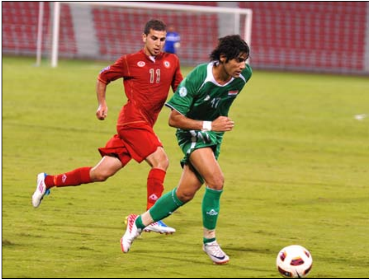
من مباراة سابقة لمنتخبنا مع لبنان في العاصمة القطرية الدوحة

وقال أشرف لـ(المدى): إن المدير الفني يحيى علوان يطمح أن تكون البروفة الاخيرة مع لبنان مفيدة من خلال تصحيح الإخطاء التي ظهرت في مباراتي لخوايا وأجانب شركات قطر فضلاً عن اختيار اللاعبين الأفضل وضمهم الى جانب عدد من المحترفين الذين سيتم تسميتهم من بين ١٦ لاعباً يلعبون في الاندية العربية والأوروبية والأميركية خلال الموسم الحالي والاستفادة من تشابه الأجواء ما بين بيروت مع اجواء العاصمة الإيرانية طهران وكذلك الاحتكاك بالمنتخب اللبناني الذي يُعد من المنتخبات الآسيوية التي استطاعت ان تتطور بسرعة كبيرة وتحقق نتائج متميزة على صعيد اللعبة في القارة خلال الفترة الاخيرة. وأشار أشرف الى ان منتخبنا