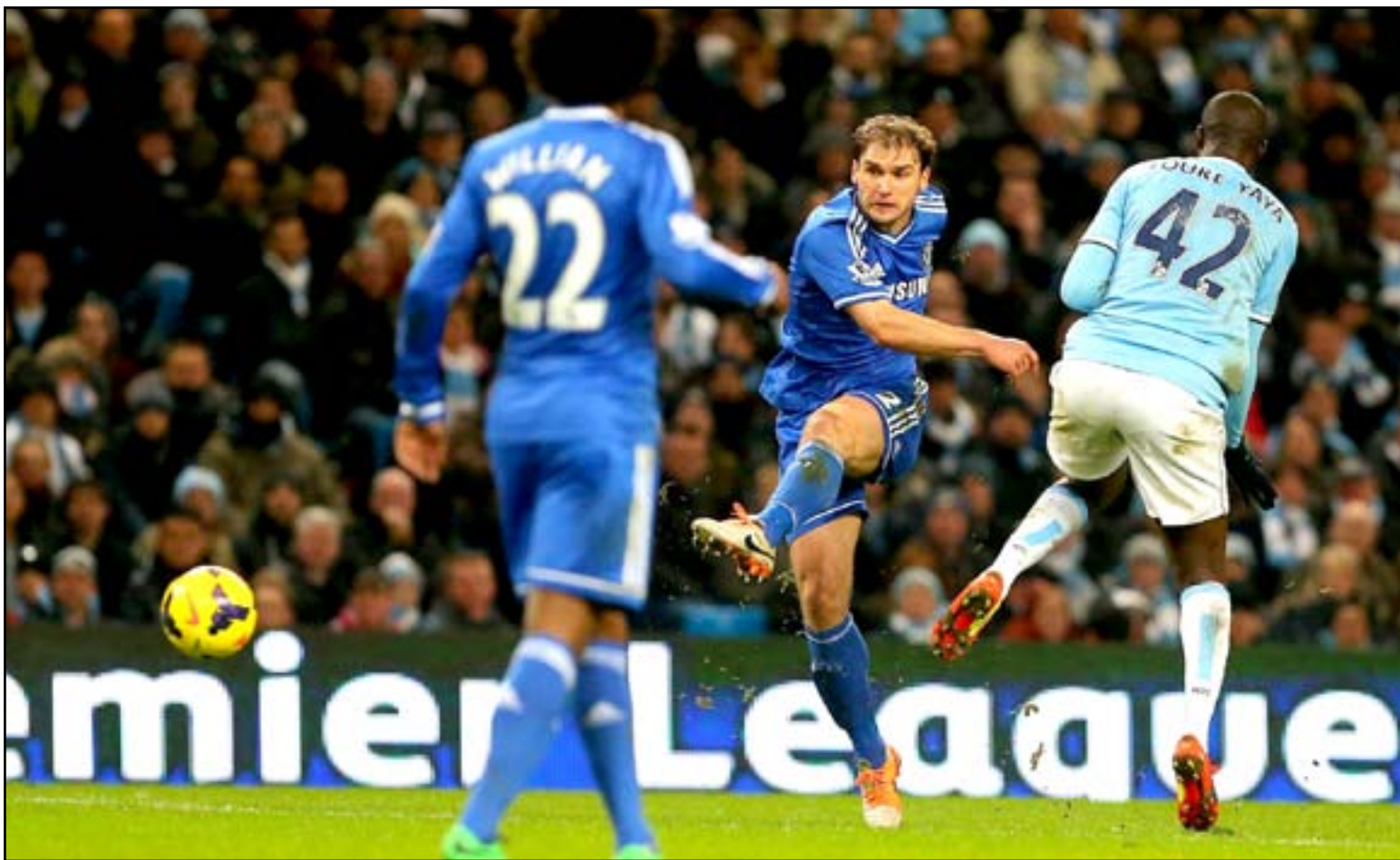
تشيلسي يسعى لانتزاع الفوز وتعويض الجولتين الماضيتين

في تصريحات صحفية "ديلي ميرور" البريطانية "أخشى أننا لم نبدأ الموسم بعد.. ما زلنا نحاول إيجاد طريقنا إنها فترة انتقالات غير منظمة بالنسبة لنا". وأضاف "بمجرد عبور فترة الانتقالات، يمكن لأوضاعنا أن تستقر ويمكننا البدء في إعداد الفريق بالطريقة التي نرغب فيها استعداداً للموسم الحالي". وفي الوقت نفسه، يتطلع مانشستر سيتي إلى تأكيد بدايته القوية للموسم وتحقيق الفوز الثالث على التوالي عندما يحل ضيفاً على إيشرتون اليوم الأحد.