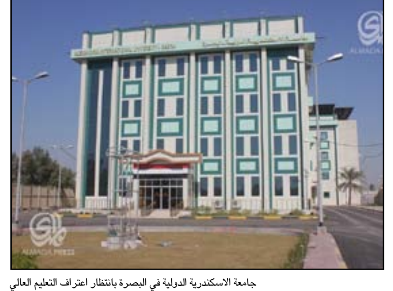
جامعة الاسكندرية الدولية في البصرة بانتظار اعتراف التعليم العالي