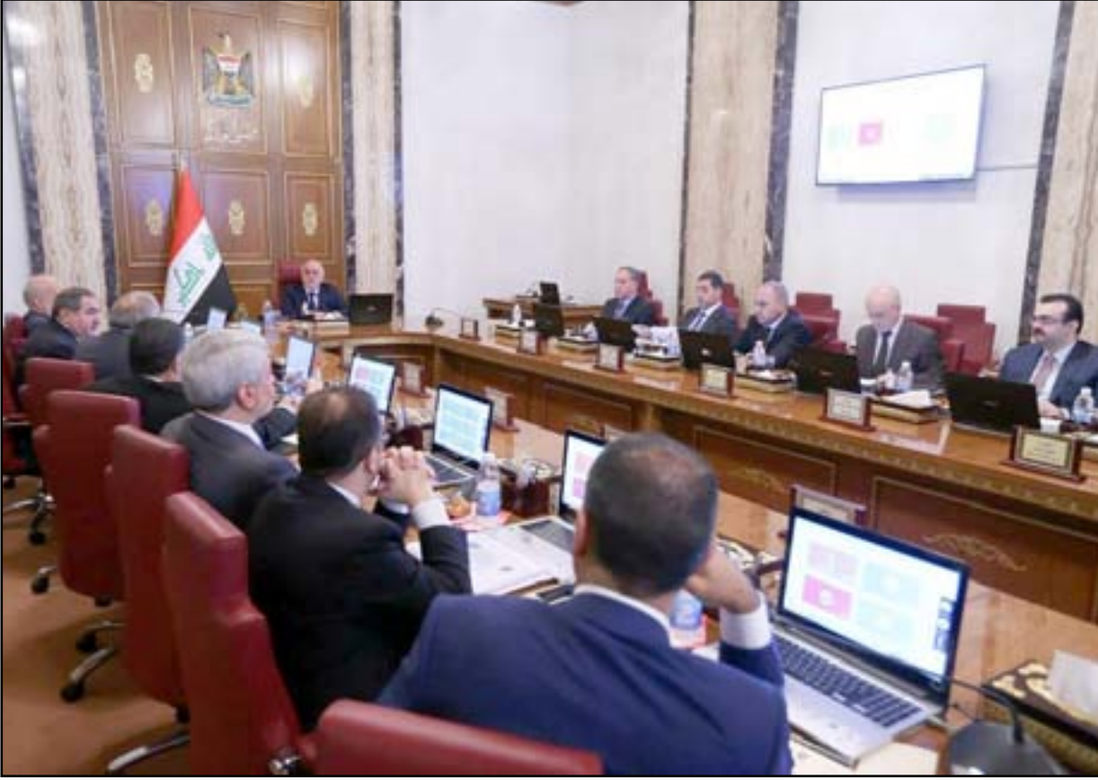
مجلس الوزراء بعد الترشيح

يعتزم رئيس الوزراء، خلال الأيام المقبلة، إطلاق حزمة إصلاحات جديدة تتمثل بتقليص الكابينة الحكومية الذي قد يؤدي لاستبدال ثلاثة وزراء تدور حولهم اتهامات بالفساد. ويرجح ان تتضمن الحزمة الحكومية اقالة وزير الكهرباء ودمج وزارته بوزارة النفط، ودمج وزارتي الموارد المائية والزراعة.