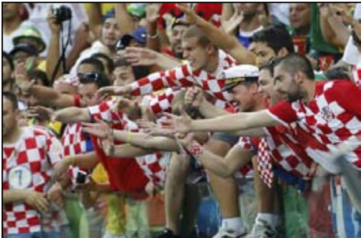
الجمهور الكرواتي يسبب حرجاً لاتحاد الكرة

سبلت يوم ١٢ حزيران الماضي. انتهت المباراة بالتعادل ١ - ١، ولكن (فيفا) خصم نقطة من كرواتيا وتم تغريم الاتحاد ١٠٠٠٠٠ يورو (١١٠٠٠٠ دولار) إضافة إلى خوض مباراتين من دون جماهير وتم حرمان سبلت من استضافة المباريات