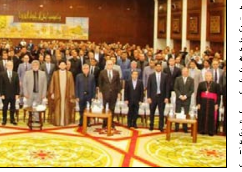
جانب من الحفل التأييني أمس

وحذر أبرز قادة الحشد الشعبي بعض السفارات أن "تعبد حساباتها في بعض الخطوات التي اتخذتها والتي تحاول أن تلعب بالنار"، مؤكدا أن "سيادة العراق خط أحمر ولا نسمح لأي كائن ان يلعب بالسيادة". وحذر الأمين العام للمنظمة من