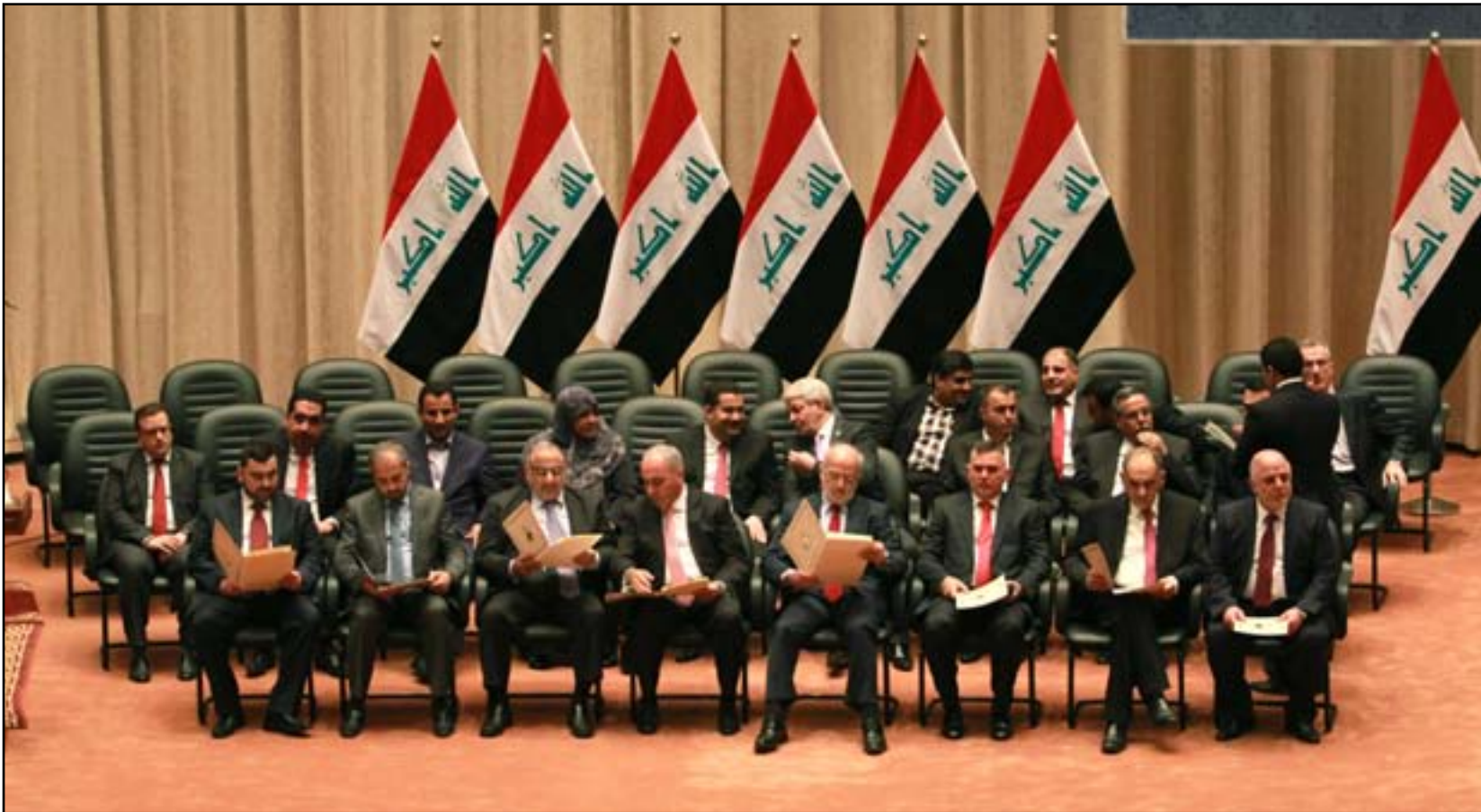
جلسة منح الثقة للحكومة .. ارشيف