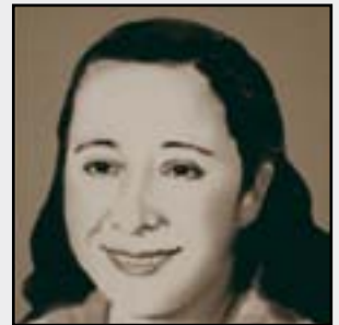
ولادة الشاعرة نازك الملائكة

في مثل هذا اليوم الثالث والعشرين من اب عام ١٩٢٢ ولدت الشاعرة الكبيرة نازك الملائكة والتي تعد واحدة من أبرز وجوه التجديد والمعاصرة في الشعر لكن نازك نفسها قالت في كتابها «قصايا الشعر المعاصر»، بأنها أول من كتبت قصيدة الشعر الحر، وهي قصيدة «الكوليرا» عام ١٩٤٧ التي تضمنتها ديوانها الثاني «شفايا ورماد» ومن بغداد نفسها زحفت هذه الحركة وامتدت حتى انتشرت