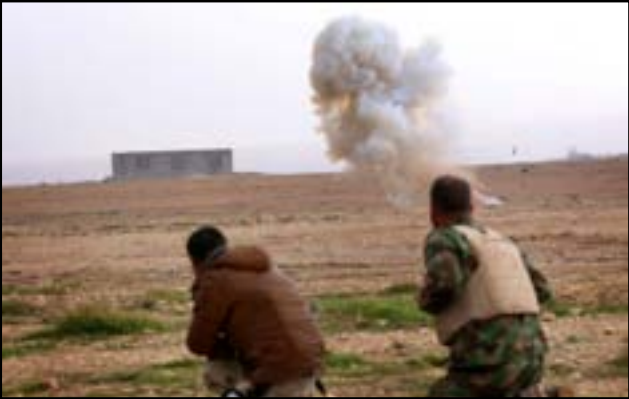
قوات البشمركة في سنجار

"المعلومات الاخيرة التي تحدثت عن احتمال استخدام اسلحة كيميائية في العراق من جهة غير رسمية تثير قلقا كبيرا". كما أعلنت وزارة الدفاع الامنية، الاسبوع الماضي، "ان لديها معلومات تفيد بأن هجوما بالاسلحة الكيماوية استهدف قوات البشمركة، وأصيب العديد منهم" بالتهابات في الجهاز التنفسي. وفي آذار كانت حكومة كردستان العراق اكدت ان لديها ائلة عن استخدام التنظيم غاز الكلور ضد قواتها في هجوم بسيارة