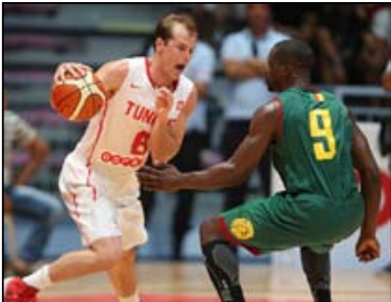
تونس تهزم نيجيريا سلويا