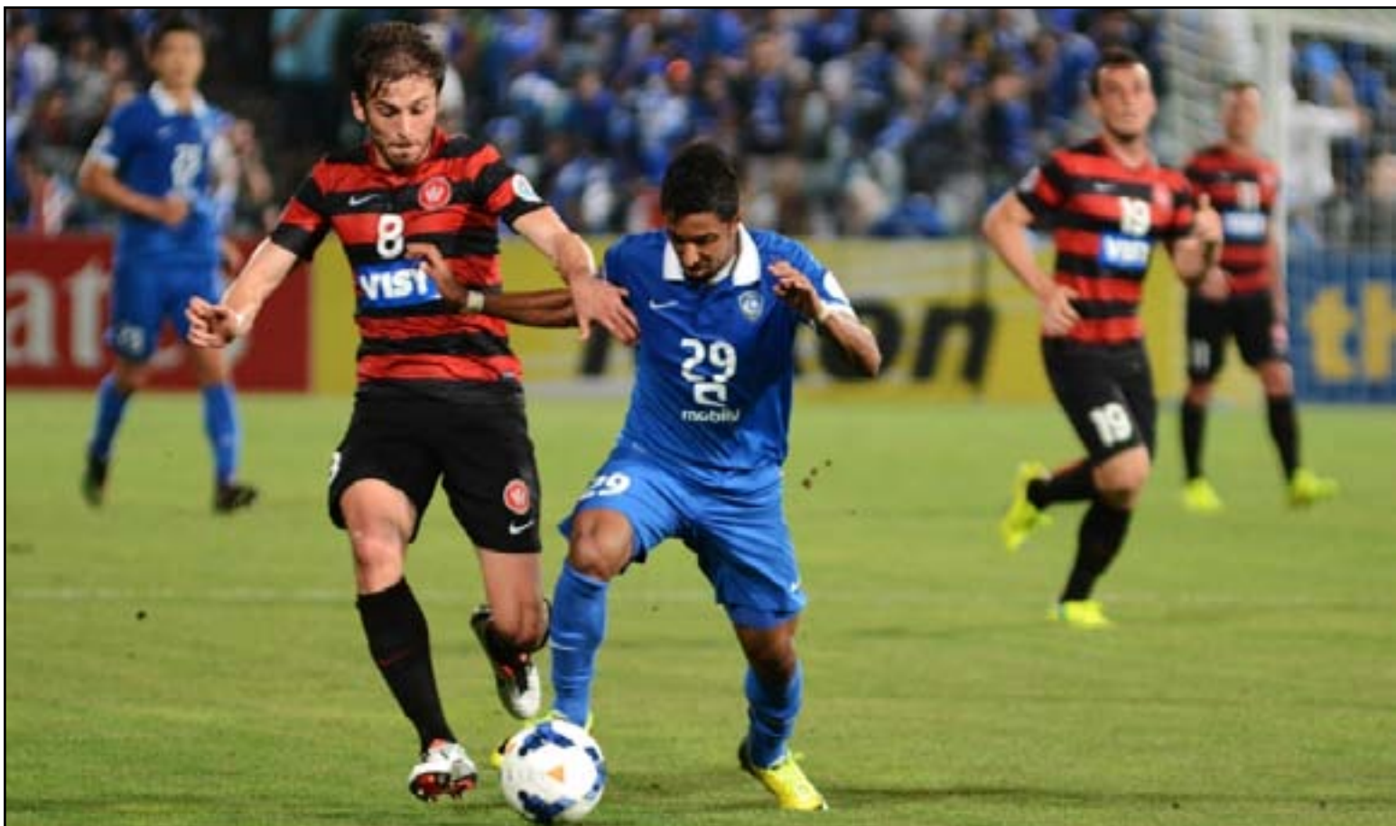
الهلال يسعى لتعويض خسارته مع لخويا اليوم

في المقابل سيخوض لخويا اللقاء تحت قيادة المدرب الأرجنتيني جمال بلماضي