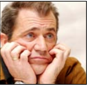
نفي الممثل الأمريكي ميل غيبسون الاعتداء على مصورة بريطانية حاولت تصويره مع صديقه في مدينة سيدني الأسترالية.