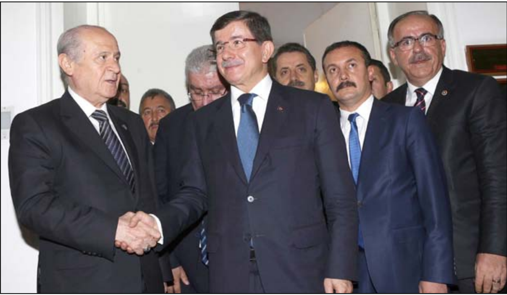
رئيس الوزراء التركي أحمد داود أوغلو يصافح رئيس حزب الحركة القومية زعيم المعارضة دولت بيجلي