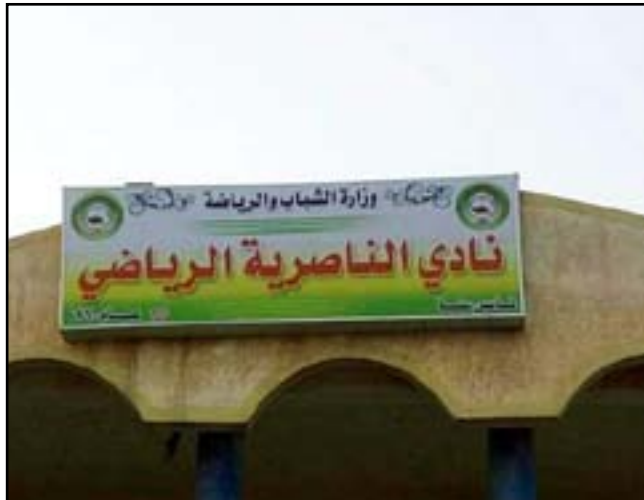
الفر الجديد لنادي الناصرية

أجل توفير الدعم لفريق كرة السلة العائد إلى الدوري الممتاز. ورجّح رئيس نادي الناصرية حسم مشاركة سلة الناصرية في الدوري من عدمها خلال الساعات القليلة المقبلة، واضعاً الكرة في ملعب الحكومة المحلية بعد لقاء عاجل سيجتمع الهيئة الإدارية برئاسة المجلس في محافظة ذي قار.