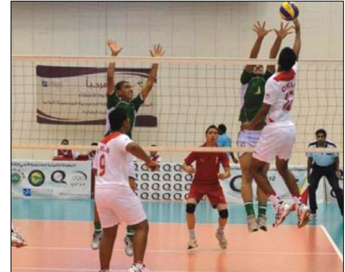
بدء منافسات اندية الدرجة الاولى لكرة الطائرة

واضاف: ان منافسات منطقة الفرات الأوسط ستقام في قاعة الكوفة وتضم الخيرات والكوفة والقاسم والنعمانية وبلادي