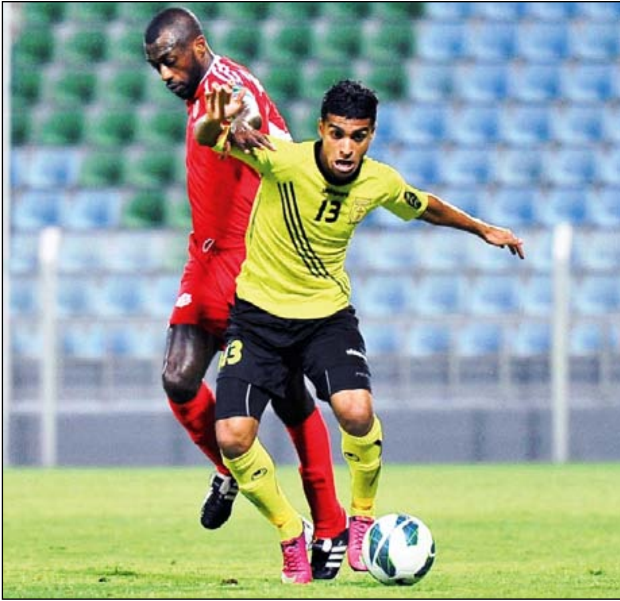
ظفار يكمل جاهزية صفوفه قبل بدء التحدي