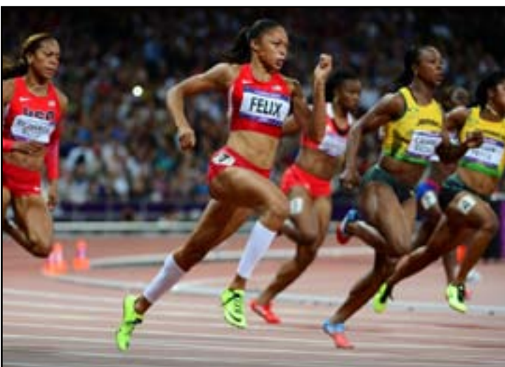
فيلكس تتأهل بسهولة في تصفيات ٤٠٠م