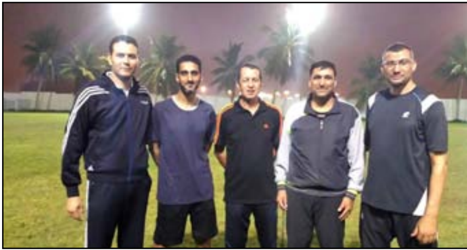
الملك التدريبي يعتزم القبض على اللقب