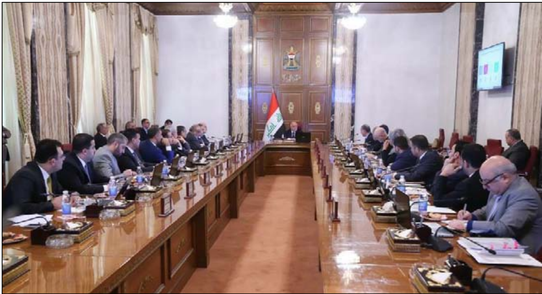
جلسة مجلس الوزراء