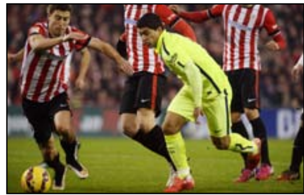
سواريز يحفظ ماء وجه البطل

تشهد انطلاقة الدوري الاسباني عمقا تهديفيا حيث سُجّلت ثلاثة أهداف في سبع مباريات حتى الآن، وانتهت اربع مباريات بتعادل سلبي. وبرغم الفوز الصعب في بداية حملة الدفاع عن لقبه، حقق الفريق الكاتالوني جزءا من ثأره من بلباو الذي حرّمه من احراز السداسية بعد ان خطف الكأس السوبر الاسبانية منه قبل ايام.