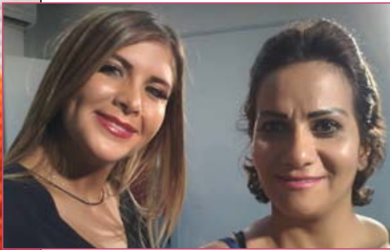
ألين لحدود مع المحررة

★ قررت النجمة اللبنانية كارول سماحة طرح البومها الجديد الذي انتبخت من تسجيله بالكامل، قبل أن تدخل في شهر حملها الأخيرة، بعد أن تضع مولودها الأول وتطمئن على سلامته وسلامتها، حيث لم يتبق للنجمة سوى أسابيع قليلة لتصبح أما، ومن المقرر أن تضع مولودها في كندا.