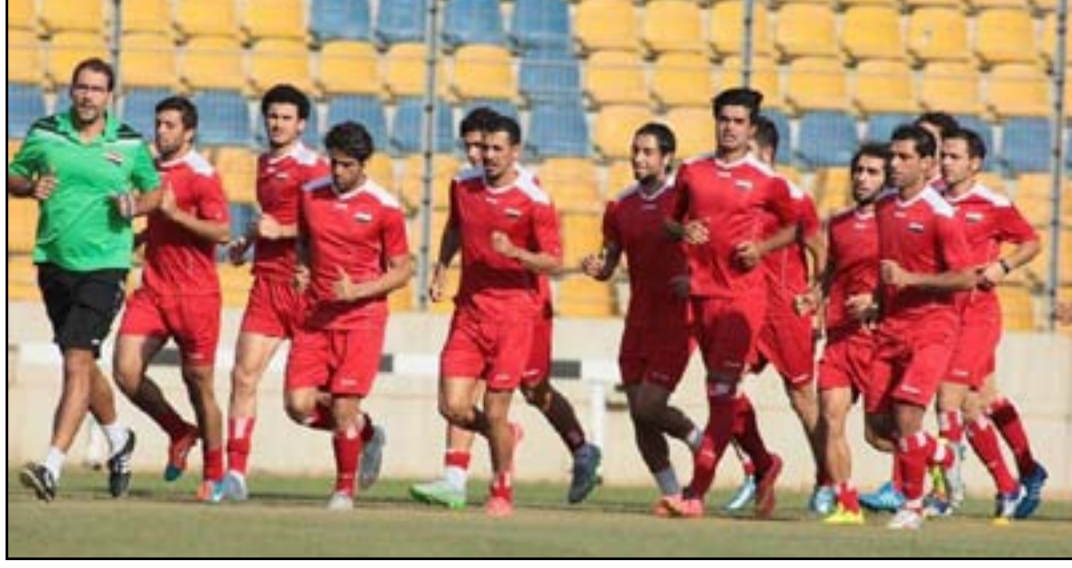
لاعبو منتخبنا يؤدون التمرين الأخير قبل مواجهة لبنان..