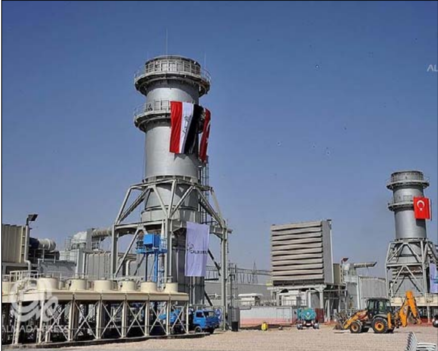
محطة كهرباء الخيرات في كربلاء

مزمنة في العراق، لاسيما بعد سنة ٢٠٠٣، إذ لم تفلح جهود الحكومة في الارتقاء بواقعها برغم انفاق أكثر من ٣٠ مليار دولار، والوعود الكثيرة "المغرقة بالتفاؤل" التي أطلقها كبار المسؤولين بما فيهم رئيس الحكومة السابق، نوري المالكي، ونايئه لشؤون الطاقة، حسين الشهرستاني، وهو ما أدى إلى تفجير الغضب الشعبي أكثر من مرة، آخرها ما تشهده ١١ محافظة منذ (٣١ تموز ٢٠١٥) وحتى الآن.