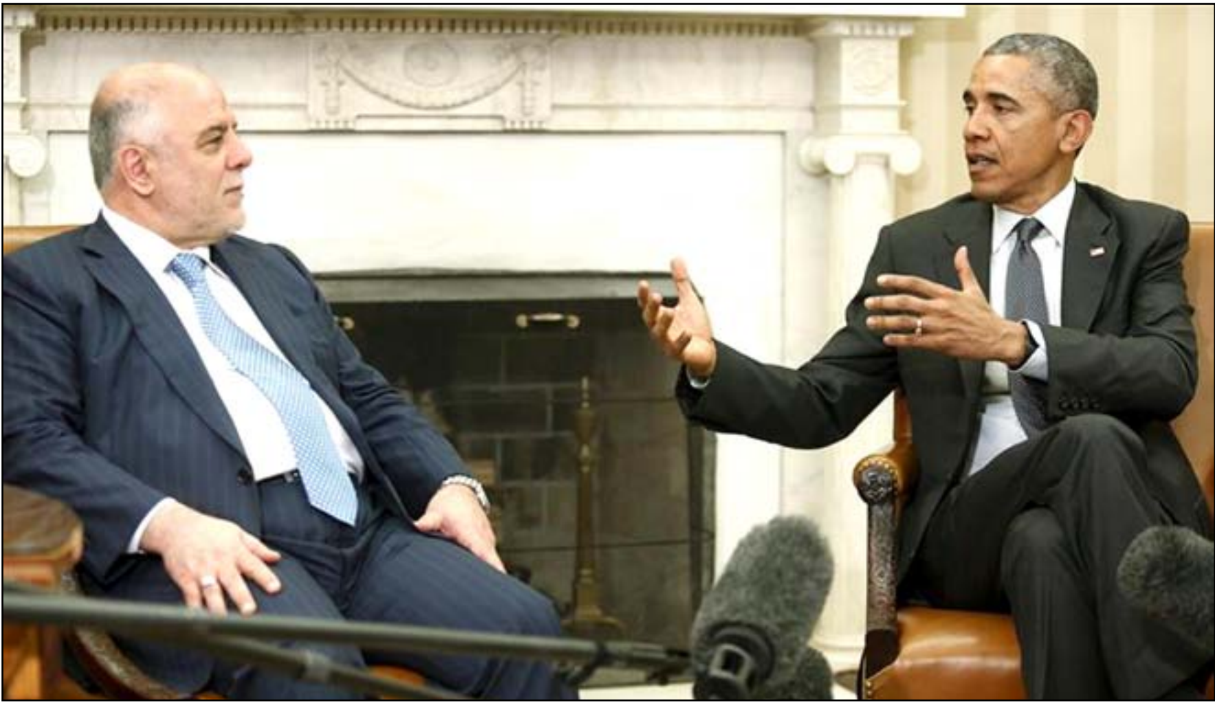
أوباما والعبادي في لقاء سابق

منذ أن غادر منصبه، جاء جيب بوش ليتشاور مع العديد من أصدقائه الجمهوريين، وانفقوا على ألا يسترجعوا أخطاء الماضي وأن يركزوا بدلاً من ذلك على مستقبل السياسة الخارجية الأميركية. ومع ذلك، فإن محاولات مرشح الرئاسة الجمهوري جيب بوش لإعادة كتابة التاريخ خلال سلسلة من الظهور في حملته الانتخابية الأسبوع الماضي لا يمكن أن تستمر دون أن يتم انتقادها. ويسعى المحافظ جيب بوش بوضوح إلى إعفاء إدارة أخيه من المسؤولية عن المشاكل التي تحدثت اليوم في العراق، عن طريق إلقاء اللوم على الرئيس براك أوباما وهيلاري كلينتون؛ بسبب ظهور تنظيم داعش في العراق والشام، وربما يخدم هذا الطرح مصالح بوش السياسية، ولكنه يسيء إلى الحقيقة. ولا يمكن لأي مناقشة حقيقية تتناول الوضع الحالي في العراق أن تغفل الأخطاء التي تم ارتكابها من قبل إدارة بوش خلال حقبة الغزو وتداعياتها، ويرتكز كثير من هذه الأخطاء على معلومات استخباراتية خاطئة، وافتراسات معيبة حيث أرسلوا عددًا قليلاً من القوات لتأمين البلاد، واستبدلت الحكومة التي كانت بمثابة عدو لسود لإيران بحكومة أخرى كانت تربطها علاقات وثيقة مع طهران. وقاموا بتسريح الجيش العراقي وطرد الآلاف من الضباط السنة الذين بدؤوا في وقت قريب تمرداً عنيفاً. ولم يتم الاعتراف بأي حقيقة من هذه الحقائق بواسطة المحافظ جيب بوش في خطابه بمكتبة رونالد ريغان الرئاسية، أو في ظهوره في إطار حملته الانتخابية في ولاية أيوا؛ لأنها تقوض محاولاته لإلقاء اللوم على الآخرين. وبحسب طرح جيب بوش الجديد، فإن الخطأ الأميركي الفاتل في العراق