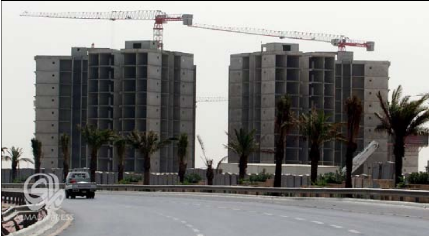
مشروع الزهور السكني الواقع على جانب طريق محمد قاسم السريع في منطقة النعيرية شرقي بغداد

□ أكاديمي: الاستثمار القطاع الأكثر تضرراً من عمليات الفساد المالي والاداري