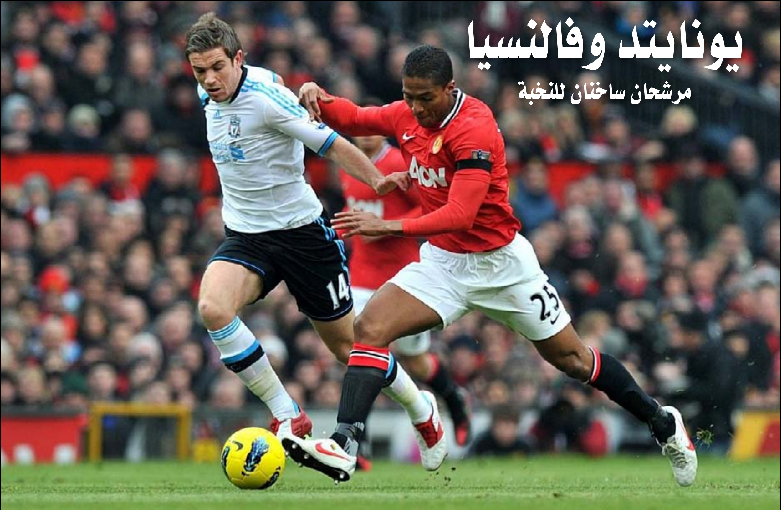
لقاء صعب للمان مع كلوب في دوري الابطال

نجاحه في بداية (بونوسيلغا) بفوزين متتاليين. ويلعب اليوم الثلاثاء شاخنار دانيفيتسك الأوكراني مع رايبند فيينا النمساوي (٠-١)، ودينامو زغرب الكرواتي مع سكينديريو الالباني (١-٢) وغدا الأربعاء اوبول القبرصي مع استانس الكازاخستاني (١-٠) وبارتيزان بلغراد الصربي مع باتي بوريسوف البيلاوسي (١-٠) وسسكا موسكو الروسي مع سبور تينغ لشبونة البرتغالي (٢-١)، وتناهل الفرق الفائزة الى دور المجموعات، فيما تنتقل الفرق الخاسرة للمشاركة في الدوري الأوروبي "يوروبالينغ" انطلاقا من دور المجموعات ايضا.