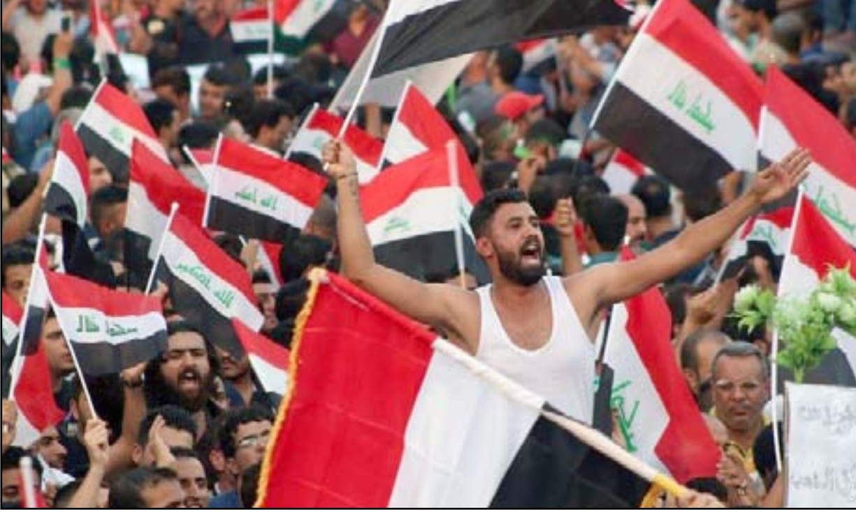
جانب من تظاهرة بابل.. أ.أ.أ.أ.

ناشطو بابل يرحبون بانتشار الجيش بعد محاولة لفض تجمعهم