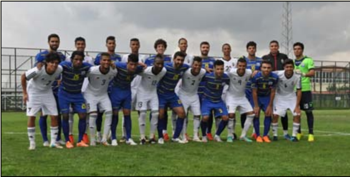
لاعبو نادي الميناء، ومنتخب ليبيا في لقاء أزمّت

وغير مدرجة ضمن أيام (فيفا دي) فضلاً عن حاجة الاندية الى تواجدهم من أجل الانسجام مع بقية اللاعبين المحليين ، مؤكداً ان هؤلاء اللاعبين سيلتحقون بمنتخبهم قبل ٧٢ ساعة من موعد مباراة سوريا وسنغافورة التي ستقام بالعاصمة العمانية مسقط يوم ٣ أيلول المقبل .