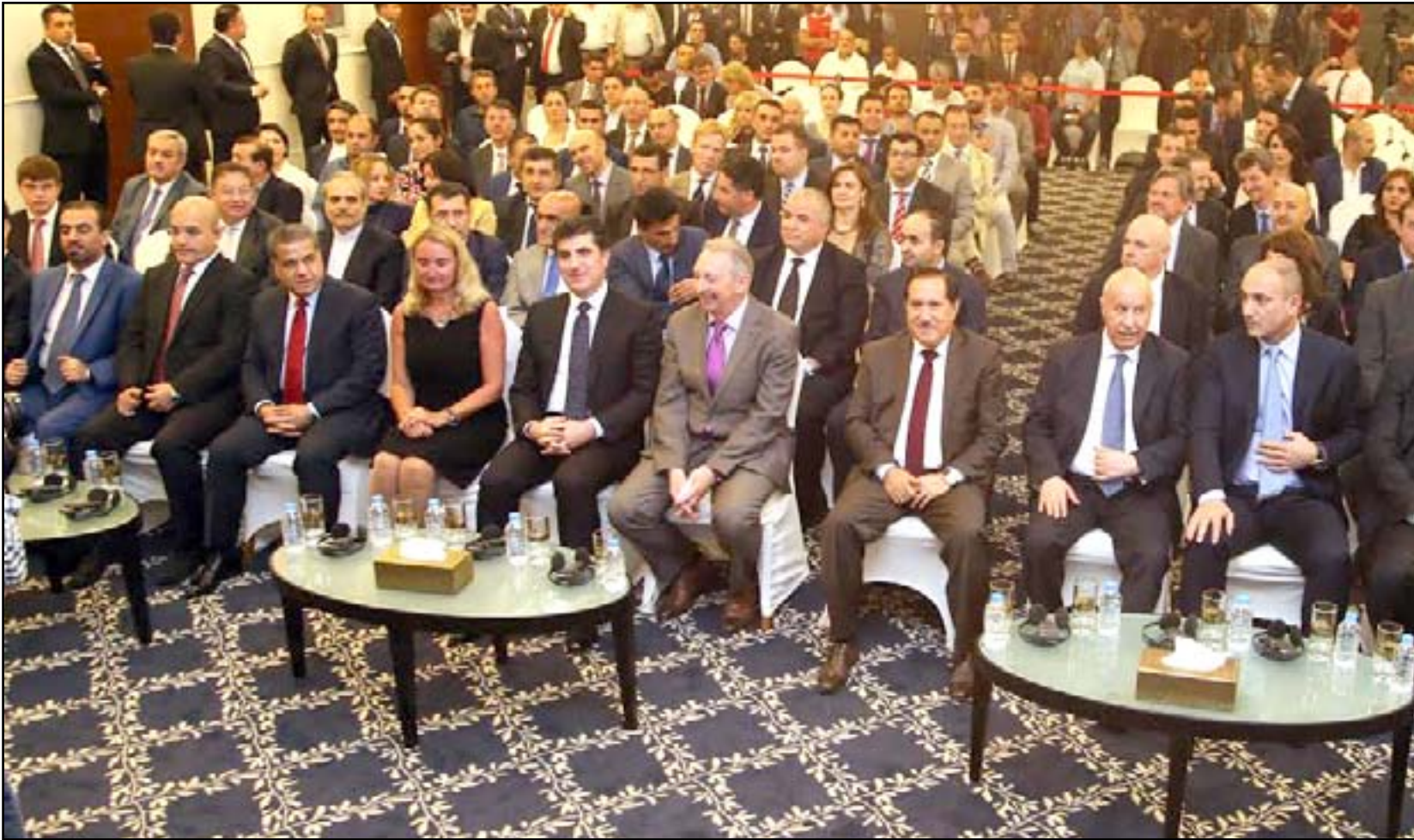
بارزاني في افتتاح ممثلة الاتحاد الأوروبي في اربيل

كما وصف زيادة الممثلات الأجنبية في إقليم كردستان إلى ٣٣ ممثلة، كانعكاس إيجابي لسياسة الانفتاح التي تنتهجها حكومة إقليم كردستان بوجه العالم، مع الأخذ بنظر الاعتبار أسس الاحترام المتبادل والمصالح المشتركة، منوها إلى أن الاتحاد الأوروبي ليس مكونا يعيش لنفسه فقط، وإنما يعيش من أجل العالم والاقتصاد العالمي وأثبت وجوده، ولا يستخدم خبراته من أجل تحسين الشروط الاقتصادية والتجارية فقط، وإنما يتعدى حدوده ويسعى بشكل جدي من أجل حماية