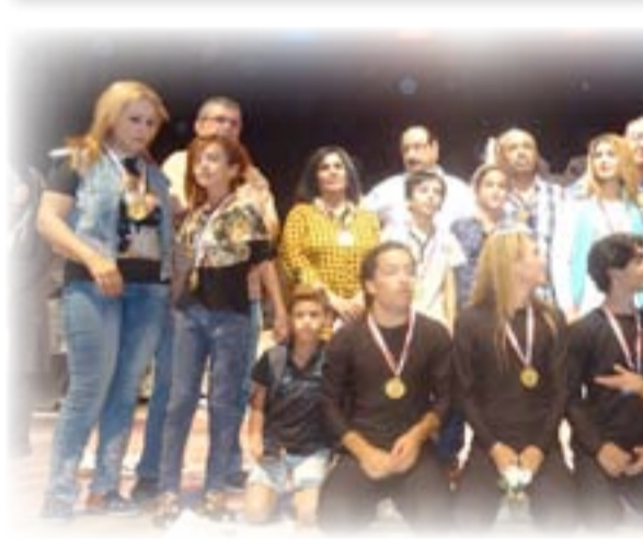
على خشبة مسرح الرافدين / المسرح الوطني اعتباراً من يوم الأحد 13 / 8 / 2015 الساعة 7 مساءً

رهط المجموعة الراقصة (تعبيريًا) يضم طفلة وطفلا، تارة تكون الراقصة عن عيد ميلاد المرأة، وخبر فيها رقصة بريئة بيضاء، فيها من الفرح والنقاء والعذوبة الكثير، ولكنها تكون في موقع آخر تعبيراً عن عيد وطني، لكن المخرج أراد منه بدعم من المؤلف، السخرية من لكنها المملخة واقعيًا، بالضحايا