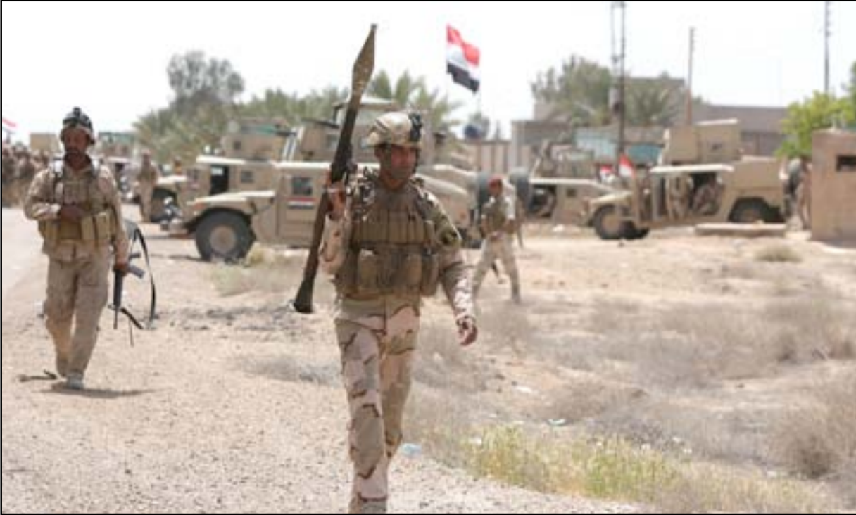
قوات أمنية وسط الكرمة.. أرشيف

تعرب اطراف في الانبار عن تفاؤلها بالدور الاميركي المتصاعد في الانبار، وتؤكد انه بات اكثر جدية في مواجهة داعش الذي يسيطر على الرمادي منذ منتصف ايار الماضي. لكن هذا التفاؤل يقترب باعتراف واضح ببطء سير العمليات العسكرية، واعتراف آخر بالحاجة لاشهر لتحرير مركز مدينة الرمادي من سيطرة داعش.