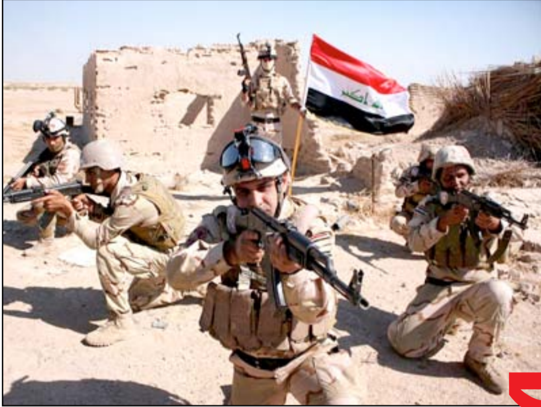
مقاتل عشائر الأنبار في قاعدة الأسد.. أرييف

بعد توقف دام أكثر من أسبوع تعاود الكتل السياسية مفاوضاتها في الساعات القليلة المقبلة لمناقشة أهم النقاط الخلافية التي تعترض تشريع قانون الحرس الوطني على أمل الاتفاق على عرضه في جلسة الثلاثاء. وتدرس قوى سياسية طرح قانون التجنيد الإلزامي كبديل مناسب عن قانون الحرس الوطني في حال عدم توصل الكتل السياسية إلى تسوية لتفظاتها.