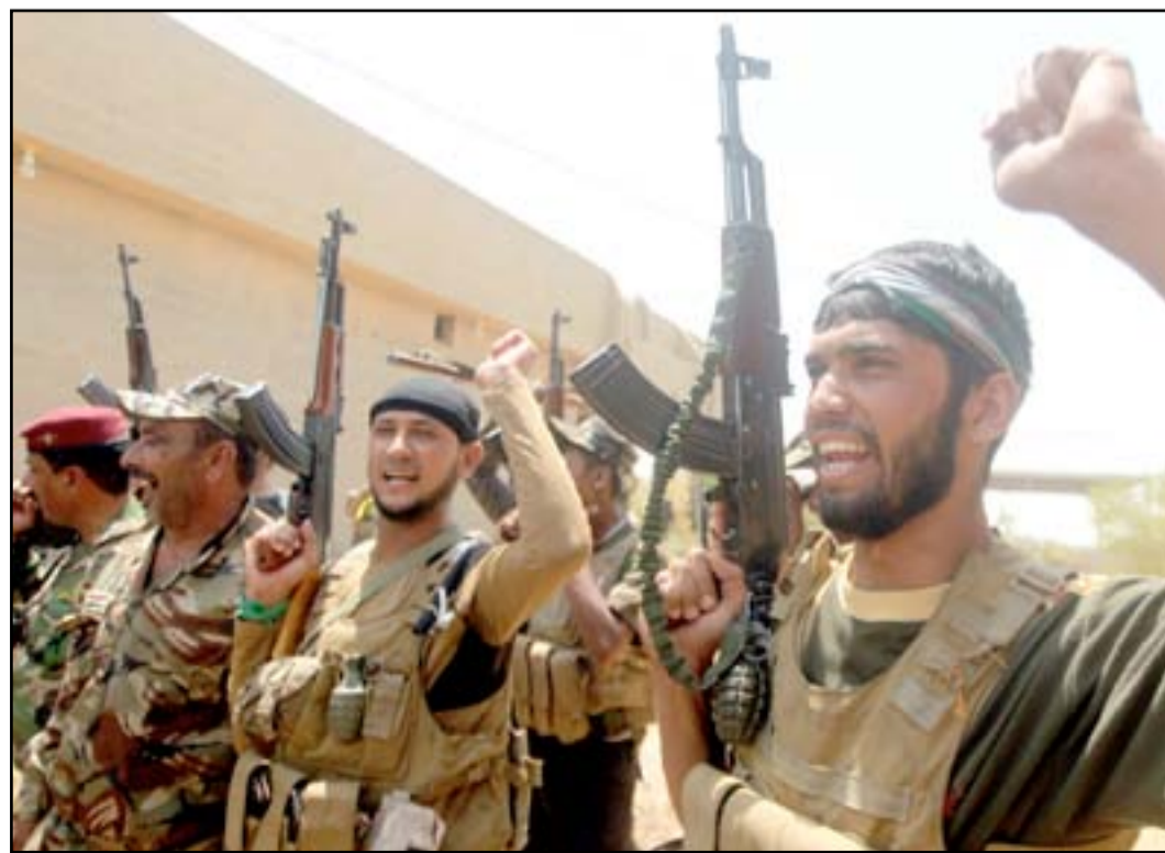
مقاتل الحشد الشعبي قرب الفلوجة.. أرشيف

وقالت قيادة عمليات بغداد في بيان تلقت (المدى برس) نسخة منه، إن "قطعات قيادة عمليات بغداد وضمن عمليات (فجر الكرمة) نفذت عملية أمنية في قضاء الكرمة، شرق الفلوجة، أسفرت عن مقتل عشرة من عناصر تنظيم داعش وإصابة عشرة آخرين". وأضافت القيادة أن "القوات الأمنية