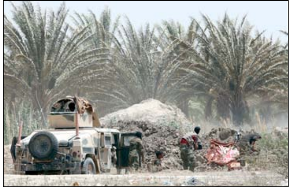
مقاتلون من الجيش والحشد قرب الفلوجة.. ا. ف. ب