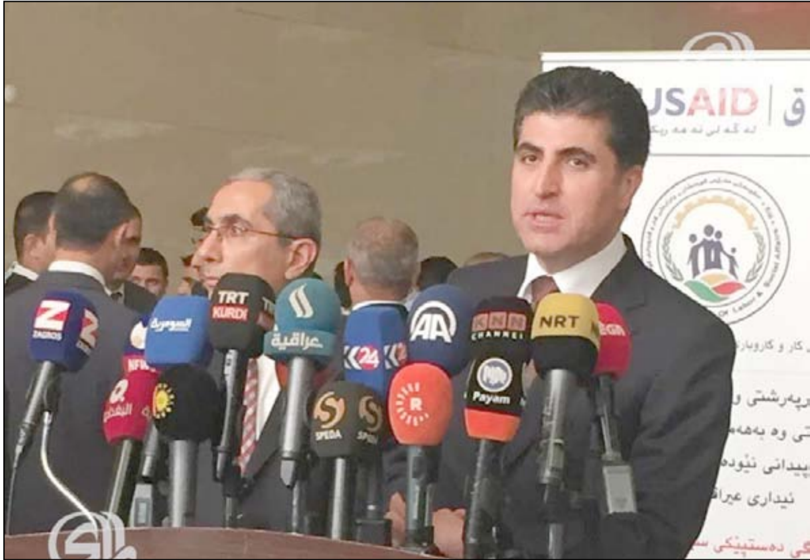
نيجيرفان بارزاني خلال مؤتمر أمس

السبت (5 أيلول 2015)، تأجيل اجتماع الأحزاب السياسية لمناقشة موضوع رئاسة الإقليم إلى الأسبوع المقبل، فيما عزا السبب إلى "صياغة" عدد من الاقتراحات لعرضها في الاجتماع المقبل. وكان رئيس إقليم كردستان مسعود بارزاني قد أكد، يوم الثلاثاء (الاول من أيلول 2015)، أن المشاكل السياسية في إقليم كردستان تدخل ضمن العملية الديمقراطية وتطورها، وفيما طمان جميع الأطراف أنه لن تحدث أية أخطاء في هذه المرحلة، لفت إلى أن هذه الأزمة أثبتت