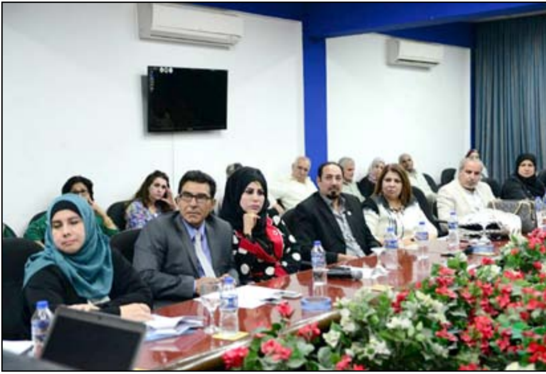
جانب من الدورة التي اقامها منتدى الاعلاميات حول انتشار ظاهرة التحرش

تحرش بل هي منظومة اجتماعية كاملة غيرت من نظرة المجتمع للمرأة وحَدّت من طموحها في المناقشة على الوظائف المهمة والتعليمات والتحرك والتقل بحرية والتعليمات المعمول بها حالياً ورسمياً جزء من هذه الأسباب.