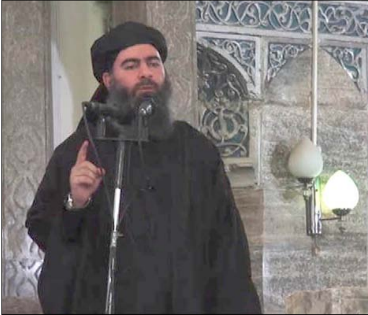
البغدادي يلقي خطبة في احد جوامع الموصل..أرشيف

داعش ينشر الغسيل القذر لهذا التنظيم، كلها تحكي عن البغدادي وتساعد في فهم كيفية صعوده لزعامته التنظيم. بناءً على هذه المصادر يمكن التوصل إلى استنتاج مختلف عن معنى ظهور البغدادي. الدرس المهم الذي يمكن استنتاجه هو ان تكون حذرين من تدوير أي حكومة، مهما بلغ استبداها، خشية خلق الفوضى التي تسمح لأمثال البغدادي بالازدهار وإقامة دولة أكثر قمعاً.