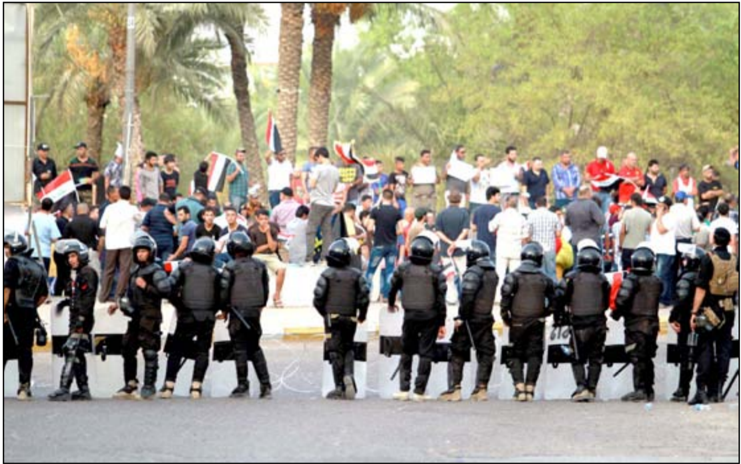
عناصر من قوات مكافحة الشغب خلال تواجدهم في ساحة التحرير..

يذكر أن المرصد العراقي لحقوق الإنسان، منظمة غير حكومية معنية بالدفاع عن حقوق الإنسان، ولديه شبكة رصد في 13 محافظة عراقية، ويعني برصد وتوثيق الانتهاكات التي يتعرض لها العراقيون.