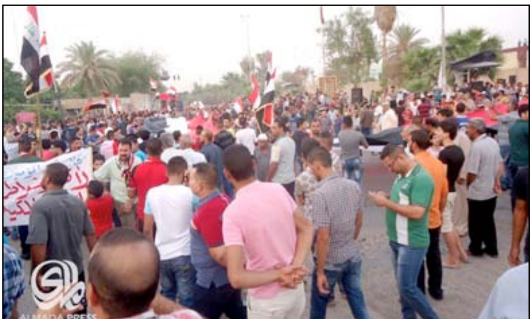
جانب من تظاهرات محافظة بابل

عمليات بابل وعضوية قادة الأجهزة الأمنية للتحقيق في حادثة الاعتداء على متظاهرين أمام مبنى مجلس المحافظة