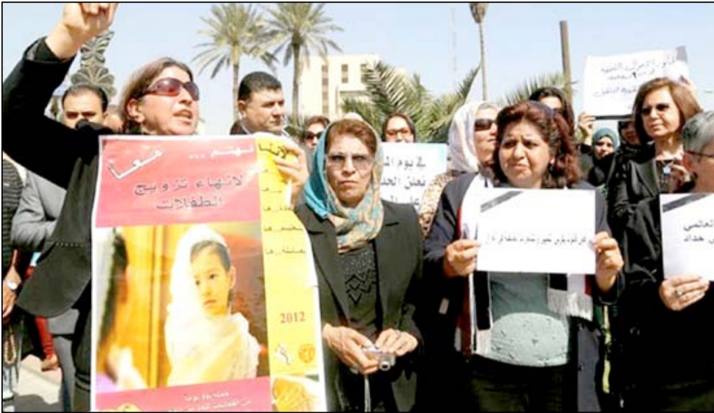
تأشطات منديبات خلال قيامهن بحملة ضد قانون الأحوال الشخصية.. أرشيف

يجتاح البرلمان إلى دائرة خاصة تتولى رصد المعارضين على أدائه تمهيدا لمقاضاتهم ، يجمع الوثائق والشواهد لتكون أدلة إثبات لإدانة من ارتكب جريمة الإساءة بحق ممثلي الشعب ، وليس من المستبعد أن يلجأ البرلمان للتصويت على قرار يحظر استخدام شبكة التواصل الاجتماعي في العراق ، ومعاينة ناشطين كانوا وراء إطلاق تسمية " مجلس النواب " حتى أصبحت شعاراً يرفعه المتظاهرون المطالبون بإبائهم من المصائب الحالية والمستقبلية؛