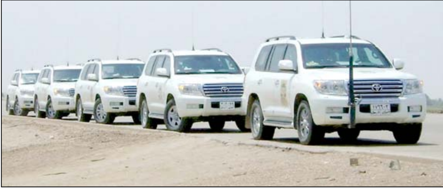
رتل تابع لشركة حماية خاصة.. أرشيف

النواب عازم على تشريع قانون الشركات الأمنية الخاصة من أجل ضبط إيقاع حركة هذه الشركات وترتيب أوضاعها فنيا وقانونيا وربطها بوزارة الداخلية. ويؤكد عضو التحالف الوطني "وجود خروقات أمنية قامت بها الشركات الأمنية في السنوات الماضية مما يثير مخاوف الجميع ويحفزها على ضرورة تنظيم عملها من خلال تشريع القانون الذي تمت قراءته الاولى". وفي السياق ذاته، يقول النائب عبدالكريم العبطان، رئيس كتلة ائتلاف الوطنية، ان "موضوع الشركات الأمنية مفصل زائد في ظل الازمة الاقتصادية الخانقة التي تمر بها الدولة العراقية"، مشيراً إلى أن "العراق لا يحتاج إلى هذه الشركات بوجود قوات نظامية في وزارتي داخلية ودفاع".