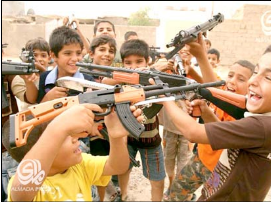
اطفال يلعبون بالأسلحة البلاستيكية

بأقل قدر ممكن وعلى وزارة النقل توفير الباصات لنقل المواطنين". إلى ذلك نفى المتحدث باسم مديرية المرور العامة، اللواء نجم عبد جابر، في حديث لـ "المدى"، "وجود أي قطع ضمن الخطة المرورية للعيد". وتابع جابر، "إذا استوجبت الضرورة ستقطع بعض الشوارع، ولكن خططنا لا يشملها أي قطع، ولدينا ٩ قواطع وزعت على المناطق التي تشهد زخماً مرورياً مثل