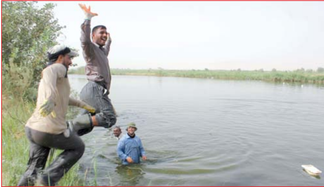
صيادون من النجف قرب احد الانهر..

غرفة عمليات لمواجهة المرض بعد وفاة 5 مواطنين