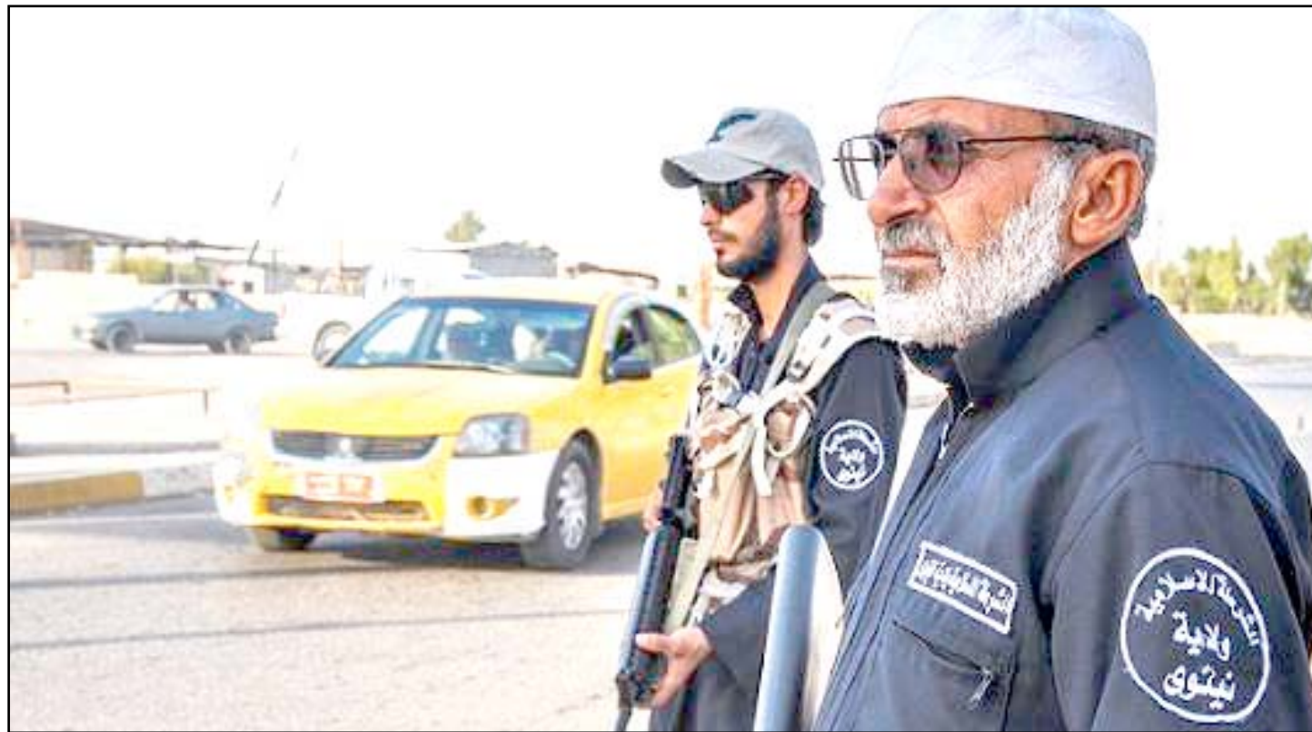
عناصر من شرطة داعش في الموصل..