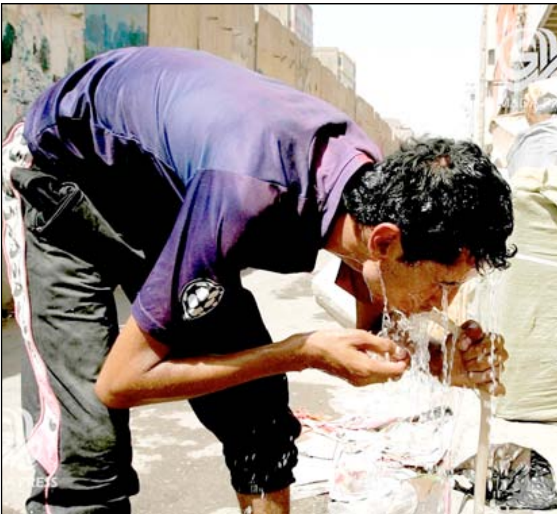
وزارة الصحة العراقية نصحت المواطنين العراقيين باضافة أقراص التعقيم لمياه الشرب

وقال محافظ بغداد، علي محسن التميمي، في بيان له تسلمت (المدى برس) نسخة منه، إن إدارة المحافظة شكّلت غرفة عمليات لوضع الإجراءات المناسبة لمواجهة مخاطر مرض الكوليرا والحد من انتشاره في المحافظة، مشيراً إلى أن "بغداد سجّلت حتى الآن 159 إصابة بالكوليرا توفي على إثرها خمسة أشخاص". وأضاف التميمي، إن "غرفة عمليات المحافظة مع لجان المتابعة المختصة، وضعت آليات وخطوات مدروسة لضمان عدم انتشار المرض في مناطق بغداد على وفق الإمكانيات المتاحة"، مبيّناً أن "الموقف الوبائي للمرض في المحافظة ما يزال غير مستقر، إذ تعمل المحافظة على محاور عدة لتعزيز الرصد الوبائي والخطة الوطنية للوقاية من الكوليرا، بكونه واحداً من الأمراض المستوطنة في العراق". ودعا المحافظ، وزارة الصحة لأن "تأخذ دورها في هذا المجال من خلال اتخاذ الإجراءات الكفيلة بعدم انتشاره، ونشر الوعي والثقافة الصحية بين المواطنين، وخلق خلايا لتعزيز التعاون بين الجهات ذات العلاقة للسيطرة على المرض"، مؤكداً على ضرورة "الرقابة النوعية لمياه الشرب المجهّزة للمواطنين، وتنفيذ الرقابة الصحية على المحال العامة ومعامل الثلج ومحطات بيع المياه المعبأة". وطلب التميمي، بضرورة "تنفيذ حملة إعلامية واسعة لتعريف المواطنين بالمرض