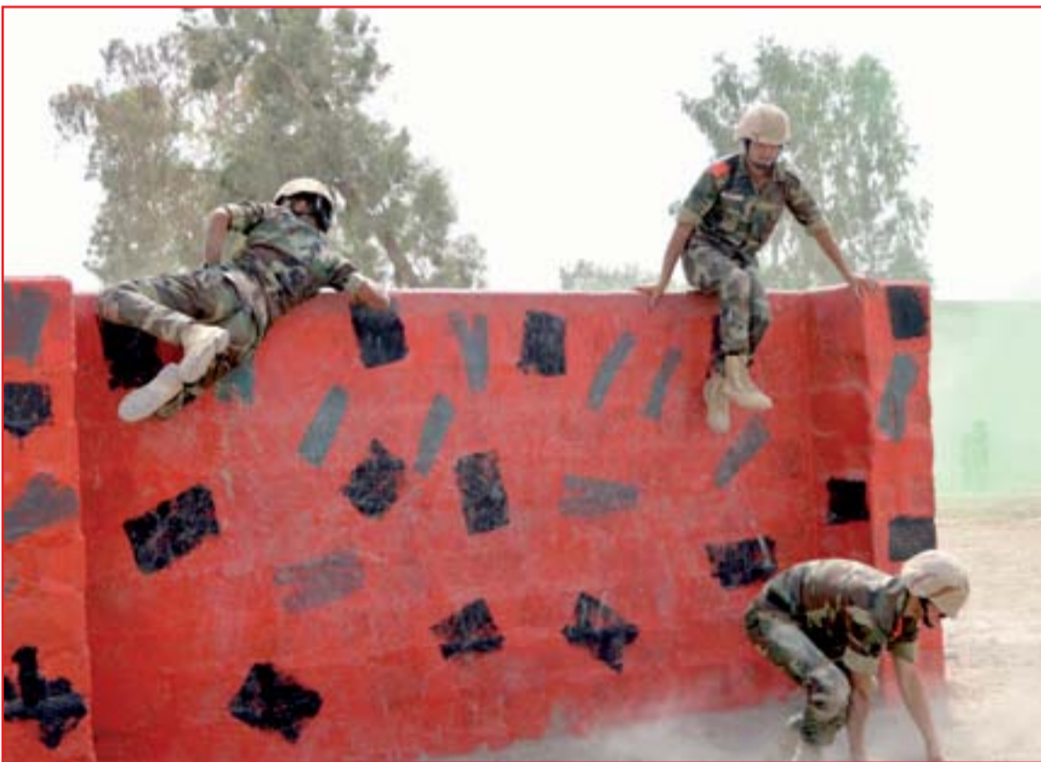
عناصر من الفرقة الخاصة يتلقون تدريباتهم في الكلية العسكرية ببغداد..