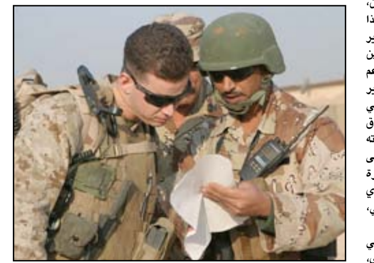
مستشار أميركي في قاعدة الأسد.. أرشيف