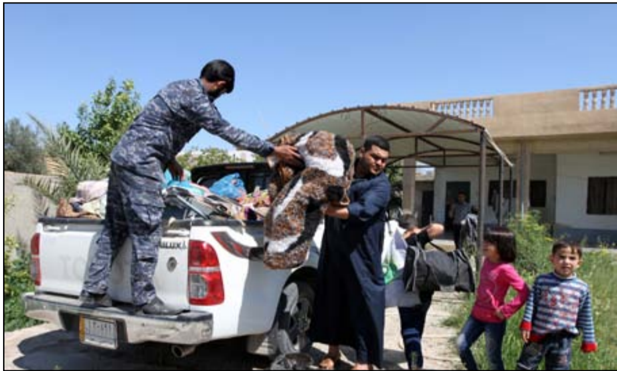
أسرة تكريتية تعود لمنزلها.. أ.رشيف

وأضاف المكتب الإعلامي لرئيس الوزراء أن المنظمة اعتمدت على تسجيلات فيديو غير موثقة واتصالات هاتفية عن أعمال سلب ونهب وتدمير وعدتها شهادات لشهود محليين، وشككت دون مبرر، بأعداد ضحايا جريمة سبايكر الذي اعترف داعش بارتكابها، مؤكداً أن "هذا التقرير مملوء بالمغالطات والشهادات غير الموثقة وينطوي على تحريض طائفي غير مبرر وتحريف للحقائق". ولفت البيان الحكومي إلى أن رئيس مجلس الوزراء حيدر العبادي أصدر اوامر مشددة في ٢٠١٥/٤/٣ للقوات العسكرية والأمنية بالتصدي لحالات التخريب التي تمارسها عصابات تريد تشويه الانتصارات التي حققها الجيش العراقي والحشد الشعبي". وأكد المكتب الإعلامي لرئيس الوزراء أن "العبادي دعا القوات الموجودة في تكريت إلى إلقاء القبض على كل شخص يقوم بمثل هذه الأعمال والحفاظ على الممتلكات