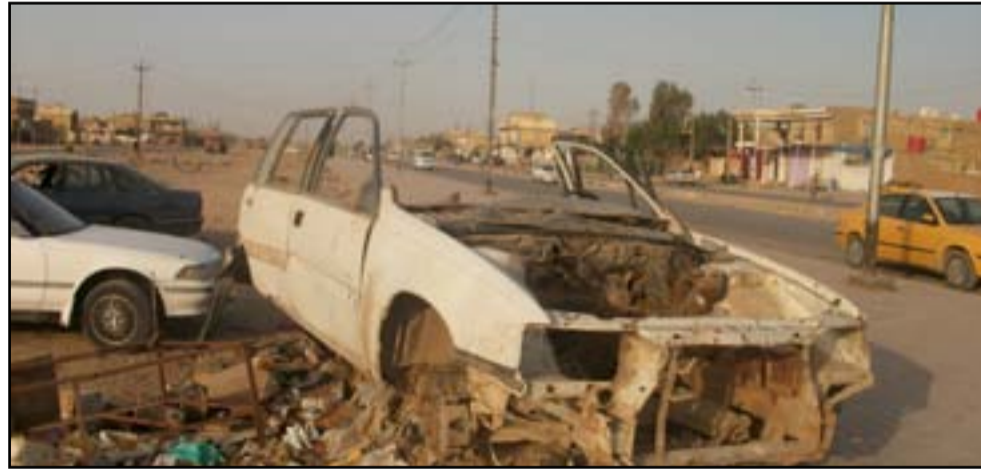
مدخل مراب العمارة

ميسان او العمارة كما تختزل وتشتهر فثلت سكن بغداد