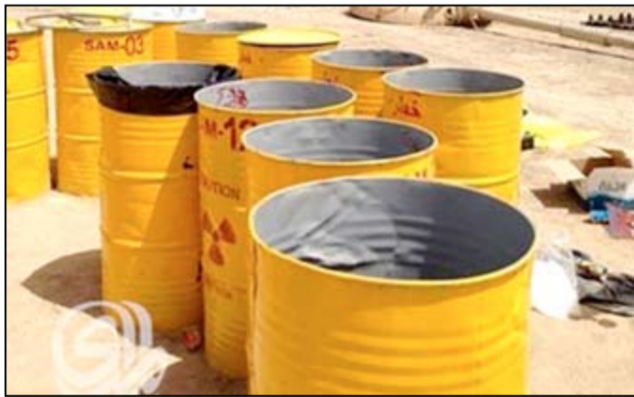
موقع ملوث إشعاعياً في محافظة المثني

تصيب أعداداً كبيرة من الأهالي بأمراض خطيرة".