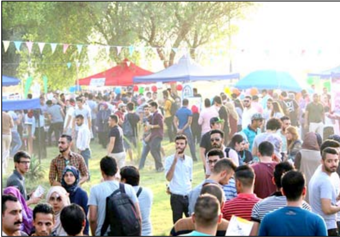
جانب من المهرجان

بمشاركة أكثر من 600 متطوع وبحضور 14 ألف شاب وشابة