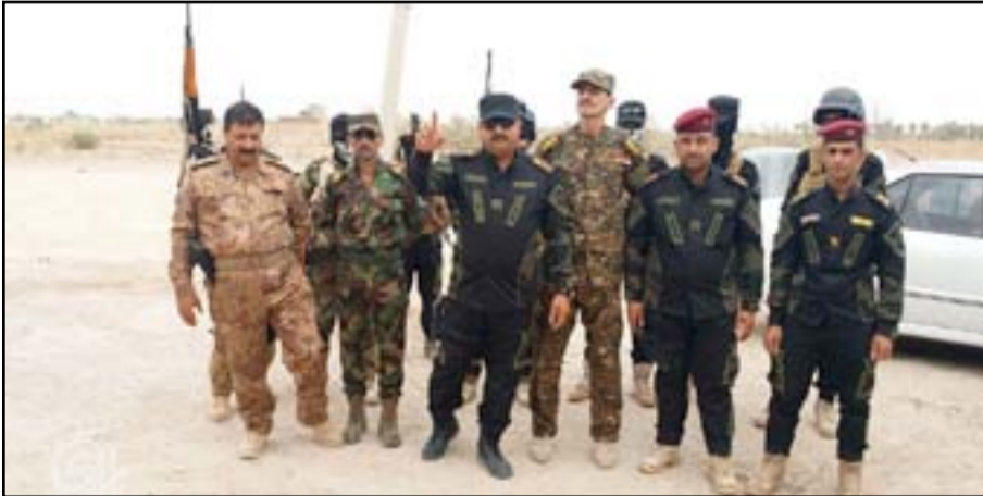
قوات الحشد الشعبي في الانبار

ويقول مسؤولون أميركيون ان القوات العراقية تقوم بعزل الرمادي استعدادا للهجوم النهائي على مركز المدينة. ويؤكد اللواء كيفن كلي من القيادة المركزية ان "الهجوم لم يتوقف وهناك تحركات على طول المحاور العديدة هناك".