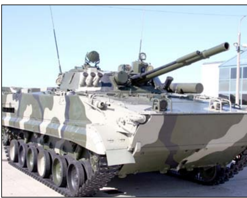
الـ BMP - 3 لية عسكرية روسية طراز 3