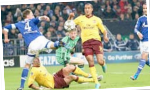
امام دينامو زغرب. وتتبقى لـ(الغانرز) مباراة واحدة أمام العملاق البافاري بايرن ميونخ يوم ٢٠ تشرين الأول المقبل على ملعب الإمارات قبل انطلاق مباريات جولة الإياب في المجموعة.

نشر لوكاس ليفيا نجم ليفربول عبر حسابه الشخصي على (إنستغرام) صورة لجدته المتوفاة الجمعة الماضية، وعلق عليها بالقول: جدتي العزيزة توفيت بعد أن أكملت مهمتها معنا بنجاح تام، سنبقى نعيش على ذكرك وستبقى في قلوبنا. وكان لوكاس قد شارك في مباراة فريقه فيلا وقدم أداءً كبيراً، برغم أن جدته توفيت ساعات فقط قبل بداية المواجهة، وتفاعل متابعوه مع الصورة التي نشرها وقدموا له التعازي بهذا المنصب.