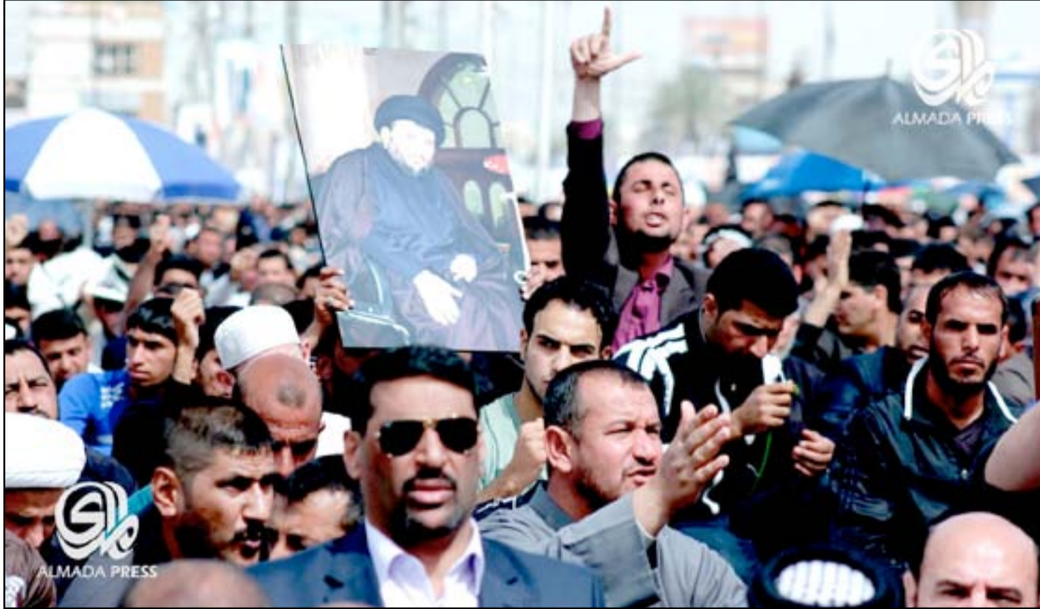
مجموعة من انصار التيار الصدري خلال تظاهرة سابقة... ارشيف

□ أكدوا أن الحكومة مستمرة بتسويف المطالب