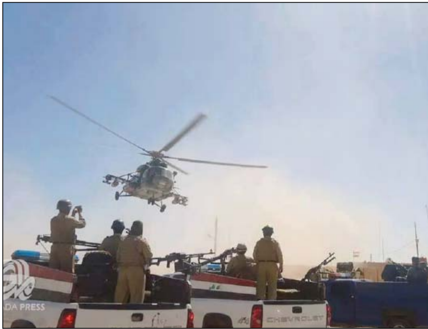
قوات عسكرية في بيبي أريشيف