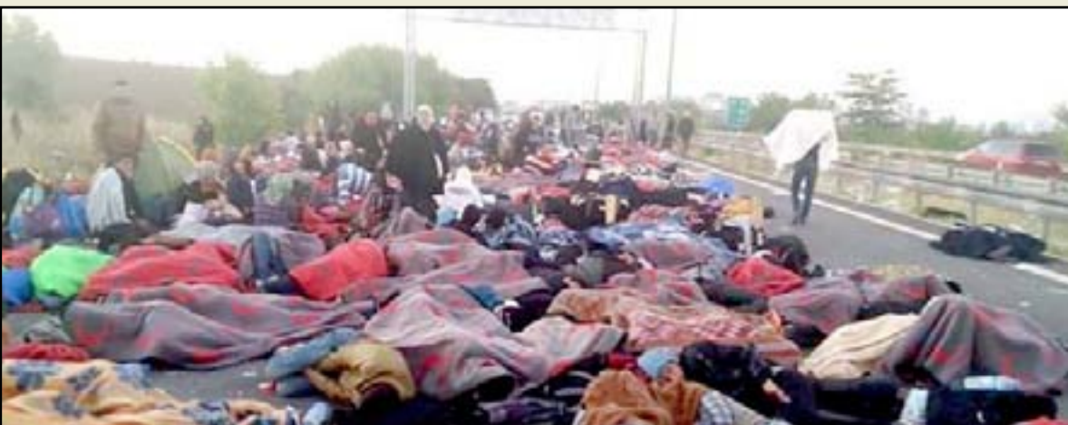
مهاجرون على خط الحدود التركية اليونانية

الجماعي الحالي ولم تشهدا فترة التسعينيات وكذلك الجميع يعلم مخاطر الهجرة والسفر في البحر أو البر وحتى الجو وامور التزوير والعقبات القانونية فالكثير من الناس راح ضحية فكرة الهجرة وكثرة امور النصب والاحتيال في سبيل الحصول على المال والهروب.