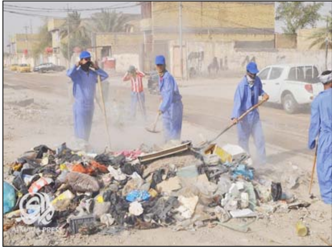
مجموعة من عمال النظافة خلال حملة لرفع النفايات...

ويرى الزاملي، أن "ضعف أداء الدوائر البلدية في المناطق الشعبية اضطر الأهالي إلى رمي النفايات في أي مكان مثلما حفز البعض على رفع صور زعماء دينيين أو سياسيين أملاً بردع من يرمون النفايات عشوائياً". ويؤكد عضو مجلس محافظة بغداد، أن "مجلس محافظة بغداد يتابع آلية عمل الأليات الخاصة بحمل النفايات"، مستدركاً "لكن مع الأسف هناك خلل كبير في عمل الدوائر البلدية وعدم وجود رادع قانوني يمنع المواطن من رمي النفايات بطرق عشوائية".