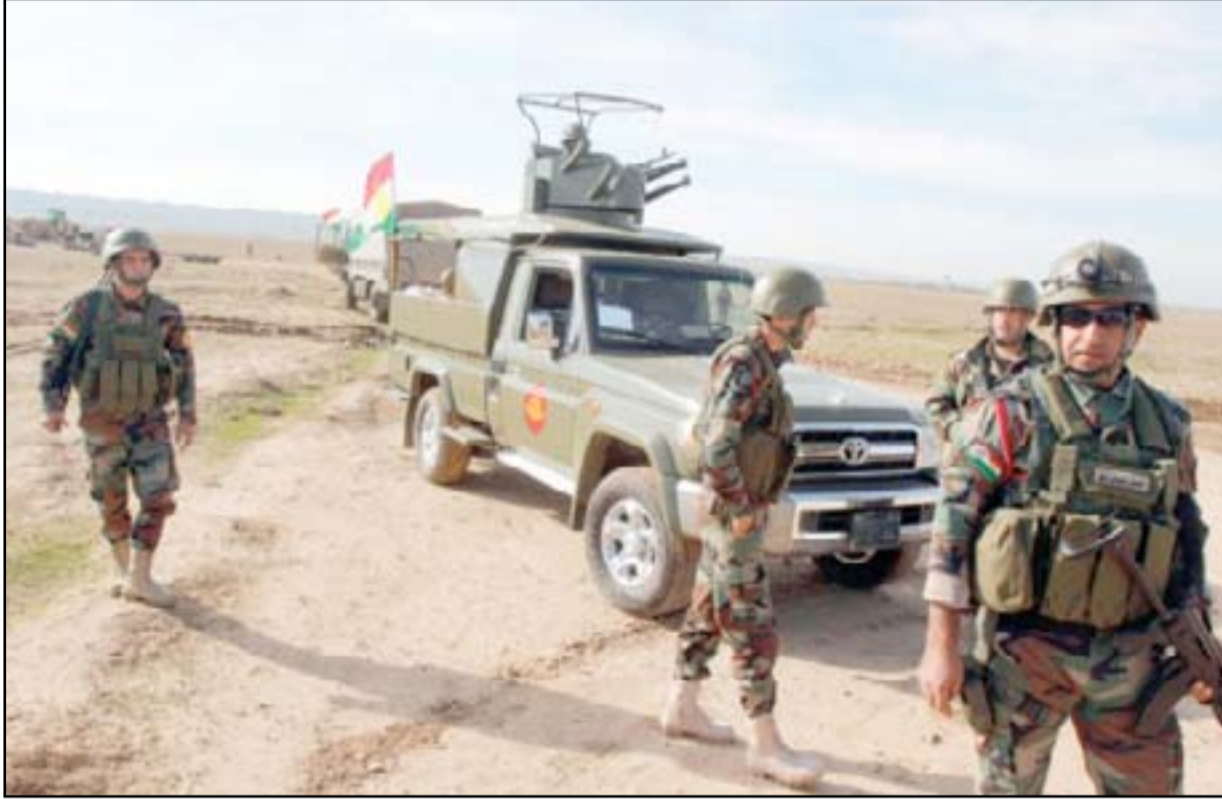
قوة من البيشمركة في كركوك