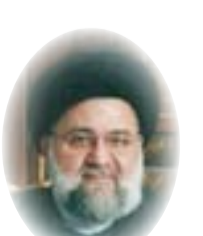
□ حسين الصدر

لقد كانت للمحات الأخلاقية في سيرة بعض الشخصيات، هي النافذة التي أطلوا منها على التاريخ. ومن هؤلاء القاضي (عيسى بن أبان) - كما جاء في كتاب الانساب للسمعاني ج ٤/ ص ٤١١-٤١٢: "لقد تولى قضاء البصرة، وكان رجلا سخيا جدا وكان يقول: والله لو أتيت برجل يفعل في ماله فعلي لحجرت عليه" ترافع أمامه شخصان كان المدعى رجل يقول: إن الله لو أتيت برجل يفعل في ماله فعلي لحجرت عليه" إن له على (محمد بن عبد) أربع مئة دينار فسأله (عيسى) عما ادعى عليه فأقر بذلك