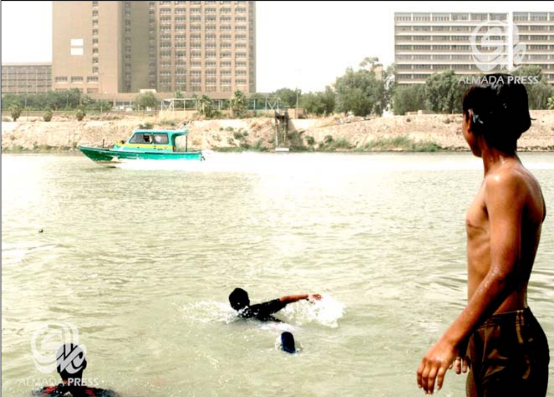
اطفال يسبحون في نهر دجلة مقابل المدينة الطبية في بغداد...

من إصابات الكوليرا سجلت في بابل، وأكدت أن معظم المصابين تماثل للشفاء من دون تسجيل أي حالة وفاة. وقالت وزير الصحة والبيئة عديلة حمود خلال مؤتمر صحفي مشترك