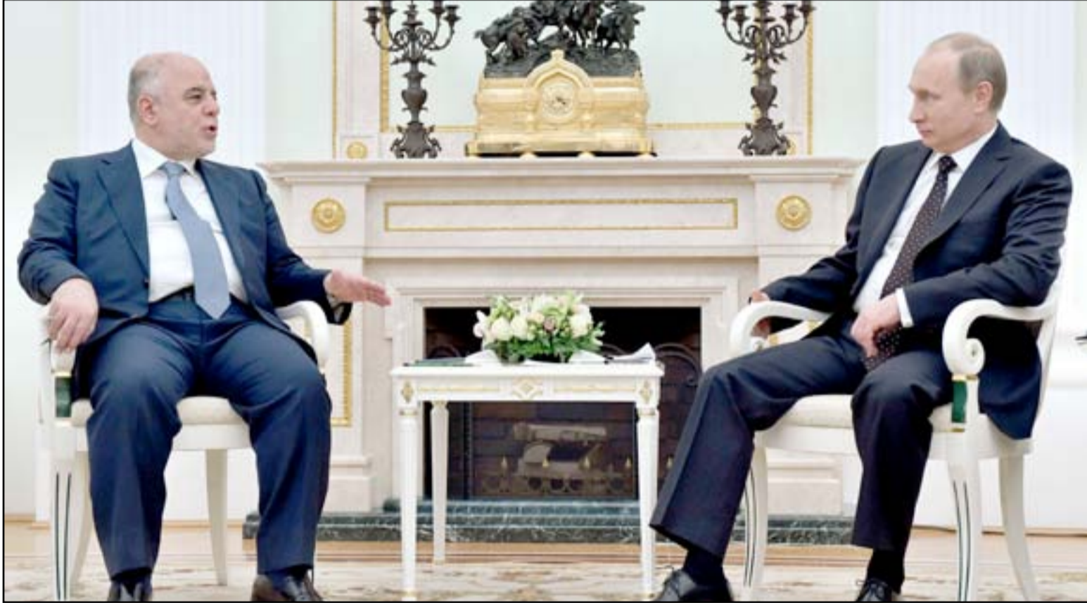
العبادي وبوتين خلال لقاء سابق

وفي مقابلة مع محطة "فرنس برس 24"، اتهم العبادي قوات التحالف التي تقودها واشنطن، ببطء الضربات ضد التنظيم المتطرف وشكك أيضاً في إرادة الزعماء الغربيين في هزيمة مسلحي التنظيم، قائلاً في الوقت نفسه، ان الضربات الجوية الروسية واردة لكن لم تتم مناقشتها.