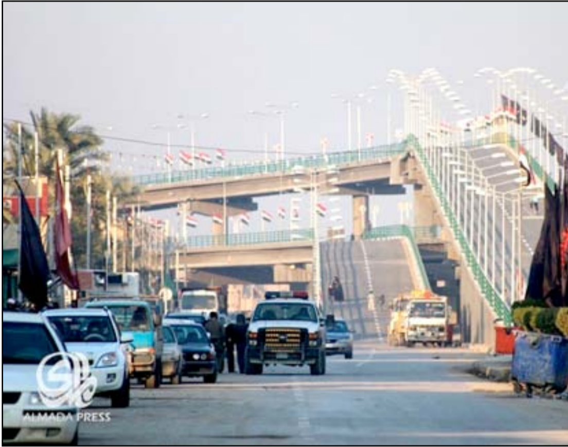
مركز مدينة الديوانية

استعدادهم صدام لتأدية الخدمة العسكرية خلال حربه ضد إيران.