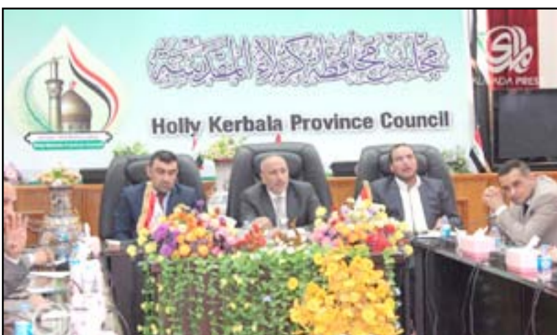
مجلس محافظة كربلاء

مجمعات تصفية مياه الشرب بالمحافظة بمادة الكلور". وأضاف المالكي، ان "المجلس صادق على ادراج مشروع تطوير شوارع حي الامام علي في مركز المدينة بكلفة 12 مليار و 520