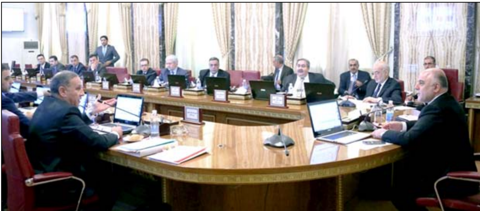
اجتماع مجلس الوزراء