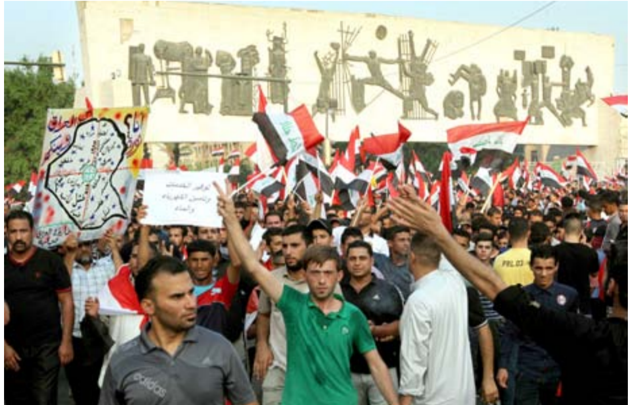
متظاهرون في ساحة التحرير وسط بغداد