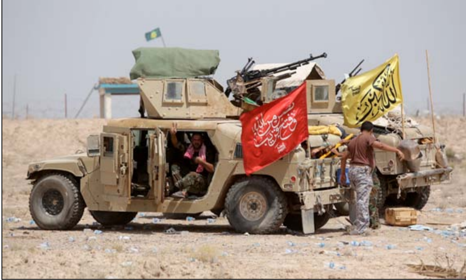
قوة من الحشد الشعبي على أطراف الرمادي.. أرشيف

أعلنت قيادة العمليات المشتركة، أمس الجمعة، الوصول إلى الملعب الأولمبي ومنطقة البو فراج شمال غربي الرمادي (١١٠ كم غرب بغداد)، في حين تمكنت القوات الأمنية من قتل ٢٥ عنصراً من تنظيم داعش بينهم قياديون بعملية عسكرية استهدفت تجمعات التنظيم، شرق الرمادي. ويأتي هذا التطور بعد أسابيع من انباء تحدثت عن توقف القتال، مع استعدادات تجريها القوات الاميركية لبدء معركة ينقذها متحاربون من عشار الأنبار لتحرير الرمادي.