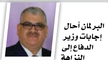
البرلمان أحال إجابات وزير الدفاع إلى النزاهة