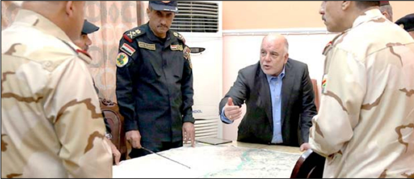
العبادي خلال اجتماع أمني.. أرشيف

وكان رئيس الوزراء حيدر العبادي المح، في مؤتمر صحفي له السبت، الى امكانية ابرام اتفاقات ثنائية مع اطراف اقليمية ودولية لمواجهة داعش. وأعرب العبادي عن استغرابه "من بعض الأطراف التي تحفظت على التعاون مع روسيا ضد تنظيم داعش"، مشيراً الى أنه "ليس هناك تحفظات على توجيه روسيا ضربات جوية ضد داعش في العراق بشرط موافقة الحكومة العراقية". وقالت مصادر برلمانية ل(المدى)، امس، ان "وفداً أمنياً رفيع المستوى يتواجد في العاصمة الروسية موسكو لوضع الترتيبات النهائية على حلف عسكري ثنائي بين العراق وروسيا سينتقد في وقت قريب". ورجحت المصادر البرلمانية، التي تحدثت شريطة عدم الكشف عنها، أنه "يمكن هذا التحالف الجانب الروسي من شن غارات جوية على مواقع داعش في الموصل والانبار او حتى القيام بانزال قوات برية اذا تطلب الامر". في هذه الاثناء تكشف تفاصيل "التحالف الرباعي" الذي اعلن عنه الاسبوع الماضي. وبحسب برلمانيين فان التحالف سيكون جهة تنسيق استخباراتية تضم 24 خبيراً، بواقع 6 أشخاص من كل دولة، ويعمل على مراقبة حركة داعش على الجانبين العراقي والسوري. وبحسب نواب فان الجانب الروسي يبدى خشية من استفحال خطر 2500 مقاتل شيشاني وصلوا المنطقة عبر الاراضي التركية، وان التحالف الرباعي سيراقب حركة تجنيد المسلحين لداعش. وكشفت موسكو، الجمعة، عن "ميثاق خاص" سيتم تبنيه قريباً لتحديد مسؤوليات اطراف