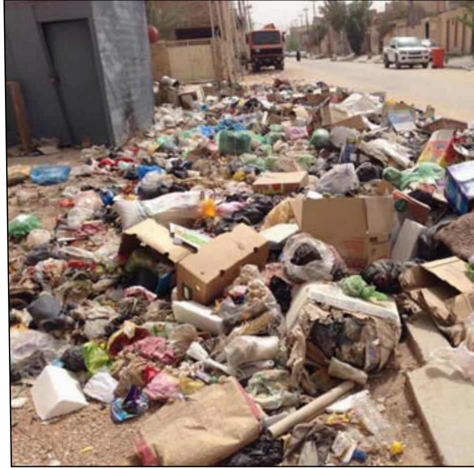
هذه حال أحياء النجف