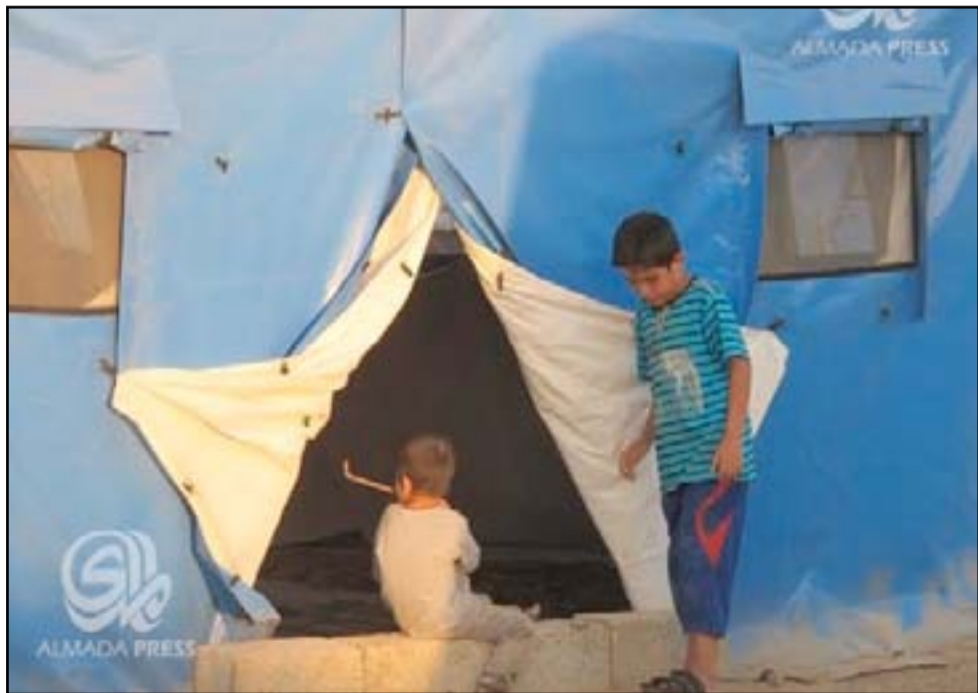
مخيم لايواء النازحين.. ارشيف

ويضيف "متي ما وجد الطفل مستوى معيشياً جيداً وشمل بقانون الرعاية الاجتماعية، فإن ذلك يساعد بعودته الى مقاعد الدراسة، وبالتالي ستنتهي هذه الظاهرة"، مشيراً الى ان "وزارة العمل نفذت برنامجاً مع اليونيسكو في العام السابق، وتم تدريب وارجاع ١٨٠ ألف طفل منتسب الى الدراسة في القرى والارياف بالاخص بالنسبة للنساء والأطفال".