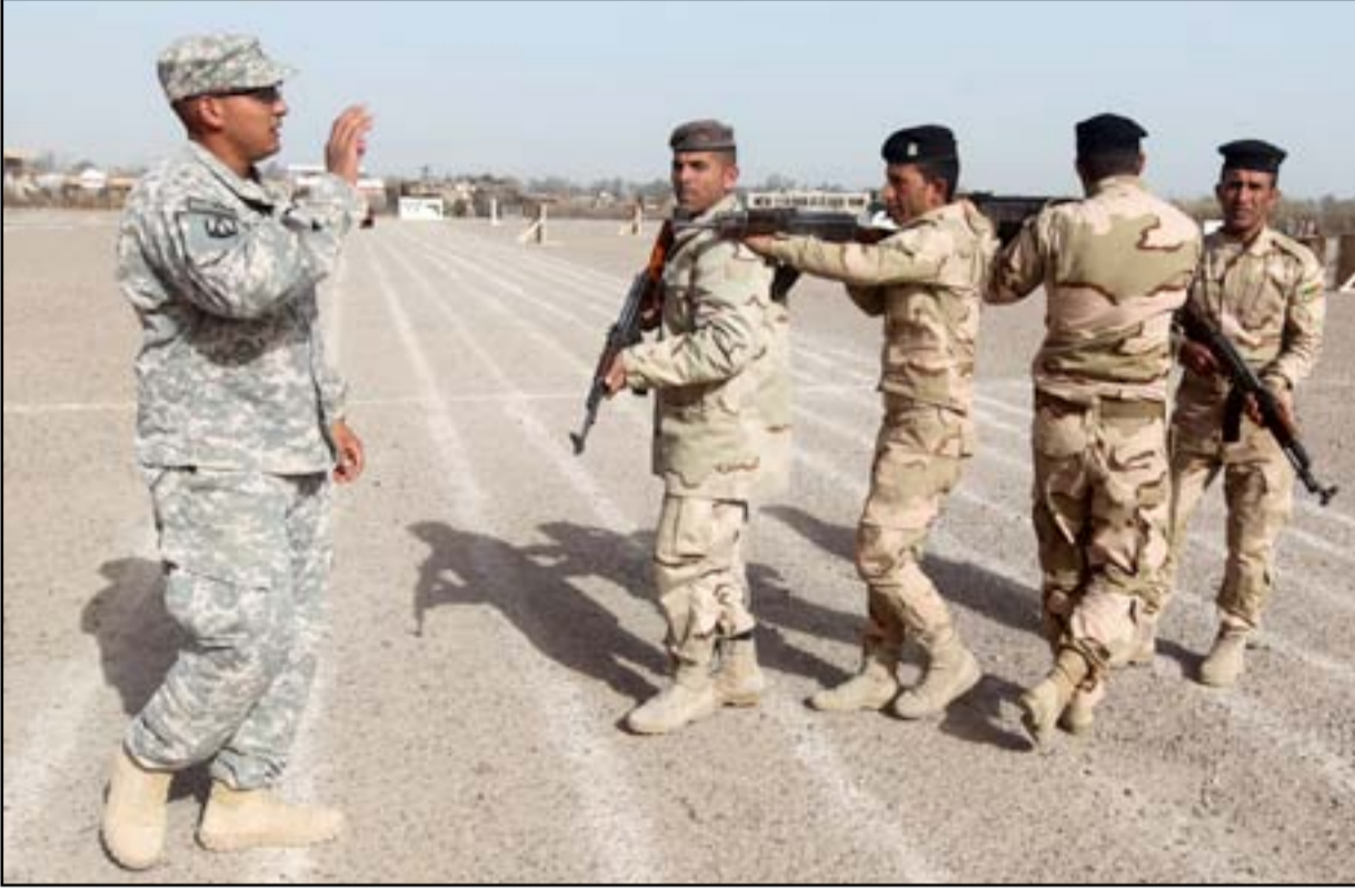
مستشار اميركي في قاعدة الأسد

مطلعة في الانبار ان احد الجنرالات الذين شاركوا في هندسة مشروع الصحوات سيكون على رأس القوات الجديدة التي يتوقع ان تشارك بهجوم بري لاستعادة الرمادي.