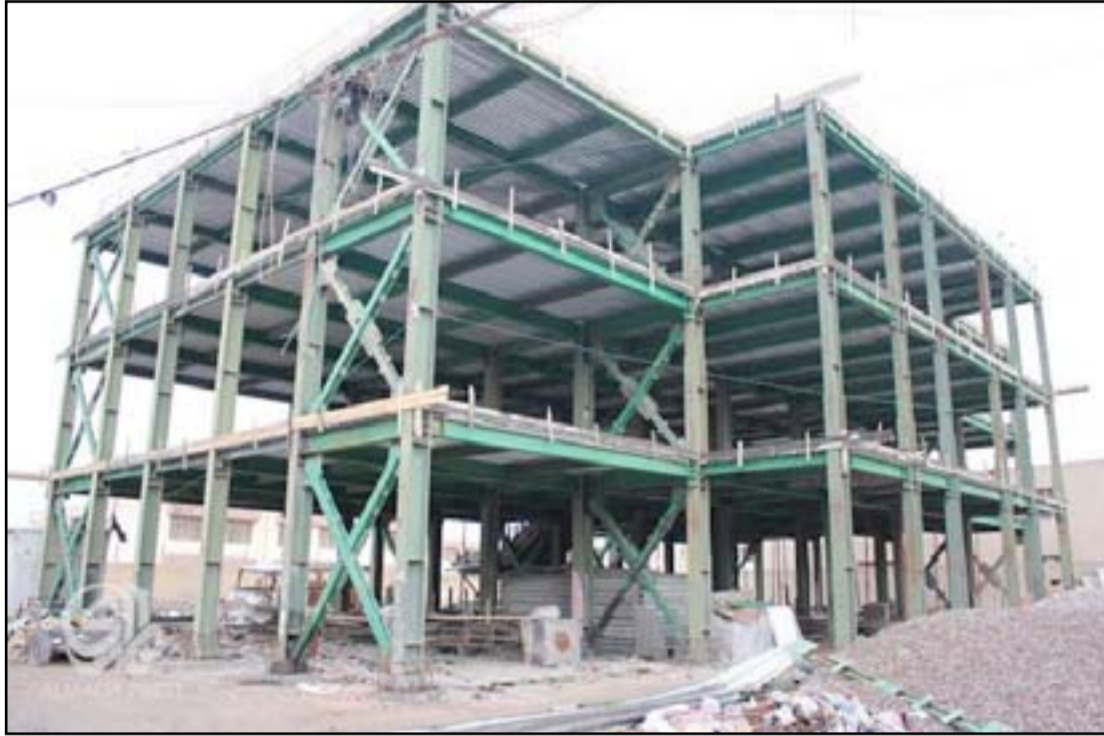
أحد الهياكل المدرسية.. ارشيف

مسؤول محلي: العاصمة بحاجة إلى 2500 مدرسة حسب إحصائيات التخطيط