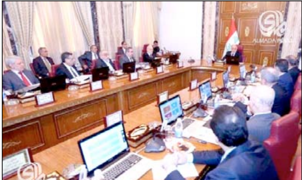
مجلس الوزراء العراقي