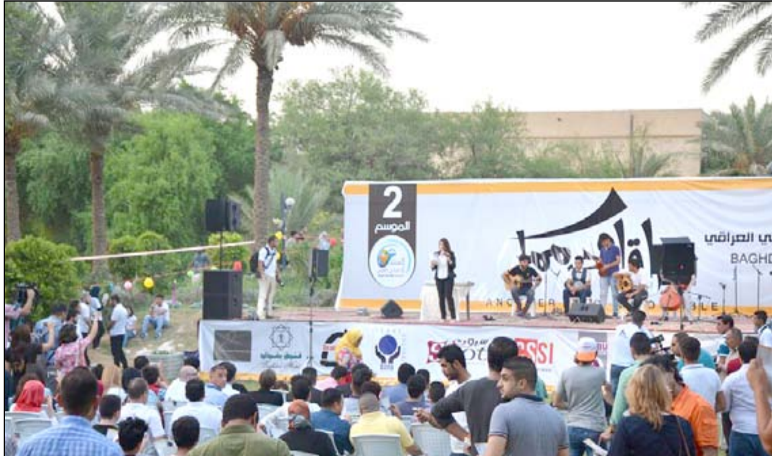
أحدى فعاليات المنتدى

□ منظّمون : الفعاليات تركّزت على السلم الأهلي ومناقشة قضايا البلد المهمة