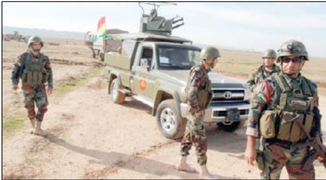
قوات البيشمركة في كركوك

وأضافت رئاسة الإقليم، "نعتقد انه إذا تم الاتفاق على العمل المشترك، بين دول التحالف وروسيا معاً ضد تنظيم داعش، فإننا سنحصل على نتائج أفضل وبوقت أسرع بالتأكيد". وكانت وزارة البيشمركة في حكومة إقليم كردستان أعلنت، يوم الأربعاء الماضي،