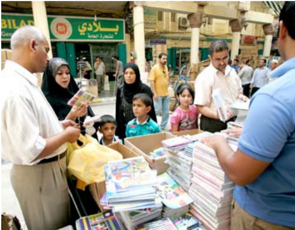
عائلة تشتري القرطاسية من شارع المتنبي

وقال محافظ بغداد، علي التميمي، في حديث لـ "المدى"، ان "مشايخ المدارس التي احالتها المحافظة متنوعة ما بين بناء وهدم وبناء واضافة صفوف، وعددها 502 مشروع مدرسي تقريباً"، مبيناً ان "المدارس التي انجزتها المحافظة تختلف عن بقية المشاريع المدرسية من ناحية الجودة وسرعة الانجاز والمواصفات الجيدة والتكلفة القليلة، وهذه المدارس تحتوي على 18 صفاً بتكلفة مليار و 300 مليون دينار، بينما وزارة التربية تبني مثيلتها بـ 3 مليارات و 400 مليون دينار". واضاف التميمي ان "المشايخ التي بنتها المحافظة تصل نسبة انجازها 10٪ كالحالات وعقود"، لافتاً الى ان "بعض التوقيعات حصلت بسبب عدم وجود سيولة مالية".