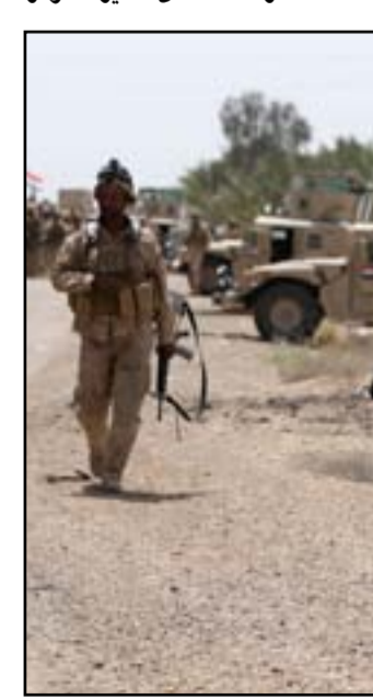
افراد الجيش على اطراف الرمادي...أرشيف

وتابع قائد عمليات الجزيرة والبادية أن "طيران التحالف استهدف مقراً لتنظيم داعش في منطقة الدو لوب التابعة لناحية البغدادي (170) كم غرب الانبار)، مما أسفر عن مقتل سبعة من قادة التنظيم واصابة اثنين آخرين بجروح متفاوتة".