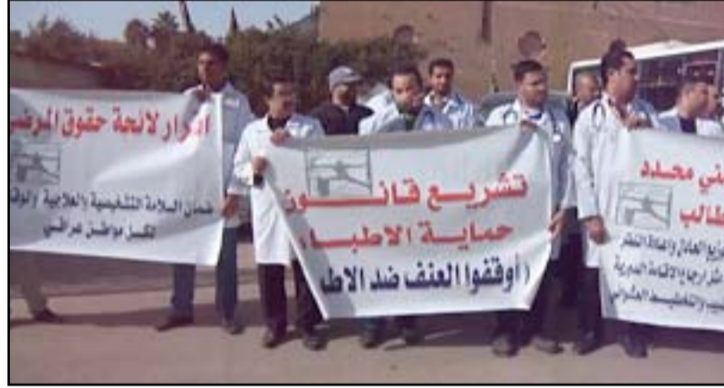
تظاهرة لأطباء، يطالبون بالحماية

الخبير القانوني طارق حرب اشار الى ان ما حصل في البصرة خلال الاسبوع الأخير من شهر ايلول 2015 من تهديدات عشائرية لأحد الأطباء بسبب وفاة مريض أثناء إجراء عملية جراحية له. إن الحكم الدستوري والقانوني يلزم هذه العشيرة والأجهزة المختصة بعدم اتخاذ أي إجراء أو تصرف تجاه الطبيب لحين صدور حكم قضائي بمسؤوليته عن وفاة المريض. مضيفاً: