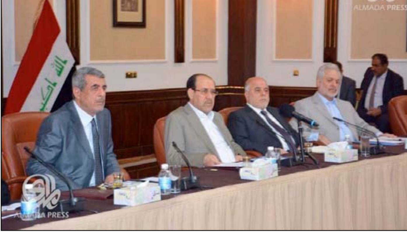
اجتماع ائتلاف دولة القانون..أرشيف

ويشدد النائب عن اتحاد القوى على منح الحكومة مزيداً من الوقت لتنفيذ جميع الإصلاحات التي شرعت بتطبيق قسم منها.