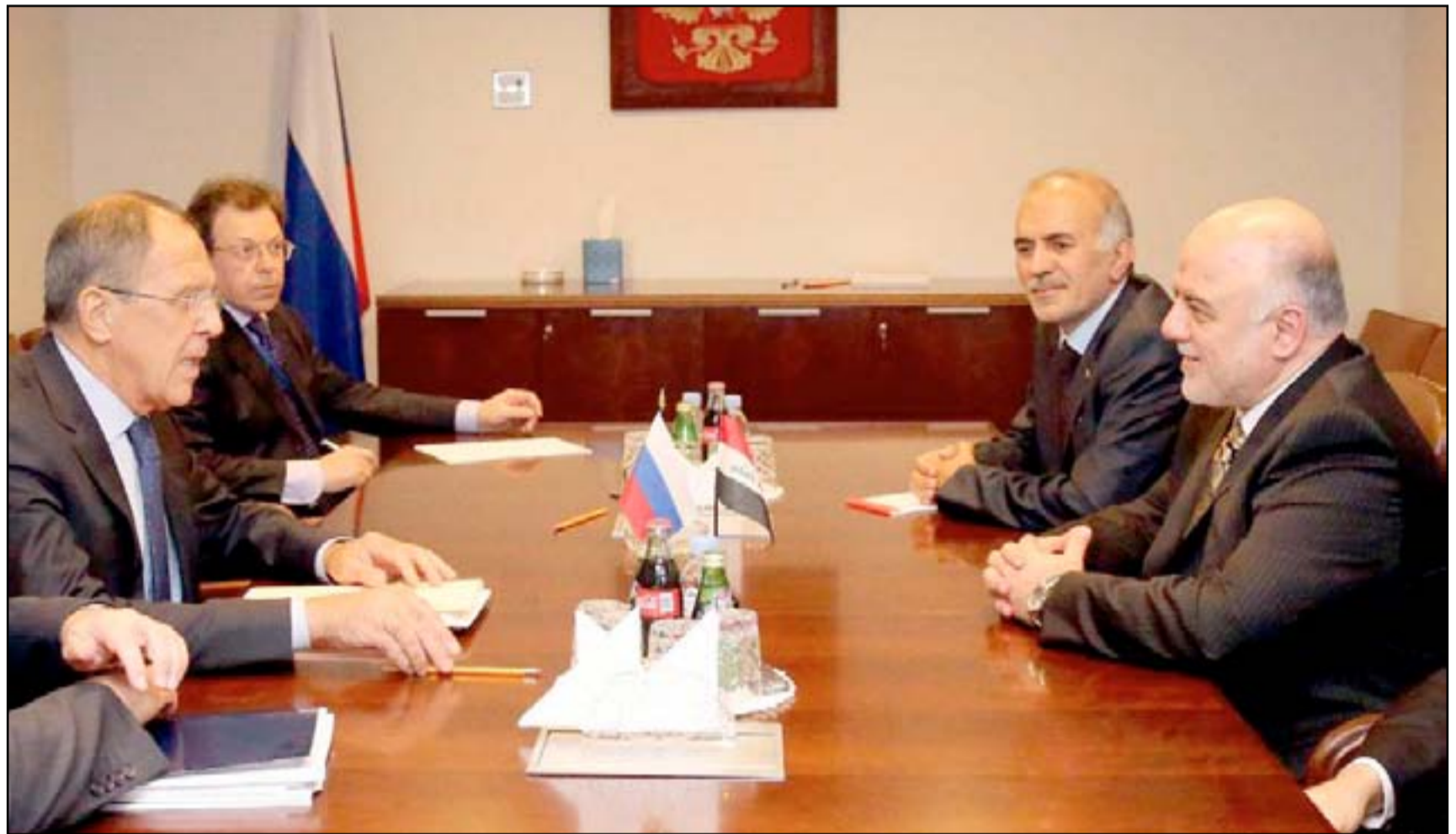
العبادي وزير الخارجية الروسي في لقاء سابق