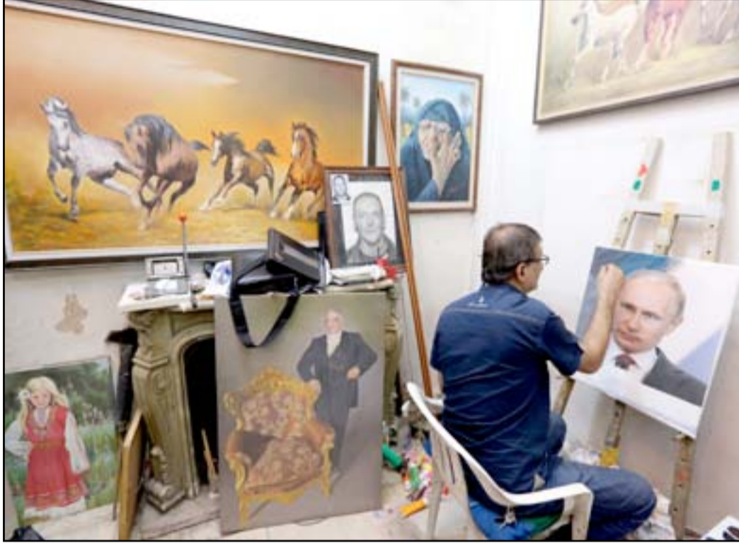
عراقي يرسم بورتريه للرئيس الروسي...

انهى رئيس الوزراء حيدر العبادي "اسبوعاً ساخناً" تخللته هجمات متكررة على سلفه نوري المالكي بلغت ذروتها بوصفه الأخير بـ "القائد الضرورة". واصر العبادي مساء الثلاثاء توضيحاً ينفي ان يكون وصف زعيم حزبه وكتلته البرلمانية بما كان يوصف به