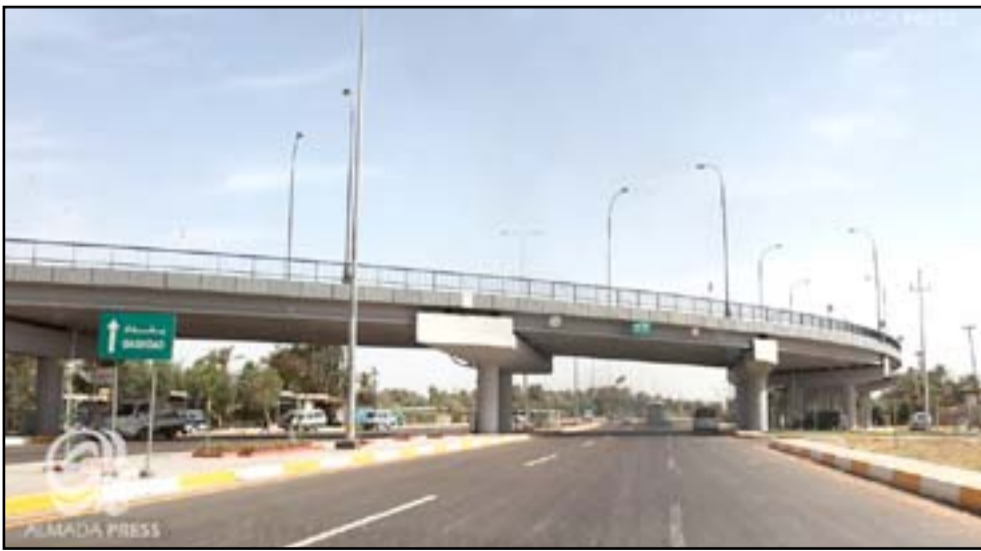
الطريق الرابط بين بغداد ومدن الدجيل وبلد وسامراء، وتكريت

وتابع عضو المجلس أن "المشروع سيوفر فرص عمل للعاطلين ويسهم في استقرار الأمن بالعاصمة، وحدث هجرة عكسية من مركز بغداد لأطرافها نتيجة الحركة التجارية الكبيرة فيها"، مستطرداً أن "المشروع سيشهد ظاهرة تجريف الأراضي وبناء المخازن بنحو عشوائي". وكانت اللجنة الأمنية في مجلس محافظة بغداد أعلنت (نهاية آب ٢٠١٥) عن مقترحين يتعلق أولهما بتأمين مدينة الصدر، بالاستعانة بشركات متخصصة وكاميرات مراقبة لرصد حركة المركبات فيها، وفي حين بيّنت أن المقترح الثاني يتعلق بتحويل منازح العاصمة لمنافذ تبادل تجاري ومنع دخول الشاحنات الكبيرة إليها، أكدت أنها "لن يحلماً" الدولة أيّة تبعات مادية.