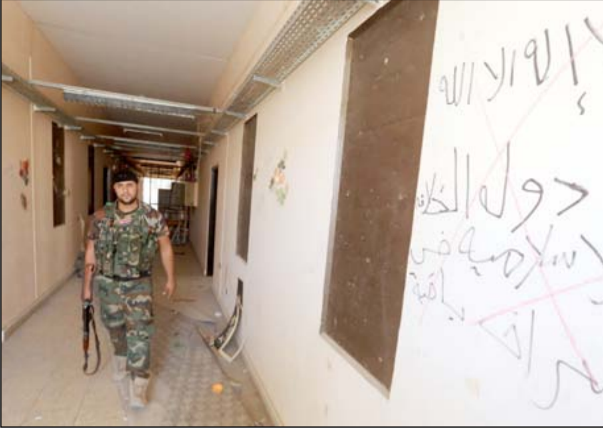
عنصر أمني يتجول في أروقة جامعة الأنبار.. أرشيف