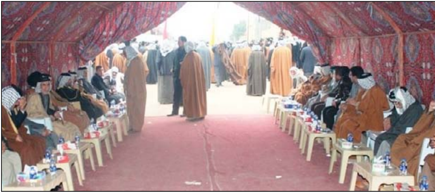
أحد الفصول العشائرية

أكثرهم ليسوا شيوخ بالأصل، بل أناس أتقنوا لبس العقاب كيهنة مع جل احترامنا للطبيين من الشيوخ الأصلاء أصحاب الحظ والبخت، لكن للأسف لا يستطيعون الوقوف بوجه هؤلاء بسبب الظرف الحالي.