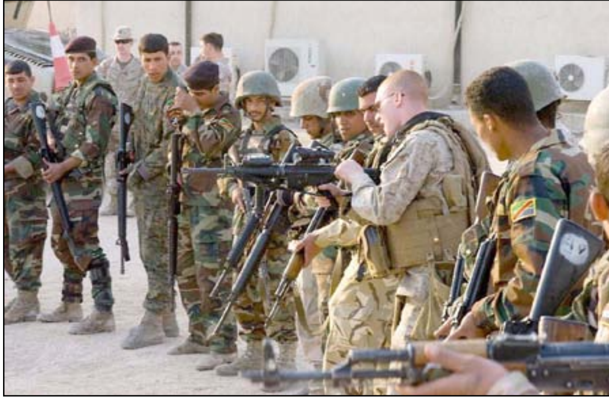
مستشار أميركي يدرّب جنوداً عراقيين