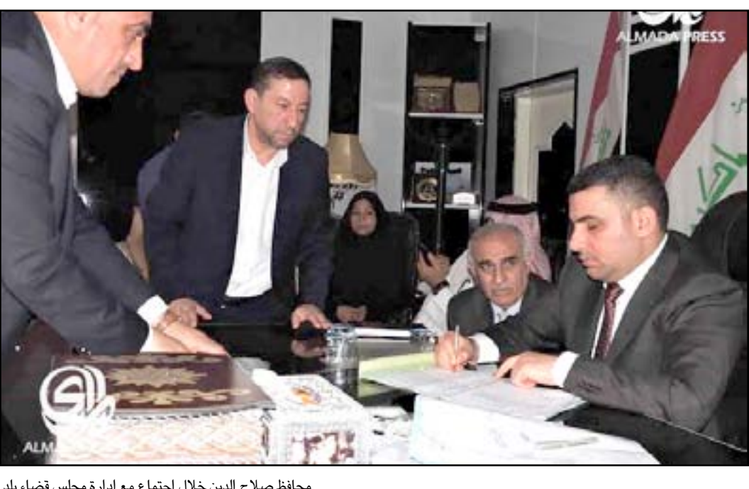
محافظ صلاح الدين خلال اجتماع مع إدارة مجلس قضاء بلد

البلدي و١٥ مليون دينار للمجلس البلدي فيما سيتم معالجة مطالب أخرى وفقاً للصلاحيات. من جانبه، قال رئيس المجلس المحلي لقضاء بلد، فاضل جعفر، في كلمة له على هامش زيارة محافظ صلاح الدين، رائد ابراهيم الجبوري إلى القضاء، وحضرتها (المدى برس) الإقليم تصل إلى نحو ١١ مليار دينار، لكنه لم يتسلم شيئاً منها لغاية الآن، لافتاً إلى أن "عمال البلدية الآن لا يتجاوز عددهم حالياً ٣٥ شخصاً"، مبيّناً أن "هناك مستحقات مالية متراكمة لعمال البلدية تزيد على ٦٠٠ مليون دينار التي إلى الآن لم تصرف لهم". وكان قضاء بلد، جنوب صلاح الدين، شهد تظاهرات كبيرة في (١٧ آب ٢٠١٥) تطالب بإصلاح الخدمات وتحسين الواقع المعيشي لسكان القضاء وإقالة القائم مقام. يذكر أن القوات الأمنية تمكنت في (الأول من نيسان ٢٠١٥) من تحرير مدينة تكريت من سيطرة تنظيم (داعش) بعد نحو شهر من انطلاق عملية واسعة استمرت لمدة شهر واحد، فيما لا يزال قضاء بيجي، شمالي تكريت، يشهد معارك كرفر بين القوات الأمنية وعناصر تنظيم (داعش) الذي يسيطر على غالبية مناطق القضاء.