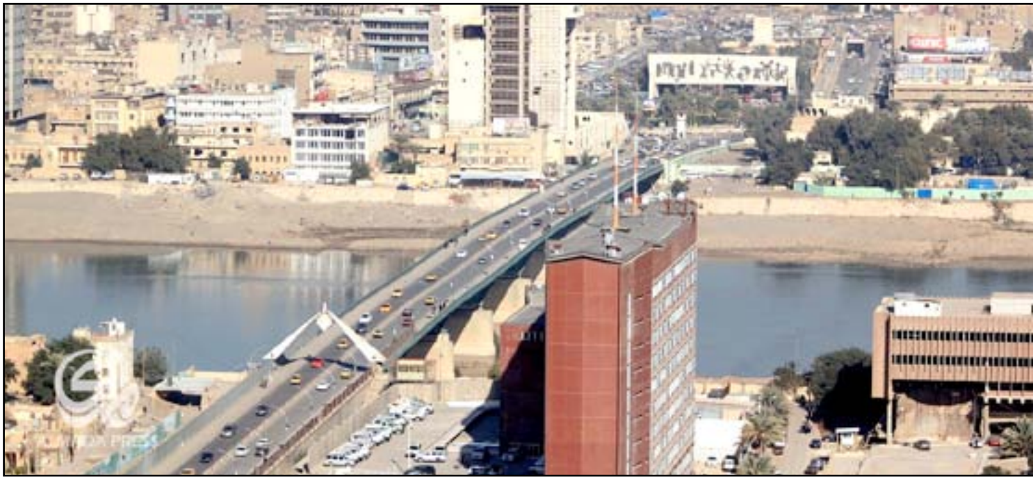
جسر الجمهورية المؤدي إلى بوابة المنطقة الخضراء، وسط بغداد