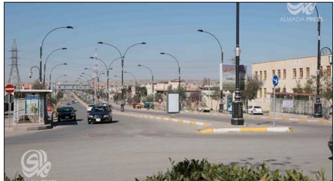
وسط مدينة كركوك