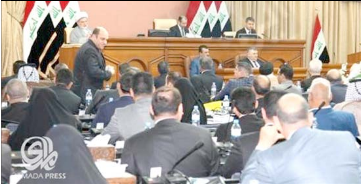
جلسة مجلس النواب