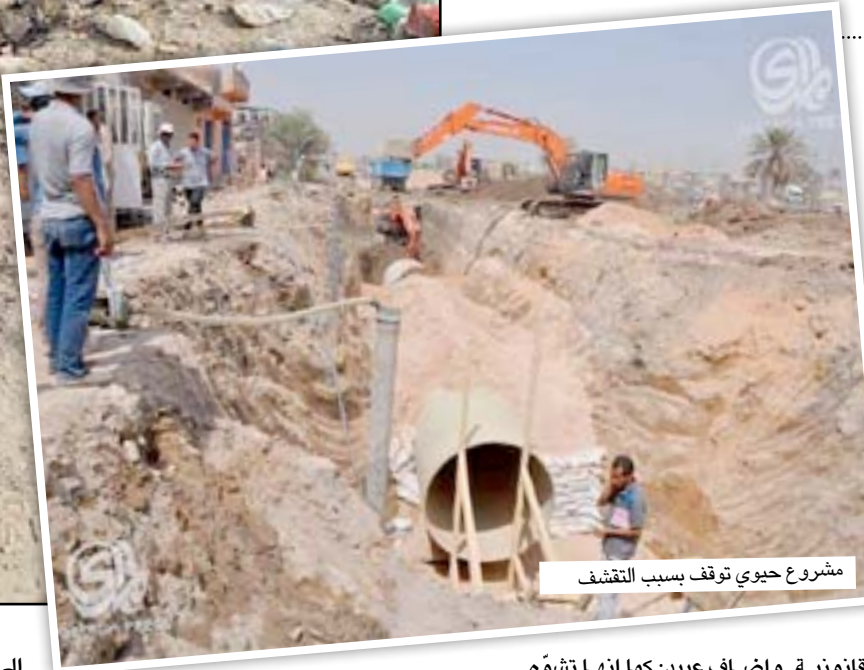
مشروع حيوي توقف بسبب التقشف

التي تتضمن الأولى إنشاء الخطوط الناقلة الرئيسية من مجسر الثورة وحتى مجسر نادر والتي بلغت نسبة الإنجاز فيه ١٦٪.