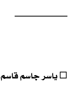
ياسر جاسم قاسم

إن التفكير ينطوي دائماً على عنصر شعري، هذا ما قاله ألبرت آينشتاين مبرهنًا على العلاقة الوشيجة بين العلوم الطبيعية من فيزياء وكيمياء وهندسة وطب، والعلوم الانسانية وعلى رأسها الادب والشعر، كما ان العلوم الطبيعية والرياضيات تحديدا لا ترقى الى اعلى مراتبها الا اذا تحولت الى فن رفيع، ومما يروى عن آينشتاين: انه تعلم من ديستوفسكي اكثر مما تعلم من نيوتن.. إذن نحن امام اهمية قصوى للادب والفن والثقافة امام العلم والتلاحق والامتزاج في بعض الاحيان بين الاثنين، كما اعطى العلم للفن وسائل تكنولوجية نشره على اوسع نطاق، ومنها: