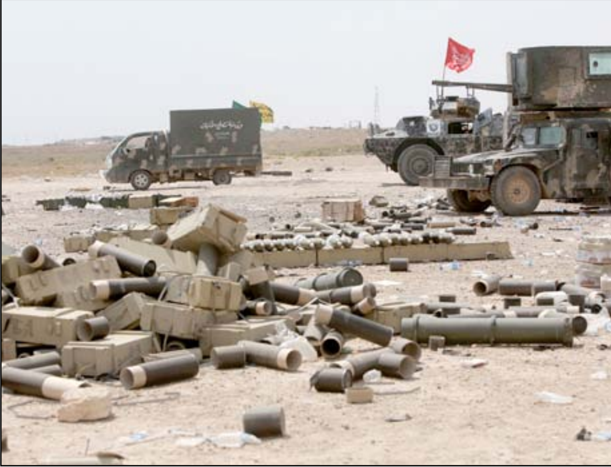
الحشد الشعبي على اطراف الفلوجة.. أرشيف

ترابط فصائل الحشد الشعبي في محيط الرمادي والفلوجة وعامية الفلوجة بعد ان تبدلت وجهه معارك الانبار، بضغط اميركية، باتجاه الرمادي بدلاً عن الفلوجة التي احكم الطوق حولها قبل ثلاثة اشهر. ويتمركز الحشد في مناطق قريبة من الفلوجة، التي كان يدافع عن فكرته بالولوية الهجوم عليها حتى آخر لحظة. ولم تغادر قوات الحشد محيط الفلوجة حتى الان، ويتحدث عن قرب بدء معركة تحرير المدينة التي توصف بأنها "رأس الافعى" لجهة سيطرة داعش عليها.