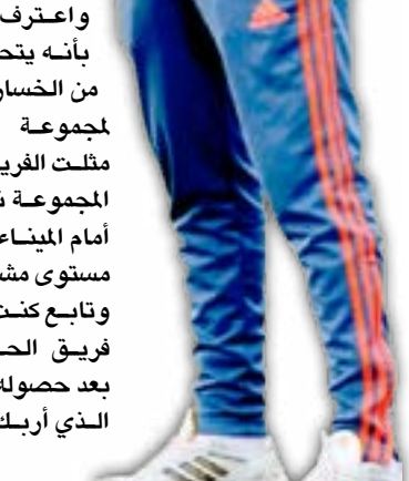
النسائية في البلد!

لذلك لا بد على الدولة العراقية بكل فئاتها التفكير جيداً وبسرعة بهذه القضية قبل أن تستفحل وعندها لا نجد لاعبا مؤهلاً من لاعبي الداخل يستطيعون ارتداء قميص المنتخب الوطني في المستقبل وأرى أن أفضل حل هو إعادة مراكز الشباب من جديد وتأهيلها على أن تضم جميع الألعاب وليس كرة القدم فقط، كما يجب أن تكون هناك مراكز خاصة بالمشاء حتى لا تموت الألعاب