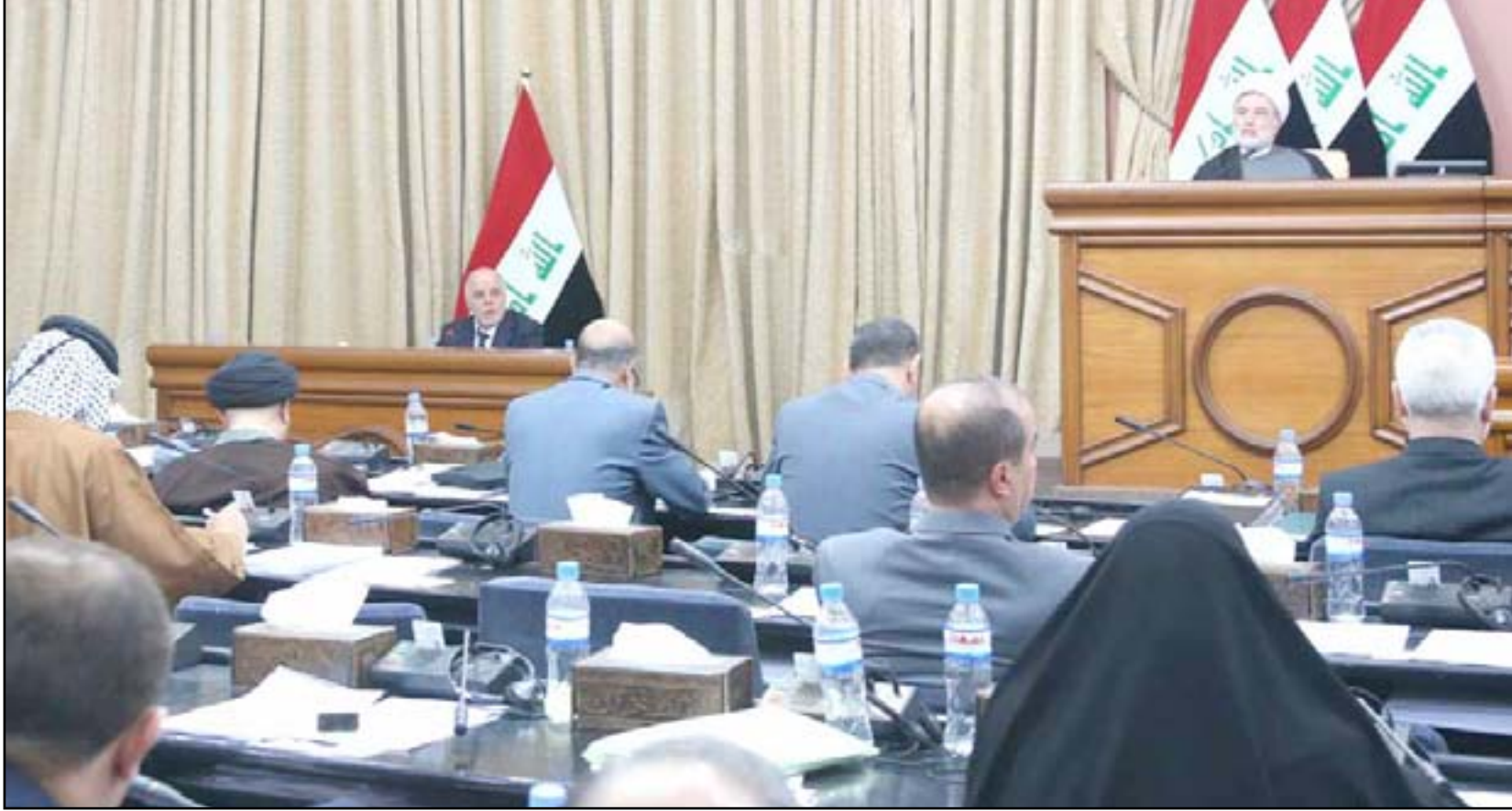
العبادي خلال استضافته في مجلس النواب. أرشيف

وتتحدث المصادر البرلمانية عن "تدخل ايراني