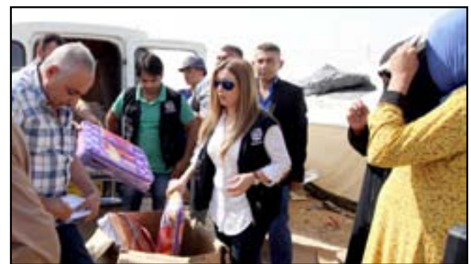
مساعدات عينية تقدمها مؤسسة المدى لنازحي بزيبز...

أعلنت مؤسسة المدى للثقافة والفنون والإعلام، امس الاحد، عن إعدادها برنامجاً خاصاً بإغاثة النازحين مع قرب حلول فصل الشتاء، مبينة أن أولى خطواته تمثلت بتقديم مساعدات طبية وعينية لستين عائلة نازحة من