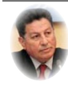
□ د. سيار الجميل

ماذا نحكي اليوم عن مجتمع عراقي أفرزته الأيام الصعبة وعانى طويلا ، وإن كان قد عاش قبل أجيال ليبدع ويكون صاحب أخلاق حميدة ، ولكن يبدو انه اليوم تربى تربية سيئة ليس في المدارس فحسب، بل حتى في بيوته نسوة ورجالا ، ومن شب على شيء شاب عليه، فالأمر لا يتعلق بجاهل او عاقل، ولا بمثقف او شخص عادي او واحد من الرعا، فكثيرا ما اجد اليوم من يحمل شهادات عليا، وهو من اسوأ الناس واوسخهم، ومن سيئاته انه ينفض نفسه ويستعرض عضلاته بأنويته و نرجسيته، ولا يحكي إلا عن نفسه ويتفاخر ببطلواته وامجاده الكاذبة، او تراه لثيما خداعا يظهر عكس ما يبطن، فتبقى معه زمنا، وفجأة يلدغك من حيث لا تدري ..