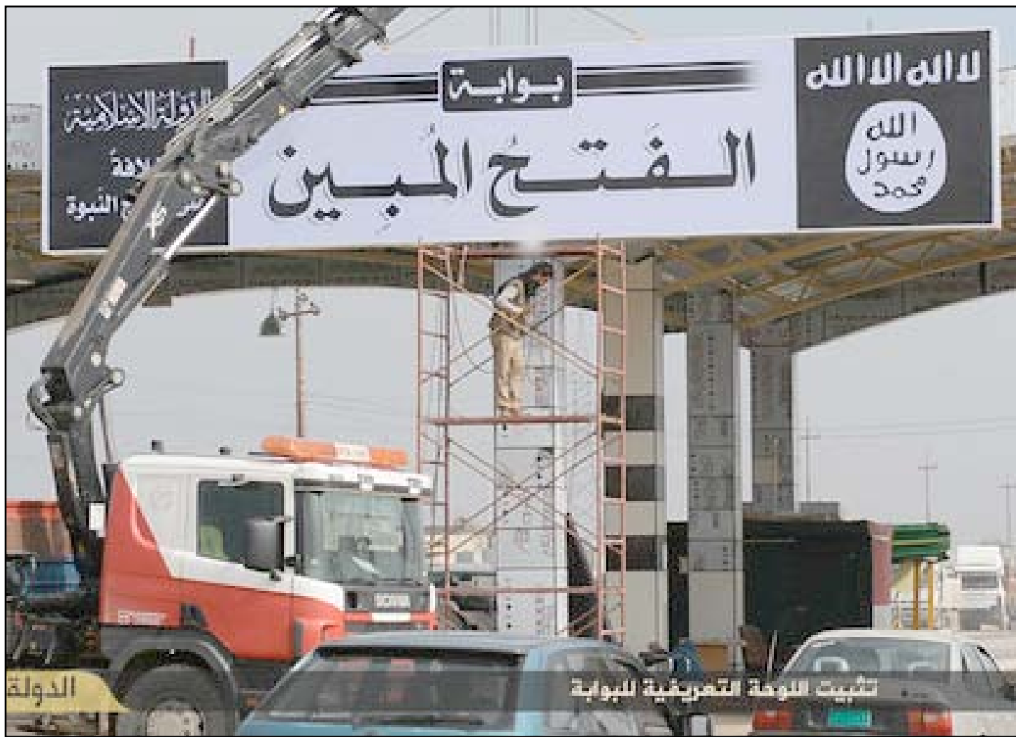
أحد مداخل مدينة الموصل... أرييف

بعد قناعتهم بأن الحكومة قد تخلت عنهم. وتنامت عمليات التهريب في الموصل، بعد احكام المتشددين قبضتهم على الاهالي وراحوا يهدمون الاشخاص واحداً بعد آخر، وهذا ما دفع مهريين الى تهريب عوائل وضمان عدم التعرض لهم يعملون في التنظيم ولهم حرية التنقل. الاهالي اضطروا مجبرين الى دفع ١٠٠٠ دولار اميركي لكل شخص يرغب بالخروج من الموصل، فالهريون يقول عنهم الاهالي، إنهم هربوا خلال اليومين الماضيين عائلتين متكونتين من ١١ فرداً. يقول احد افراد العائلة الهاربة، انه لم يكن يعرف الى اي مكان هو ذاهب،