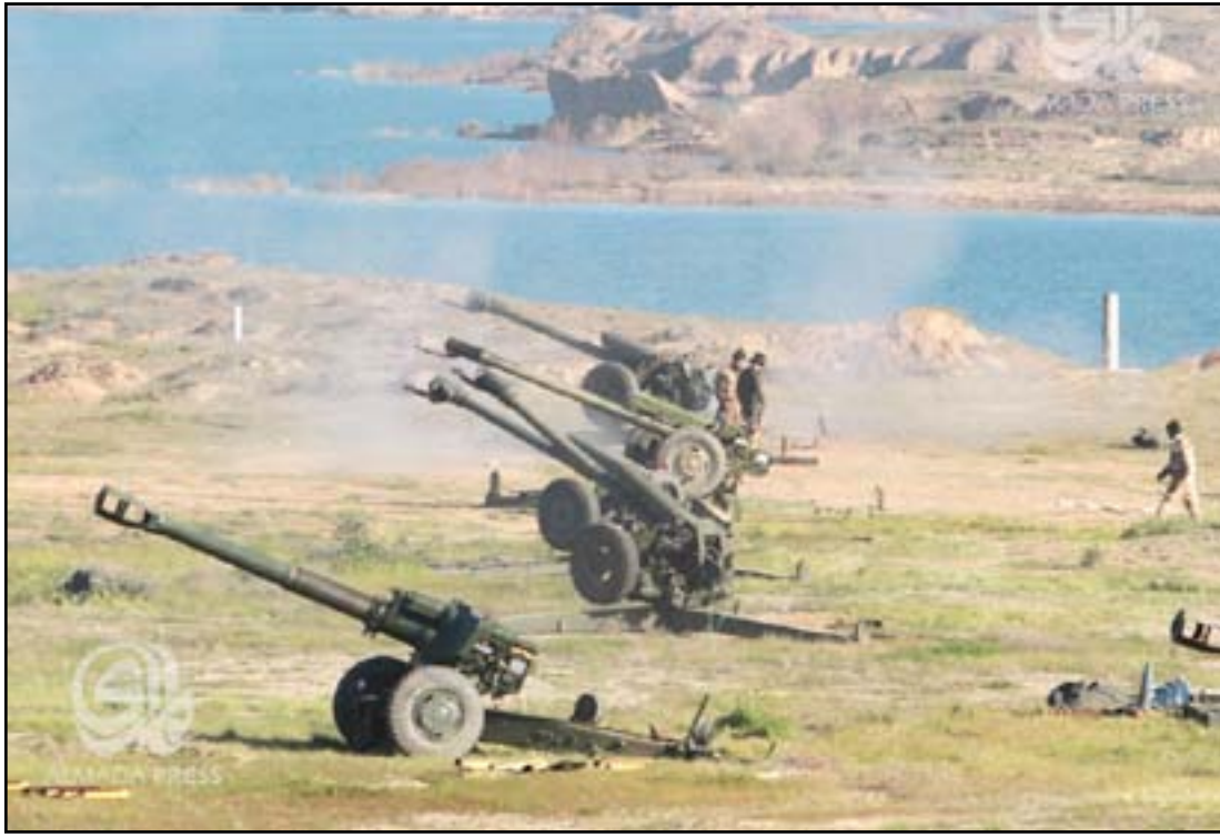
تصنف مدفعي مناطق داخل صلاح الدين يتواجد فيها عناصر داعش... ارشيف

زارنا محافظ صلاح الدين رائد الجبوري وأبدى دعمه للمبادرة"، مؤكداً أن "المحافظ ثمن دورنا في خدمة أبطال الحشد الشعبي وباقي القوات الأمنية، وبشرنا بأن العمل يتواصل لتحرير الشرقاط بعد الانتهاء من بجي". ويشير الدليمي الى أن "عشائر كثيرة، منها الجبور والعبيد والعزة، شاركت في إقامة للولائم للقوات المشتركة،