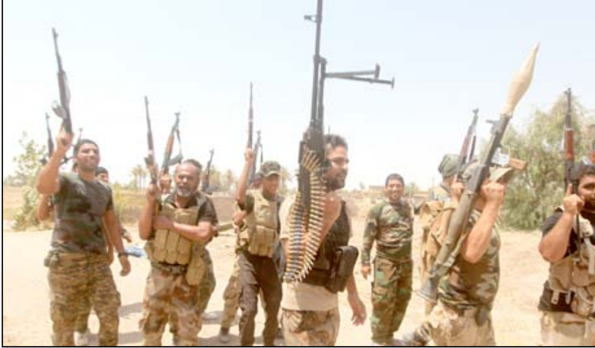
عناصر من الجيش في الرمادي.

مواجهات وسط الرمادي وفي الرمادي، التي تحاصرها القوات المشتركة من اشهر، فجر داعش ١٢ سيارة ملغمة على القوات المهاجمة في حي التأميم، من المحور الغربي، الأمر الذي ادى الى توقف عملية التحرير التي انطلقت من اسبوعين.