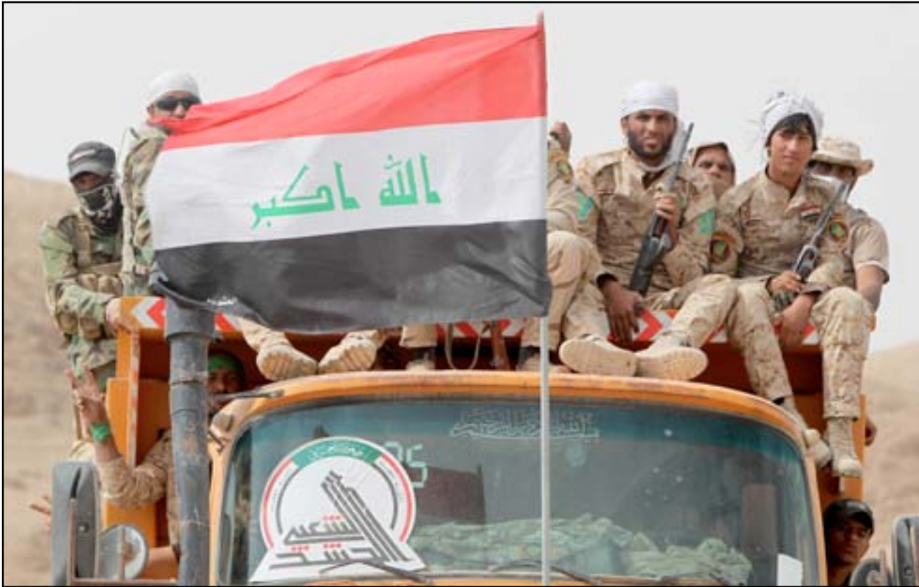
مقاتلو الحشد الشعبي في بيجي...