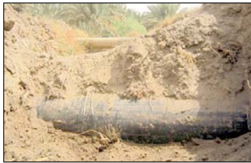
أنبوب النطف داخل المدينة

كما أوضح الباحث والموسوعي: ان هناك العديد من الأحداث الضخمة جدا في هذه المدينة قد نكرت في التوراة والتلمود ليخلق هذا التداخل التاريخي والديني حالة من الترابط الكبير بين الحضارة البابلية ومختلف حضارات العالم.. وبخصوص البليات الترويج السياحي لهذه المدينة قال مهاوش: علينا معرفة الآليات التي يتم من خلالها توظيف الأحداث التي شهدتها هذه المدينة