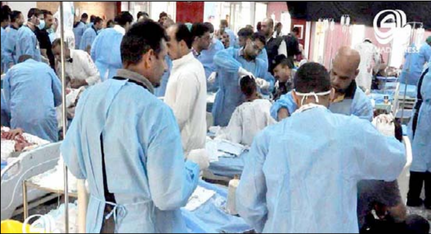
صالة الطوارئ في مستشفى البويناية العام