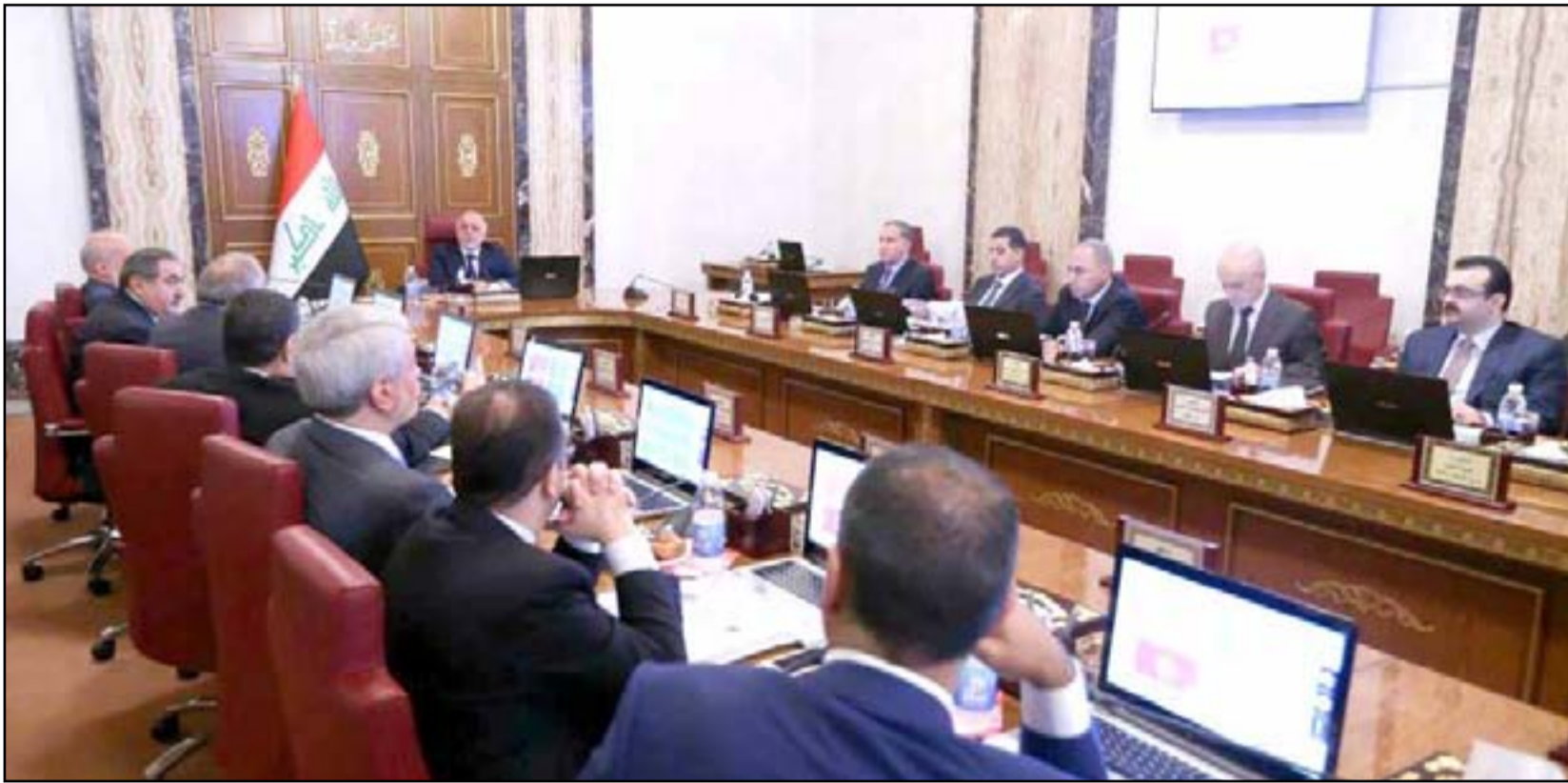
اجتماع مجلس الوزراء

واقرت الموازنة الاتحادية بقيمة بلغت ١٠٦ ترليون دينار، باعتماد سعر ٤٥ دولار لبرميل النفط، ويواقع تصدير يبلغ ٣.٦ مليون برميل يوميا. في حين تقول اللجنة المالية النيابية ان العراق لم يصل بعد الى ذلك المستوى من تصدير النفط بسبب الازمة مع كردستان.