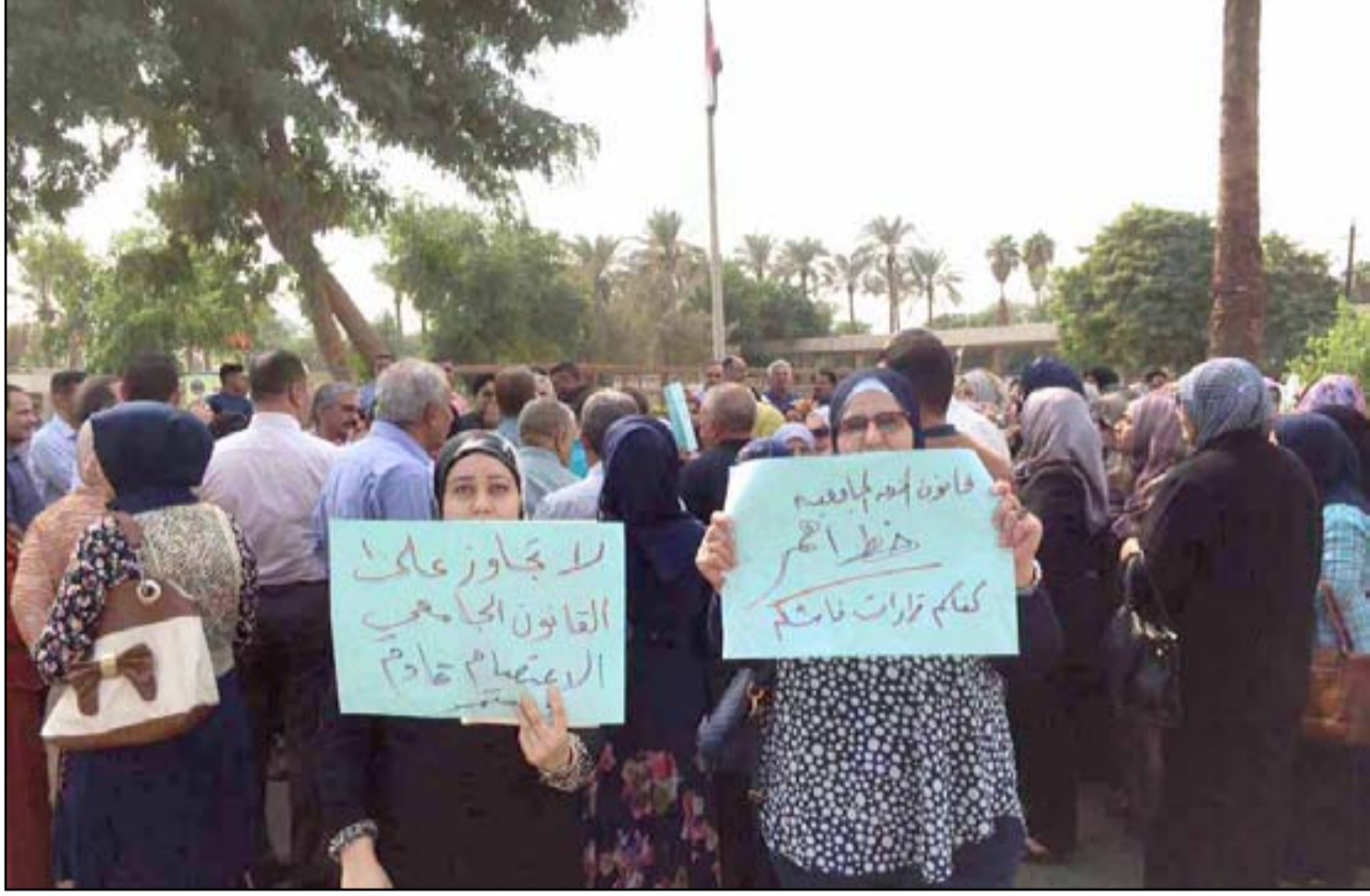
مجموعة من اساتذة جامعة بغداد خلال تظاهرة، أمس الاثنين، أمام مبنى رئاسة الجامعة

لوح اساتذة جامعيون، أمس الاثنين، باللجوء إلى المحكمة الاتحادية والاعتصامات المفتوحة في حال تنفيذ سلم الرواتب الجديد، معتبرين قرار خفض رواتبهم "مخالفة دستورية يعاقب عليها القانون"، فيما دعا خبراء إلى شمول الدرجات الخاصة والمسؤولين الحكوميين بالسلم الجديد.