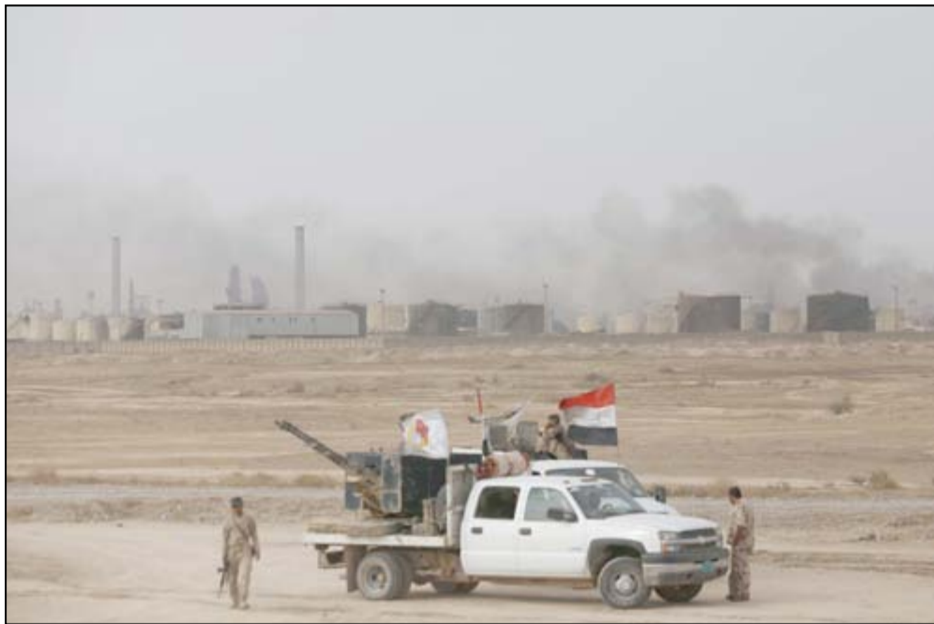
الحشد الشعبي في بيحي

قال مسؤولون ان القوات العراقية تقدمت الأحد نحو داعش من ثلاث جهات بعد ان قضت على جيوب الارهاب في بيحي وما حولها، في الوقت الذي تقترب فيه قوات عراقية أخرى من الرمادي والحويجة. وشنت القوات العراقية والحشد الشعبي المساند لها الأسبوع الماضي هجوماً واسعاً على مدينة بيحي شمال العاصمة. وكانت المدينة والمصفى القريب منها أحد أسوأ بؤر التوتر منذ هجوم داعش في حزيران 2014.