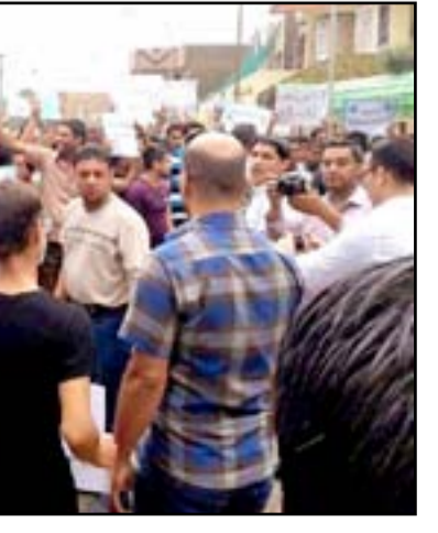
موظفو العقود يتظاهرون في واسط للمطالبة بصرف رواتبهم

يذكر أن عقود تنمية الأقاليم هي الصفة التي تطلق على الموظفين المعيّنين بعقود مؤقتة وتصرف رواتبهم من مبالغ الإشراف والمراقبة المحددة بنسبة مئوية لكل من مشاريع تنمية الأقاليم التي تنفذ في المحافظة ولعموم القطاعات المدنية.