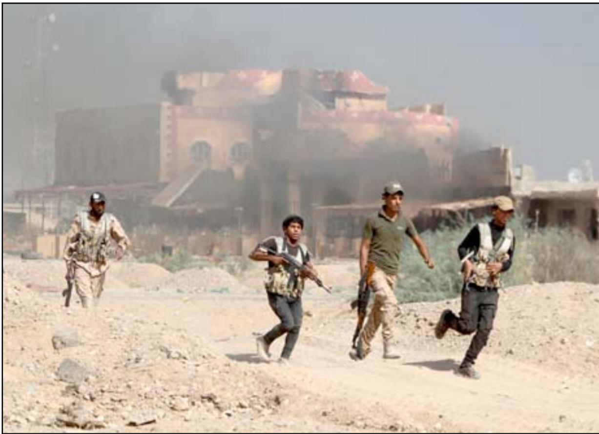
مقاتل الحشد الشعبي قرب القصور الرئاسية في بجي.

في هذه الاثناء تلقى رئيس الوزراء حيدر العبادي رسالة خطية من الرئيس الروسي فلاديمير بوتين، سلمها له السفير الروسي في بغداد، الذي اكد رغبة بلاده بتطوير العلاقات الثنائية مع العراق في مختلف المجالات لا سيما في الجانب التسليحي وتبادل المعلومات لمواجهة عصابات داعش الارهابية. ونقل بيان حكومي عن العبادي تأكيده "حرص العراق على اقامة افضل العلاقات مع روسيا بما يخدم مصلحة الشعبين، مشيراً الى ان "العراق يواجه اليوم حرباً شرسة ضد عناصر