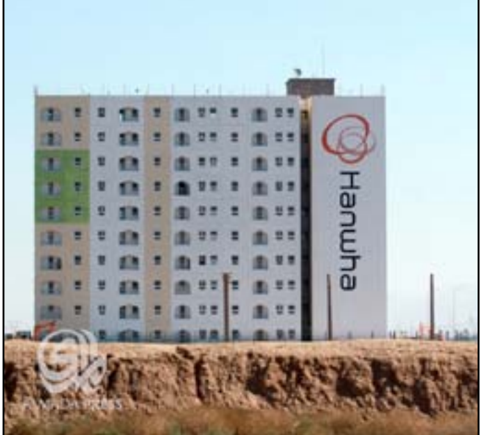
مشروع بسماية السكني جنوب شرقي بغداد الثلاثة آلاف شقة، لافتا إلى أن العمل يتواصل على وفق المخطط لإنجاز خمسة آلاف شقة، فضلا عن وجود وحدات سكنية أخرى انجزت أساساتها وأوضح المسؤول، أن "العمل بالمشروع

أكدت لجنة النزاهة في مجلس النواب، أمس الاثنين، وجود شبهات فساد في عقد مشروع بسماية السكني، وعدت أن كلفته التي تبلغ عشرة مليارات دولار "مهولة" ويمكن أن تبني أكثر من 100 ألف وحدة سكنية، وفيما نفت شركة (هانوا) الكورية الجنوبية، المنفذة للمشروع تلك الاتهامات أو وجود تكتؤ في العمل، اتهمت وسائل الإعلام التي تستهدف المشروع بمحاولة "تشويه الحقائق لغايات مجهولة". وقال مسؤول إعلامي في شركة هانوا في حديث إلى (المدى برس)، إن "ما تحدثت به بعض وسائل الإعلام عن وجود تلك الامور في مشروع بسماية أو رداءة بتنفيذه عارية عن الصحة". وأضاف المسؤول، الذي طلب عدم كشف هويته، أن "ما تناقلته وسائل الإعلام بشأن المشروع تضمن مغالطات بهدف تشويه الحقائق لأغراض مجهولة"، مبينا أن "الوحدة السكنية الواحدة في المشروع مكونة من عشرة طوابق، وفي كل واحدة منها 12 شقة، مجهزة