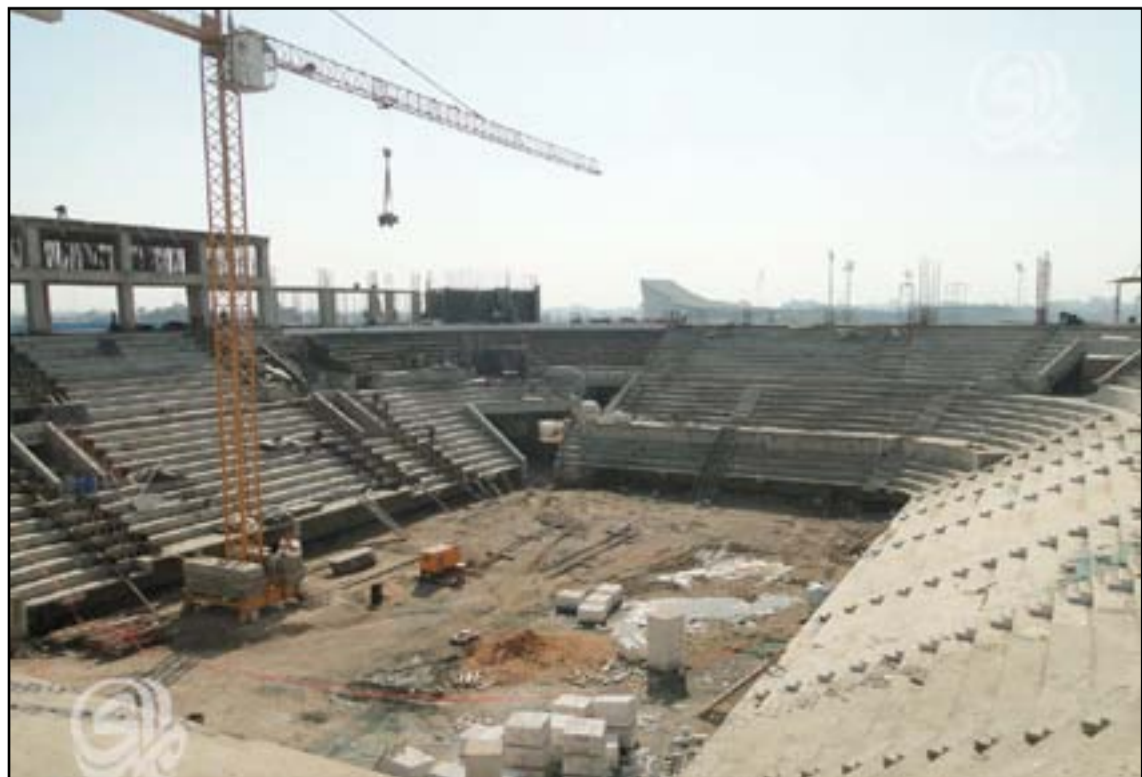
مشروع القاعة الرياضية شرقي بغداد الذي يتم انشاؤه من قبل شركة تركية..