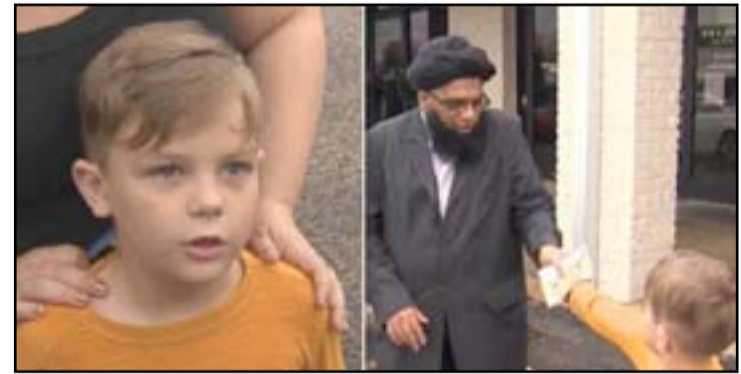
وقال عضو المركز الإسلامي في بفلوغريف (ICP)، في مقاطعة ترافيس، إنه وصل صباح يوم الإثنين ليجد القذارات وقد تركت أمام المبنى. كما عثر على صفحات ممزقة من القرآن الكريم أيضا في مكان الحادث.

تبرع صبي يبلغ من العمر سبع سنوات، بكل مدخراته، لمسجد في ولاية تكساس، كان قد تعرض للتخريب في أعقاب الهجمات الإرهابية على باريس.