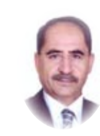
□ نوري المالكي

قدر العراقيين، أن يعيشوا بؤساء، ذلاً وفقرًا، هاقبة ووجعًا، حسرةً وتشريدًا،