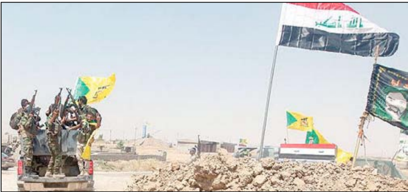
مقاتلو الحشد الشعبي في تكريت... أرشيف

واضاف الربيعي "الناس لا يريدون خسارة مكاسبهم الاقتصادية أو نفوذهم السياسي. ستكون هذه عقبة أخرى أمامه بسبب شهرة الحشد الشعبي".