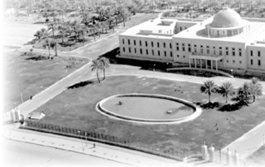
القصر الجمهوري (البلاط الملكي سابقاً)، كرادية مريم، (١٩٥١-٥٨)، للمعمار "جون كوبر"، منظر عام