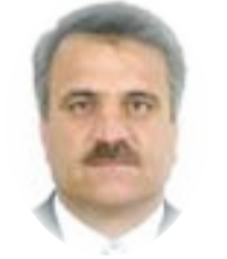
□ بهروز الجاف

قرأت البارحة كتاباً قديماً، منشوراً لأول مرة في عام ١٨٢٧، مؤلفه (كبييل) وهو رحالة بريطاني معروف على أنه قبطان معالي السيد جورج، أي (هون جورج)، وقتل ربما كان كبييل قبطاناً بحرياً عند اللورد هون جورج (١٧٩٤-١٨٠٣) ضابط البحرية وعضو البرلمان البريطاني. عنوان الكتاب طويل عريض (سرد شخصي لرحلة من الهند إلى انكلترا عن طريق البصرة وخراباب بابل وكردستان والديوان الفارسي والساحل الغربي لبحر قزوين وأستراخان ونيشني نوفوغورود و موسكو و سان بطرسبرغ في عام ١٨٢٤، الجزء الثاني، الطبعة الثانية، كولبورن ١٨٢٧)، وجررت إعادة طبع الكتاب في عام ٢٠١٣ بنفس العنوان مؤلفه (القبطان) فقط؛ في مؤسسة الكتب المنشية البريطانية.