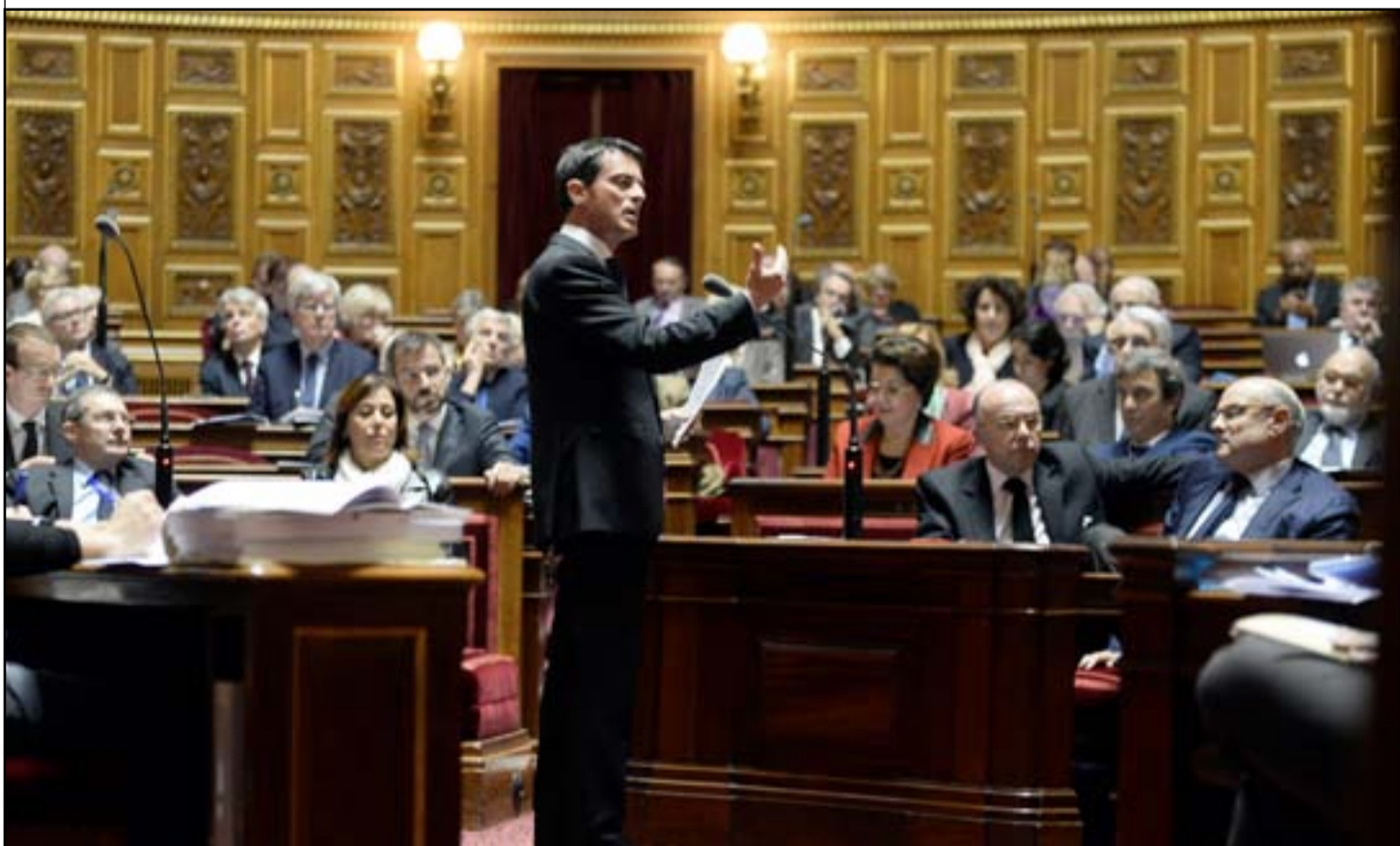
رئيس الوزراء الفرنسي مانويل فالس يتحدث خلال نقاش حول حالة الطوارئ في مجلس الشيوخ الفرنسي.