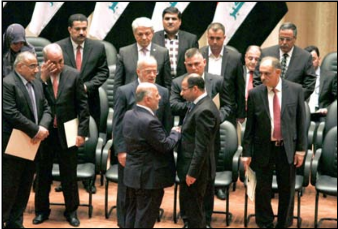
الكابينة الوزارية خلال جلسة منح الثقة.. عسة: محمود رؤوف

السياسية في مجلس النواب يعارضون توجهات حزب الدعوة بشأن تشريع قانون تحديد الولايات الثلاث، ويرى هذا التوجه أن سكوت الدستور عن عدم تحديد ولاية رئاسة مجلس الوزراء لايعني ان تحديدها يعد مخالفة دستورية". وأضاف عضو اللجنة القانونية انه "من خلال عدم التطرق إلى تحديد ولاية رئيس مجلس الوزراء في الدستور بقي الأمر متروكا للمشرع الذي يستطيع تحديدها أو لا"، مشيرا الى ان "الكتل السياسية البرلمانية ترى من الضروري تحديد ولاية رئيس مجلس الوزراء بولائتين متتاليتين أسوة برئيسي الجمهورية والبرلمان".