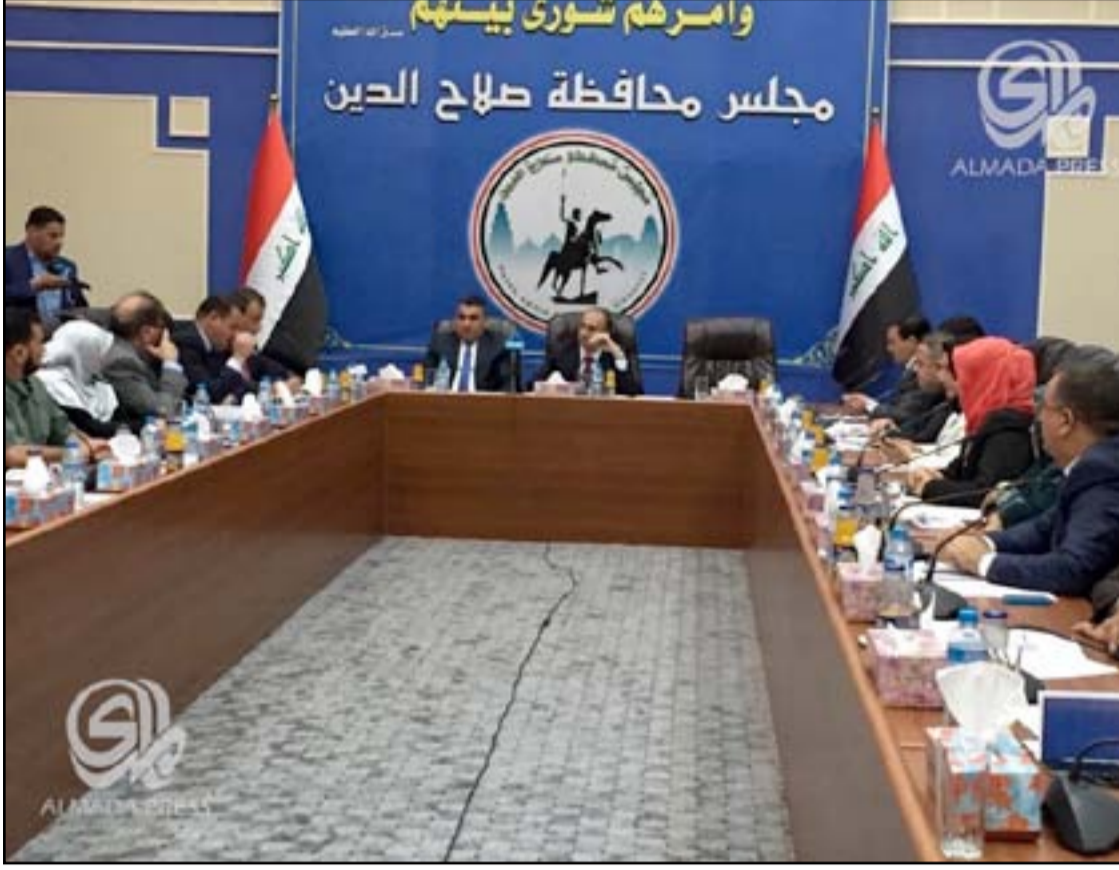
الكريم خلال جلسة مجلس المحافظة، أوشيف

كبديّة ويخشون اعتقالهم". وكان الدليمي قد اعتقل، أواخر شباط ٢٠١٤، فيما اختلفت الروايات حول سبب الاعتقال بين اتهامه بالمدّة ٤ إرهاب وتشابه الاسماء او شعوله في اجراءات اجنثاات البحث قبل ان يخلى سبيله في منتصف ٢٠١٥.