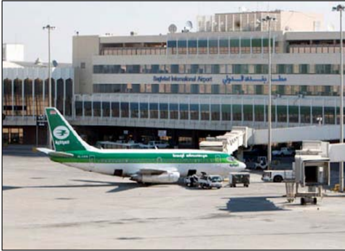
طائرة عراقية في مطار بغداد الدولي

التفتيشية في مطار بغداد الدولي والمشكلة بأمر القائد العام للقوات المسلحة وفق سياقات دقيقة يجري تفتيشها على الطائرات القادمة للعراق للتحقق من مدى مطابقتها لقوائم ومفردات الشحنات التي تم بموجبها الحصول على إذن دخول الأجواء العراقية والهبوط في المطارات العراقية من قبل قيادة الدفاع الجوي".