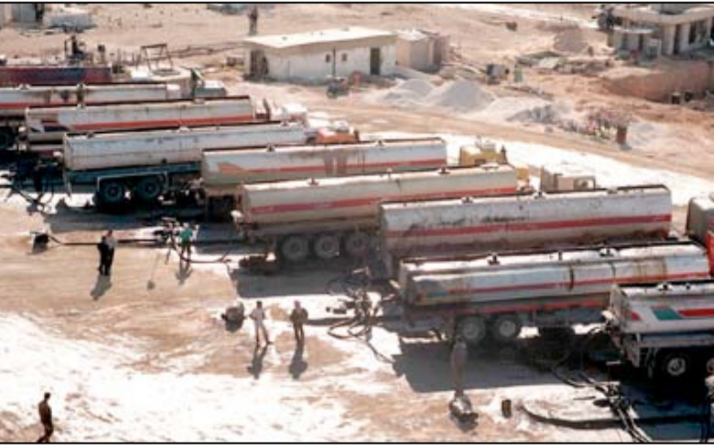
ناقلات حوضية مخصصة لنقل النفط

الضربات التي باءت تستهدف حقول النفط المستغلة من قبل مسلحي داعش جاءت لا لان المسؤولين الاميركيين يعلمون الغيب، وانما إدارة اوباما كانت تسعى للتقدير في استهداف التنظيم الارهابي. المخبرات الاميركية من جانبها أكدت بشكل صارخ إن الاضرار التي لحقت بالتنظيم كانت مفرطة بعد استهداف حقول النفط، سيما ان عائدات مسلحي داعش من بيع النفط بلغت ٤٠٠ مليون، وفقا لتقديرات المخبرات الاميركية. قسم البينات في وزارة الخزانة الاميركية أصدر تقريرا عقب اعتداءات باريس وتحديدا بعد ساعات من تفجير ملعب لكرة القدم في العاصمة الفرنسية قال فيه "ان مسلحي داعش يحصلون على ٥٠٠ مليون دولار سنويا من بيع النفط".