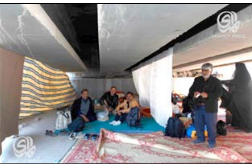
زوار من إيران اقاموا خيمة تحت احد الجسور في النجف

للزائرين الإيرانيين، مشيراً الى أن هناك عدم عدالة في هذه الأسعار وطلما واضحه بحقهم" . وأكد الياسري، أن "الحكومة قرار من مجلس الوزراء بذلك، مبيناً أن "١٢ دولاراً لا يفي بكلفة الخدمات المقدمة للسائحين الذين يقدّمون لخدمة هذه المبالغ للفنادق الإيرانية عند زيارة المدن الإيرانية وهي لا تعلق شأننا عن فنادق النجف الاشراف وكربلاء المقدسة" . منه، إن على وزير السياحة المحلية متجهة لمطالبة مجلس محافظة النجف بإصدار قرار داخلي بهذه الخصوص للسنوات المقبلة" .