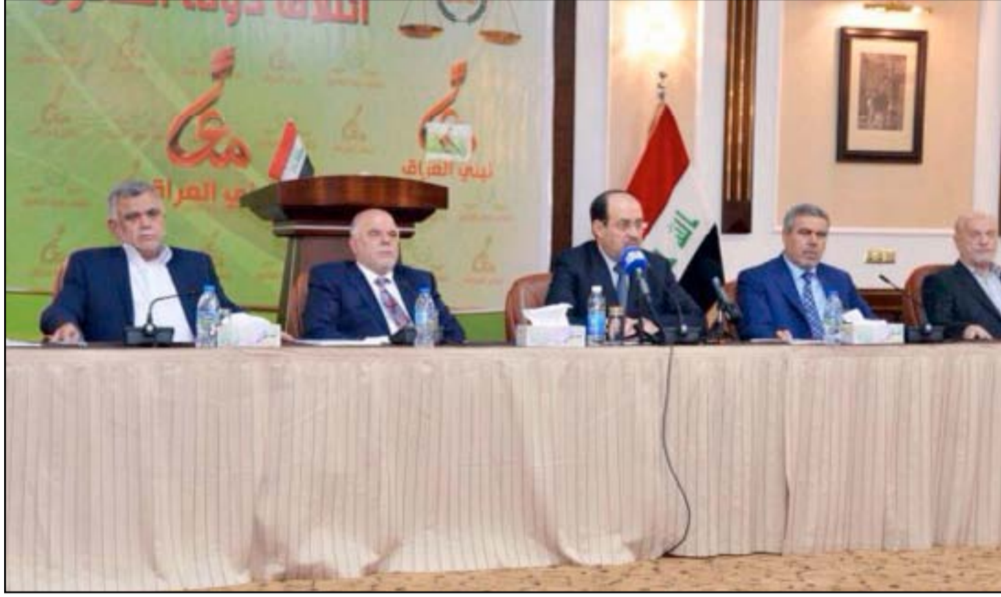
العبادي والمالكي خلال اجتماع سابق.

بعد أسبوعين من تسلم رئيس الحكومة لقائمة الشروط السنوية مقابل دعم اصلاحات الحكومة، ارسل حيدر العبادي النسخة المعدلة لقانون العفو العام الى البرلمان. القانون وعلى الرغم من الاعتراضات حول بنوده، إلا انه يعتبر من ضمن اهم بنود الاتفاق السياسي الذي جمدهته حزم الاصلاحات التي اطلقتها رئيس الوزراء في آب الماضي، الى جانب قوانين اخرى كالحرس الوطني والمساءلة والعدالة.