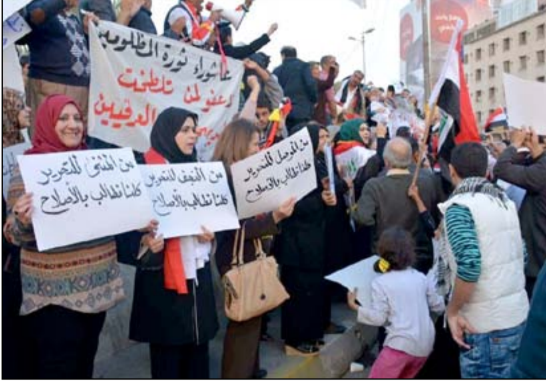
ناشطات يمثلن عدد من المحافظات شاركن في تظاهرة الجمعة الماضية

وتابعت، ان "التمييز والاقصاء والتمييش والسياسة التي تبعتها الطائفية، أمور همتش المرأة، لذلك فأن