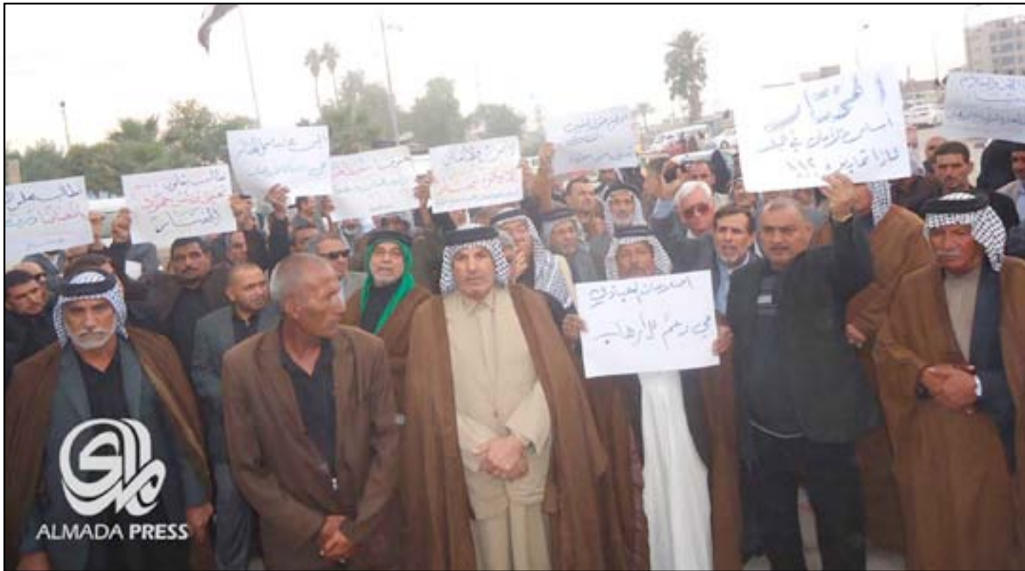
تظاهرة مخاتير محافظة بابل

المدة القانونية لنا ولم تصدر تعليمات إجراء الانتخابات"، مؤكداً "رفع كتاب من خلال مجلس المحافظة برقم ٤/ ٨ إلى الأمانة العامة لمجلس الوزراء للتوصية بالتريث إلا أننا فوجئنا بتاريخ ٤/ ٩ بقرار بأننا وحسب الرأي القانوني ليست لنا أية صفة أو غطاء قانوني للعمل كمخاتير".