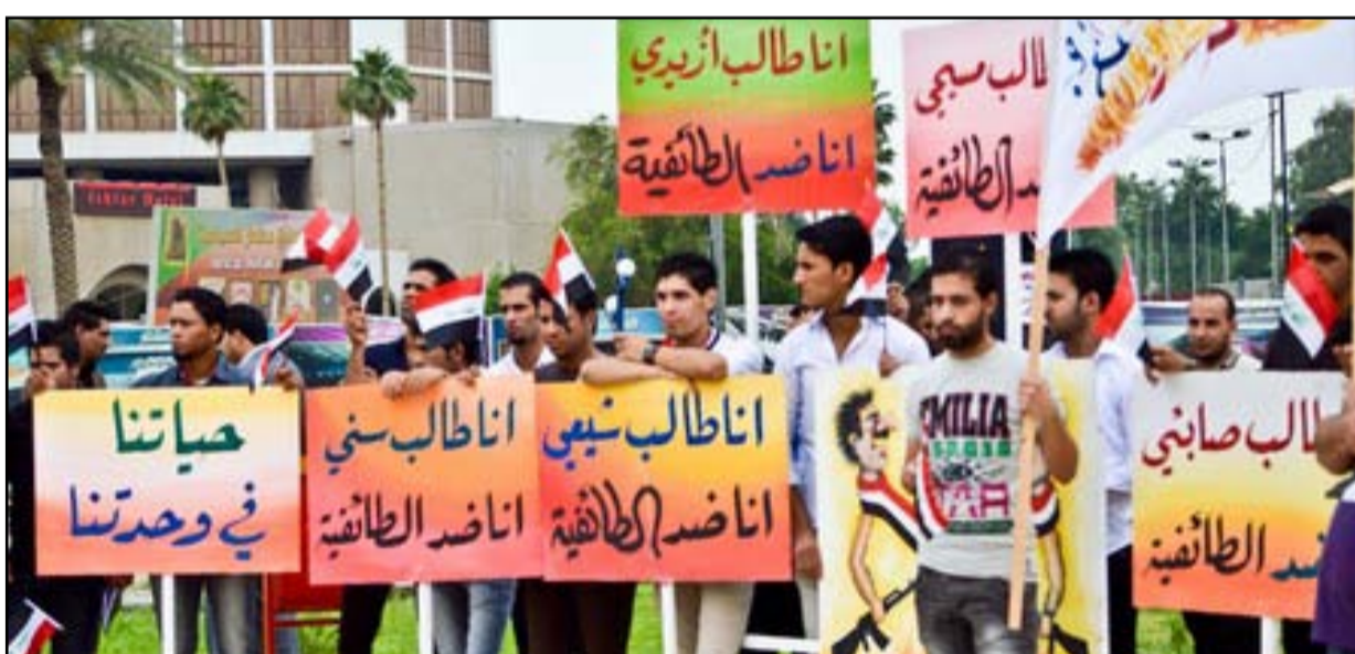
شباب يدعون إلى التعايش السلمي

واسترسلت الناشطة في حقوق الانسان: لا بد لي ان اشير الى اننا نحتاج وقبل كل شيء ان نتذكر ان لا بد ان نتسامح ونصالح أولاً مع ذاتنا ونحترمها لنتمكن من التسامح مع الآخر. مؤكدة: أننا كشعب عراقي على قدر ما يعاني فيه الفرد من ظلم واضطهاد فهو شعب أعلى احلامه هو العيش. ويده ممدودة للسلام من تحت أنقاض الإرهاب تحتاج لمن يسكنها ليحملها نحو افاق النور والأمان.