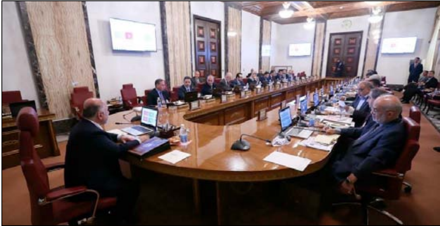
اجتماع مجلس الوزراء

طوارئ إذ سيتم صرف كل الإيرادات التي ستصل للحكومة مباشرة"، منوهة الى ان "المصادقة على الموازنة سيتمنح الحكومة الشرعية القانونية لعمليات الإنفاق". وكانت الخلافات السياسية حالت دون تمرير موازنة 2014، وإعتمدت الحكومة على صلاحيات محدودة لنفقاتها. وتطالب الكتل السياسية الحكومة بتقديم جرد حساب لنفقات العام الماضي.