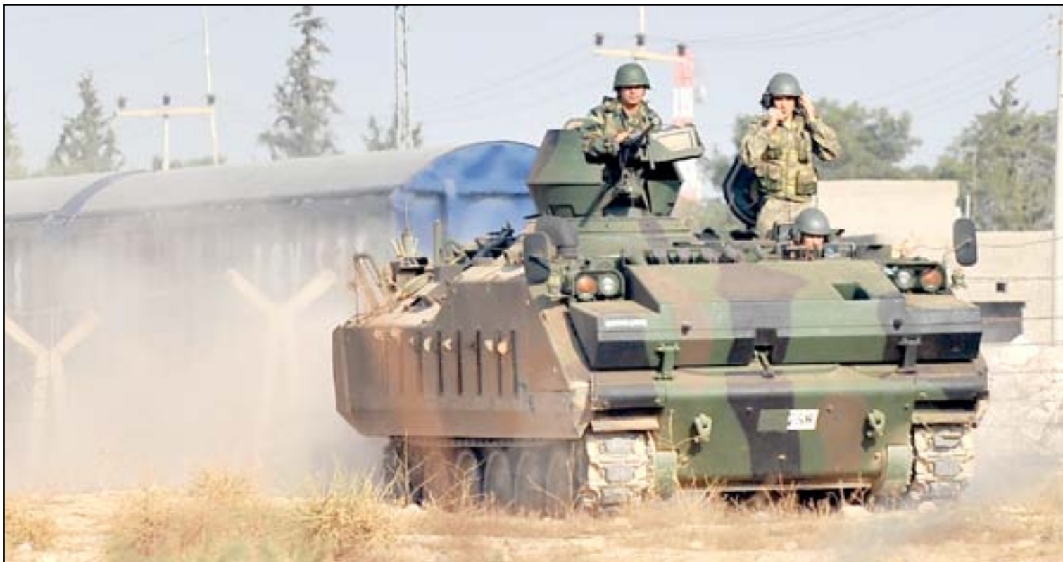
مدربة تركية في أحد المقار العسكرية

قامت تركيا، الاثنين الفائت، بسحب مجموعة عسكرية صغيرة من قواتها من معسكر للتدريب شمال العراق، لكنها رفضت الإذعان لضغوط بغداد وموسكو لسحب كامل قواتها.