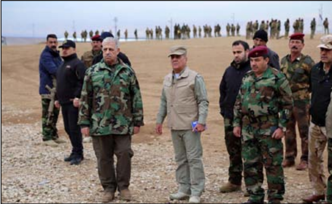
النجيفي في معسكر تحرير نينوى.. أرشيف.