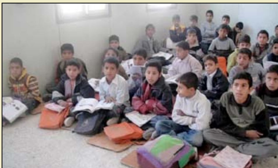
الاهمال الحكومي تسبب بزيادة المدارس الأهلية

المشرف التربوي وعدد الطلاب أحد أولياء أمور الطلبة ذكر ان أبنائه في مدرسة (....) الأهلية الكائنة في حي القاهرة: انها استلمت من كل طالب مبلغاً قدره (١,٨٠٠,٠٠٠) أجور دراسة للترويجي! مبينا: انثناء زياره المشرف التربوي للعام الحالي، مضيفاً: انها استوفت من كل طالب مبلغ