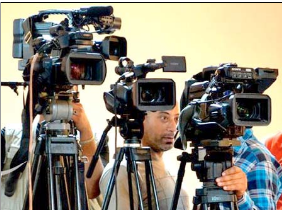
صحفيون عراقيون خلال احدى التغطيات الاعلامية

وقال رئيس مرصد الحريات الصحفية، زياد العجيلي، في حديث لـ (المدي برس) إن "الدائرة الإعلامية في مجلس النواب أصدرت مؤخراً تعليمات جديدة لاعتماد الهيئات الخاصة بالصحفيين لدخول بنائية المجلس، منها الزام الصحفي الاداعي والتلفزيوني، جلب كتاب اعتماد من هيئة الإعلام والاتصالات".