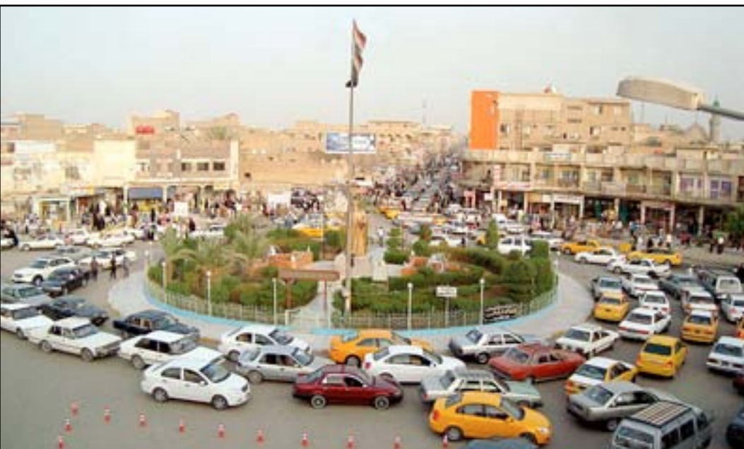
مركز مدينة الناصرية

وتشريعات قانونية تساعد الحكومات المحلية في معالجة المشكلة". وأشار محافظ ذي قار إلى إن "إدارة المحافظة عملت على معالجة مشكلة المتجاوزين من خلال المبادرة الوطنية