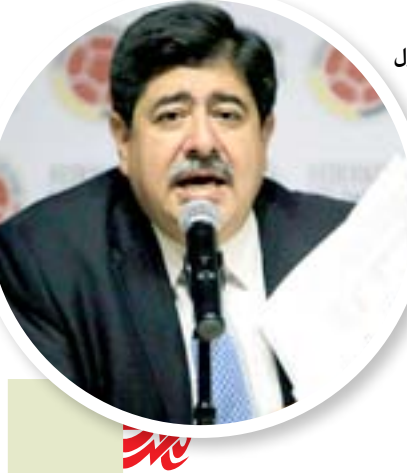
الفيصلي يطمح للتتويج بطلاً للخريف

خلفت قرعة الدور الثاني لمسابقة الدوري الأوروبي "يوروباليج" في كرة القدم التي سحبت في مدينة نيون السويسرية، مواجهات نارية لكبار القارة العجوز، فيما حظي ممثلاً انكلترا مانشستر يونايتد وليفربول باختيارين سهلين نسبياً. وعلى غرار قرعة الدور ثمن النهائي لمسابقة دوري أبطال أوروبا التي شهدت 4 مواجهات من الطراز الرفيع، فإن قرعة مسابقة الدوري الأوروبي أسفرت عن 4 مواجهات نارية بين فيورنتينا الإيطالي وتوتنهام الإنكليزي، وفاريزال الإسباني وناپولي الإيطالي، وبوروسيا دورتموند الألماني وبورسو البرتغالي، وسبورتنغ لشبونة البرتغالي وباير ليفركوزن الألماني. وعموماً، لم ترشح القرعة الأندية الألمانية، فبوروسيا دورتموند ثاني البوندسليغا سيلتقي مع بورتو ووصيف الدوري البرتغالي الذي أبلى البلاء الحسن في مسابقة دوري أبطال أوروبا وكان قريباً من بلوغ الدور ثمن النهائي لولا خسارته أمام تشيلسي الإنكليزي