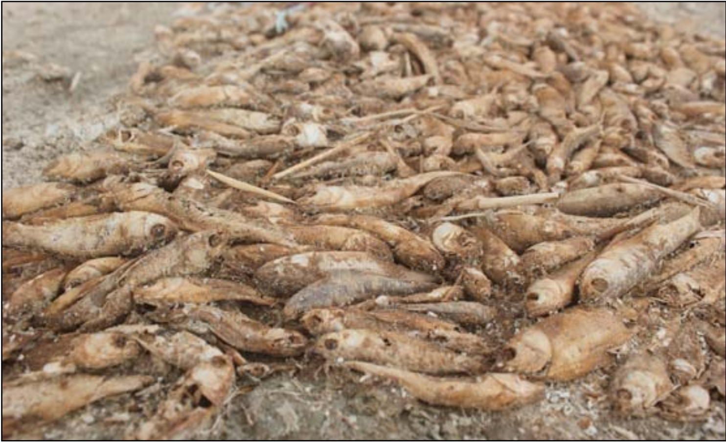
أسماك بحيرة الرزازة تنفق بسبب المياه الثقيلة والتلوث

ونفى الفتاوي، أن "يكون موت أسماك الرزازة بسبب مياه المجاري التي ترمى فيها، لوجود أسماك في الميازل التي تمر عبرها المياه الثقيلة من دون نفوقها"،