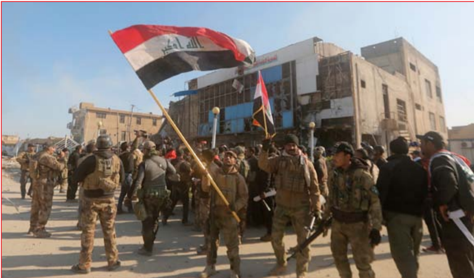
القوات المحررة ترفع العلم العراقي وسط المجمع الحكومي