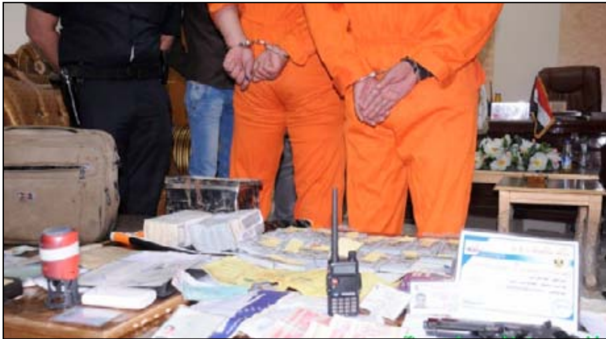
القبض على عصابات منظمة

والتي تمتد أحياناً الى أكثر من الساعة الثامنة او التاسعة صباحاً هذا الأمر أسهم في هروب الناس من التعامل مع المصارف. دور البنك المركزي واشار الشماشي الى أن الوضع العام في المصارف العراقية هو الآخر يحتاج الى وقفة جادة من قبل المعنيين والمختصين، داعياً الى ضرورة تحسين ادارات بعض المصارف بسبب السلبات التي راقت عمل العديد من تلك المصارف مما أساء الى سمعة القطاع المصرفي العراقي، لافتاً الى أهمية أن يلعب البنك المركزي دوراً مهماً وبارزاً في إعادة الثقة للجمهور والتعامل مع المصارف الحكومية والخاصة وهذا أيضاً يأتي ضمن خطوات العمل الجاد للمصارف الأهلية أيضاً.