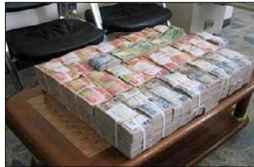
أموال مسروقة بقبضة قوى الأمن

تستقبل المدى شكاواكم من خلال هذه الزاوية اليومية وذلك على العنوان الالكتروني (Email: info@almadapaper.net) وكذلك على العنوان البريدي "جريدة المدى" بغداد - شارع السعدون - خلف محطة تعبئة وقود السعدون