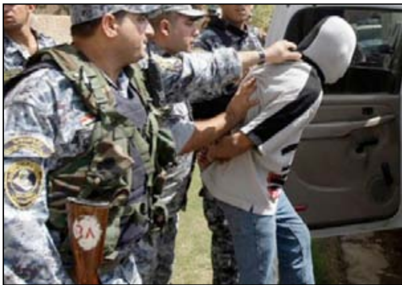
القبض على سارق