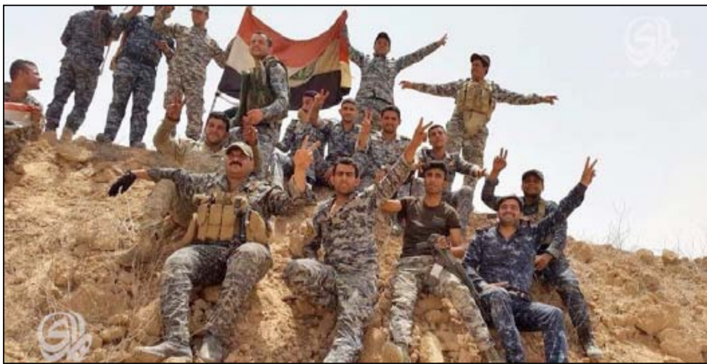
جنود في تكريت... أرشيف

إلى الثلاثين. وتسبب استيلاء داعش في عام ٢٠١١ على مساحات واسعة من الأراضي العراقية في ارتفاع نسبة الحضور إلى ٨٧ في المئة.