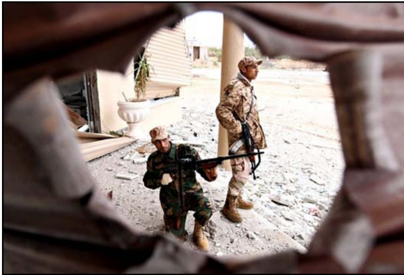
القوات الموالية للحزب، خلال معركة للسيطرة على بنغازي

وينتقل إلى صحيفة الغارديان التي كتبت موضوعاً عن حالة التفاؤل التي يعيشها الشارع الإيراني قبل ساعات من صدور تقرير الوكالة الدولية للطاقة الذرية الذي إذا أقرّ التزام طهران سترفع العقوبات الاقتصادية المفروضة عليها. وتكتب مراسل الصحيفة في إيران سعيد كسالي دوغان تحت عنوان "لحظة تاريخية لإيران مع عودة ثاني أكبر اقتصاد في الشرق الأوسط من الجمود". ويقول المراسل إن إيران تضررت بشكل كبير على مدار عقد من الزمان بسبب العقوبات المفروضة عليها ولكن الصورة توشك على أن تتغير خلال عطلة نهاية الأسبوع، إذ يلتقي وزير الخارجية جواد ظريف مع نظرائه من أميركا وأوروبا لإعلان تقرير الوكالة الدولية للطاقة الذرية عن التزام طهران بالاتفاق النووي