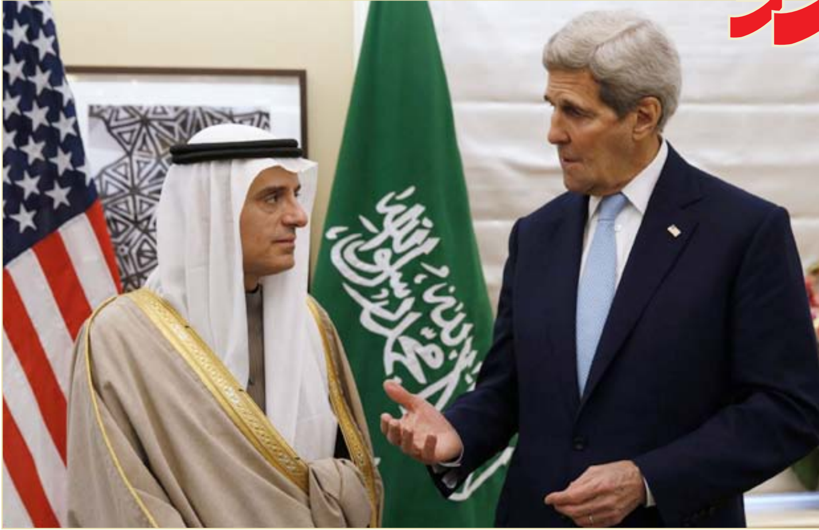
كيري مع وزير الخارجية السعودية

نشرت صحيفة "لوفيفارو" الفرنسية، مقالاً تحليلياً للصحفي والكاتب كلود سيكار، حول "صراع الحضارات" بين الحضارة الغربية، وبين الحضارة الإسلامية، وخاصة إثر تدفق المهاجرين إلى أوروبا. وقال الكاتب في مقاله الذي ترجمته "عربي ٢١"، إن تدفق المهاجرين إلى أوروبا خلال عام ٢٠١٥، بالإضافة إلى الاعتداءات الجنسية التي شهدتها مدينة كولونيا خلال رأس السنة الميلادية؛ شكلت صدمة بالنسبة لأوروبيين، ونقل عن عالم الاجتماع ماتيو بوك كوتي، قوله في هذا الصدد، إنه "من الصعب أن يدخل مئات الآلاف من الناس بلد ما؛ دون أن يتسبوا في صدمة ثقافية بينهم وبين البلد المضيف، كما أن هذا الاختلاف يمكن أن يصل إلى صدام حضارات بين الطرفين". وذكر الكاتب كلود سيكار أن مصطلح "صراع الحضارات" تم استخدامه من قبل علماء الأنثروبولوجيا، أو علم الإنسان، الذي يمثل فرعاً من العلوم الإنسانية يهدف إلى دراسة كيفية عيش البشر سوياً، وكيفية تفاعل المجموعات داخل المجتمع مع بعضها البعض، "إلا أن هذا العلم لا يدرس كثيراً في فرنسا، على الرغم من الحاجة لعدة توجيهه انتقادات حادة إلى انتهاك حرية التعبير في تركيا. وحمل بايدن بعضاً على الضغوط المفروضة على الصحافة والأصوات المعارضة في تركيا التي قال إنه "لا يمكن أن يُضرب بها المثل في مجال حرية التعبير". وأعلن بايدن في مستهل لقائه مع ممثلين عن المجتمع المدني التركي بحضور ستة أكاديميين ورؤساء تحرير وصحافيين أترك مقرين من المعارضة "عندما يتم تهريب وسائل الإعلام أو سجن الصحافيين ويتهم أكثر من ألف أكاديمي بالخيانة لجرد أنهم وقعوا على عرضة، فهذا لا يشكل مثلاً جيداً". وخضع الأكاديميون للاستجواب والتوقيف وتعرض بعضهم لعقوبات تأديبية، ما أثار الغضب في تركيا وخارجها. وقال بايدن "إذا لم