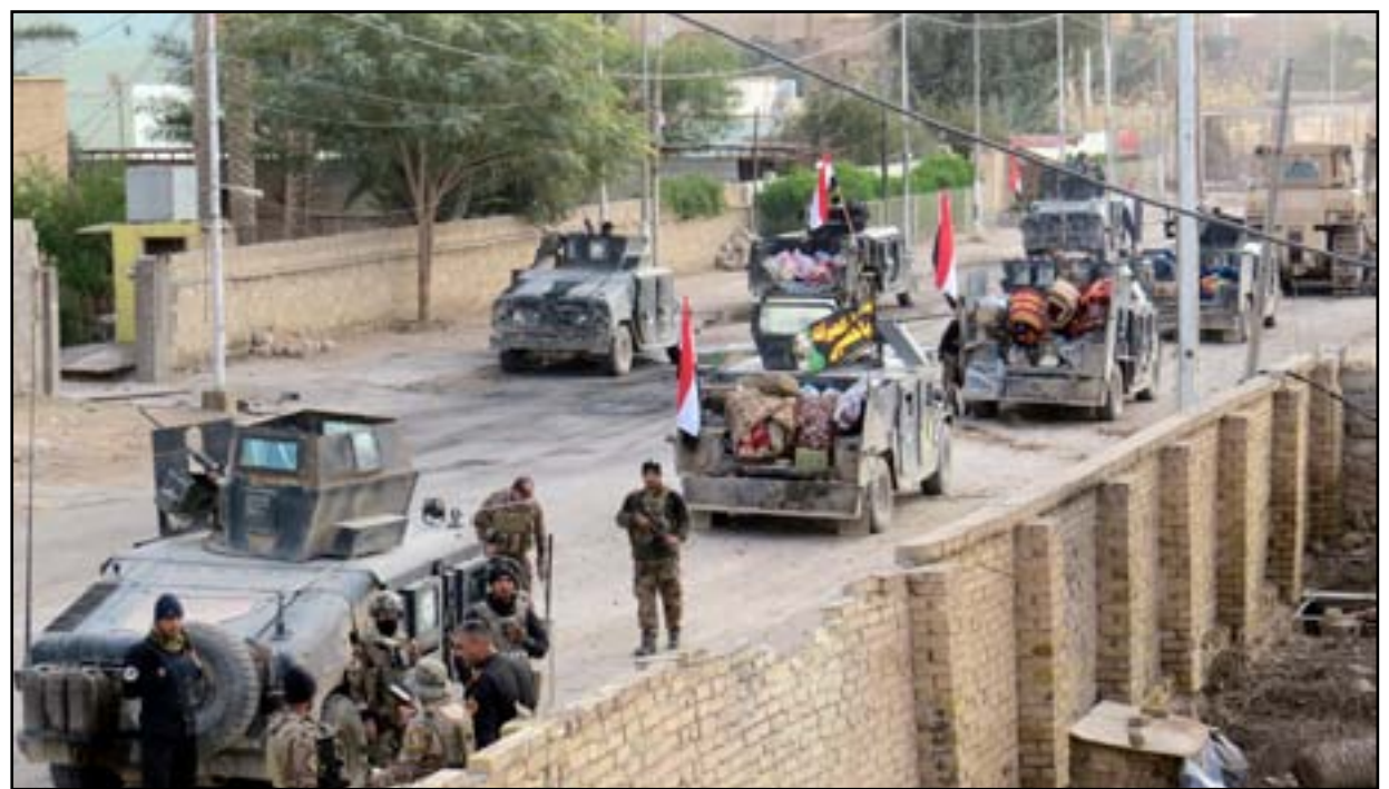
رتل عسكري وسط الرمادي.. أرشيف.

التنظيم وعناصره الذين يهربون دون مواجهة مفتوحة مع القوات الامنية". وأشار رئيس المجلس إلى أن "المعركة القادمة ستكون في تطهير جزيرة الخالدية شرقي الرمادي"، مشيراً إلى أن "لكل سيتضمن فتح الطريق البري القديم الذي يربط