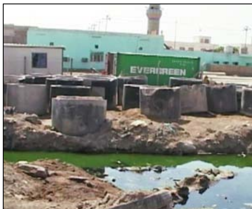
ادوات متروكة بالانتظار

خلال مقابلة ثانوية، وهو ما يعني عدم قدرة المحافظة على الاستعانة بشركة أخرى لاستكمال المشروع.