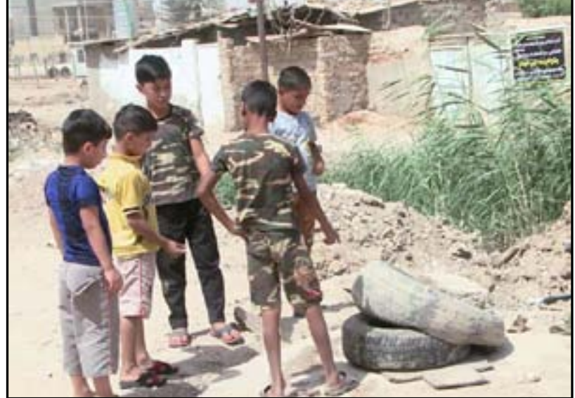
الأطفال وخطر المشاريع المتوقفة

يعترف المدني بأن الحلول "مؤجلة"، وأفضل هذه الحلول "لن ينتهي قبل عامين أو ثلاثة"، فالعقد الموقع بين وزارة البلديات والشركة، كما يؤكد المدني "يتضمن عدم إحالة الشركة لأي من أجزاء المشروع الى شركة أخرى من