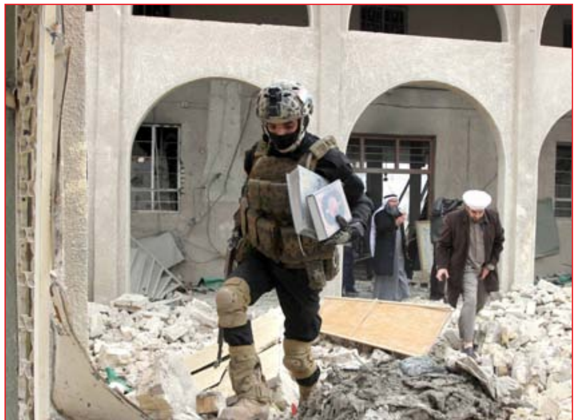
جندي يحمل مصاحف من احدى جوامع المقادادية.. تصوير محمود رؤوف