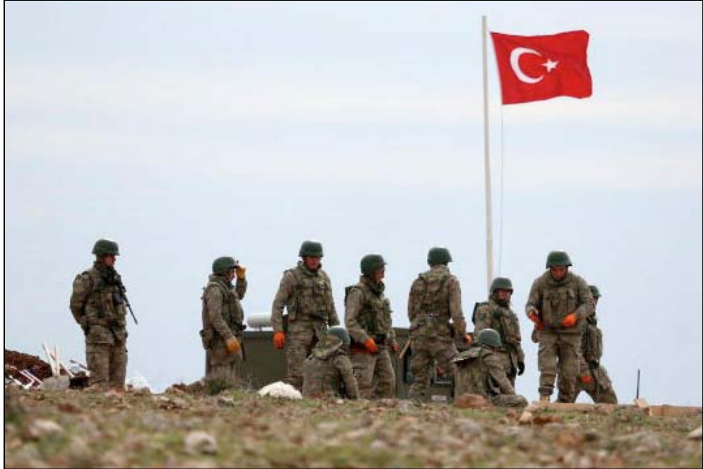
جنود اترك قرب الحدود العراقية.. أرشيف

خلال المنتدى الاقتصادي العالمي المنعقد في دافوس - سويسرا، دعا رئيس الوزراء حيدر العبادي تركيا الى سحب قواتها من الأراضي العراقية، وبدلاً من ذلك توفير التدريب والتجهيزات لمحاربة مجموعة داعش التي تتكبد الكثير من الخسائر.