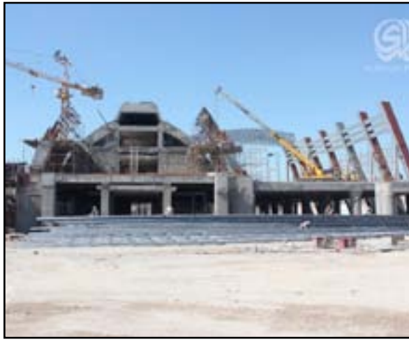
مشروع مرآب النهضة وسط العاصمة بغداد

واضاف البخاتي ان الكثير من الوزارات تنقسم الى مديريات وهذه المديريات يختلف تعاملها مع