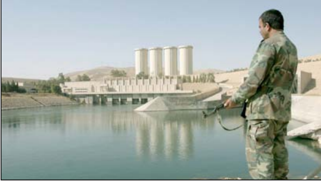
جندي بالقرب من سد الموصل.. أرشيف.

بصعوبة ذلك كونه يصدمم بالآزمة المالية والوضع الأمني. وأهملت الحكومة، خلال السنوات الماضية مع وجود الوفرة المالية، إصلاح السد أو أكمل سد "بادوش" الذي توقف خلال حقبة التسعينيات بفعل الحصار الاقتصادي. ويعتبر سد بادوش، حاجز صد لتقليل أثار الكارثة في حال انهيار السد الأول وتحويله إلى فيضان اعتيادي، بحسب تأكيد المسؤول السابق في وزارة الموارد المائية.