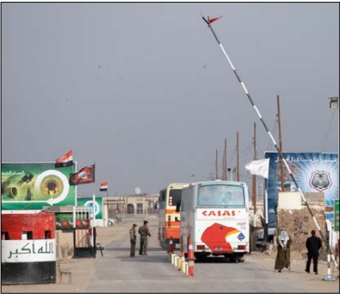
الحدود العراقية الإيرانية