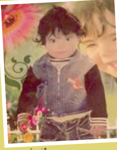
الضحية بعمر سنتين