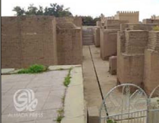
الجنائن الملقة في المدينة الأثرية في بابل

وإثناء المشاريع". ولفت رئيس الهيئة إلى أن "الهيئة بحثت أيضاً موضوع السلامة المرورية والاختناقات الكثيرة في مركز مدينة الحلة"، مشيراً إلى أن "هيات النقل والصحة والمرور