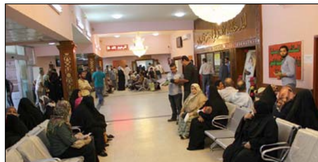
صالة انتظار مستشفى حكومي

المستشفيات والمراكز الصحية. مشددا: ان هذا يتم من خلال توعية الناس وتقنيهم وتعريفهم بدور المراكز الصحية باضافة مادة تدريسية باسم الصحة العامة تدرس في مراحل الدراسة كافة وتكون مدمجة مع حصص العلوم او الاحياء يتعلم من خلالها الطالب دور المركز الصحي ومتى يجب عليه الذهاب اليه وكيف يتصرف ومتى يذهب الى المستشفى.