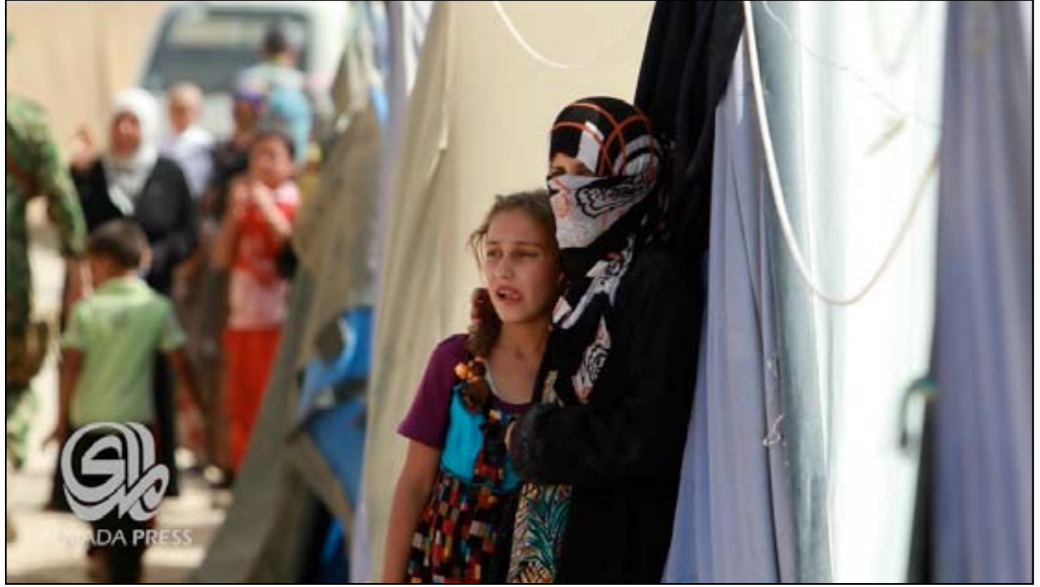
مخيم لايواء النازحين

أكدت المفوضية العليا لحقوق الإنسان في العراق، أمس الجمعة، أن النازحين في كركوك، يعانون "مشاكل عدة وأوضاعاً صعبة"، وفي حين كشف عن إصابة مئات الأطفال والنساء منهم بأمراض نتيجة البرد القارس في ظل قلة الدعم الحكومي والدولي، دعا الحكومة الاتحادية إلى الاهتمام أكثر بهم وحل مشاكلهم لاسيما مع وزارتي الهجرة والمهجرين والتجارة.