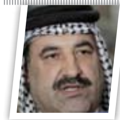
السياسة الأميركية في العراق تنذر بحرب وشيكة