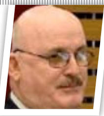
البرلمان وضع شروطاً لبيع أماكن الدولة