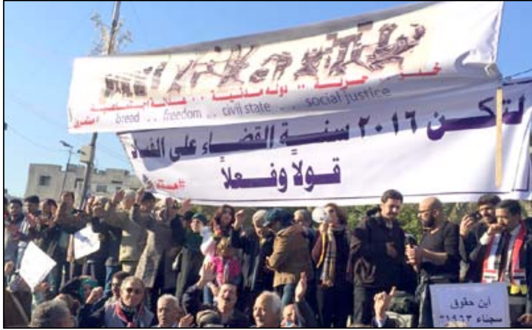
جانب من تظاهرة ساحة التحرير