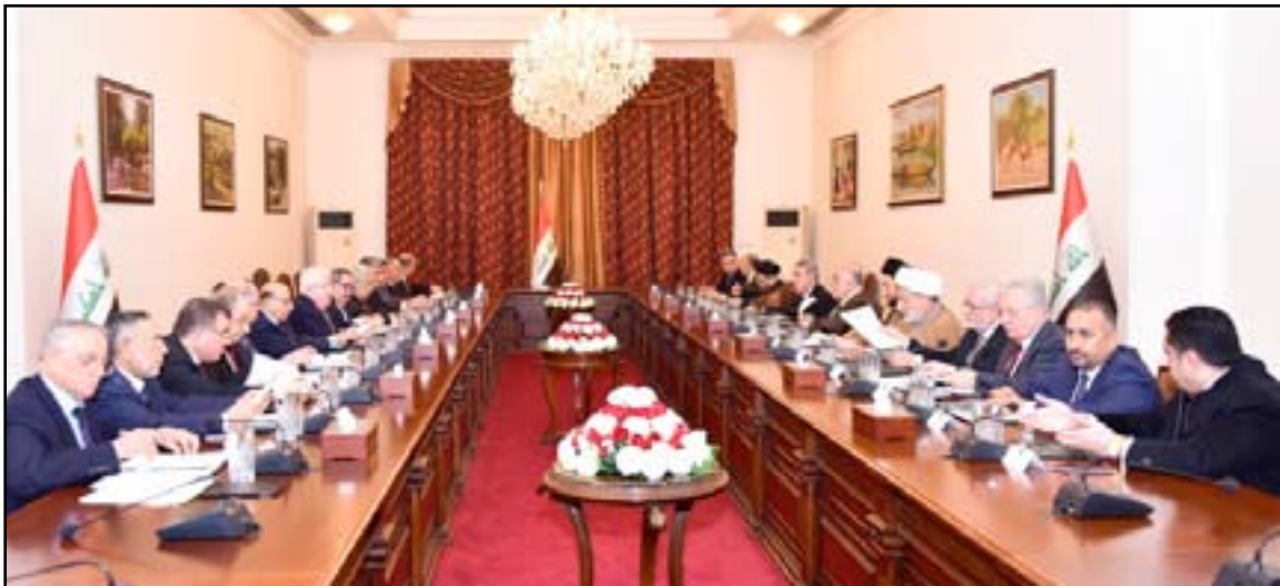
اجتماع الرئاسات ورؤساء الكتل

وأكد رئيس الوزراء أن "الحكومة تسعى إلى الإسراع بتحرير مدينة الموصل"، مشيراً إلى "أهمية إعادة النظر في القوات الأمنية في ناحية البغدادي وتأهيلها وتدريبها"، وشدد على ضرورة "انسحاب القوات التركية من الأراضي العراقية". وفي سياق ذي صلة، ذكر بيان لرئاسة الجمهورية بثلث (المدى برس)، نسخة منه، أنه "حرصاً على المصالح العليا ولضمان تحقيق الانتصار التام على الإرهاب، وسعيها إلى تطوير الأداء على مختلف المستويات والمجالات لصالح تقدم البلاد على الصعيدين الداخلي والخارجي، عقد مساء يوم الخميس، اجتماع في قصر السلام ببغداد حضره السادة رئيس الجمهورية ورئيس الوزراء وقادة ورؤساء الكتل السياسية". وتابع البيان أن المجتمعين "أشادوا