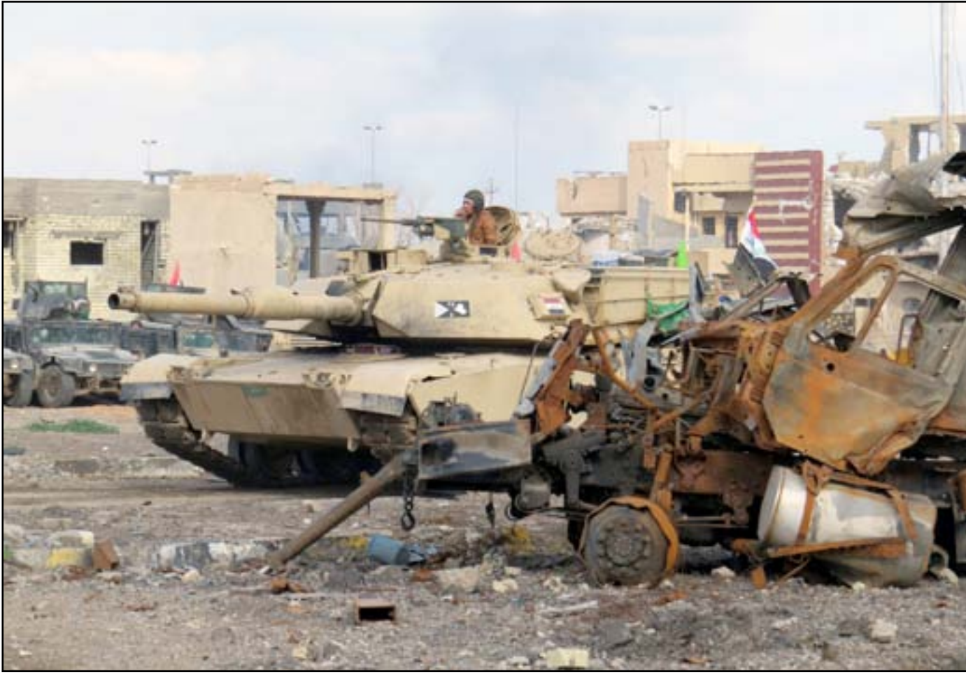
العبوة العسكرية وسط الرمادي.. أ.ف.ب.

عنصر في داعش مكلف بزرع ٧٠ عبوة يومية. وان معدل العبوات التي يضعها داعش، هو عبوتين لكل متر مربع.