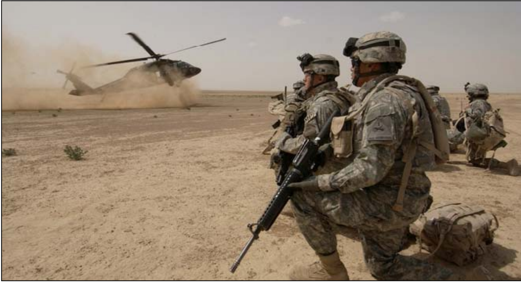
قوات أميركية تنفذ عملية انزال في العراق.. أرشيف