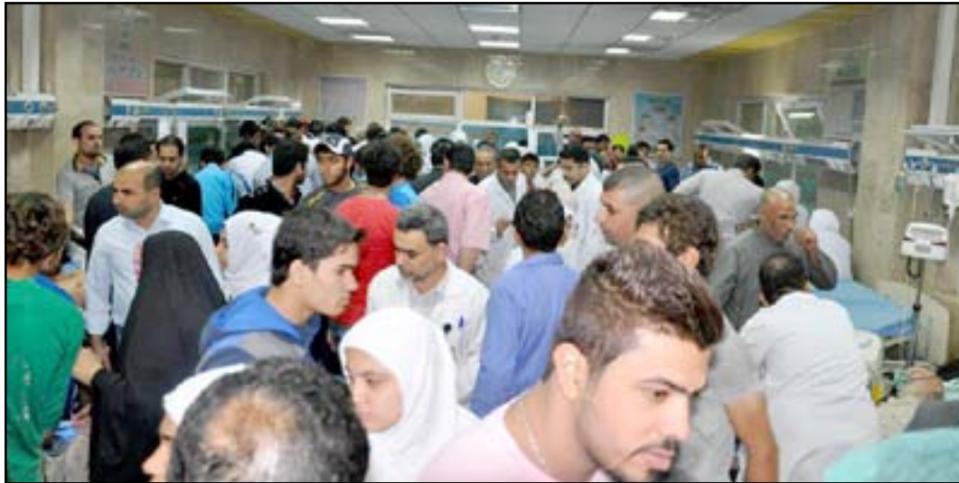
صالة طوارئ أحد المستشفيات

واضاف طالب: الأزمة المالية التي تمر بها البلاد وقلة تخصيصات المالية لوزارة الصحة هي الاخرى جعلت اغلب المستشفيات الحكومية تفقر للعديد من الامور منها الأجهزة الطبية الحديثة والأدوية للأمراض المزمنة. مستدركا: لكن رغم هذه الصعوبات والتحديات التي يشهدها البلد فإن المستشفيات العراقية والمراكز الصحية تعمل وتقدم الخدمات المرضي وفق الامكانيات المتوفرة والمتاحة.