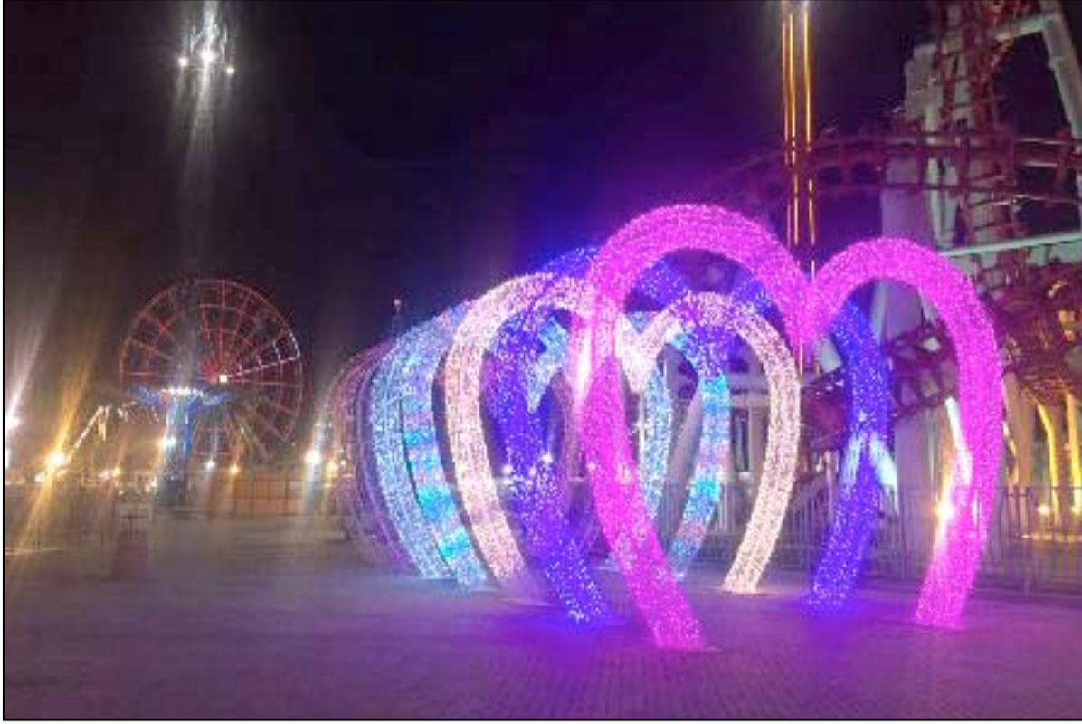
مدينة ألعاب الزوراء تستعد لعيد الحب بنصب سبعة قلوب الأكبر في الشرق الأوسط

وقالت إدارة مدينة ألعاب الزوراء في بيان، تلقت (المدى برس) نسخته منه، إن "المدينة أكملت نصب سبعة قلوب رمزية للحب تعد الأكبر في منطقة الشرق الأوسط بمناسبة عيد الفالتائين الذي يصادف في الـ ١٤ من شهر شباط الحالي، مبيئة أن هذه التجربة تعكس إرادة التواصل مع العالم وإتاحة الفرصة للشباب للتعبير الحضاري عن مشاعرهم ومكوناتهم الداخلية وأضاف إدارة المدينة أن لهذه القلوب السبعة دلالات رمزية: