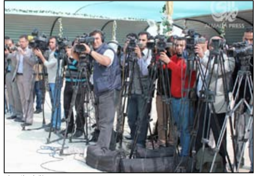
مصورون صحفيون خلال احد المؤتمرات

لافتاً إلى أن "المركز أكد منذ فترة طويلة في إحدى توصياته على ضرورة إلغاء بعض الحواجز القانونية، نظراً لأهمية عمل ونشاط العاملين في الوظائف العامة التي يسمح القانون بنشرها للرأي العام، في حالة حدوث مخالفة أو استغلال للمنصب بما يضر بالصلحة العامة، واختيار طريق الرد وهو حق مكفول".