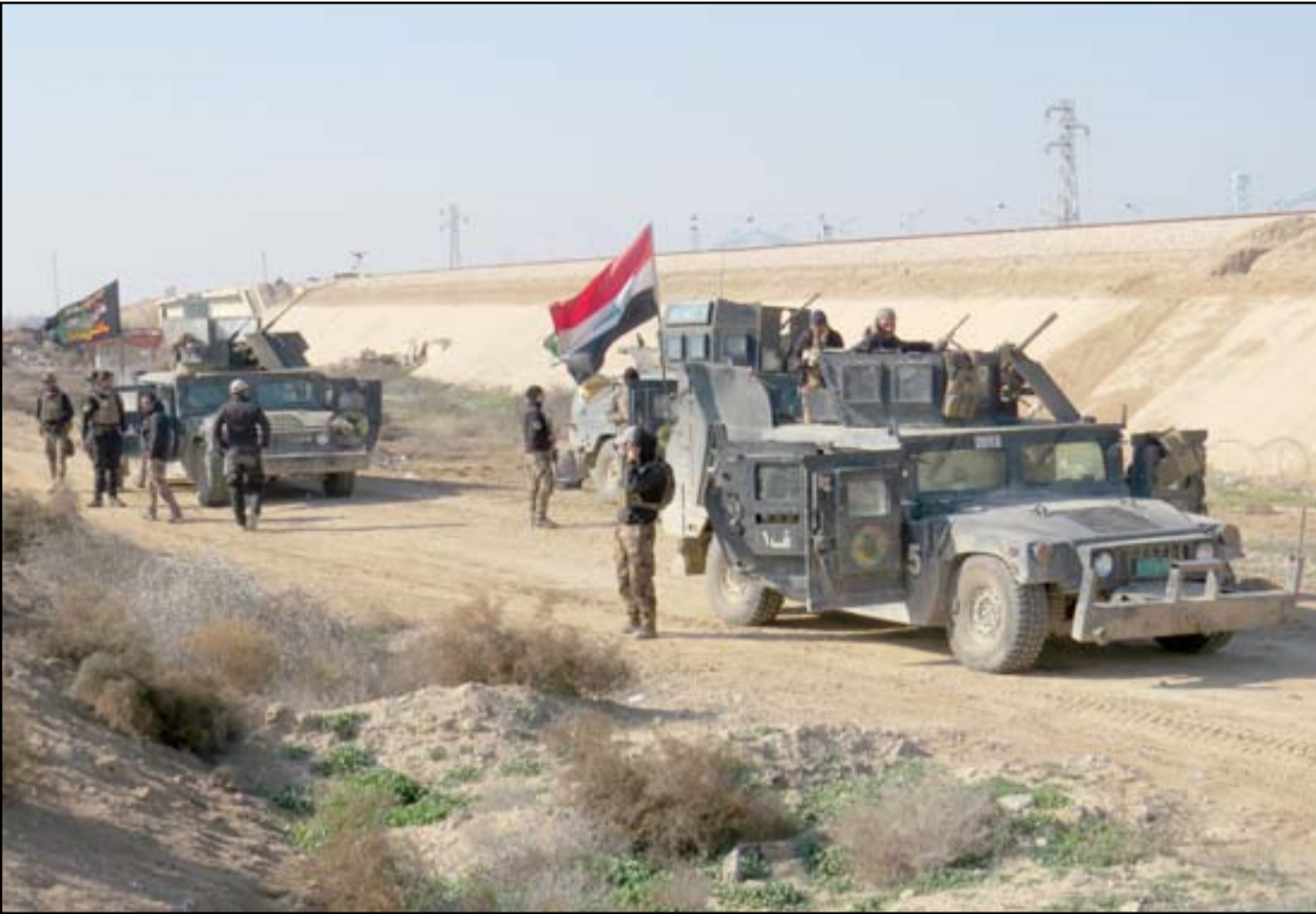
قوة من مكافحة الإرهاب شرقي الرمادي.. أ.م.ب.

ويمدى تدمير شديد، الأمر الذي عطل تحريرها لأسابيع.