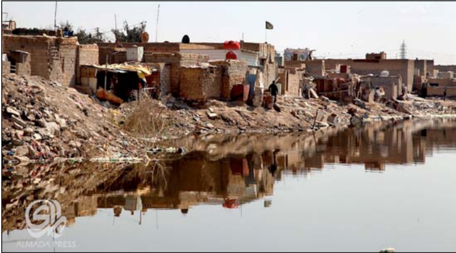
منازل لعائلات متجاوزة في أطراف بغداد

العمل بقرار مجلس الوزراء رقم (١٣٣) لسنة ٢٠١٤ لمدة سنتين.