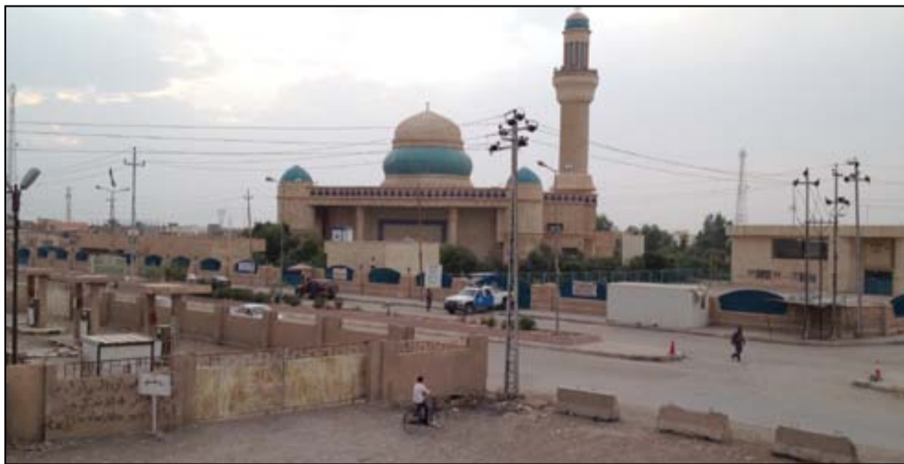
مدينة طوز خورماتو

أعلنت إدارة قضاء طوز خورماتو، أمس السبت، عن موافقة وزير الداخلية محمد سالم الغبان على تعيين ٢٠٠ شرطي في القضاء، شرق تكريت، (١٧٠ كم شمال صلاح الدين)، وفيما طالبته الحكومة بصرف تعويضات متضرري القضاء، أكد الحشد التركماني ان عناصر الشرطة الجدد سيقومون بمسك الجانب الجنوبي والشمال للقضاء.