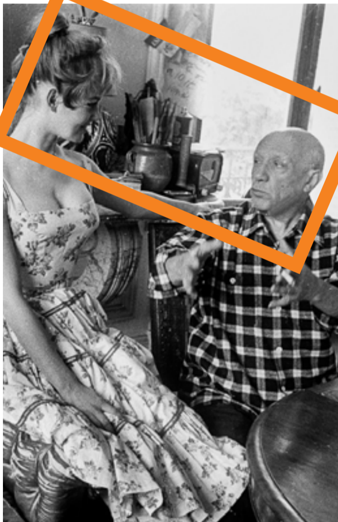
بيكاسو وبريجيت باردو

الثلاثية هذه بأعوام، يقول دالي لكتابت سيرته حين يسأله: لماذا قبل ان يأخذ وساما من الجنرال فرانكو. ألا يسبب له ذلك إحراجاً؟ فيجب على العكس ان الملتزمين هم الخدم وانا اريد ان أبقى سيدياً على الدوام. وحين يقول له: إنك بذلك تنسى هؤلاء المثقفين، والذين قتلوا في سبيل أفكارهم، تنسى صديقك لوركا، فيكون جوابه: "ياسيدي انا بدأت خائناً لطبقتي التي هي البرجوازية فقد أمنت بأقصى اليمين، فأنا من انصار الملكية المطلقة، وانا كذلك فوضوي، لذلك فأنا اقبل اي وسام من الاتحاد السوفيتي او الصين، اعطني إياه وساقبله على الفور". وحين يقول له المحرر: ان انت راض بدور الخائن، يجب وهو يضحك: نعم لأنني اعرض بيكاسو في كل شيء