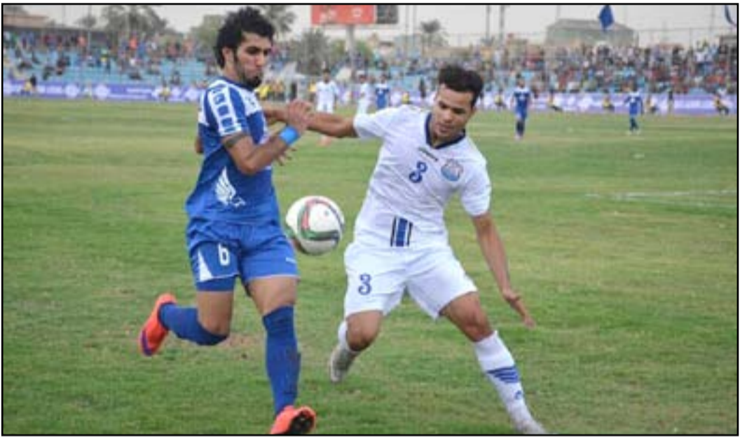
على ملعبه وبين جماهيره فريق الشرطة سابع الترتيب برصيد ١٧ المركز الخامس برصيد ٢٠ نقطة ويواجه فريق النجف صاحب المركز الثاني التي أختتمت يوم ٣٠ كانون الثاني الماضي بالعاصمة القطرية الدوحة .