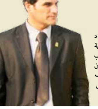
الكرة المركزية في اتحاد