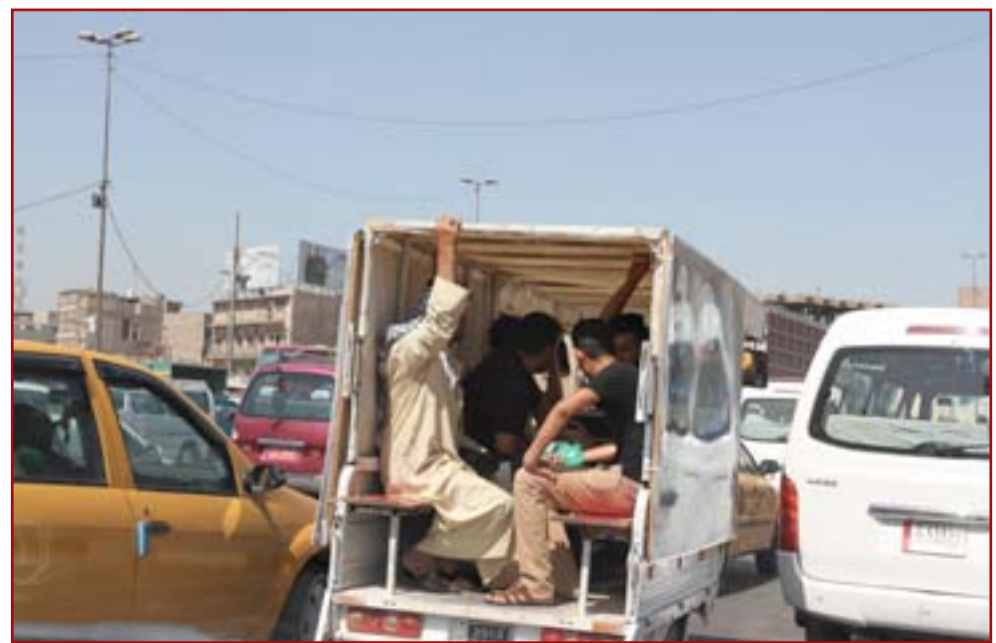
الستوتات هل مشمولة بالقرار؟