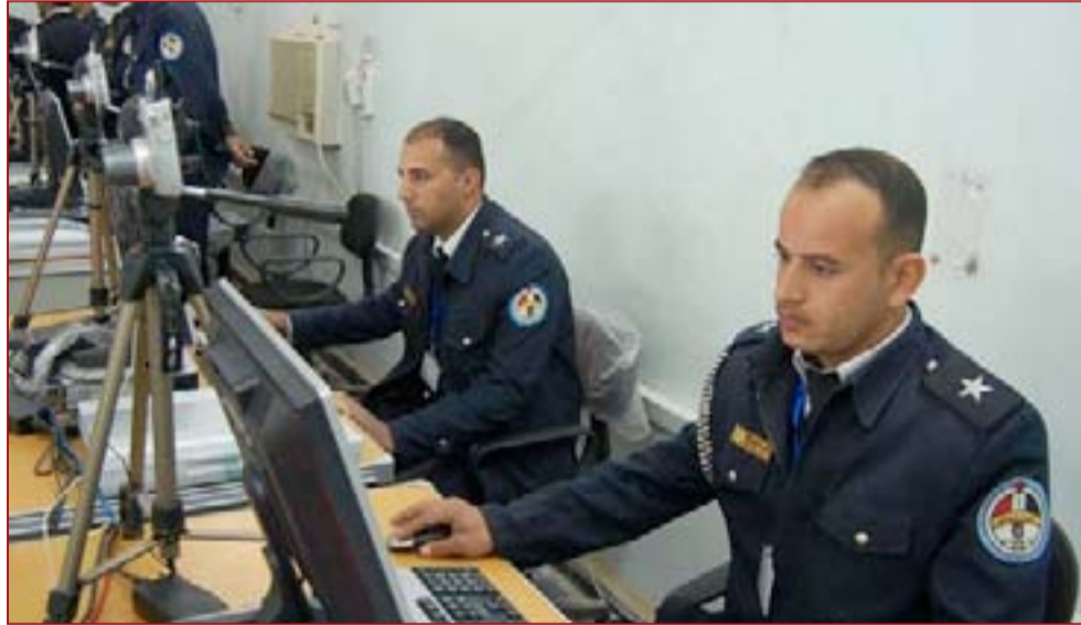
ضباط مرور يقومون بعملية الاصدار