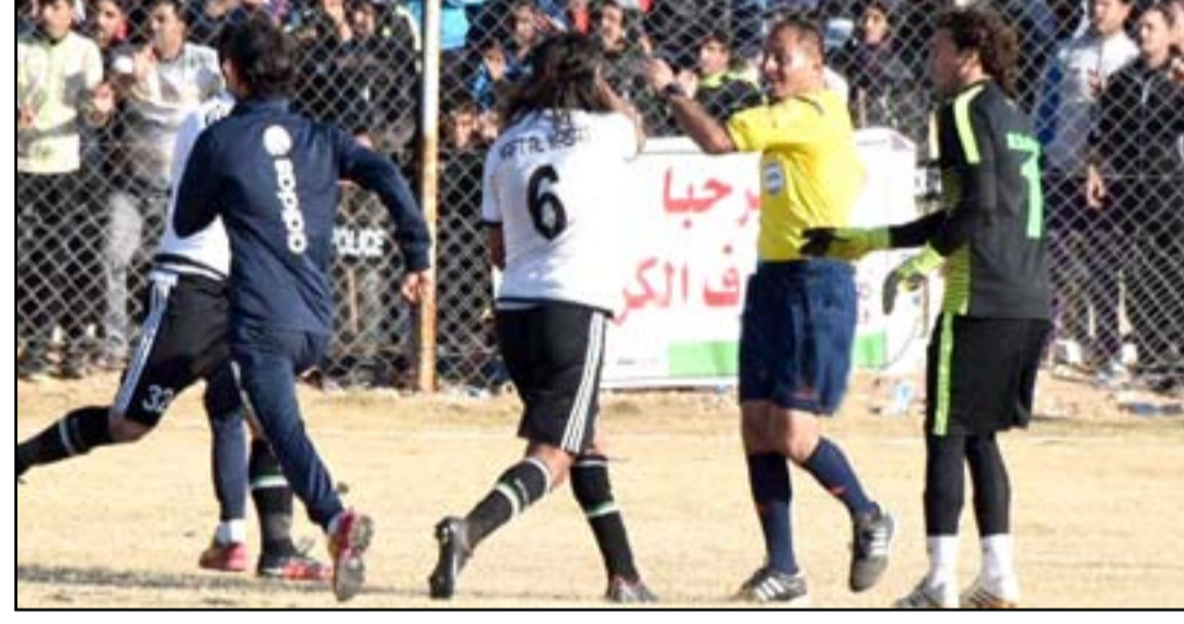
عن موقع الكرة العراقية

وأكدت الوزارة إنها وبرغم التأكيدات المستمرة والتذكير الدائم لكنها سجلت عدم جدية عدد كبير من الأندية في الاهتمام