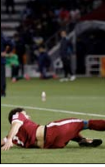
الكرة المركزية في اتحاد