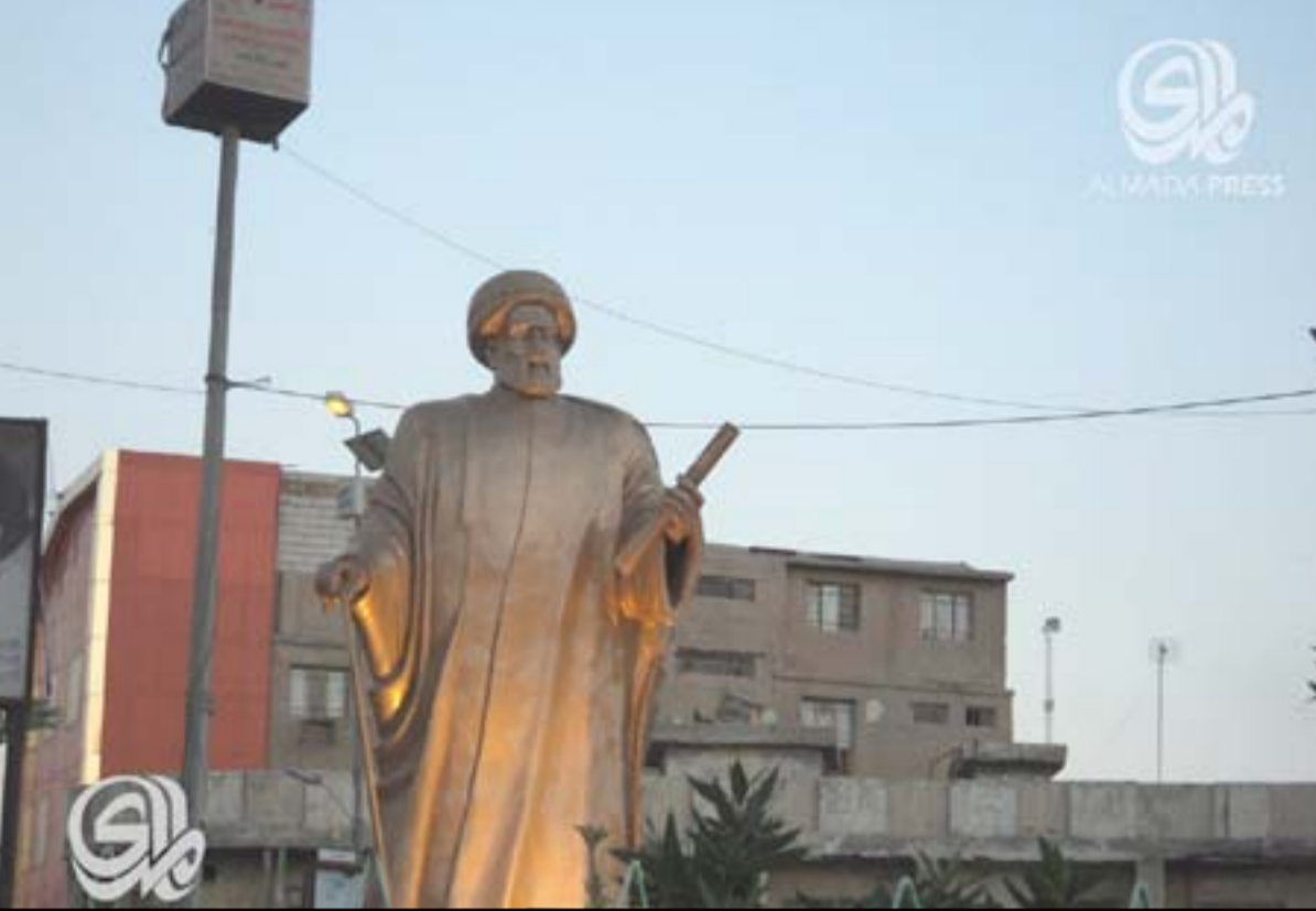
ساحة الجبوبي وسط مدينة الناصرية

المتظاهرين". يذكر أن العاصمة بغداد و١٠ محافظات عراقية هي (بابل وكربلاء والنجف والديوانية والمثنى وذي قار وواسط وميسان