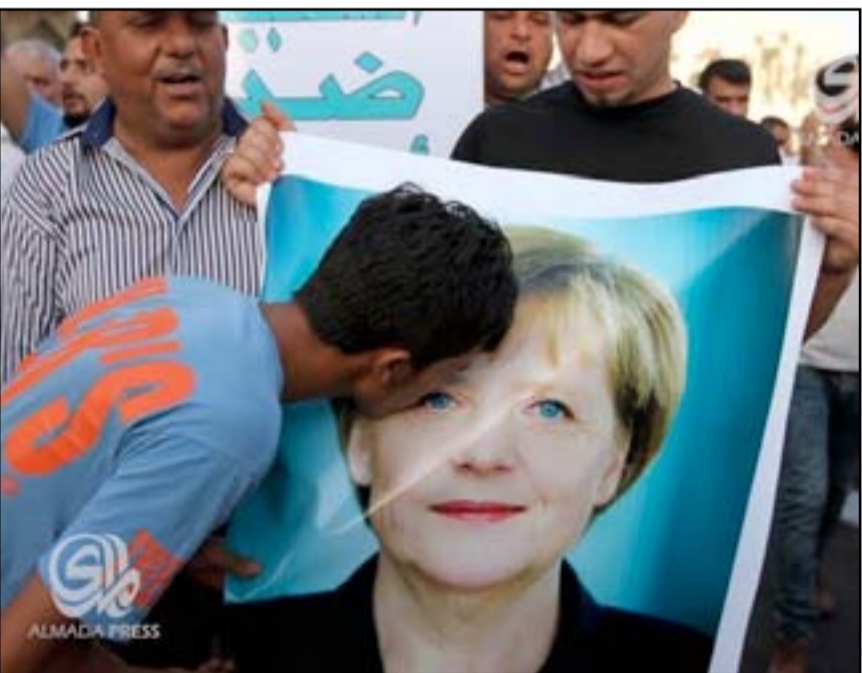
متظاهر يقبل صورة للمستشارة الألمانية أنجيلا ميركل في ساحة التحرير، يوم الجمعة (٤ ايلول ٢٠١٥)

كربلاء، عبد المهدي الكربلائي، الجمعة، (٢٨ من آب ٢٠١٥)، من اتساع ظاهرة الهجرة التي تهدد بإفراغ البلد من طاقاته الشابة والمتفقة، وعد ذلك نتيجة لفقدان الشباب لـ"أمل" بتحسن أوضاعهم وعدم وجود فرصة حقيقية لتوظيف طاقاتهم، وفيما طالب المسؤولين بالعمل بجدية لإصلاح الأوضاع وتنشيط القطاع الخاص، دعا الشباب "المحبتين" إلى إعادة النظر في خياراتهم والتخلي عن الصبر والتحمل.