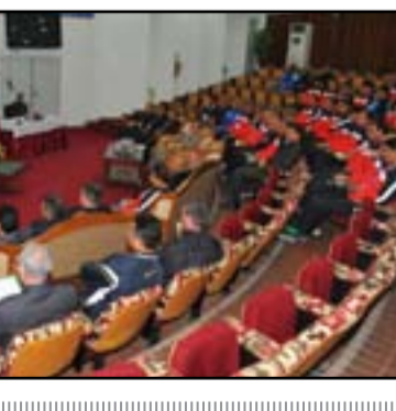
الكرة المركزية في اتحاد