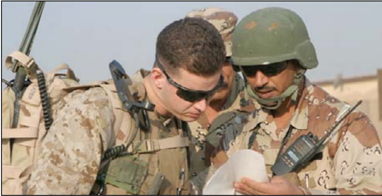
مستشار أميركي في قاعدة الأسد

الحملة الكبرى لإعادة الإعمار والتمهيد لعودة عاجلة وأمنة ومنظمة لعموم نازحي محافظة الأنبار"، مؤكداً أن "اللقاءات التي عقدتها الحكومة المحلية مع ممثلي المجتمع الدولي والمنظمات الدولية بالتنسيق مع الحكومة المركزية أثمرت عن بدء الاستعدادات لدخول المنظمات والفرق الدولية لرفع الأنقاض والمخلفات العسكرية، وإعادة بناء الجسور والبنى التحتية". وأوضح الراوي، أن "التنسيق مستمر مع وزارة الداخلية في تقديم الدعم اللازم للضباط والمتنسين من الفوج التكتيكي وقيادة شرطة الأنبار، في ما يتعلق بالتدريب والتسليح وتوفير العجلات القتالية". الى ذلك، اتهم رئيس ديوان الوقف السني عبد اللطيف الهميم، جهات مغرضة بالسعي لـ "تخريب" مشروع إعادة نازحي مدينة الرمادي. وقال المكتب الإعلامي لرئيس ديوان الوقف السني عبد اللطيف الهميم في بيان تلقى (المدى برس)، نسخة منه، ان "جهات مغرضة ومعروفة لدى الشارع الأنباري تسعى لتخريب مشروع إعادة نازحي المدينة".