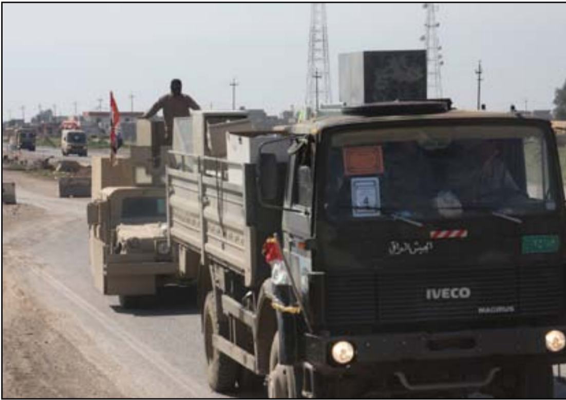
رتل عسكري متجه نحو الموصل

دخل الجيش باعتباره مصدراً للثقة، لا سيما بعد مشاركته بتحرير الرمادي، وحول إمكانية مشاركة الحشد الشعبي في عملية التحرير، يرى أن الأمر متروك لتفكير إيران والولايات المتحدة لانهما يديران المعارك في سوريا والعراق.