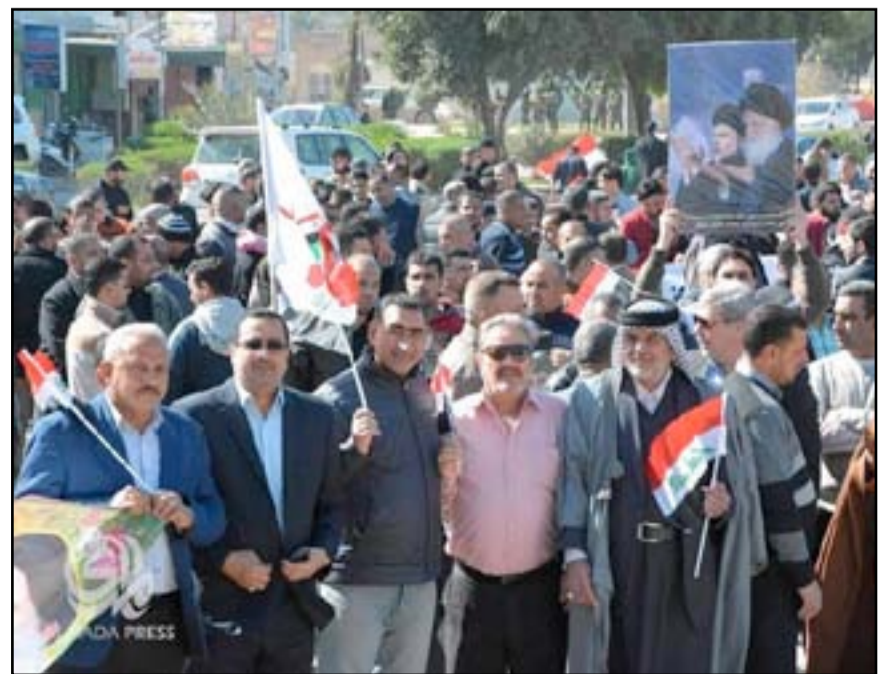
أتباع الصدر يتظاهرون في واسط تأييداً لمشروعه الاصلاحية ويطالبون العبادي بتنفيذه

يذكر أن زعيم التيار الصدري مقتدى الصدر أعلن، يوم الاثنين (٨ من شباط ٢٠١٦)، استعداده لإطلاق مشروع للإصلاح "قريباً"، وقدم شركه الى المرجعية الدينية لاعتراضها على تردي الخدمات والأوضاع الأمنية والإصلاحات السياسية الخجولة"، وفيما وصف موقفها بـ"الشجاعة"، طالب الحكومة بـ"العمل الجاد من أجل الإصلاح وإيقاف الفساد".