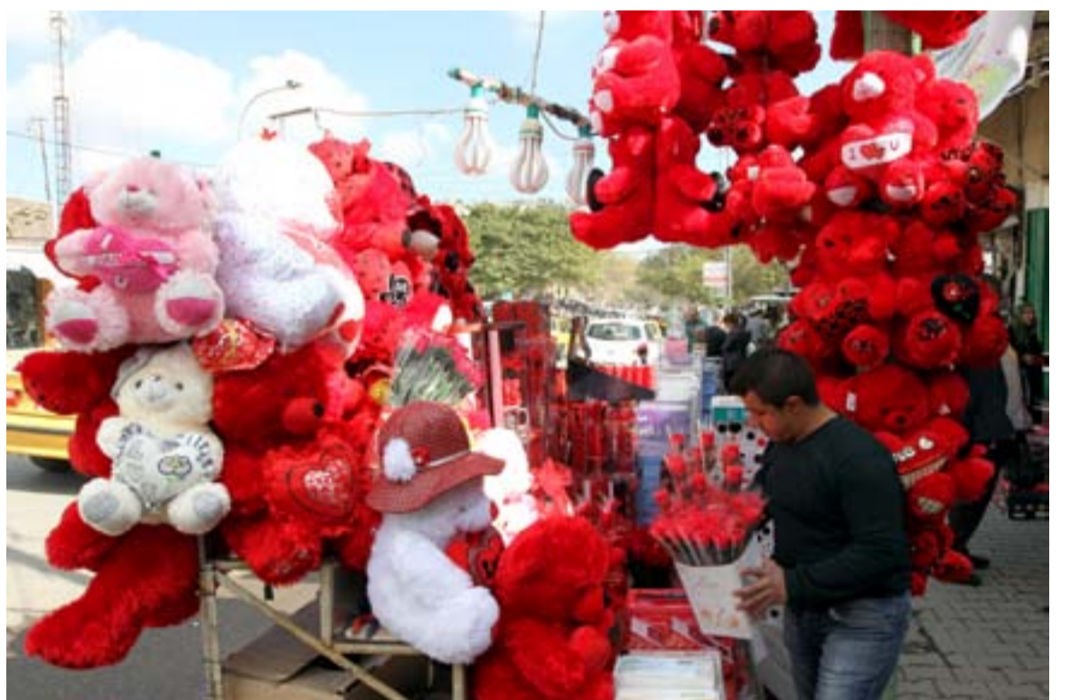
محل لبيع الهدايا في بغداد...

أطلق زعيم التيار الصدري مقتدى الصدر، مشروعاً للإصلاح يتضمن أربعة ملفات، وفيما دعا إلى تشكيل حكومة تكنوقراط بعيدة عن حزب السلطة والتحزب برئاسة رئيس الحكومة الحالي حيدر العبادي. ويزعم الصدر كتلة الأحرار النيابية التي تمتلك 40 مقعداً برلمانياً، ووزارتين بالإضافة الى منصب نائب رئيس الوزراء الذي فقدته خلال حزمة الإصلاحات الحكومية، الصيف الماضي. وقال مقتدى الصدر، في كلمة متلفزة تابعتها