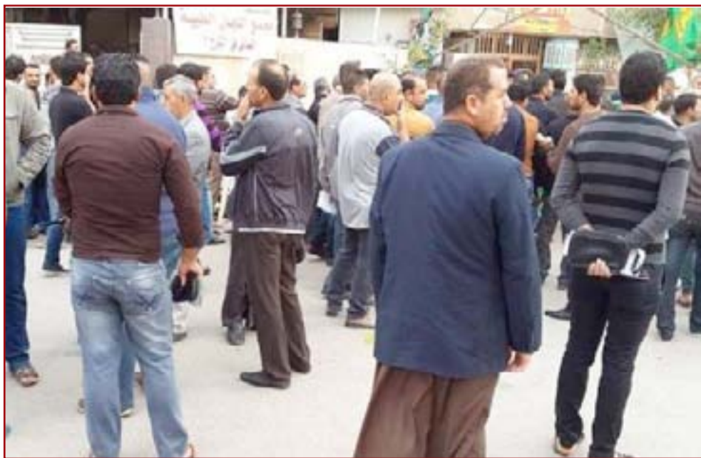
زحام على احد مراكز الفحص الطبي

ان المرور العامة سبق وان امهلت الطلبة الذين لا يمتلكون رخص السياقة إلى مراجعة منافذ المديرية لحين العطلة الربيعية.