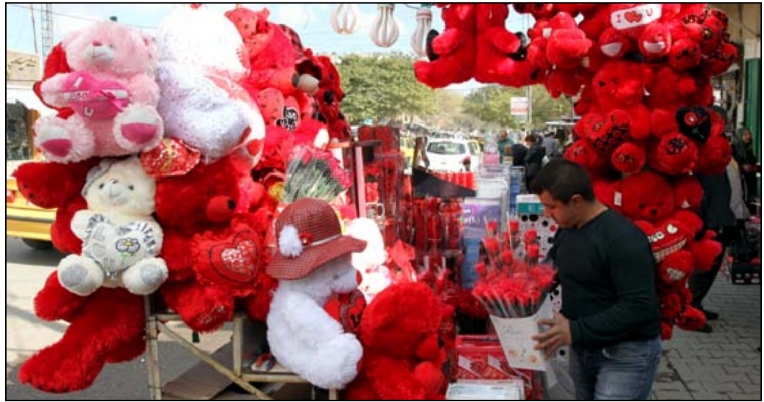
زيادة الاقبال على شراء الهدايا بمناسبة يوم (الفالتاين) برغم ارتفاع الاسعار..

العاب الزوراء تطلق آلاف البالونات في سماء بغداد احتفالاً بـ "الفالتاين"