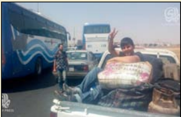
عدد من الأسر النازحة في طريق عودتهم إلى صلاح الدين.. أرشيف

سامراء، اللواء الركن عماد الزهيري، خلال المؤتمر، "أنا نخطط لاستكمال تحرير مناطق