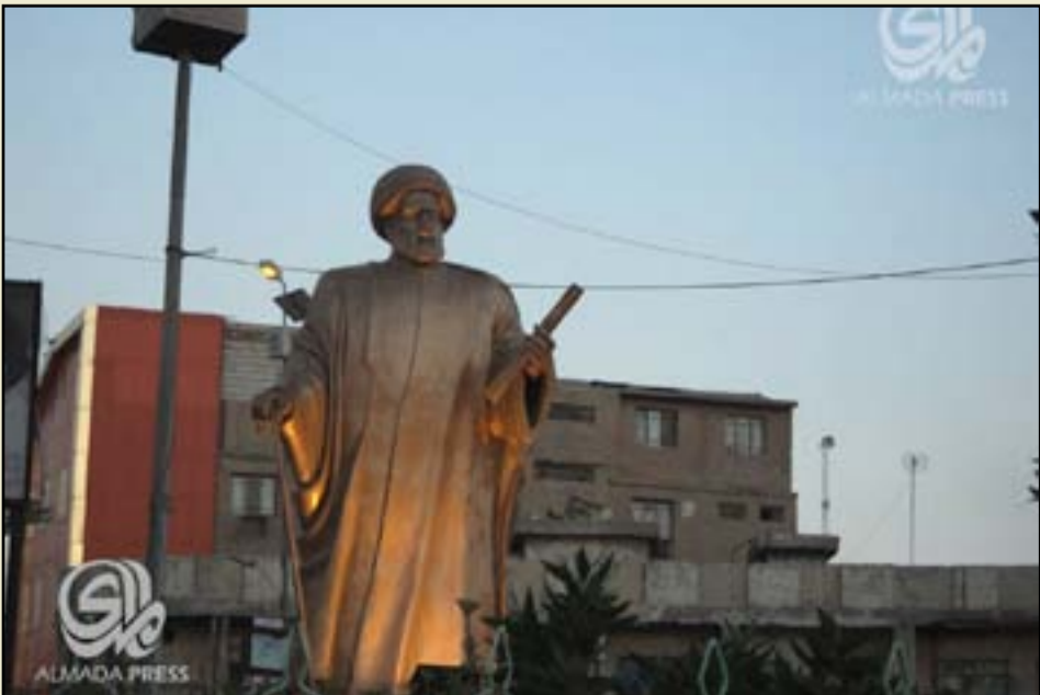
تمثال الجبوي وسط مدينة الناصرية

أكدت وزارة النقل، أمس الثلاثاء، ان "التكسي النهري بدأ بنقل الأشخاص من منطقة الربيع بالكربيعات الى الضفة الأخرى بالكاظمية مجاناً لمدة شهر كامل ابتداءً من يوم امس. وقالت الوزارة في بيان ان "زوارق التاكسي النهري باشرت بنقل المواطنين من منطقة الربيع بالكربيعات الى الضفة الاخرى في الكاظمية المقدسة بعد ازالة جسر المشاة الرابط بين الضفتين من قبل الموارد المائية وذلك بسبب ارتفاع منسوب المياه لنهر دجلة في محافظة بغداد". من جهة قال مدير ناحية الربيع ان "نقل المواطنين بين الضفتين سيكون بالمجان لمدة شهر كامل ابتداءً من يوم امس".