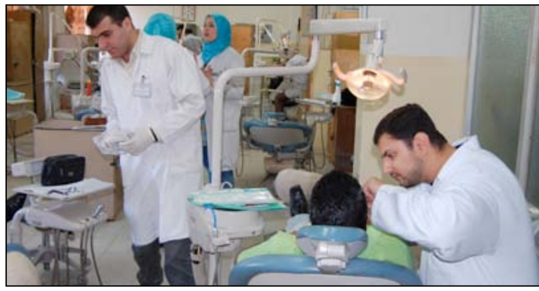
شباب يشكون ارتفاع اجور اطباء الاسنان... أرشيف