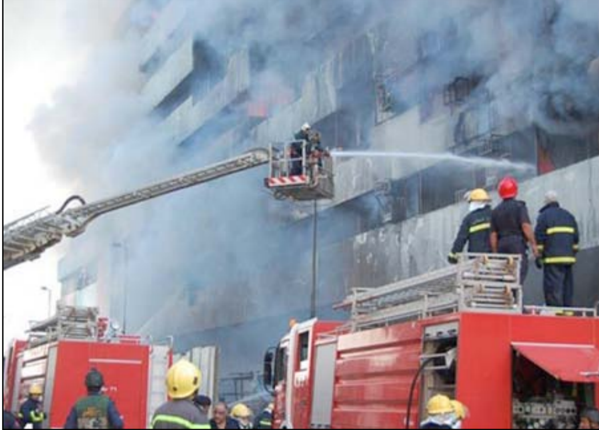
فرق الدفاع المدني تعالج حريق في منطقة الشورجة وسط العاصمة بغداد... أرشيف

أكدت وزارة الداخلية، أمس الثلاثاء، أن مديرية الدفاع المدني تشكل "الظهير الأساس، للقوات الامنية في محاربة الارهاب"، وفيما أشارت الى ان مزارع الدفاع تمكنت من حماية اكثر من 224 مليار دينار عراقي و 25 كيلوغراما من التلث والاحتراق في حوادث حرائق متفرقة، أكدت البدء باستخدام اجهزة حديثة لمعالجة الحوادث ذات الطابع الكيماوي والنووي.