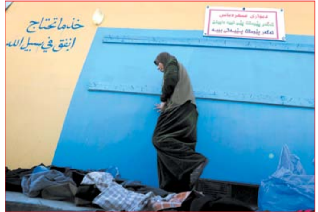
جدار الرحمة في اربيل لمساعدة المحتاجين.. ا.ف.ب