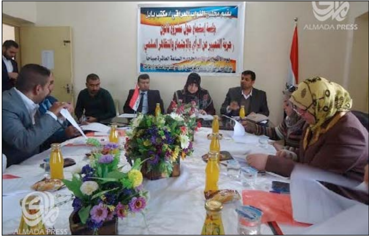
جلسة حوارية لبرلمانيين وناشطين مدنيين بشأن قانون التعبير عن الرأي وحق التظاهر

يُذكر ان مشروع قانون حرية التعبير عن الرأي والاجتماع والتظاهر، يضم خمسة فصول تتضمن سبع عشرة مادة، وتشرف خمس لجان برلمانية على اعداد القانون، وقد عرض الى القراءة الاولى في عام ٢٠١٤، والثانية في ٢٠١٥. وتم قراءته مرتين في عامي ٢٠١٤ و ٢٠١٥.