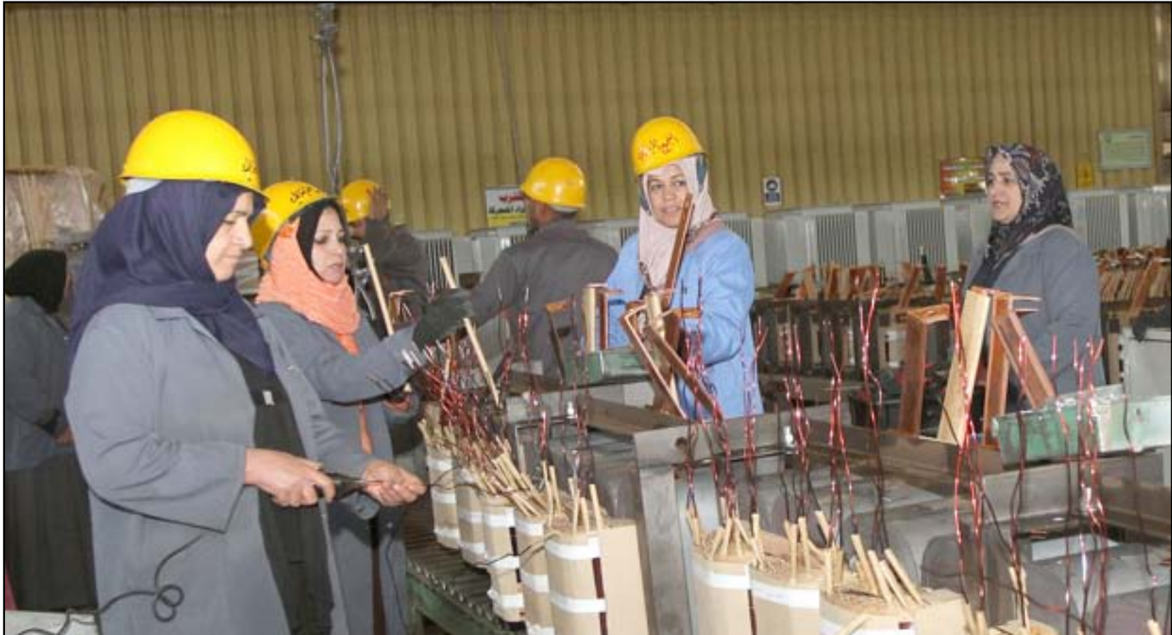
نساء يثبتن كفاءتهن في العمل الصناعي