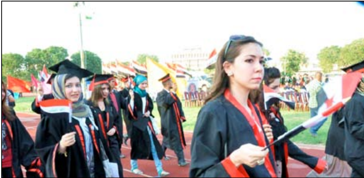
طالبات في حفل تخرج... هل يجدن فرص عمل ؟