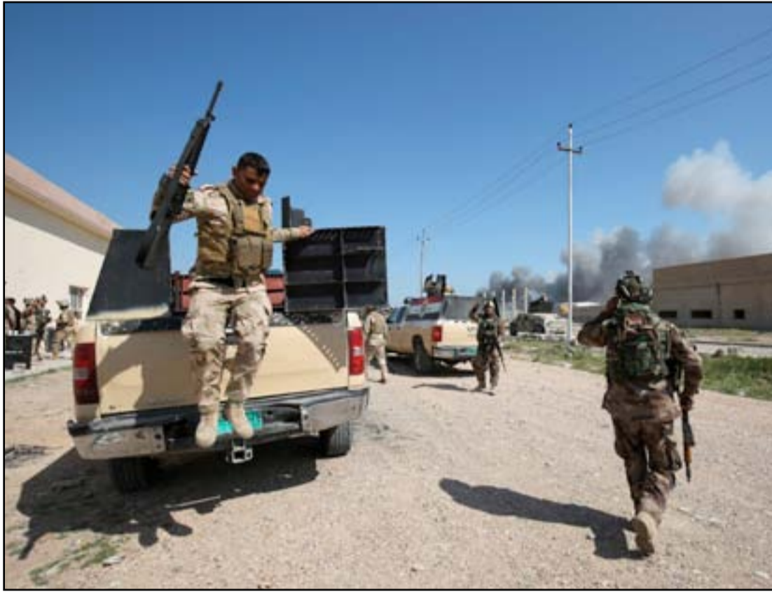
قوة أمنية في أبو غريب...أ.غ.ب.

مرت ١٠ أشهر على انطلاق عملية عسكرية لتحرير "الكرمة" من دون السيطرة على مركز المدينة او حتى منع المتسللين الى العاصمة بغداد، بحسب مسؤولين. وتمكن متسللون يقدر عددهم بـ ٤٠ شخصا، فجر الاحد، من اختراق منطقة ابو غريب قادمين من قرية الصبيحات، الواقعة الى الجنوب الشرقي من ناحية الكرمة. وقال بيان لفريق الاعلام الحربي، مطلع العام الحالي، ان "تيار الرسالي" بالتعاون مع قوات الجيش تمكن من تطهير منطقة الصبيحات من العصابات النافسة والوصول الي مشارف الفلوجة". لكن مسؤولاً محلياً في الفلوجة اكد ان "الصبيحات مازالت بيد داعش وان القوات المتشاركة لم تحرر سوى بعض القرى في الاطراف".