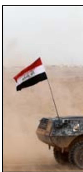
اليات عسكرية قرب خط الالين.

الجوية وطيران الجيش، مؤكداً أن "القطعات حققت تقدماً سريعاً في عمدة محاور الهجوم، واندفعت عدة كيلومترات في عمق العدو". بدوره، أفاد مصدر في قيادة العمليات المشتركة، بأن القوات المشتركة تمكنت من تحرير قريتين غربي سامراء خلال عمليات "أمن الجزيرة". وقال المصدر في حديث الى (المدى برس)، إن "القوات المشتركة من عمليات سامراء والحشد الشعبي