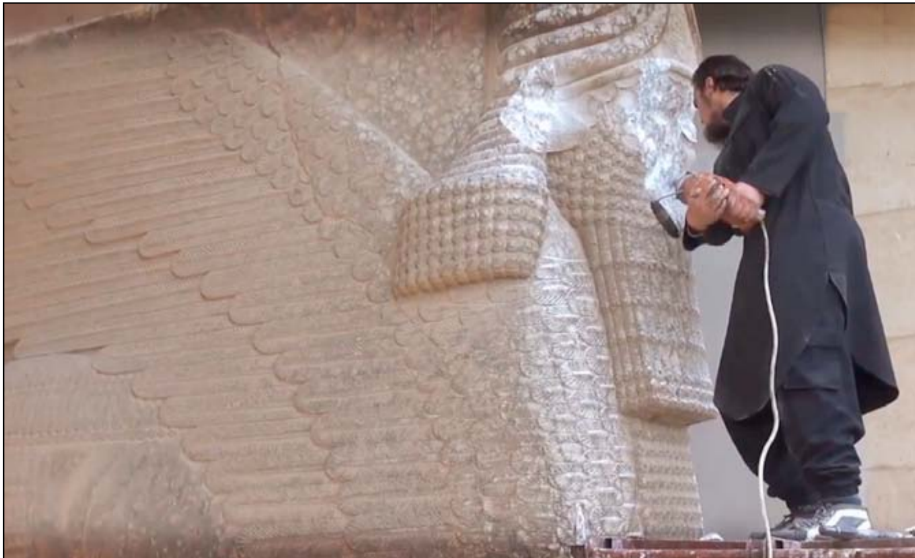
عنصر من داعش أثناء تدميره آثار الموصل

المواد غير المشروعة تصل الى مشترين في أوروبا والولايات المتحدة". بعض جامعي التحف قد يُجرون هذا بأنهم "يحتفظون" بالآثار المسروقة من سوريا والعراق لأن داعش دمّرت الكثير من المواقع التاريخية القديمة ذات الأهمية الكبيرة. ويقول التقرير "هذا التبرير مثير للسخرية لأن رفع الآثار من مواقعها التاريخية القديمة ونقلها الى حيازات خاصة من دون دراسة أثرية سليمة، لا يُسهم بشيء في السجل التاريخي". من جانبهم اقترح المشروعون الأميركيين