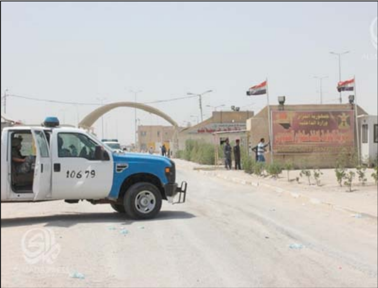
منفذ سفوان الحدودي