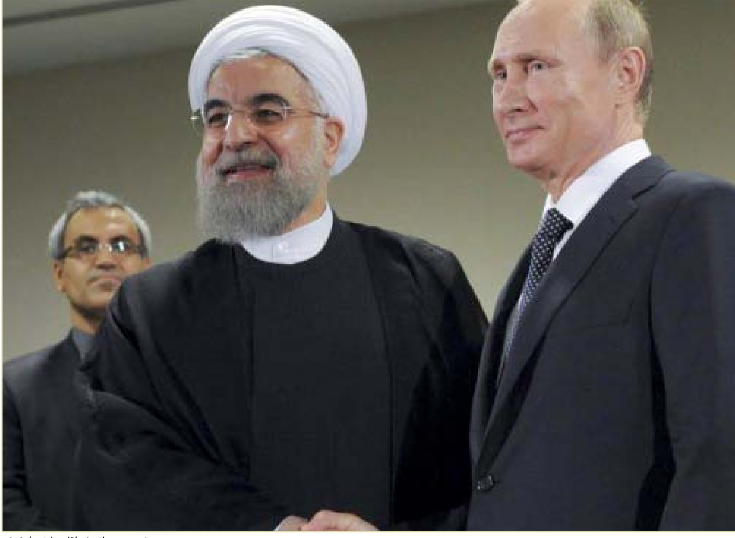
بوتين مع روحاني في لقاء سابق.. أرشيف