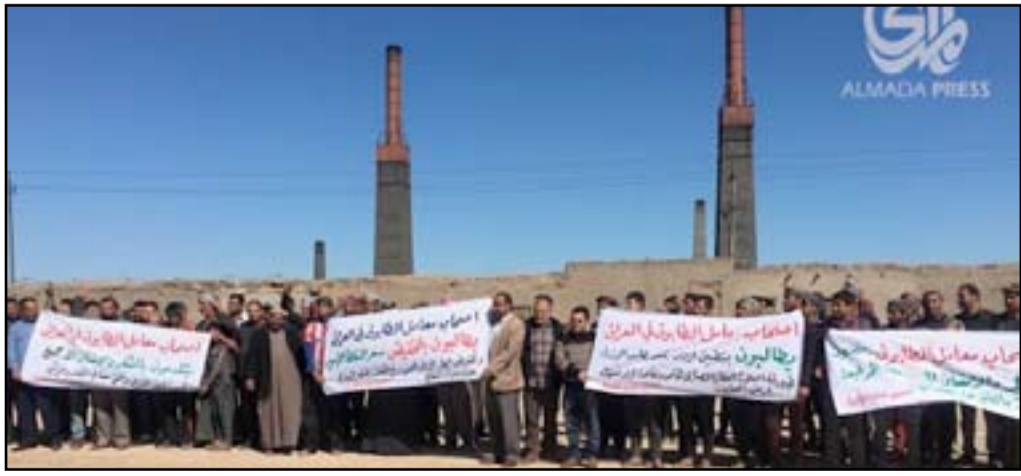
تظاهرة اصحاب معامل الطابوق في منطقة النهروان

وكانت لجنة الاقتصاد والاستثمار النيابية دعت، يوم الأحد (7 من شباط 2016)، إلى تخفيض سعر النفط الأسود المباع لمعامل الطابوق وإصدار قرارات لدعم تلك المعامل، فيما أكدت أن أكثر من نصف مليون شخص يعتمدون على تلك المعامل لتأمين معيشتهم. يذكر أن أسعار الطابوق قد شهدت تراجعاً كبيراً خلال الأشهر الأخيرة نتيجة توقف معظم المشاريع الحكومية بسبب الأزمة المالية التي تمر بها البلاد التي انعكست سلباً على مجمل المفاصل والقطاعات الاقتصادية.