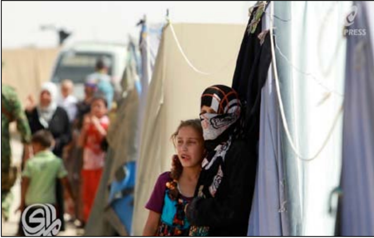
عوائل نازحة من مدينة الرمادي يسكنون بمخيمات في ناحية عامرية الفلوجة جنوبي الفلوجة

أعلنت بعثة الأمم المتحدة في العراق (يونامي)، أمس الاثنين، أن النساء يشكلن نسبة 51% من عدد النازحين في العراق، وفيما أشارت الى وجود ١,٦ مليون أرملة، طالبت رابطة للدفاع عن المرأة العراقية بالاعتراف بدورها كـ "شريك أساس" بعملية بناء الأمن والسلام والإسراع بإقرار قانون العنف الأسري.