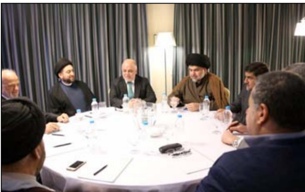
قادة التحالف الوطني في اجتماع كربلاء

وأضاف رهيف لـ"المدى" "هناك مشكلة في عدم التوصل إلى آلية مناسبة لاختيار حكومة تكنوقراط، ما أثار خلافاً حاداً بين مكونات التحالف الوطني".