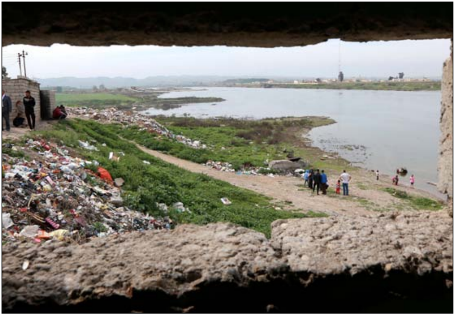
أهالي بلدة (وامة) يقفون على ضفاف نهر دجلة.. أ ف ب

تتنازع مشاعر القلق والتشكيك أهالي بلدة وامة الواقعة على منحدر سد الموصل، إزاء تقارير تتحدث عن احتمال انهيار السد بشكل مفاجئ ما قد يؤدي الى غرق بلدتهم بالكامل خلال دقائق.