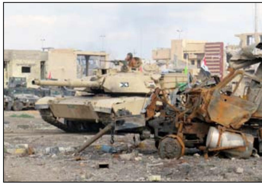
مدرعة عسكرية وسط الرمادي

المسح التقني ورفع وتفكيك المخلفات الحربية، بعد أن تم رفع الانتقاض والمسح المرئي لهذه المخلفات، من قبل فرق المقر المسيطر والفعاليات المجتمعية ومنطوي العشائر، وتفكيك الممكن من العبوات الناسفة والمواد غير المنفجرة". وأضاف الراوي ان "حكومة الأنبار المحلية استعانت بالجهود المحلية والدولية بالتنسيق مع الحكومة المركزية، لإنجاز المسح المرئي والتقني للمخلفات الحربية والمواد غير المنفجرة، لتمضي بعدها قداما ويجهد مضاعفة في تنظيم عودة أمنة وعاجلة للنازحين".