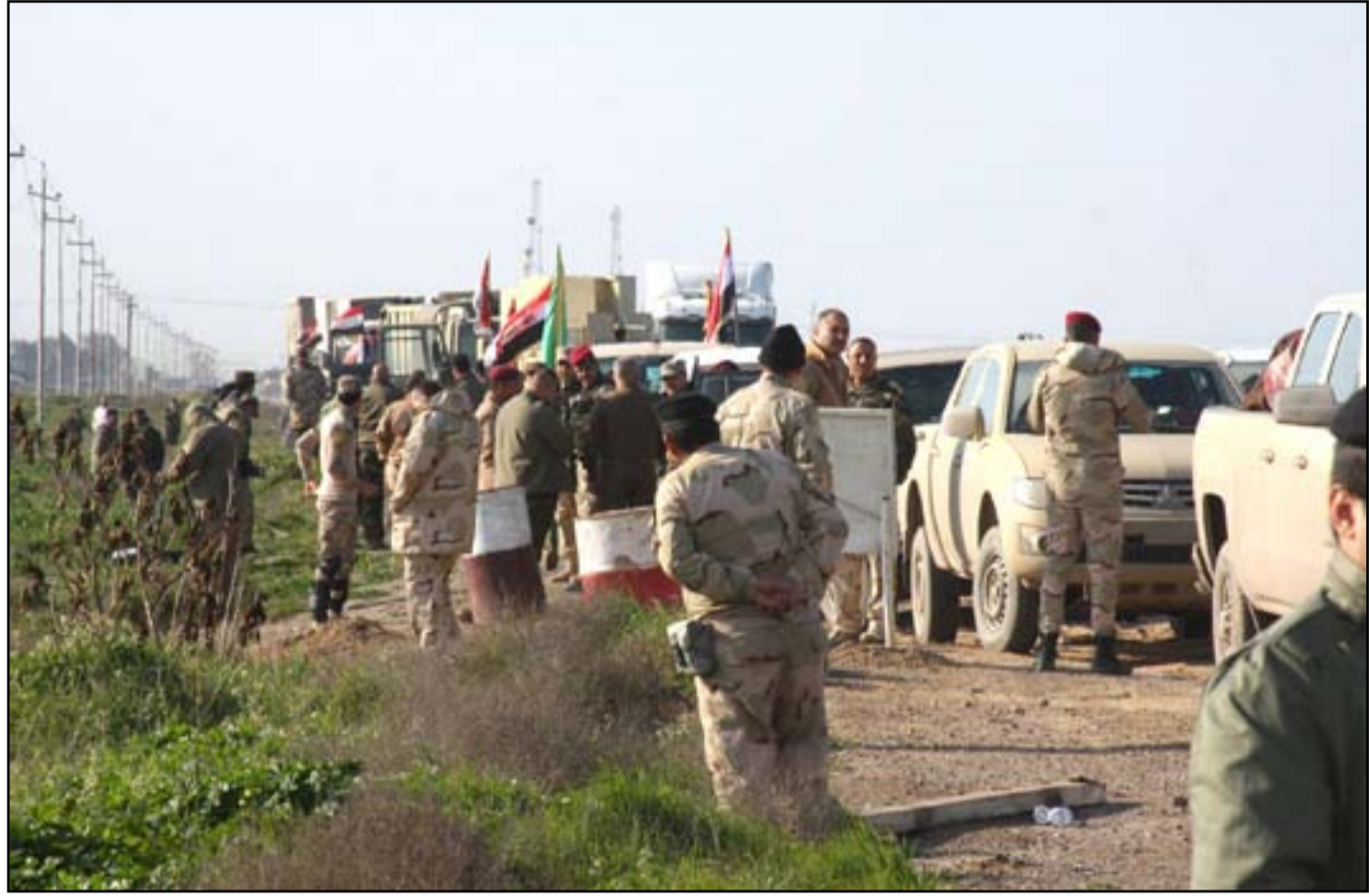
قوة عسكرية متجهة الى الموصل