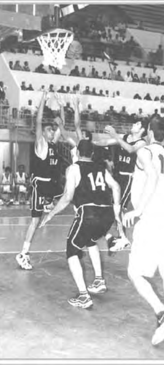
سلة الكهرياء القادمة الى الدرجة الاولى