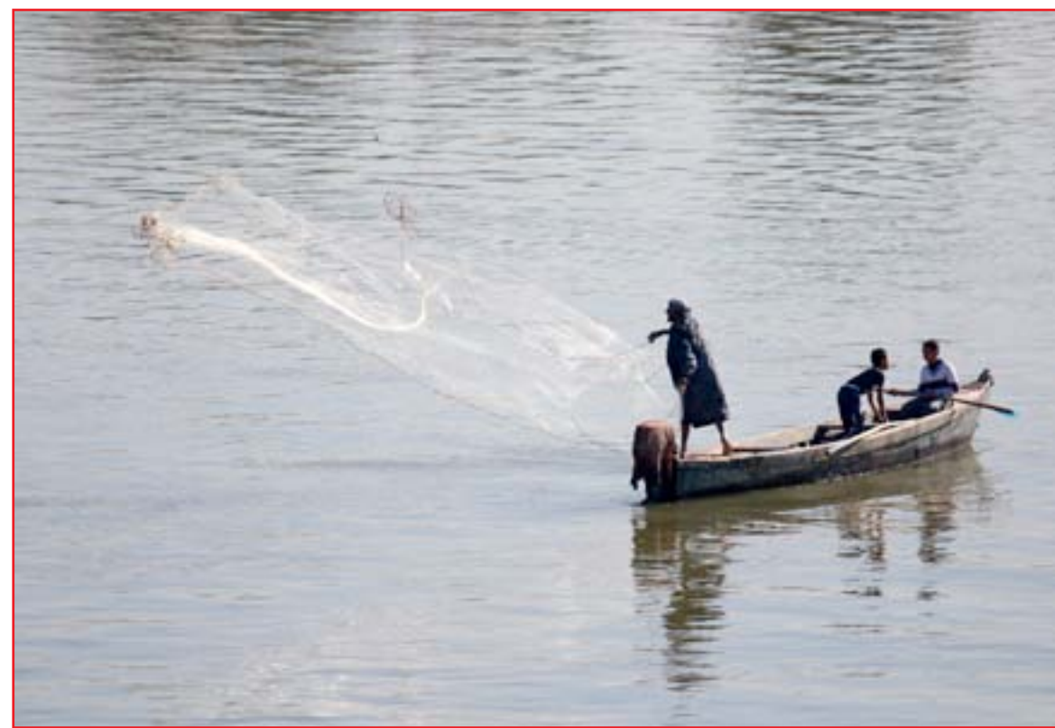
صيداء بصراوي يرمي شبكها في شط العرب