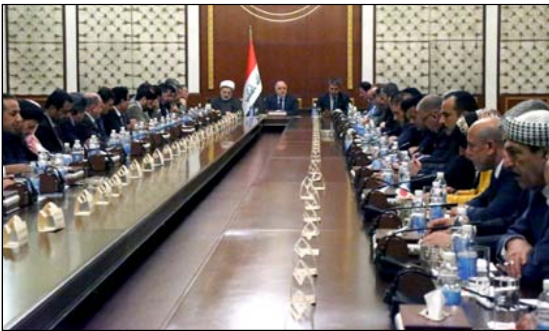
اجتماع العبدي برؤساء الكتل السياسية. أ.رشيف.