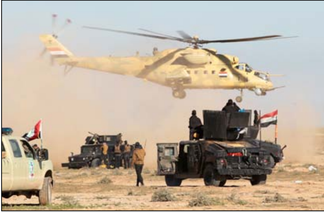
قوة عسكرية في الرمادي

وأضاف وارن أن "العدد الإجمالي لعناصر تنظيم داعش في العراق وسوريا ما بين 19 إلى 24 ألف عنصر"، مؤكداً أنه "تم قتل 10 آلاف عنصر من التنظيم خلال المعارك". وكشف المسؤول الأميركي إن "قوات التحالف الدولي دربت 20 ألفاً من عناصر القوات الأمنية العراقية وقدمت لهم المهارات والمعدات"، مبيناً أن "هذه القوات حصلت على تدريبات متنوعة من اقتحام المباني والتدريبات القتالية الأخرى". وأضاف أن "مدربين عراقيين ومستشارين من هولندا وإسبانيا وفرنسا والولايات المتحدة شاركوا بعمليات التدريب". إلى ذلك، نكر المتحدث باسم التحالف الدولي إن "تنظيم داعش يسعى للحصول على أسلحة كيميائية ولكن نحن لا نعتقد انه تم الحصول عليها"، مبيناً أن "الأسلحة التي حصل عليها التنظيم هي كلورين وهي مادة صناعية ممكن الحصول عليها والخردل وهو عامل يمكن أن يسبب إصابات مؤلمة في الجلد لكن احتمالية موت الإنسان في الغاز قليلة". وأشار وارن إلى "الحصول على معلومات مهمة جداً من أمير داعش الخاص بالأسلحة الكيميائية يدعى ابو داود وهو الآن في عهدة العراقيين وسلمناه الى حكومة كردستان الأسبوع الماضي"، مؤكداً أنه "تم تقليص قدرات تنظيم داعش بتصنيع أسلحة كيميائية جديدة من خلال ضرب مقر تصنيع الأسلحة ونحن مستمرين في ضرب تلك المآثر".