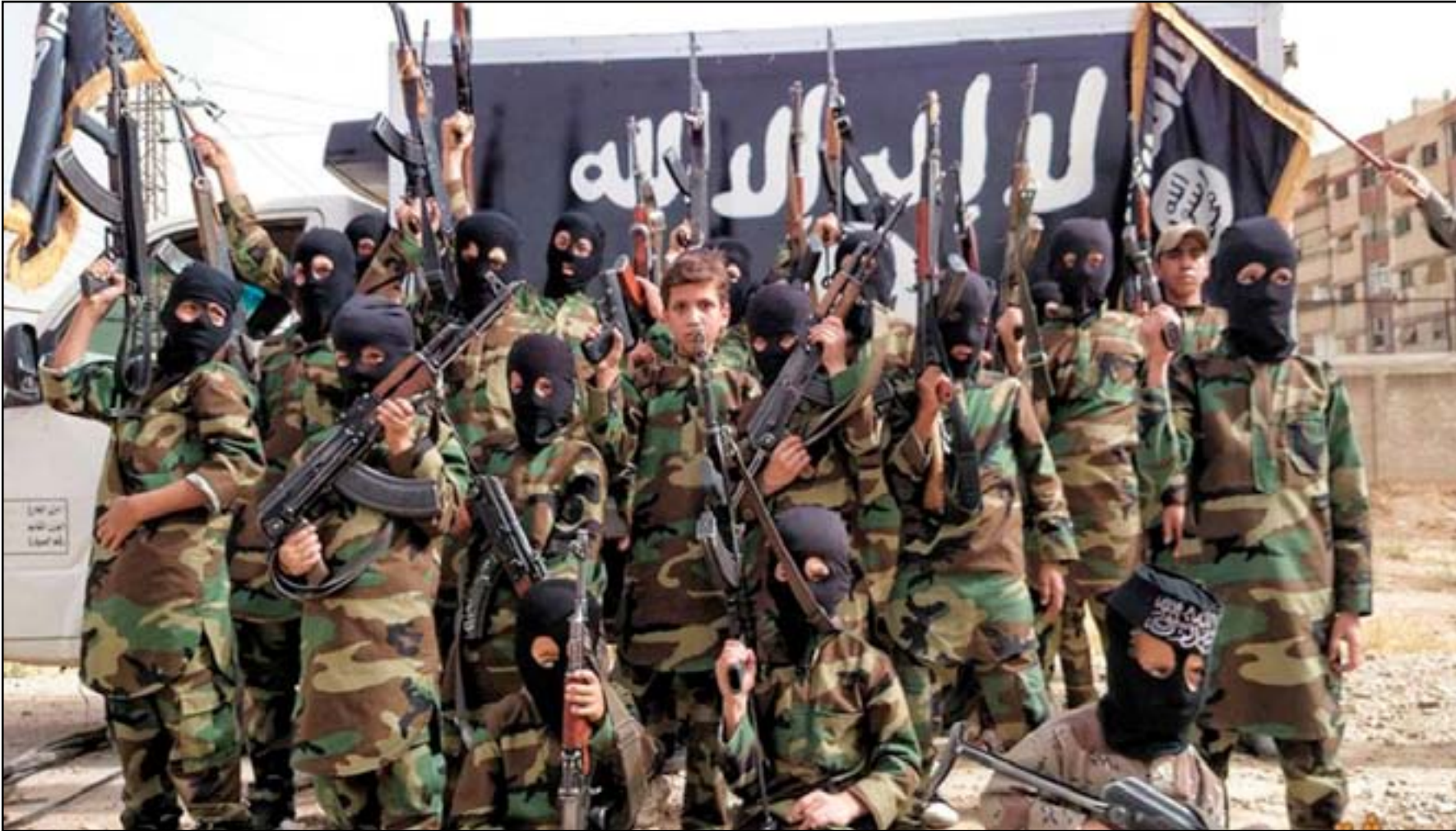
أطفال في معسكر لداعش

صوت المشرعون الأميركيون الاثنين على تصنيف الفظائع التي ارتكبتها تنظيم داعش في سوريا والعراق في خانة "الإبادة"، داعين إلى إنشاء محكمة دولية مكلفة بالتحقيق في جرائم الحرب في النزاع السوري، بحسب وكالة فرانس برس. وأقر مجلس النواب الأميركي بالإجماع قراراً غير ملزم بهدف الضغط على إدارة الرئيس باراك أوباما لتسمية هجمات تنظيم داعش ضد المسيحيين والأيزيديين وغيرهم من الأقليات بـ "جرائم حرب"، وجرائم ضد الإنسانية وإبادة"، وهو ما ترفضه وزارة الخارجية حتى الآن. ويطلب قرار ثانٍ حظي بتأييد 392 صوتاً في مقابل ثلاثة أصوات معارضة، البيت الأبيض بمطالبة مجلس الأمن التابع للأمم المتحدة بإنشاء فوراً محكمة مكلفة بالتحقيق في جرائم الحرب المرتكبة في النزاع السوري، واصفا ارتكابات الحكومة السورية، من بين أمور أخرى، بـ "الانتهاكات الخطيرة للقانون الدولي والتي ترقى إلى مستوى جرائم حرب وجرائم ضد الإنسانية". وقال رئيس مجلس النواب الجمهوري بول راين إن "ما يحدث في العراق وسوريا هو استهداف متعمد، وممنهج للأقليات العربية والدينية". وقد منح الكونغرس وزارة الخارجية حتى الخميس لاتخاذ قرارها حيال تصنيف "الإبادة". وقال المتحدث باسم وزارة الخارجية، جون كيري الاثنين إن وزير الخارجية الأميركي جون كيري