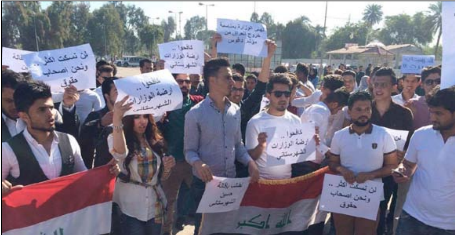
مجموعة من الطلبة أثناء إحدى التظاهرات.. اريشيف

الموبايلات وعدم محاسبة المخالفين للزي الموحد، مشيراً الى أن هذه حلول ترقيعية تحاول