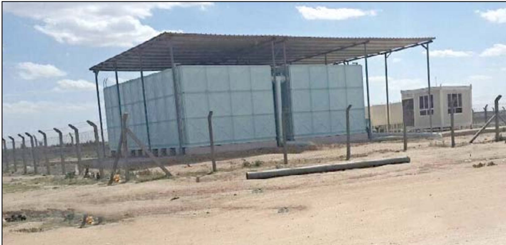
محطة مياه تكفي المخيم متروكة بدون تشغيل فعلي

الحكومة سواء كانت مادية أو غذائية. منوها: الى ان الحكومة المحلية رفعت يدها عن المخيم وسحبت كل موظفيها بسبب عدم استطاعتها توفير سيارة نقل لهم. لافتا: انها تركت إدارة المخيم إلى دائرة الهجرة والمهجرين التي لم تقدم شيئا الى الآن.