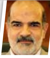
اقترحنا تشكيل البرلمان والغاء المجالس المحلية

وأوضح عضو دولة القانون "لدينا تجربة مريرة مع الاعتصامات التي حصلت في الرمادي، ونتخوف من أن يكون هناك مندسون مع المعتمدين فيحدث أمر لا تحمد عقباه". وأضاف "الاعتصام المفتوح سيربك الشارع ويزيد الأمر تعقيداً ويهدد الأمن الداخلي، لذلك نطالب الجميع بالتفكير والاحتكام إلى الدستور والابتعاد عن المواقف المتشجبة كونها لا تخمد إلا دأش والذين يحاولون ضرب العملية السياسية".