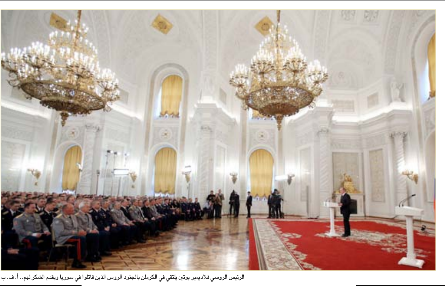
الرئيس الروسي فلاديمير بوتين يلتقي في الكرملن بالجنود الروس الذين قاتلوا في سوريا ويقدم الشكر لهم...

وصل مبعوث الأمم المتحدة الى اليمن اسماعيل ولد الشيخ احمد الى العاصمة صنعاء التي يسيطر عليها الحوثيون، بعد محادثات أجراها في الرياض مع الرئيس عبد ربه منصور هادي في شأن إعادة اطلاق مساعي السلام. وكان في استقبال الشيخ احمد ممثل عن وزارة الشؤون الخارجية التابعة للحوثيين علي حجار، ومدير مطار صنعاء خالد الشنايف. ولم يدل المبعوث الأمامي بأي تصريح، فيما برنامج زيارته الى صنعاء غير معروف. وبحث الشيخ احمد مع هادي الجمعة في الرياض "الجهود الهادفة الى إعادة السلام الى اليمن"، وفق ما أفادت وكالة الأنباء (سبأ)، ونقلت عن هادي أن "كل الأبواب مفتوحة للتوصل الى السلام على اساس قرارات مجلس الأمن". وتلزم قرارات مجلس الأمن، خصوصا منها القرار 2216، المتفردين بالانسحاب من الأراضي الواسعة التي استولوا عليها منذ أكثر من عام خصوصا من صنعاء، وإعادة الأسلحة التي استولوا عليها من الجيش.