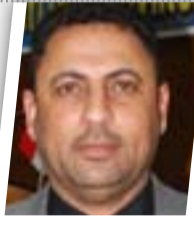
تجربتنا مريرة مع الاعتصامات في الرمادي

أكد النائب عن كتلة الاحرار النيابية ماجد الغراوي أن هناك لجاناً فنية مختصة تعمل على تنسيق التظاهرات والاعتصامات لضمان عدم تسببها أو اختراقها أو خروجها عن المطالب المشروعة. وقال الغراوي إن "بعض الساسة الفاسدين في الكتل السياسية المتنفذة يحاولون تسويق قضية المطالب المشروعة للمتظاهرين وربطها بما حصل سابقاً من أحداث في اعتصامات المحافظات الغربية". وأضاف عضو كتلة الاحرار أن التظاهرات سلمية وهناك متابعة وضبط لها وهي افران ونتاج لمطالبات شعبية أيدتها المرجعية وتحدثت بها رئيس الوزراء حيدر العبادي وقدمها في ورقته الأولى بالإصلاح. وأوضح الغراوي أن "المطالب التي تقدم بها زعيم التيار الصدري السيد مقتدى الصدر لا تختص بكتلة أو مكون أو طرف بل هي مطالب لكل العراقيين وتعبر عن حاجاتهم وحقوقهم".