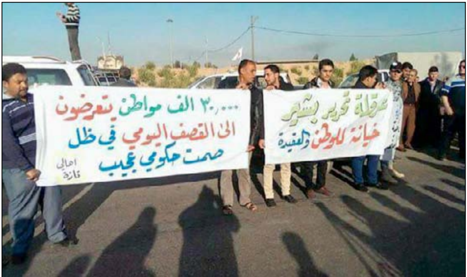
تظاهرة لاهالي تازة.. أرشيف