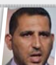
1400 من أهالي الأنبار معتقلون في جرف الصخر