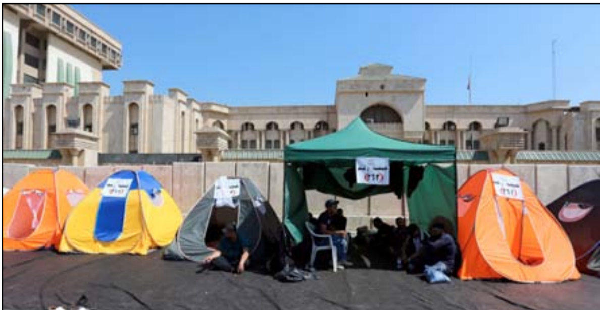
معتصمون قرب المنطقة الخضراء... أ.ف.ب

كانت اشبه بالكرنفال الذي ضم اشخاصاً من قوميات وديانات ومذاهب مختلفة، مشيراً إلى أن "روح التعاون كانت سائدة بين المعتصمين والقوات الأمنية والجهات المنظمة".