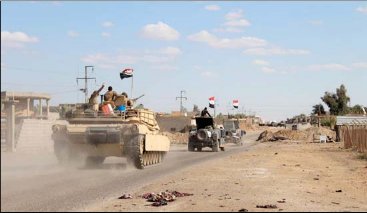
رتل عسكري في ناحية الحمدي.. أ.غ.ب.

عمليات تحرير نينوى في مخمور مؤتمراً ولم يتعرض إلى أي هجوم. في غضون ذلك، أفاد مصدر أمني في محافظة نينوى، أمس السبت، بأن ٨٠ عنصراً من تنظيم داعش قتلوا بثلاث ضربات جوية لطيران التحالف الدولي، استهدفت مواقع التنظيم في مناطق متفرقة من مدينة الموصل.. وقال المصدر في حديث إلى (المدى برس)، إن "طائرات التحالف الدولي، استهدفت مواقع التنظيم في مناطق داخل الحرم الجامعي لجامعة الموصل، وسط المدينة، فيما قصفت موقعا للتنظيم بمعسكر الغزلاني، غربي مدينة الموصل"، مشيراً إلى أن "قصف الموقعين أدى إلى