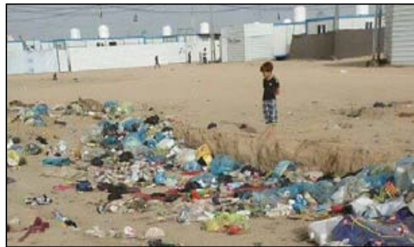
النايات احد اسباب المرض