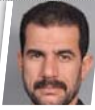
الاعتصامات "منسقة" ولن تخرج عن المطالب المشروعة

تحت عنوان "داعش يتعرض للعزلة والانهايار"، أوردت (صحيفة ميرور) تقريراً لمحللين خبراء ان الضربات الجوية قطعت الكثير من العائدات النفطية غير المشروعة لتنظيم داعش، ما تركه معزولاً ومنتهاراً بعد خسارته الأراضي والموارد المالية الحيوية.