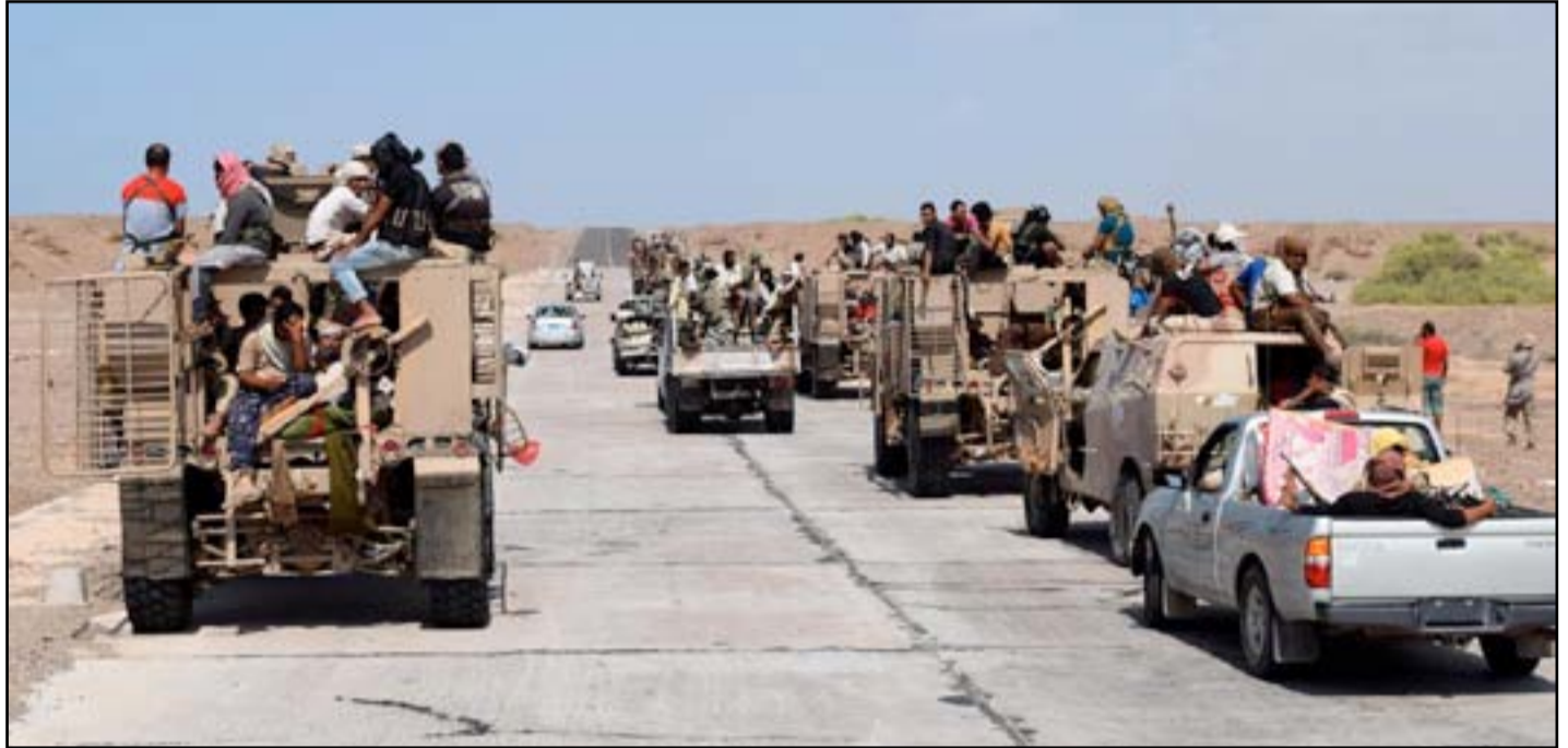
الجيش ومقاتلو العشائر قرب الرمادي.. أرشيف

طالبت النائبة عن ائتلاف دولة القانون عالية نصيف رئيس الوزراء حيدر العبادي بإجراء تغيير حكومي شامل دون الرجوع إلى الكتل السياسية. وقالت نصيف ان بإمكان العبادي "الأخذ بزمام المبادرة وإجراء التغيير الوزاري دون الرجوع إلى الكتل السياسية ودون استشارتها". وأضافت عضو دولة القانون "من هنا عليه أن لا يتحجج بعدم موافقة الكتل السياسية التي لا ترغب بالحاق الضرر بمصالحها وبالتالي اللعب على عامل الوقت، فالعبادي اليوم هو وحده المسؤول أمام الشعب العراقي عن إجراء التغيير". وتابعت نصيف، أن خطة الإصلاحات التي يضعها العبادي يجب أن تمثل الرأي العام وأن تشمل على التغيير الوزاري أولاً وعلى مشروع يبي تلغات الجماهير ثانياً وليس المجيء بمشروع مستنسخ من دولة أخرى كوثيقة الإصلاح التي أعلن عنها مؤخراً، مشددة على "أهمية عدم تباطف العبادي في إجراء التغيير الشامل لوزرائه".