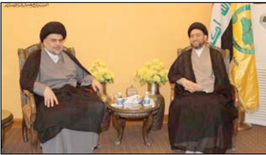
لقاء الصدر والحكيم... أرشيف.

يضرِب المعتصمين" ويقول التيار الصدري بأن "الاعتصامات" نصب في مصلحة رئيس الوزراء، معتبراً أنها "فرصة" أمام الأخير للمضي بالإصلاحات وكسب تعاطف الشارع. ويؤكد الكفائي أن "المعتصمين سيضغطون على العبادي لتحقيق الإصلاحات".