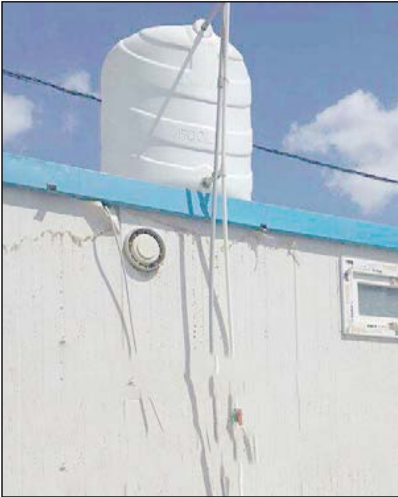
خزان ماء بهذا الحجم لـ١٢ يوماً وربما أكثر؟