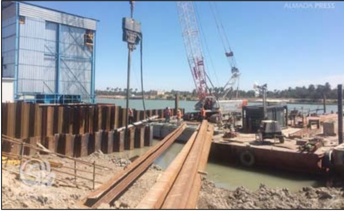
جانب من مشروع ماء البصرة الكبير

مياه شط العرب لتصل نسبتها لمعدل ٢٥٪. وأضاف الاستشاري أن التعديلات تضمنت إدخال مواصفات جديدة لمحطات التصفية وكذلك الأغشية و(الفلتر) لتكون مناسبة لمياه شط العرب في حال ارتفاع نسبة الأملاح فيه. ويضمن مشروع ماء البصرة الذي يقع شمالي ضفاف شط العرب في ناحية الهارثة، إنشاء محطة تصفية بطاقة ٣٣٤ ألف متر مكعب ومحطة سحب وإطى بطاقة ٥٦٠ ألف متر مكعب ومحطة سحب وإطى ومحطة تحلية عملاقة بطاقة ٢٠٠ ألف متر مكعب ومحطة كهرباء بطاقة ٥٠ ميغا واط، بكلفة تقدر بنحو ٢٠٠ مليون دولار بتمويل مشترك من قبل الحكومتين اليابانية والعراقية.