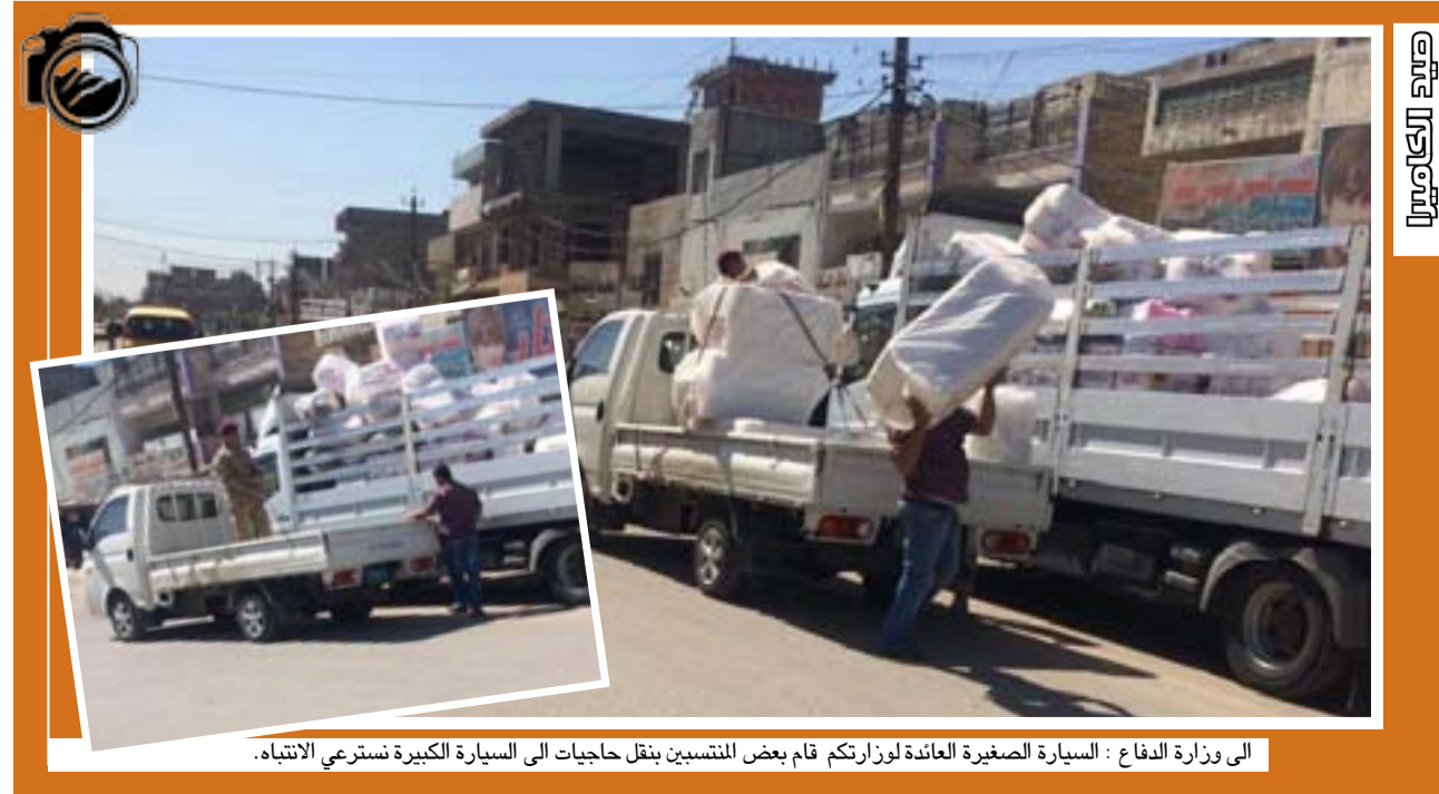
الى وزارة الدفاع : السيارة الصغيرة العائدة لوزارتكم قام بعض المنتسبين بنقل حاجيات الى السيارة الكبيرة نستري الانتباه.