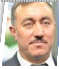
مرشحو العبادي قريبا من حزب الدعوة