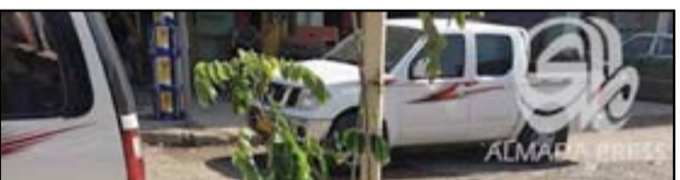
إدارة قضاء بدرة في واسط تطلق حملة لزراعة ١٢ ألف شتلة في الحدائق والمنتزهات والأماكن العامة