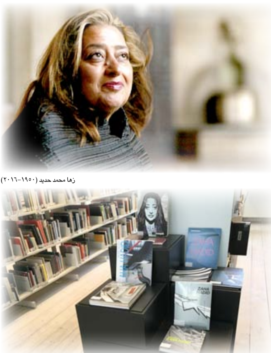
احتفاء مدرسة العمارة في كوبنهاغن/ الدانمارك لذكرى زها حديد

– بأن زها معنية اساساً في تشكيل وترتيب الشكل الخارجي لمبناها، أكثر بكثير من الاهتمام في الداخل. لكنها تجيب عن هكذا تساؤل طرحه عليها الناقد الياباني "يوشيو فوناغاوا" Y. Futagawa بأن هذا ليس اسلوبها في التصميم؛ >>... اننا هنا في المكتب لا نقوم على استيلاء تصاميم، انطلاقا من اقتصرها على الشكل الخارجي فقط. نحن نهتم دوما في ايجاد عمارة تراعي جميع متطلبات العملية التصميمية في أن واحد...< (Document، ٩٩، Tokyo، Sept، ٢٠٠٧، p.٩٠). وتضيف العمارة في مكان آخر من المقابلة اياها >>... بالتاكيد، ثمة مصممون يستخدمون الكمبيوتر لتوليد الاشكال، لكن بالنسبة لي فهو لا يساعدي في خلق الافكار، انه محض اداة، اداة تسهم في تكوين فهم عميق للأشكال... وهذا الفهم العميق للأشكال، يظل عرضه ووصولا الأخر للتغيير والتطوير وصولا الى الاحساس بالثقافة في