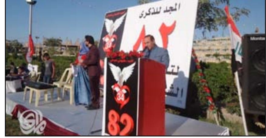
شيوخو بابل يحتفلون بالذكرى ٨٢ لتأسيس حزبهم

بالحياة والأمل والمحبة والتطور، مبيناً أن "الحزب رفع شعار "وطن حر وشعب سعيد" وكافح ضد الظلم وحارب الفساد المستشري في مفاصل الدولة، كي يؤمن حياة كريمة للعراقيين أصحاب أكبر منجم للفكر والحضارة". وقد تضمن الاحتفال كلمة محلية للحزب الشيوعي، وإلقاء مجموعة قصائد للشاعر موفق محمد، وكلمات للرفاق القدماء وفعاليات أخرى متنوعة.