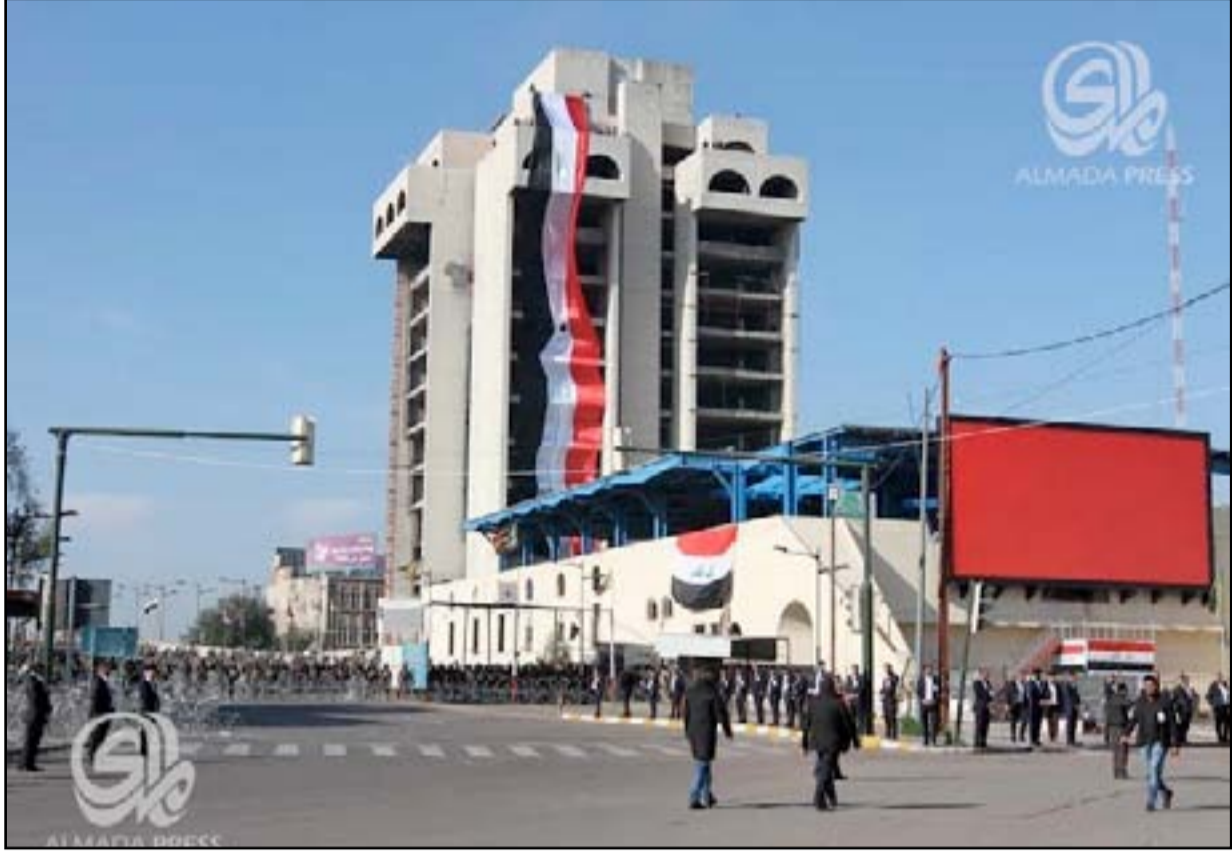
جسر الجمهورية، وسط بغداد، ويبدو مغلقة أمام حركة المرور

وقال مراسل (المدى برس) إن العشرات من موظفي العقود في مديرية توزيع كهرباء محافظة كركوك خرجوا، صباح أمس، في تظاهرة أمام مبنى دائرة التوزيع في منطقة حيّ تسعين، وسط المدينة، للمطالبة بصرف مستحقّاتهم المالية المتوقّفة. وأضاف المراسل أن المتظاهرين دعوا إلى تديبتهم على الملاك الدائم للمديرية لكونهم يعملون بصفة عقود منذ أكثر من ثماني سنوات. وكان وزير الكهرباء قاسم محمد الفهداوي أعلن في (١٠ كانون الثاني ٢٠١٥) عن حاجة الوزارة إلى دعم "حكومي ودولي" لإعادة إعمار البنى التحتية التي تعرضت