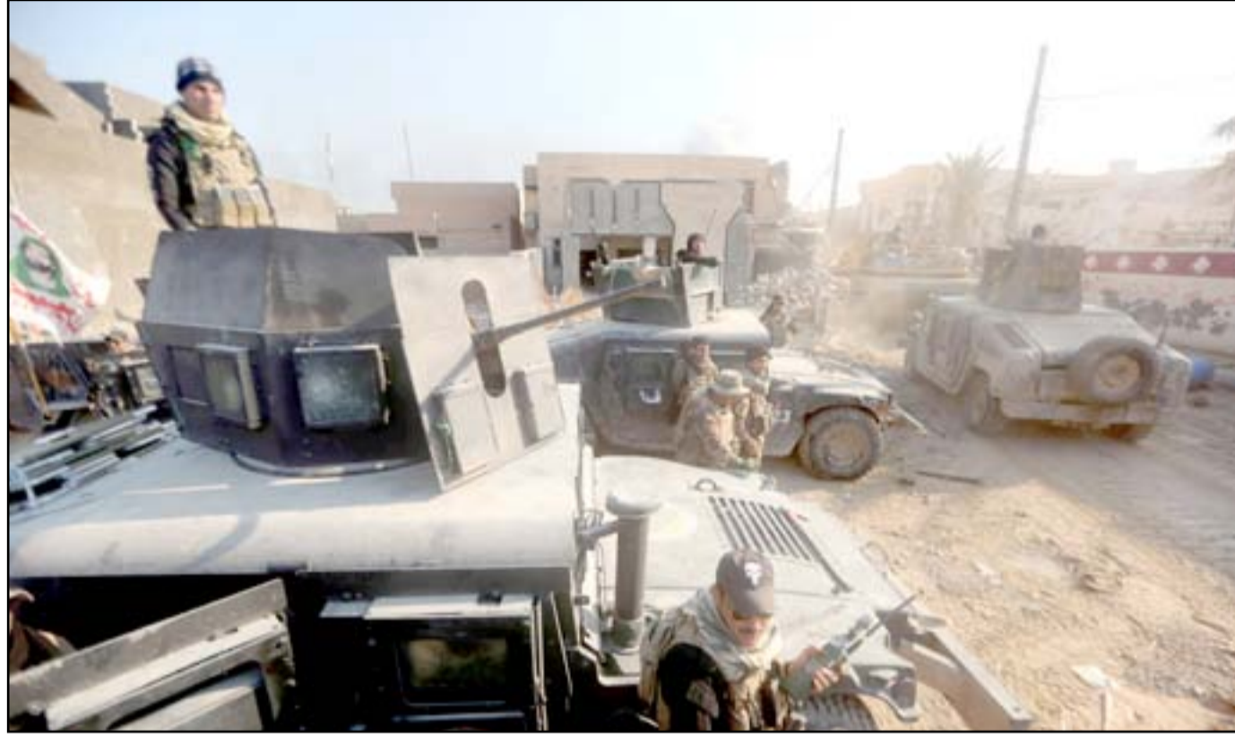
قوة أمنية وسط الرمادي..أ.ف.ب.

وأشارت القيادة الى أن "من بين القتلى الإرهابي أبو سليمان الشيشاني او ما يسمى بمسؤول كتيبة الخرساني، والإرهابي شيخ جمال طرقي العيساوي (أبو عبدالعزيز الجنوبي) هارب من سجن ابو غريب عمل مع (ابو ايوب المصري) وأحد المقربين من الإرهابي ابو بكر البغدادي، والإرهابي ضياء زويج الحرداني الذي تسلم ما يسمى ولاية الفرات بشكل مؤقت وهو مسؤول عن عمليات ارهابية كثيرة، والإرهابي ابو احمد الجنوبي وهو ضابط سابق في الجيش السابق رتبة رائد وهو هارب من سجن ابو غريب ويعمل كناقل للبريد الى العدناني وابو بكر البغدادي. وتابعت القيادة أن من "بين القتلى الإرهابي عبد الباسط الجميلي الملقب (ابو حذيفة) أحد مسؤولي