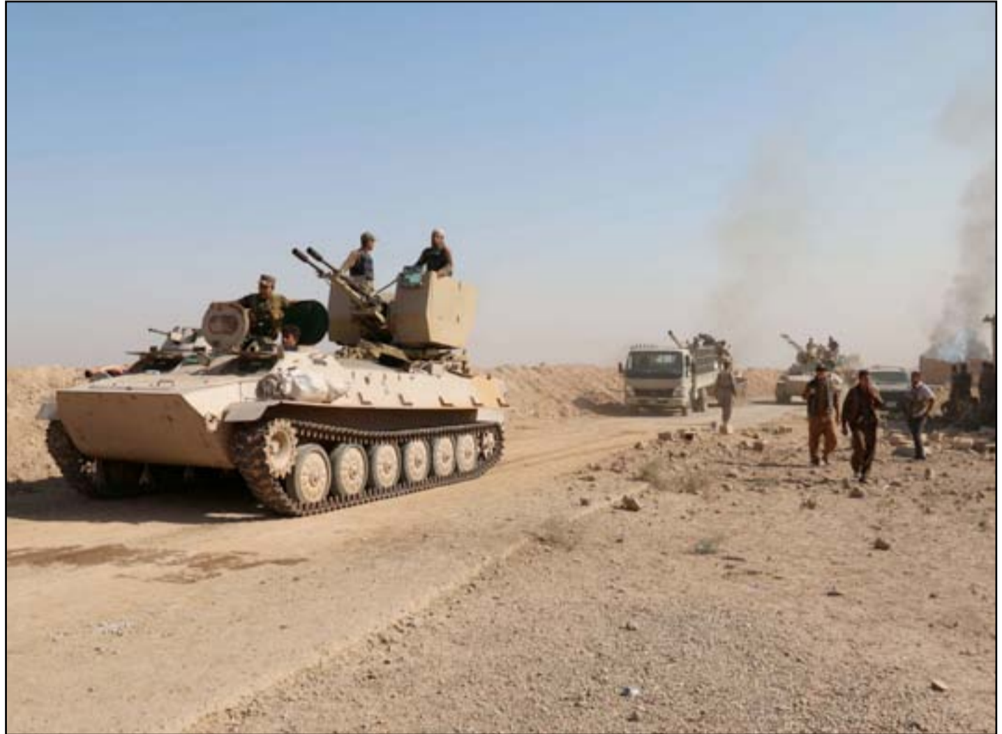
قوة عسكرية شمالي الرمادي

وادي الفرات باتجاه مدينة هيت بعد ان سيطر على أكثر من ٢٥ ميلاً من الأراضي خلال الأسبوع الماضي. وفي شرقي سوريا سيطرت وحدات حماية الشعب الكردية على مدينة شداي بدعم من القوات الخاصة الأميركية ورافق ذلك استيلاءها على ألف ميل مربع من الأراضي. ويقول مسؤولون أميركيون ان أكبر القيود التي تعيق المزيد من التقدم العسكري الآن هي قيود سياسية الى حد كبير. فالتقدم الحاصل على الجبهات المهمة، كالمصالحة في العراق والجهود الدبلوماسية لإنهاء الحرب في سوريا، لا تواكب التقدم في ساحات القتال وتعيق خطط نقل المعارك الى معاقل داعش الأكثر حيوية. حيث توقفت خطط إحدى العمليات على مدينة الرقة السورية بسبب التوترات بين الكرد والعرب حول من الذي سيشارك وكيفية حكم المدينة بعد استعادتها.