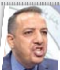
ندعو لصف مرتب شهر واحد لوظفي الموصل

وأضاف رئيس لجنة النزاهة "لدينا معلومات ان أحد هؤلاء المسؤولين لديه أكثر من ٦٠٠ مليون دولار في إحدى الدول المجاورة للعراق"، مشيرا إلى أن "تحقيقات مثل هذا الحجم تحتاج الى تعاون عدد كبير من الجهات الداخلية والخارجية".