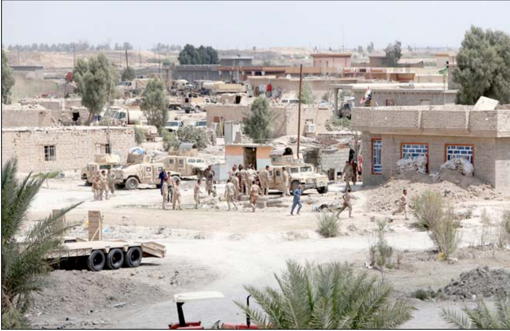
قوة عسكرية وسط الرمادي... أ ف ب

وأقر وزير الخارجية جون كيري خلال وجوده في بغداد الأسبوع الماضي بالحاجة إلى المزيد من المساعدات في إعادة الإعمار، حيث قال "مع تحرير المزيد من الأراضي من داعش، على