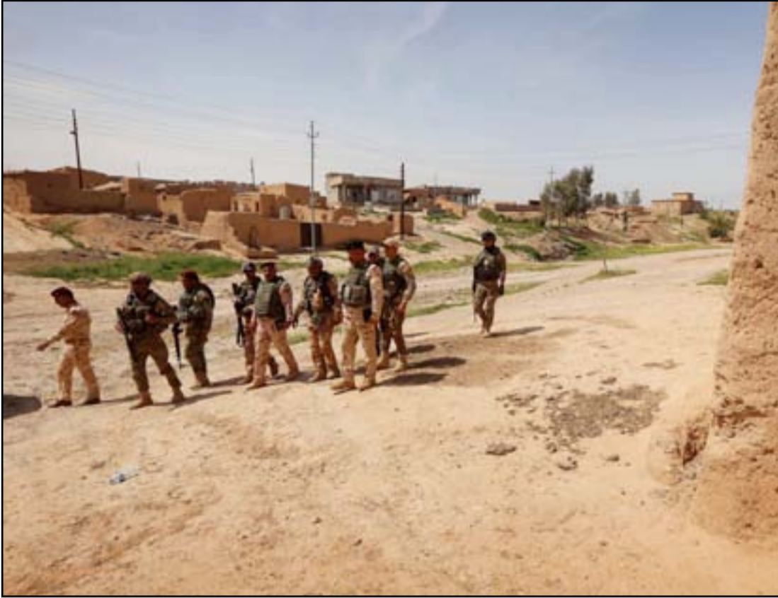
جنود في إحدى القوى جنوب الموصل.. أ.ف.ب.

قد تعدّ مهاجمة "الشرقات"، شمال تكريت، في الوقت الحالي مغامرة كبيرة، دون إحراز تقدم واضح من الجهة الأخرى للمعارك في جنوب الموصل. لكنّ العمليات البرية توقفت بالفعل باتجاه "القيّارة"، منذ أسابيع، مما قد يعطي "داعش" فرصة لترتيب أوراقه مجدداً في الموصل، بل وقد يستعيد المسلحون بلدات أخرى محررة، بحسب مسؤول كردي في مخمور، مستغلة الأزمة السياسية في بغداد.