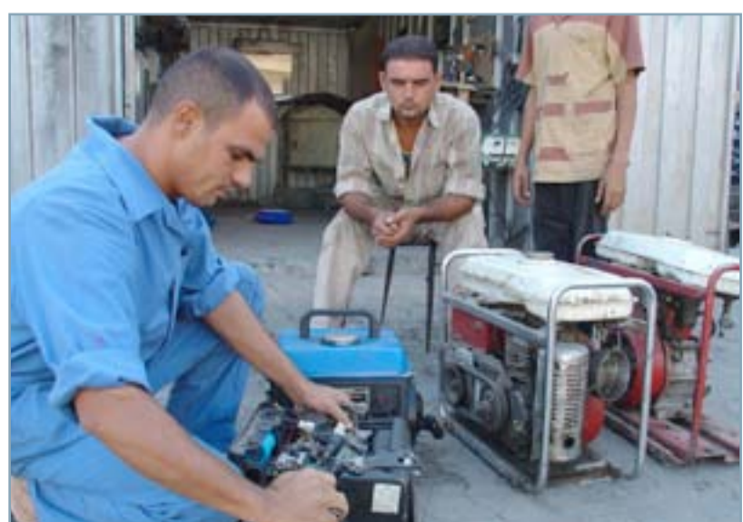
المولدات المنزلية استهلكت مدخولات العائلة