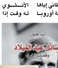
رسائل عيد الميلاد