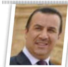
لا غالب ولا مغلوب في جلسة الثلاثاء

واضاف حمودي بحسب البيان، ان "الحراك البرلماني الأخير اذا ما تمخض عنه معارضة حقيقية فهو