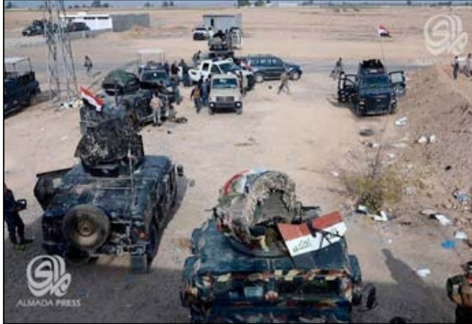
قوة أمنية قرب البغدادي.. أرشيف.

معاقلهم وسنعلن رسمياً تحريرها خلال الساعات القليلة المقبلة". وفي الانبار ايضا، أعلنت قيادة قوات الحشد الشعبي في محافظة الانبار، أمس الاثنين، عن مقتل ٢٢ عنصرا من تنظيم داعش (بقصف جوي استهدف مركزاً لتمويل التنظيم بالمواد الغذائية، شرقي الفلوجة. وتمكنت القوات الامنية المشتركة من تحرير العديد من المناطق المحيطة في الفلوجة منها الجانب الشرقي.