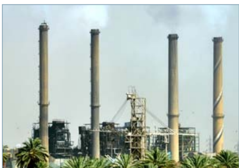
محطات كهربائية قديمة