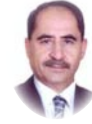
□ نوبس إقبليس

تضاربت الآراء والتوقعات حول الأزمة التي تمرّ بالوطن، وما قد يترتب على الحراك المتخبط الأخير، من نتائج وتعقيدات بل وتميرات من أجل الخروج من الأزمة المركبة بأي ثمن. فالشعب لم يعد يستوعب أو يتحمّل مثل كل مرّة، ما تنوي الكتل السياسية وزعماءها من تمريره عبر صفقات مشبوهة لا تخدم غير تثبيت مواقعهم ومناصبهم في الحكم والسلطة والسرقة من الكعكة المتهالكة التي يبدو أنها لم تنضب بعد، بحجة الشراكة والاستحقاق الانتخابي والحفاظ على الدستور "الأعرج". ولكن، ما يتفق عليه الجميع، هو أنّ الحراك الأخير قد هزّ عروش الرئاسات الثلاث، التي بدأت تتخوّف على مصيرها وتخشى من عواقب فقدانها لإحجام الحكم الذي بات في حكم الأيل إلى السقوط.