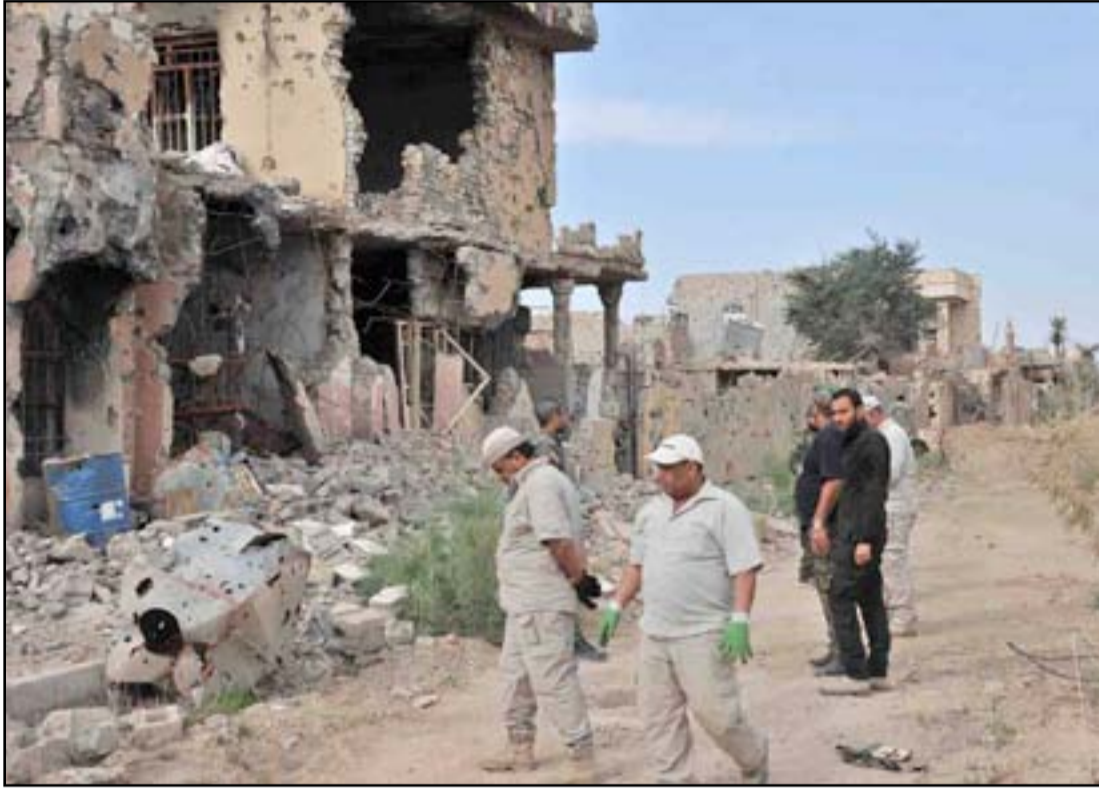
جنود خلال عمليات تطهير الرمادي من العيوب

وتحمل تلك القوائم، التي أعدت بالاعتماد على شهادات السكان والقوات الامنية والاستخبارات، الاسماء الحقيقية وكنى قادة داعش في المدينة.