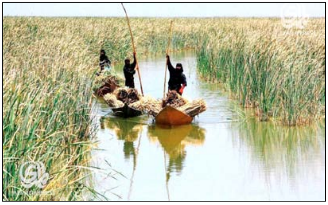
نساء يعملن في مجال الزراعة باهوار ذي قار

وتضم محافظة ذي قار، مركزها مدينة الناصرية، (٣٥٠ كم جنوبي العاصمة بغداد)، نحو ١٢٠٠ موقع أثاري يعود معظمها إلى الحضارات السومرية والأكديّة والبابلية والأخمينية والفريية والساسانية والعصر الإسلامي، وهي من أغنى المدن العراقية بالمواقع الأثرية المهمة، إذ تضم بيت النبي إبراهيم (ع) ورفورة أور التاريخية، فضلاً عن المقبرة الملكية، وقصر شولكي ومعبد (دب لال ماخ) الذي يعد أقدم محكمة في التاريخ.