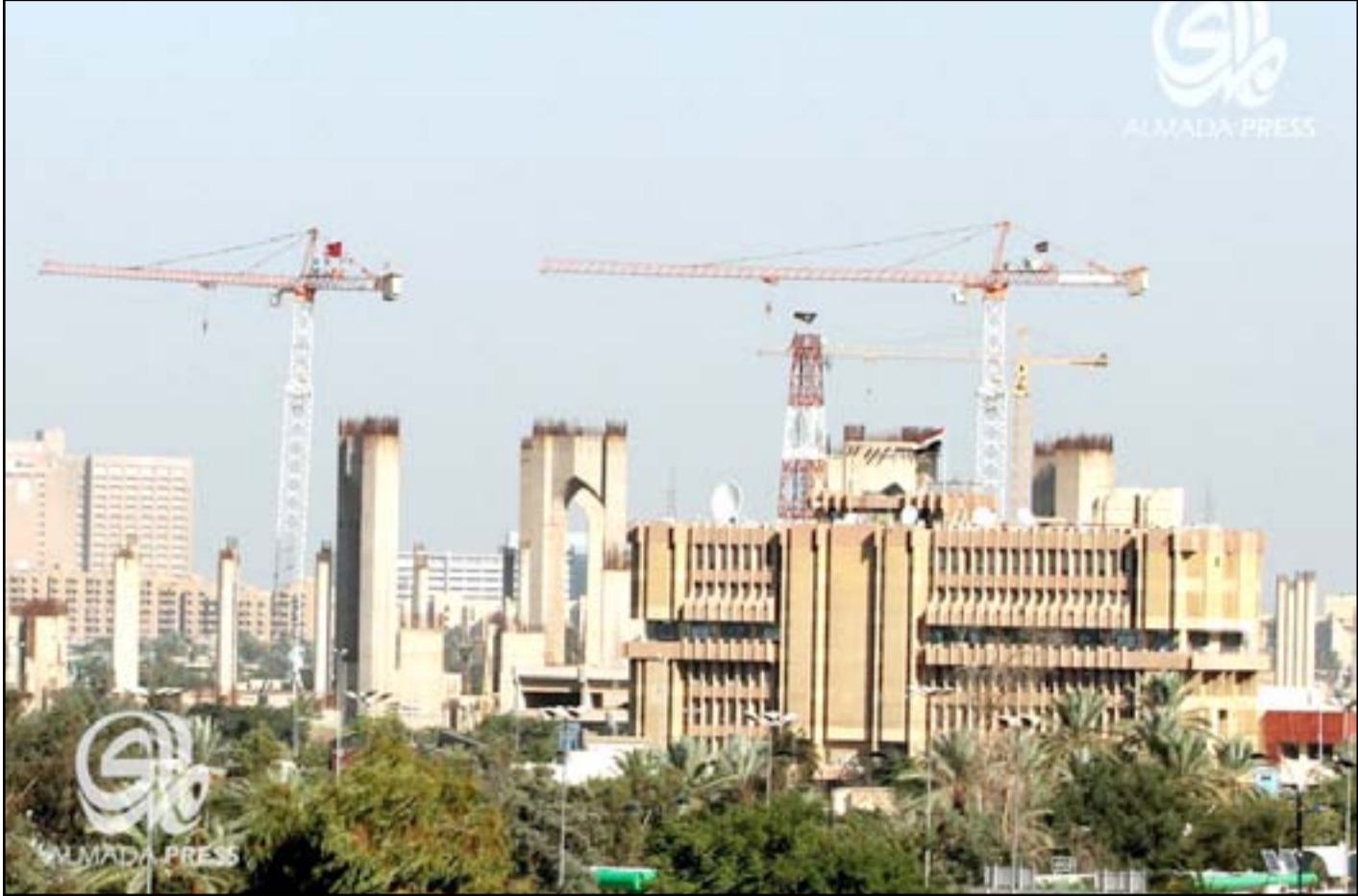
مشاريع استثمارية في العاصمة بغداد

وأضاف مدقق شركة أرنست ويونغ أن "المحافظة قامت بالتعاقد مع شركة الرشيد العامة لتجهيز أليات تخصصية وسيارات صاروخية بمبلغ 6٥٥٠٠٠٠٠٠٠ دينار رغم أنها شركة ليست متخصصة ودفعت المحافظة سلفة تشغيلية بلغت 1٠٠% من قيمة العقد وبلغت نسبة الإنجاز ٠% لغاية سحب العمل"، مشيراً إلى أن "المحافظة لم