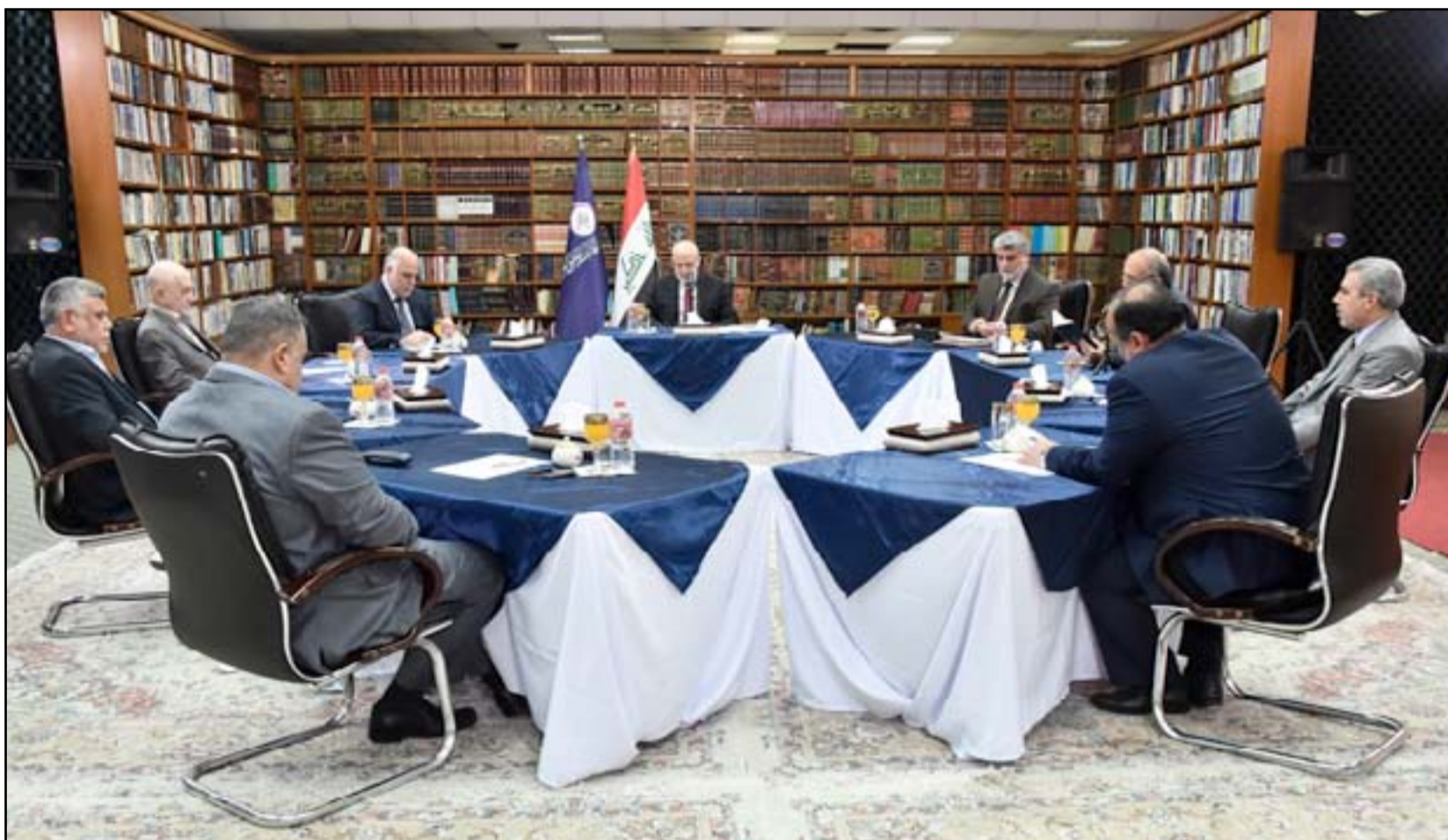
اجتماع التحالف الوطني... أرفيف.

وكان رئيس الجمهورية، فؤاد معصوم، طرح في (١٥ من نيسان الحالي)، مبادرة لإصلاحات حقيقية وحل أزمة البرلمان على وفق برنامج مدروس يضمن إنهاء الخصاصة الحزبية في دوائر الدولة وإيجاد حلول للأزمة الاقتصادية