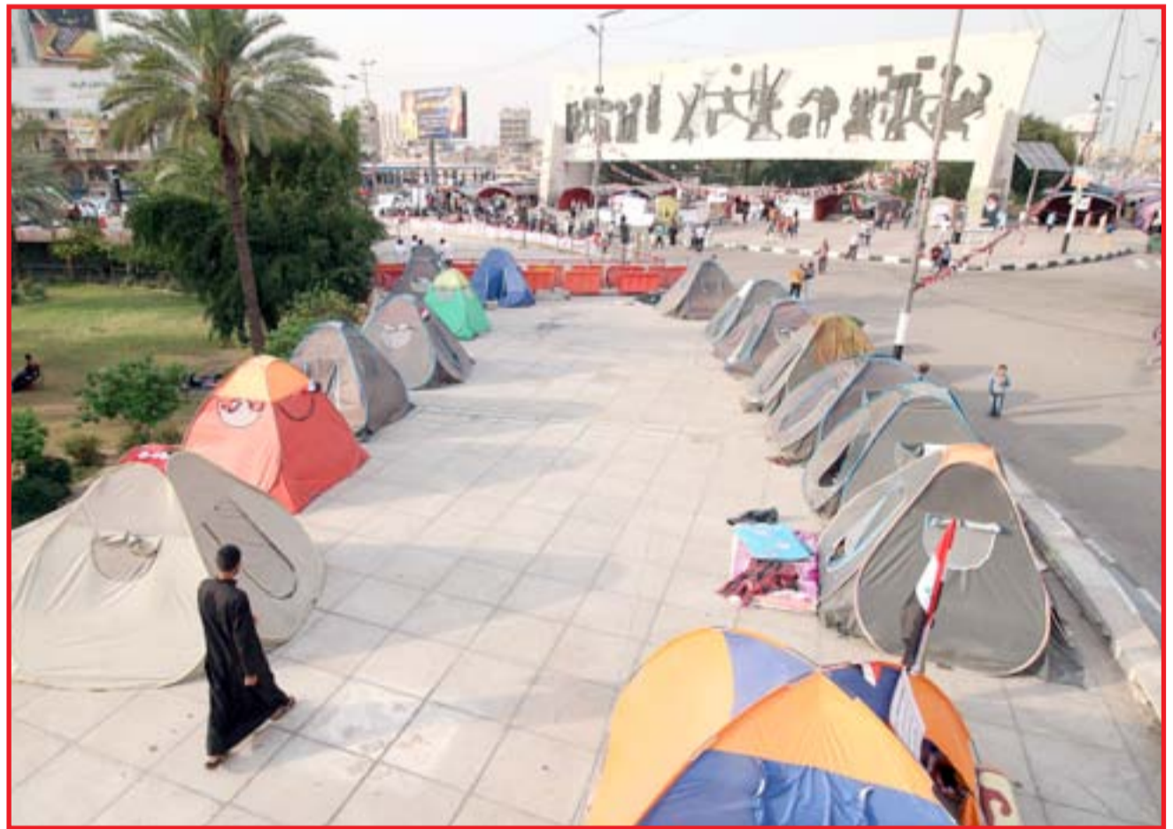
خيم المعتصمين وسط بغداد...