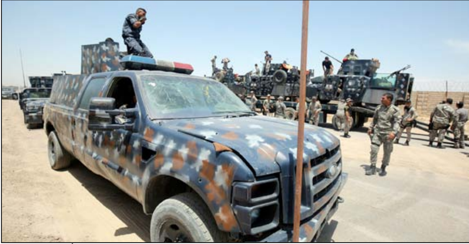
قطعات عسكرية تحشد قرب الفلوجة أمس...

لكن لاحقاً، داعية المواطنين إلى الابتعاد عن مقر عصابات داعش وتجمعاتها إذ سيتم التعامل معها كاهداف للطيران الحربي". وأضاف بيان للخلية، تلقت (المدى برس) نسخة منه، أن "على المواطنين كافة في الفلوجة تقديم المعلومات وطلب المساعدة من خلال إرسال رسائل على الخط المجاني ١٩٥"، وحثت العوائل التي لا تستطيع الخروج من الفلوجة برفع رايات بيضاء على مكان تواجدها". وأشارت الخلية إلى أن "عملية تحرير الفلوجة هي عملية عسكرية عراقية تشترك بها كل القطاعات من الجيش وجهاز مكافحة الإرهاب والشرطة والحشد الشعبي والعشائري والقوة الجوية وطيران الجيش، مبيّناً أن "هذه القوات ستخوض المعركة بخيار وحيد هو النصر وتحرير الفلوجة من دنس داعش الإرهابي". وتابع بيان الخلية الحربية مخاطبة الأهالي أن "عملية تحرير الفلوجة من أجلكم ومن أجل إعادة الفلوجة إلى أهلها وهي انتصار لكل عراقي