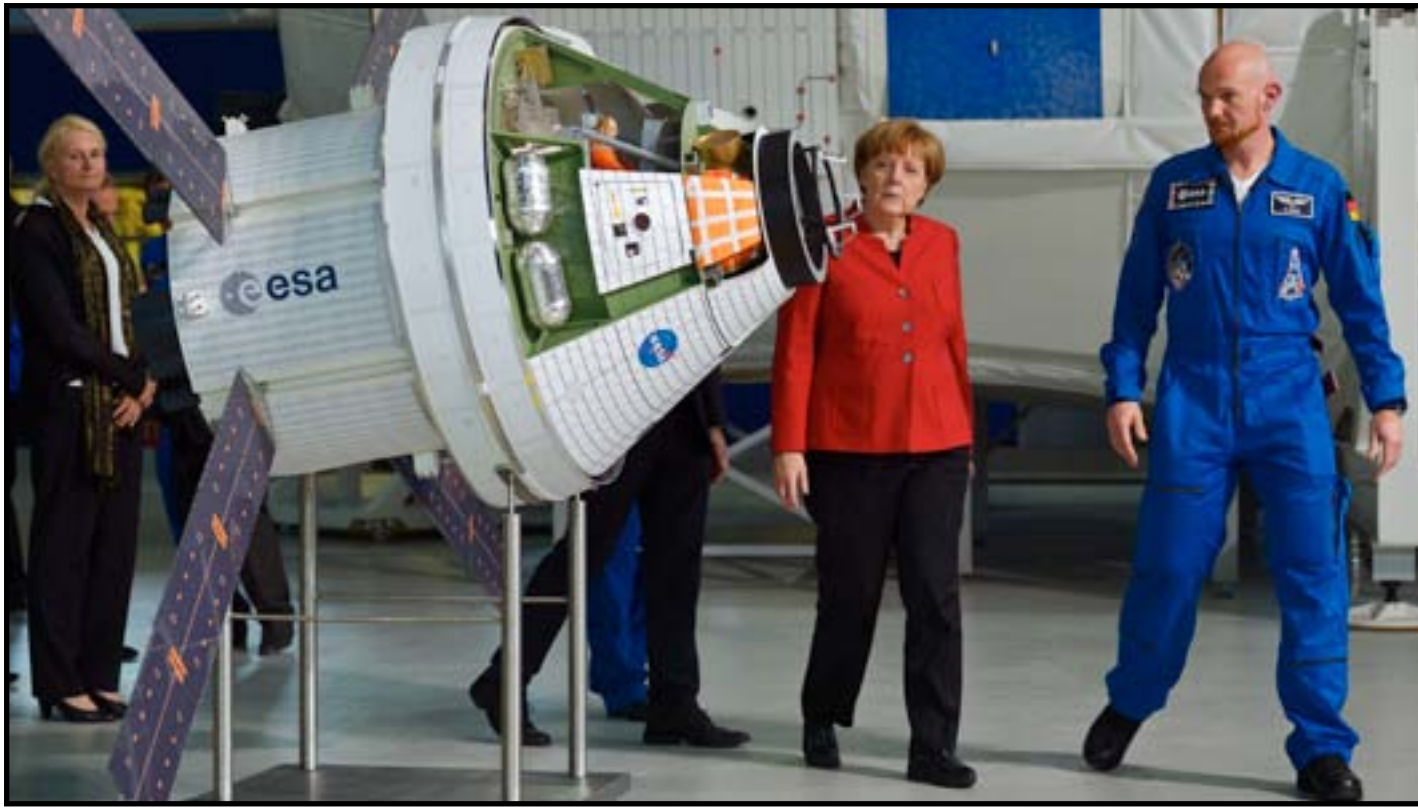
انجيلا ميركل مع رائد الفضاء الألماني الكسندر كرسنت في مركز (EAC) من وكالة الفضاء الأوروبية (ESA) في كولونيا، غرب ألمانيا.. أ ف ب

كأن العالم لا يكتفي دونالد ترامب واحد، أميركي الجنسية، حتى برز آخرون في القارة العجوز. فقد أشار أنطوني فايولا في صحيفة واشنطن بوست الأميركية إلى أن الأوروبيين قد يكونون قلقين من بروز نجم دونالد ترامب في الولايات المتحدة، لكن من بريطانيا إلى النمسا، تواجه المنطقة صعود اليمين الشعبوي الخاص بها. ويقول الصحافي الأميركي: "قد يرمون لحماء حمراء إلى الجموع، لكن هذه الأيام، هي مظهورة ومقدمة بشكل أفضل. سياساتهم تُعرض مع ابتسامته، حتى مع نكتة. في الماضي، كان يمكن للقوميين أن يبثوا الرعب في قلوب من كانوا يسمعونهم. الآن، هم متعهدو عروض واقعية ترفهية. قلة منهم تتمتع بالجادبية أيضاً". وأعلن اليمين الشعبوي سلسلة من الانتصارات الوطنية خلف الستار القومي، مع الحكام القوميين في المجر وبولندا، على سبيل المثال، الذين يتسبون بقلق جدي عبر نشر سميتهم الخاصة من سياسات الذراع القوية ضد وسائل الإعلام الإخبارية والعارضين السياسيين. لكن إغراء الشعبوية ينتشر غرباً في قلب أوروبا. هذه نظرة إلى بعض من أصوات أقصى