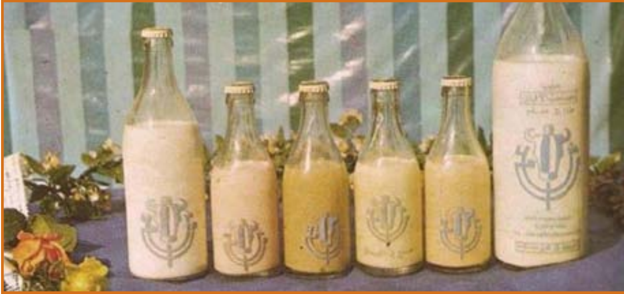
الحليب العراقي الذي يُفتقد

تتمتع أبو طيف بما معروض في الثلاجة من انواع الحليب والأجبان المستوردة باحثا عن النوع الذي اوصته به زوجته، لكنه لم يجده. استفسر من صاحب المحل، الذي اجاب: لا أتعامل بهذا النوع من الحليب. دون ان يسأل عن السبب كانت نبرة البائع واضحة. تدارك أمره متجها الى محل آخر عسى ان يجد ضالته وكانت ذات الاجابية.. وثالث ورابع، حتى جزع ليعود الى سيارته في الساحة القريبة من السوق دون ان يشتري شيئا مع خسارة ثلاثة آلاف دينار أجرة الوقوف لربع ساعة في ساحة ووقوف مجازة من امانة بغداد يفترض انها تعمل بالسعر المحدد "الف دينار".