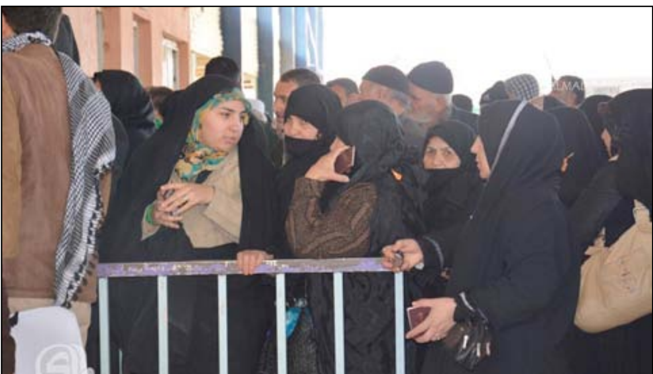
زوار ايرانيون في منفذ زرباطية شرقي واسط

والدوريات الأمنية على الطريق العام كوت - بكرة وكوت - نعمانية ونعمانية - شوملي" وهو الطريق الذي يسلكه الزوار القادمون من إيران قبل الوصول إلى محافظة كربلاء". وكان مجلس محافظة واسط قرر، امس الأحد (٢٢ من ايار ٢٠١٦) تعطيل الدوام الرسمي اليوم الاثنين، بمناسبة الزيارة الشعبانية (ولادة الامام المهدي)، فيما استثنى القرار الدوائر الأمنية والخدمية. يذكر أن ملايين الزوار من داخل العراق مدينة كربلاء، لافتا إلى أن "الحكومة المحلية وضعت خطة أمنية لحماية هؤلاء الزوار خلال مرورهم في الأراضي العراقية ضمن حدود المحافظة من خلال نشر عشرات المفازر