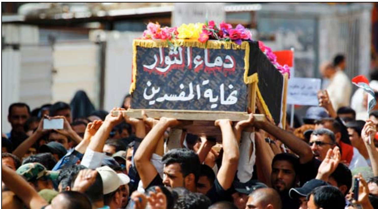
جانب من تشييع اثنين من متظاهري التيار الصدري قتل في اقتحام المنطقة الخضراء...

وتابع البيان أن "الكتل السياسية المهيمنة على إدارة الدولة لم تتعلم الدرس من أحداث الـ ٣٠ من نيسان باتجاه اتخاذ مواقف شجاعة على طريق معالجة الأزمة السياسية وتحقيق الإصلاحات وعلى العكس من ذلك فإنها سارت بذات النهج الطائفي والمحاصصاتي، ووضعت شروطاً تعجيزية عطلت السلطة التشريعية، في مسعى تخريبي لاستمرار الاستعصاء والشلل السياسي في البلاد". وحلّ التيار الديمقراطي، بحسب البيان، الكتل السياسية "المتنفذة مسؤولية أي تأخير لحل المشاكل الاجتماعية والاقتصادية". داعياً إلى "الاستجابة الفورية لمطالب المحتجين المشروعة