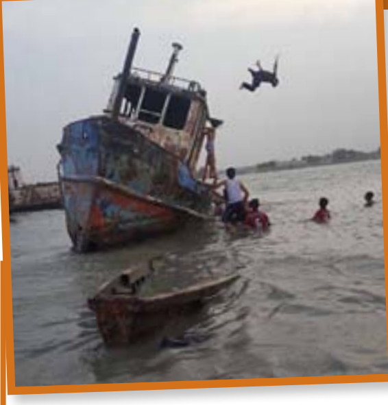
بعض السفن والمراكب اخر. وسبب ذلك غياب وحطامها الذي يعد خطرا المسابح الكافية.

مع ارتفاع واشتداد حرارة الصيف العراقي خاصة في الجنوب وتحديدا في مدينة البصرة، الامر الذي يجبر الشباب والشبان للجوء الى الانهار والبرك للسباحة هربا من ما يعرف بـ(الشرجية) اذ يكون شط العرب المكان المفضل للجميع على طول امتداده مع المدينة. سبق وان حذرنا من مخاطر بعض اسماك القرش المتسربة من البحر. ومخاطر اخرى من تلوث المياه وامتداد المد الملحي. رغم ذلك مازال الشط المكان المفضل للكثير رغم ركام