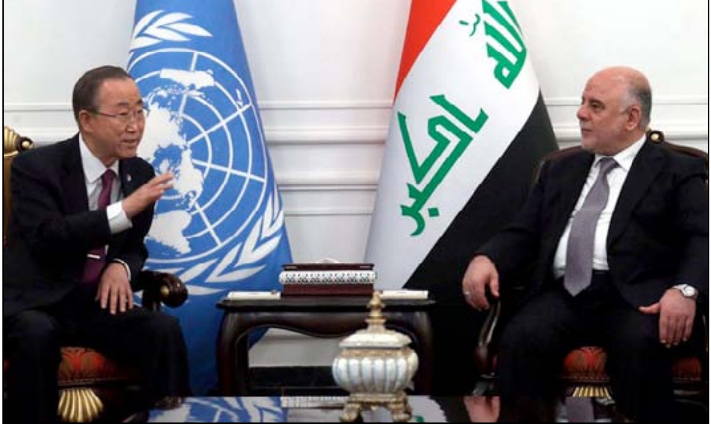
العبادي وأمين عام الأمم المتحدة

يتوقف مزاد العملات، لأن هذا يقتل العراقيين. ومما يثير القلق أن التقارير لم تذكر وزارة واحدة، بل ذكرت وزارات متورطة في تنظيم مشاريع وهمية وتسببت في فضيحة للحكومة. وبلغ الغضب الشعبي درجة الغليان بسبب أزمة المرتبات التي ضربت القطاع العمومي في العراق، ففي بداية هذه السنة، أنفقت الحكومة قرابة ٣ مليارات دولار على رواتب موظفيها، ولكن ٢,٥ مليار دولار فقط هي من عائدات النفط؛ لأكثر من ستة ورواتب الموظفين في الوزارات تتأخر، حتى أغلقت بعض المعامل أبوابها. وأصبح موت الصناعة أمراً لا مفر منه، لأن الوزارات غالباً ما تسييس انداباتها، فتقدم الوظائف للتصويت في نظام المحاصصة؛ غير المغل على حقيقته.