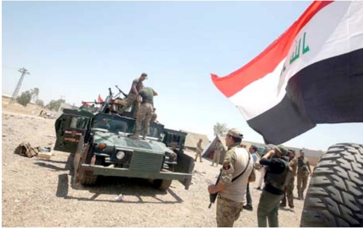
قطعات من الجيش قرب الفلوجة أمس.. أ.ف.ب

وقال مصدر مطلع في عمليات الأنبار، لـ(المدى برس)، إن