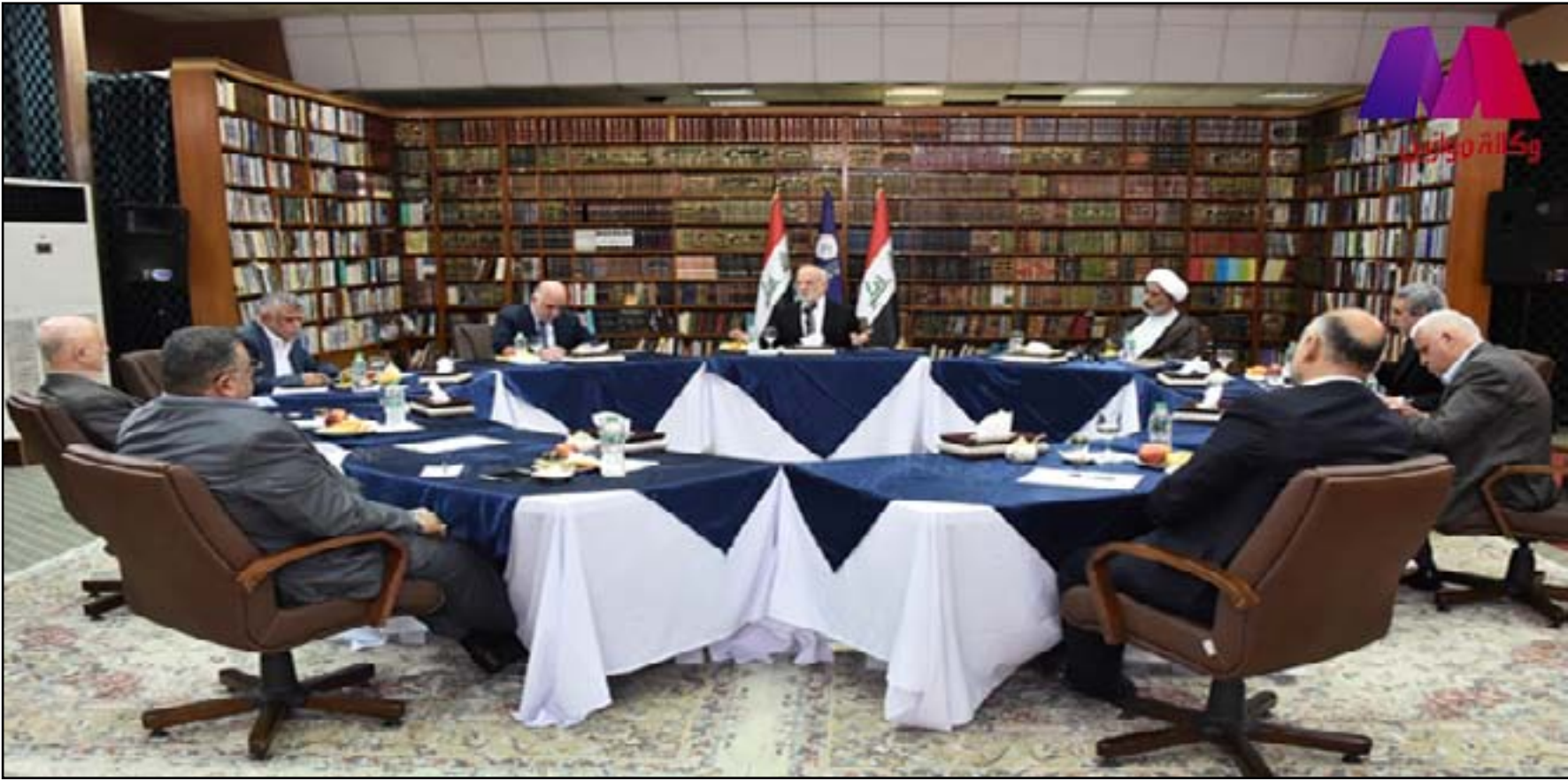
اجتماع سابق للتحالف الوطني

في الاجتماع، الذي حضره رئيس الوزراء حيدر العبادي، تسأل بعض الحضور عن سيطرة زعيم التيار الصدري على انصاره، لاسيما في ظل المعلومات التي تفيد بعدم علم القيادات العليا في التيار بأمر الاقتحام.