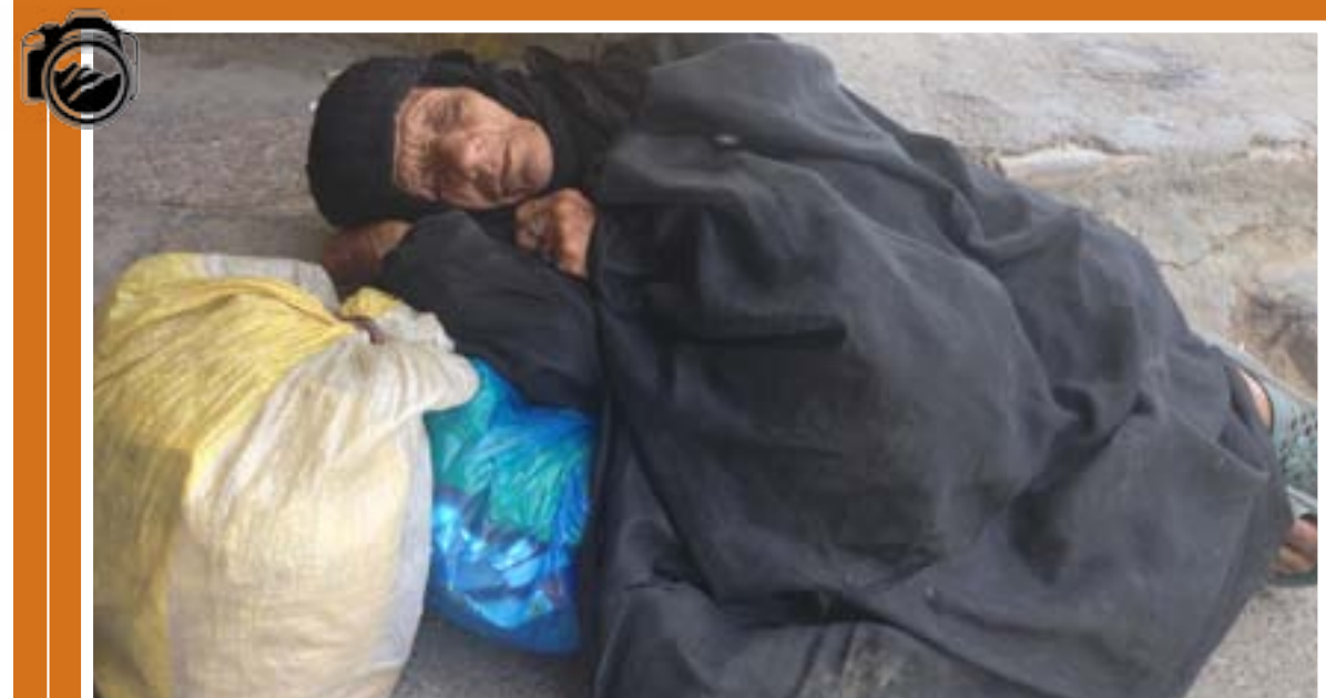
امراة بلا ماوى تتخذ من ارضة شارع العشار مكان استراحة في مدينة تعج بالثروات والاحزاب الاسلامية..

إلى / جريدة المدى العراقي الموضوع / خبر صحفي تهديد مديريتنا اظيب وأرق التحايا.. إشارة الى الخبر الصحفي المنشور في صحيفتكم بعددها المرقم (3586) بتاريخ (2016/2/29)، وتحت عنوان (الى مديرية المرور العامة بعد مفاتحة الجهات ذات العلاقة نئين لكم بأنه تم اللازم من قبل مديرية مرور بغداد الرصافة والإيعاز الى فصيل الطوارئ بالميرية لاتخاذ الاجراءات اللازمة للحد من الزحامات المرورية. راجين نشر الرد في صحيفتكم مع التقدير وزارة الداخلية مديرية العلاقات والاعلام 2016/5/11