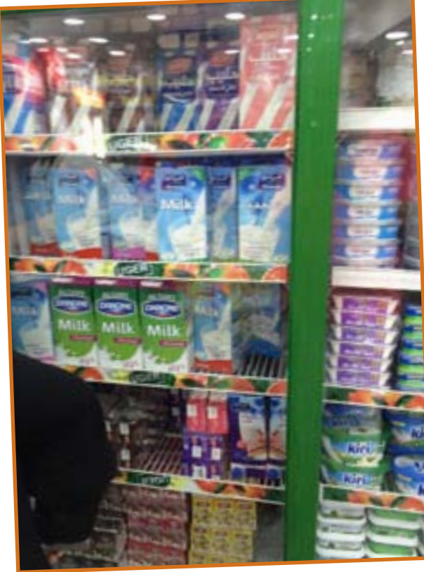
منتجات الألبان المستوردة

قبل ان يهجم بالدخول الى منطقة سكنه واذا بإعلان ضوئي كبير يشير الى تخفيض جديد بسعر حليب المراعي من 2000 دينار الى 1500 دينار، استغرب سبب ذلك التخفيض المفاجئ الذي جعله يستدير ويركن سيارته امام (سوبر ماركات) كبير، أغرته المعروضات وأسعار التخفيض بالتسوق، حتى وصل الى الثلاجة