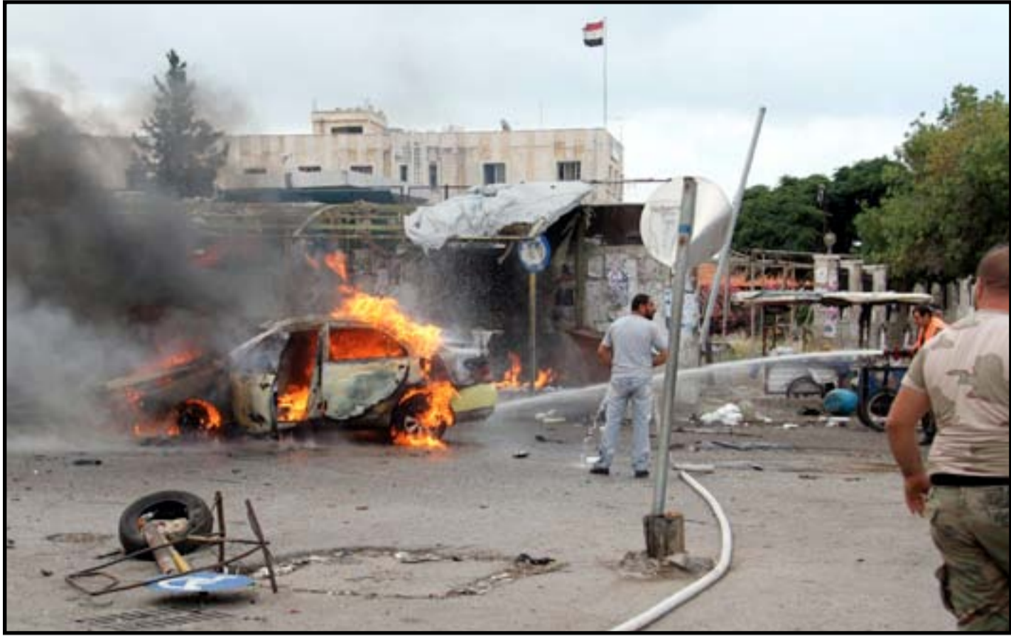
رجل الإطفاء يقوم بإخماد الحريق في مكان التفجيرات المتعددة في مدينة طرطوس شمال غرب دمشق...

أشرف عبد الغني التي سعت جاهدة لإقناع التنظيم بنهج المفاوضات". وأضافت "إنه لم يتم حتى الآن الكشف عن هوية خليفة الملا منصور، غير أن مسألة مباحثات السلام في العموم لم تحظ بتأييد عميق بين أوساط القيادات البارزة لتنظيم طالبان". وأوضحت الصحيفة أن "غارة بلوشستان تعكس في حقيقة الأمر أن إدارة الرئيس الأميركي باراك أوباما لم تتحل بالصبر الكافي في التعامل مع فشل باكستان في التحرك بقوة ضد تمرد طالبان، وبينما ظلت المؤسسة العسكرية القوية في باكستان تتعاون بهدوء مع حملة وكالة الاستخبارات المركزية الأميركية "سي آي إيه" لشن غارات بطائرات بدون طيار ضد تنظيم القاعدة وحركة طالبان الباكستانية في المناطق القبلية بشمال غربي البلاد، رفضت في نهاية المطاف الطلبات الأميركية لتوسيع نطاق الغارات إلى بلوشستان (على حد قول مسؤولين أميركيين سابقين)". وأشارت (نيويورك تايمز) إلى أن الولايات المتحدة والحكومة الأفغانية طالما اعتبرتا أن ملاذات طالبان عبر الحدود في باكستان، لإسما في إقليم بلوشستان، السبب الرئيسي في صلابته المتمرد بالرغم من الحملة الدولية ضدهم، والتي وصلت إلى ذروتها بقوات دولية يبلغ عددها نحو 150 ألف مقاتل.