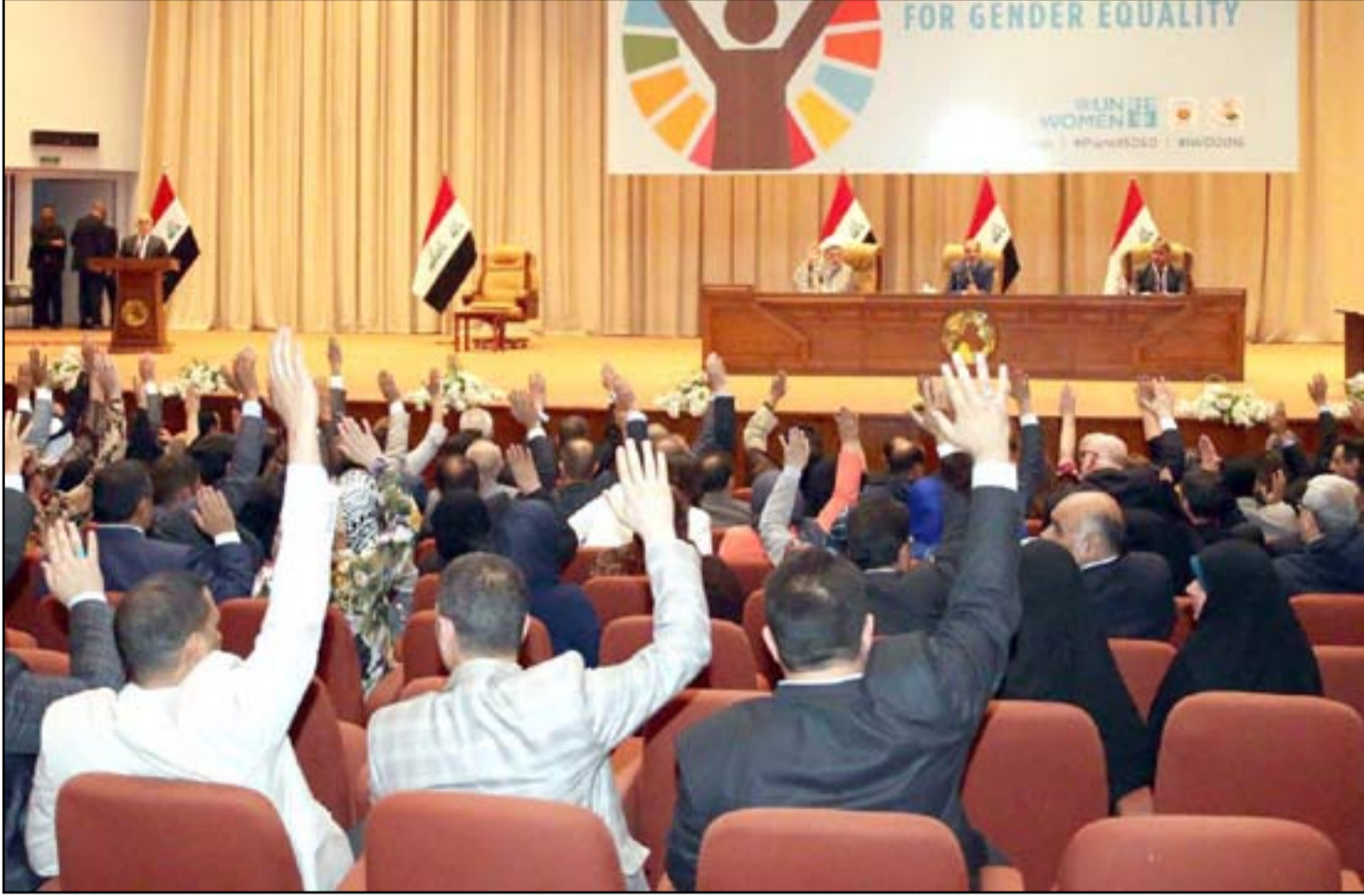
جلسة طرح الثقة بالوزراء التكنوقراط

القانون، والنصيدي لاستعادة هبة الدولة، ومواصلة دعم قواتنا المسلحة والحشد الشعبي لاستكمال عملية تطهير كامل التراب العراقي من رجس عصابات داعش الإرهابي.