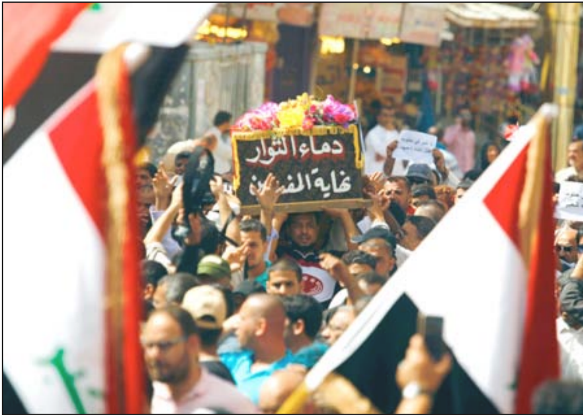
تجفيون خلال تشييع ضحايا تظاهرات بغداد... أ ف ب

واقترح آلاف من المتظاهرين لاسيما من اتباع التيار الصدري، المنطقة الخضراء، ومقر رئاسة الوزراء، ما أدى إلى تصدي القوات الأمنية لهم بالماء الحار والقنابل المسيلة للدموع، ومن ثم الرصاص المطاطي والحى، ما أدى إلى مقتل ما لا يقل عن اثنين منهم وإصابة المئات، في تطور خطير يؤشر مدى تفاقم الأمور والنقمة الشعبية من جراء "العقم السياسي" وعدم تحسين الخدمات ومحاسبة الفاسدين وتنفيذ إصلاحات حقيقية، لاسيما أن الكثير من المحافظات تشهد تظاهرات متواصلة منذ (٢٠١٥) من دون تطور يذكر.