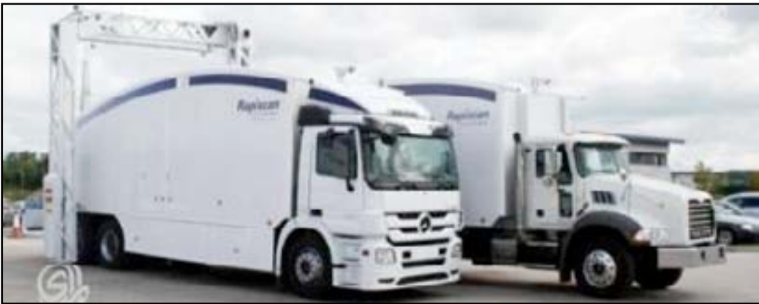
سيارات للكشف عن المتفجرات

المتفجرات ولن تتسبب بأية زحامات مرورية عند الفحص إذ تستغرق عملية فحص السيارات ثواني عدة"، مبيّناً أنّ "سيارات الكشف عن المتفجرات ستوزع على نقاط التفقيش بمختلف مناطق المحافظة لتسهل بحفظ الأمن فيها". يشير الى أنّ شرطة محافظة بابل تمتلك عدداً من سيارات الكشف عن المتفجرات وزعت في بعض نقاط التفقيش في المحافظة فيما ستغطي السيارات الجديدة باقي نقاط التفقيش في المحافظة. وكانت وزارة الداخلية العراقية قد تعاقدت في العام ٢٠٠٧، على شراء أجهزة كشف المتفجرات (أي دي إي-٦٥١) من شركة (أي تي سي إس) البريطانية، وقالت الشركة البريطانية إن بإمكان هذه الأجهزة كشف الأسلحة