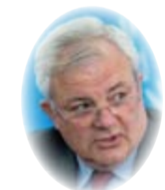
□ ستيفن أوبراين ×