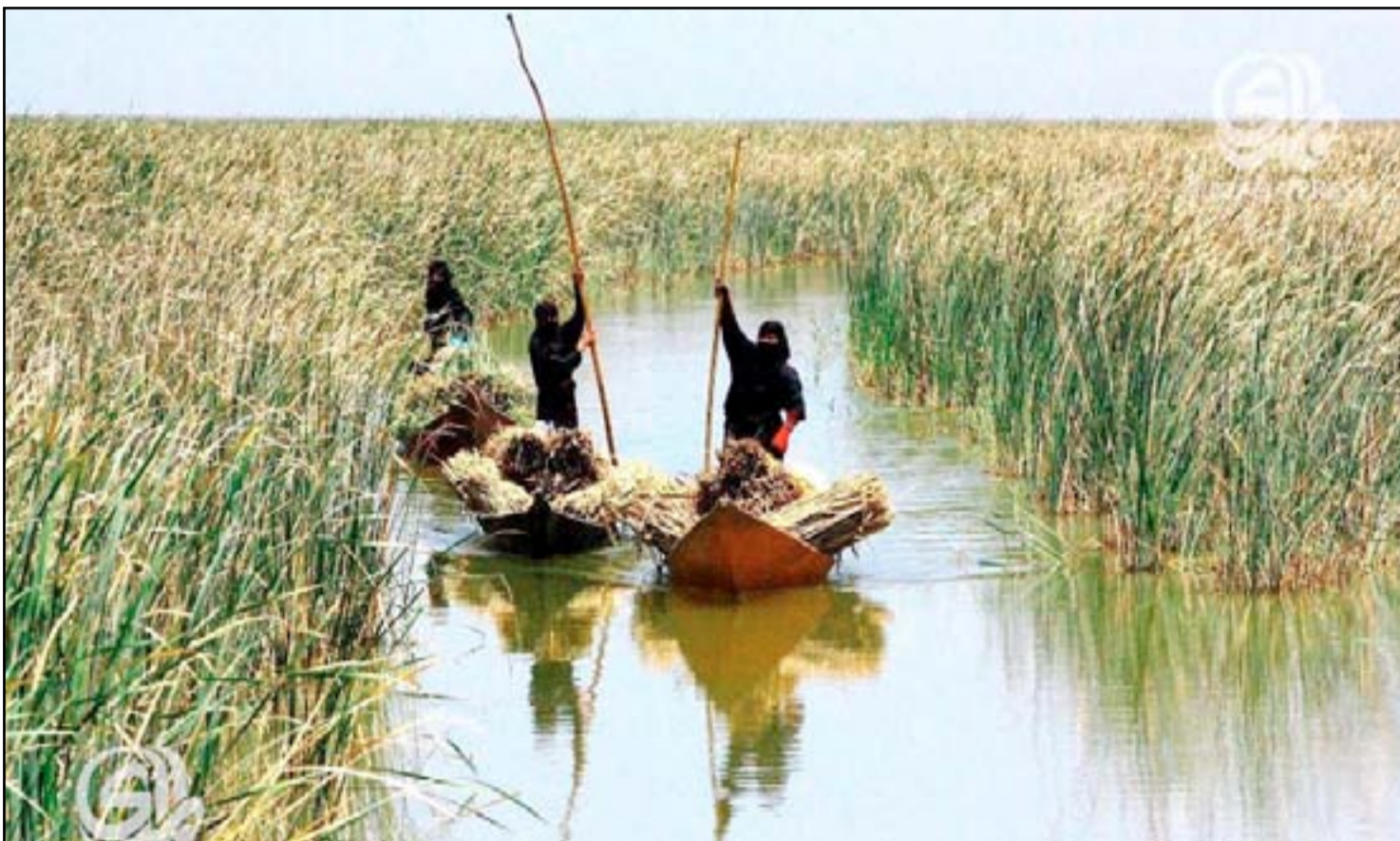
مجموعة من النساء يعملن في مجال الزراعة باهوار ذي قار

أعلنت وزارة الموارد المائية، يوم أمس الاثنين، أنّ مركز إنعاش الأهوار والأراضي الرطبة العراقية أرسل مذكرات لمنظمة (رامسار) لـ "التذكير بأهمية الأهوار العراقية"، فيما أكد محافظ ذي قار يحيى الناصري أنّ إيران تعهدت بالتصويت لصالح ضم الأهوار والأثار العراقية لللائحة التراث العالمي.