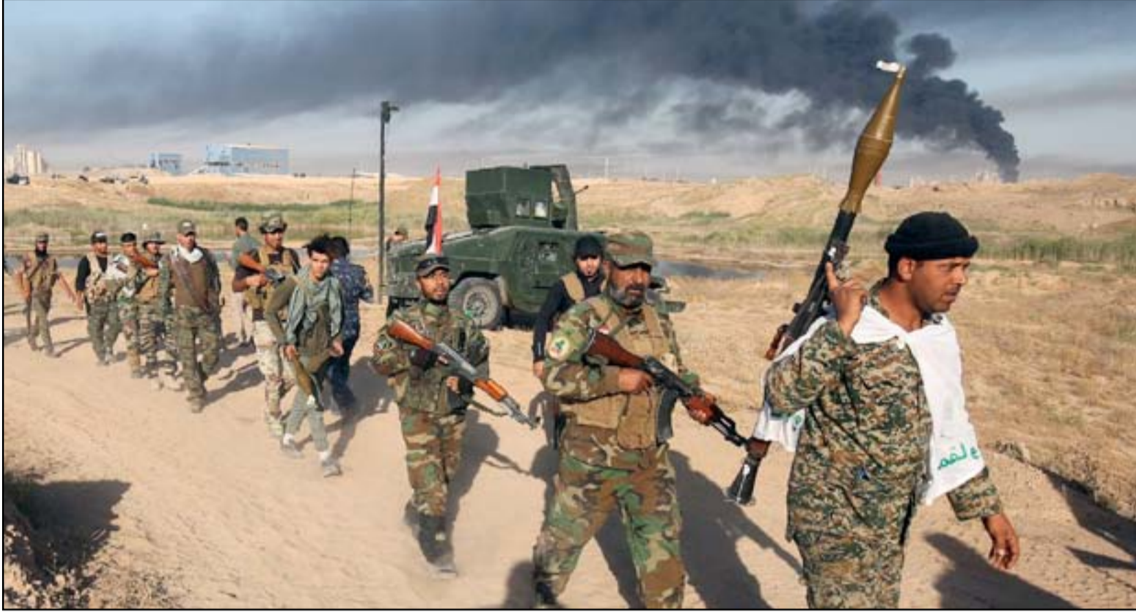
جنود قرب الفلوجة امس