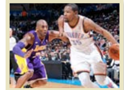
واشنطن / أف ب

مدير / أف ب أعلن المدرب لويس انريكي أن الأوروغوياني لويس سواريز مهاجم برشلونة الإسباني الفائز على أشبيلية (٢-٠) بعد التمديد في نهائي كأس اسبانيا يعاني من تمزق عضلي في فخذه الأيمن، وامكانية مشاركته في كوبا أميركا من ٢٦ الشهر المقبل باتت موضع شك.