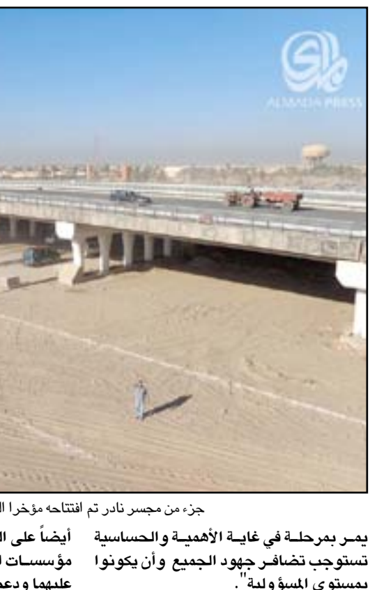
جزء من جسر نادر تم افتتاحه مؤخرا الذي يربط حركة السير بين بابل والنجف

بمرحلة في غاية الأهمية والحساسية تستوجب تضافر جهود الجميع وأن يكونوا بمستوى المسؤولية". وأضاف السلطاني، أن "المجتمعين أكدوا