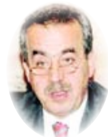
□ غسان شربل ×

على أرض العراق سيدفع القوى السياسية والحزبية والمليشياوية في بغداد إلى شيء من التعقل. حصل العكس تماما. أغلب الظن أن أبو بكر البغدادي شديد الإغتناب بالمشهد الحالي في بغداد. وربما وجد في الفشل الصارخ الذي توكده أحداث العاصمة العراقية، عزاء بعد الضربات الموجحة التي تلقاها تنظيمه على يد التحالف الدولي والجيش العراقي. كشفت أحداث المنطقة الخضراء فشلاً عراقياً مريعا لم يعد ممكناً تعليقه على مشجب نظام صدام حسين أو الإحتلال الأميركي. إنه فشل المسؤولين والسياسيين العراقيين والأقوياء الجدد في عهد ما بعد صدام، فضلا عن أنه فشل القوى الخارجية التي تتمتع بنفوذ في العراق وفي مقدمها إيران. منذ ٢٠٠٢ أتابع الوضع العراقي من بغداد وأربيل محاولا جمع الروايات وفهم ما يجري. سأشرك عزيزي القارئ في بعض ما يمكن أن يسمعه الصحافي من سياسيين منخرطين في اللعبة العراقية حين يضمنون عدم ذكر أسمائهم. قال: (انحصر الشيعة ولم يصدقوا أنهم انتصروا. وهزم السنة ولم يصدقوا أنهم هزموا. تولى الشيعة عمليا السلطة واستمروا في التصرف كعناصرين. تعاملوا مع الدولة كأنهم سيغادرون غداً. انتقل السنة عمليا إلى المعارضة لكنهم استمروا في التصرف كأصحاب حق مقدس في الحكم وتوهوا أنهم سيعودون غداً. كل فريق يريد دولته لا الدولة التي تتسع للجميع. أوضاع الشيعة فرصة تاريخية حين امتنعوا عن التنازل قليلا لمصلحة منطق الدولة، وهو ما كان يمكن أن يحمي انتصارهم. أوضاع السنة فرصة تاريخية حين امتنعوا عن التنازل لمنطق الدولة الجديدة، وهو ما كان يمكن أن يضبط خسائرهم.) أضاف: (صدقني أن عملية النهب التي يتعرض لها العراق أكبر بكثير مما تعرضت له روسيا غداة سقوط الاتحاد السوفياتي. تسطو الميليشيات