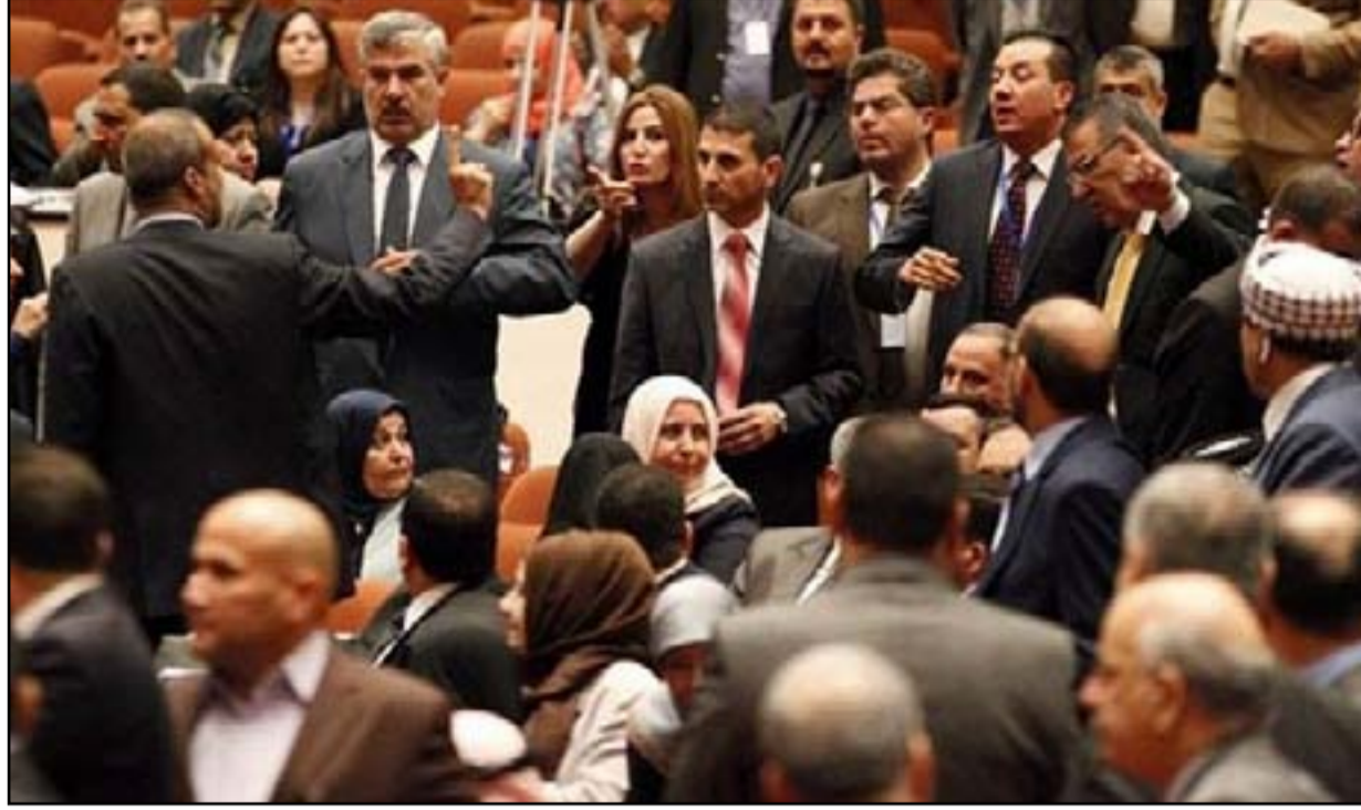
مشادة كلامية بين نواب في أول جلسة للدورة البرلمانية الحالية

وقانون "الحكمة الاتحادية" من القوانين الأخرى التي فشل البرلمان في إقرارها، وهذه المحكمة هي أعلى سلطة قضائية في البلاد لها صلاحية النظر في الخلافات بين السياسيين في البرلمان والحكومة، ولهذا فإن كل كتلة سياسية تريد أن يكون القانون وفق مصالحها. هذه القوانين تتضمن إصلاحات