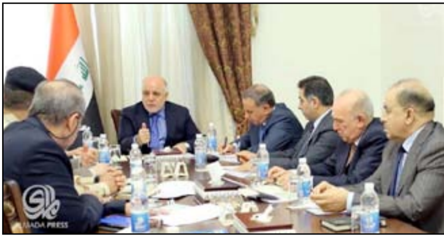
العبادي خلال اجتماع الامن الوطني

وأضافت الخلية، أن "القذائف انطلقت من منطقة القفلة، شرقي العاصمة بغداد". وبالتزامن مع ذلك، حث المجلس الوزاري للأمن الوطني، في اجتماعه الذي عقده في وقت متأخر من يوم الأحد برئاسة رئيس مجلس الوزراء حيدر العبادي، الفعاليات والكتل السياسية على مساندة