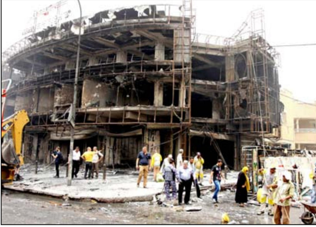
ولجة مجمع تجاري وسط الكردية

ارتفعت حصيلة ضحايا انفجار الكردية، وسط بغداد، إلى 374 شخصاً بين قتيل وجريح. بدوره أعلن رئيس الوزراء الحداد العام لثلاثة أيام. وكانت سيارة مفخخة قد انفجرت صباح يوم الأحد وسط حي الكردية المكتظ بالمتبضعين مع قرب عيد الضطر. وأدى التفجير إلى تدمير ثلاثة مجمعات تجارية كبيرة أبرزها مجمع "الليث" المعروف إلى جانب مجموعة كبيرة من المحال التجارية.