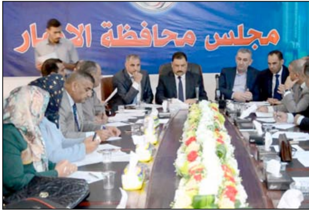
اجتماع لمجلس محافظة الأنبار

وتسعى الأغلبية في مجلس الأنبار التي أطلقت على نفسها (كتلة الإصلاح)، وتتكون من 17 عضوا من أصل 20، إلى إعادة رئيس مجلس المحافظة السابق جاسم الحلبوسي إلى المنصب