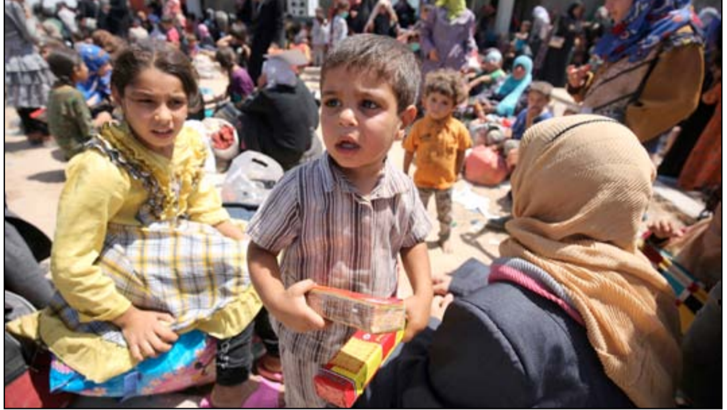
أطفال مع اسرهم في مخيم للنازحين في عامرية الفلوجة.. أ.ف.ب

كما يذكر التقرير ان الفتيات المختطفات أكثر عرضة للإعتداء الجنسي لاسيما المنتهيات الى طوائف دينية وعرقية، حيث جاء في التقرير "تم توثيق استخدام العنف الجنسي والمعاملة الوحشية ضد النساء والفتيات، حيث جرى إختطاف الكثير منهن واحتجازهن لأشهر وبيعهن في سوق الخناسة الجنسية وتعرضن للإغتصاب والتعذيب وسوء المعاملة". اما الأولاد فغالبا ما يجبرون على دعم نشاطات الخطوط الأمامية في الصراع كقاتلين أو إنتحاريين". ووثقت المنظمة 124 حالة تجنيد أطفال منذ 2014، لكن العدد الفعلي قد يكون أكبر من ذلك. ان التهديد الأخر الذي يواجه الأطفال هو الآف الأنغام والعيوات المنتشرة في أنحاء البلاد. ويقول التقرير ان القوات الأمنية في ديالى فككت ما لا يقل عن 18