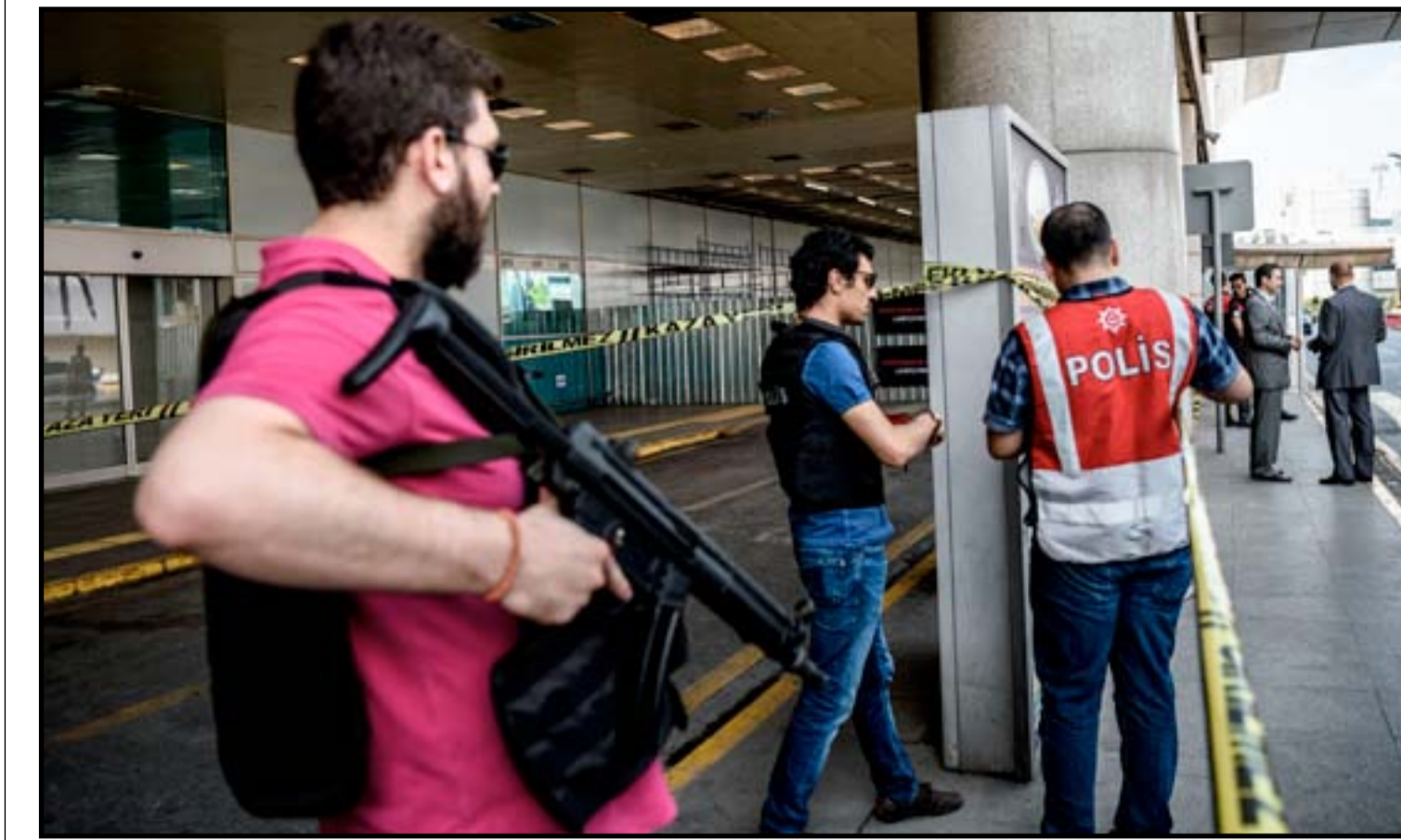
ضباط الشرطة التركية في موقع الانفجار في محطة مطار أتاتورك الدولي.. أ.ف.ب

اهتمت صحيفة واشنطن بوست الأميركية باستجواب "الإف بي أي" لوزيرة الخارجية الأميركية السابقة هيلاري كلينتون على مدار ثلاث ساعات في قضية البريد الإلكتروني الخاص بها أثناء توليها الوزارة. وقالت الصحيفة إن التحقيق حول ما إذا كانت كلينتون أو أي من كبار مساعديها قد كشفوا أسرار حكومية بسبب قرار استخدام خادم خاص لبريدها الإلكتروني أثناء توليها مهام منصبها، يأتي في توقيت شيق للغاية، على افتراض أن تلك المقابلة التي طال انتظارها بين رجال المباحث الفيدرالية والوزارة السابعة سيؤدي التحقيق في هذه القضية. فالقائم العام للحزب الديمقراطي سيبدأ في فيلادلفيا في ٢٥ يوليو/ تموز. وحتى تصبح كلينتون المرشحة الرسمية للحزب بأصوات المندوبين، فإنها تظل مرشحة مفترضة. وبناءً على ما ستعلن المباحث الفيدرالية نتيجة تحقيقها، فإن هذا الأمر يمكن أن يعقد بشكل كبير محاولات كلينتون لإعادة بناء الرُخم والحصول على الترشيح. وكان