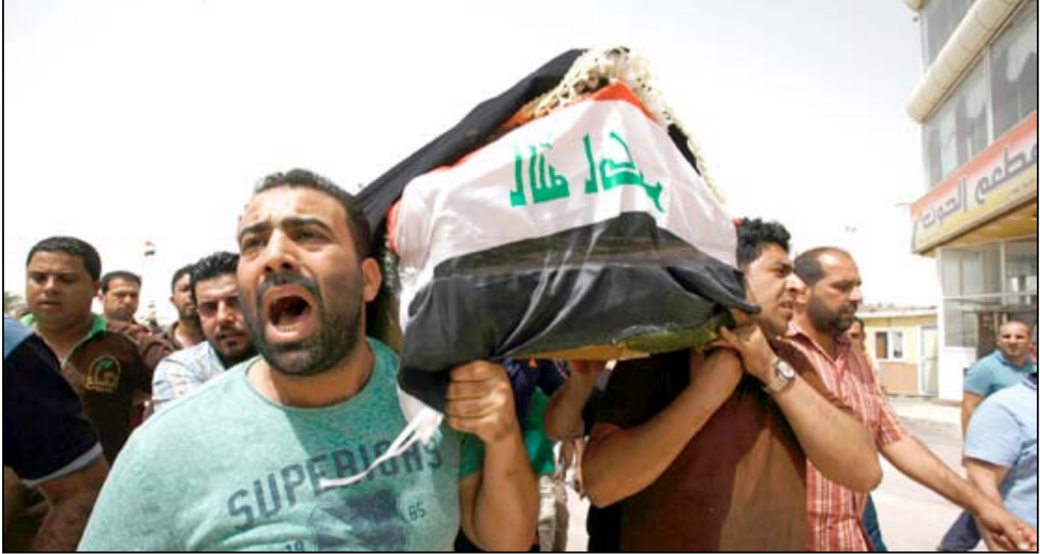
أهالي الكرادة يشيعون ضحايا التفجير الدامي الذي استهدف مركز التسوق... أف ب

قد يهتمني البعض بالإفلاس، أو البطر، فما جدوى النقطة أو علامة الإستفهام أو غيرها من علامات التفتيش في بلد يُحارب أفرادها على جميع الجبهات: تارة لتأمين لقمة عيش كريم في زمن العطالة والتجوير؛ وتارة للحفاظ على شبر — فرسخ من الأرض أن يقطع تحت السمع والبصر، وحيناً للنجاة من المحرقة التي قضت أو أوشكت القضاء على الأخضر واليابس، بما فيها المساهمة بوعي أو من دونه، تقطيع أوصال اللغة. وتوزيعها، شلوا شلوا مجاناً على الغرباء.