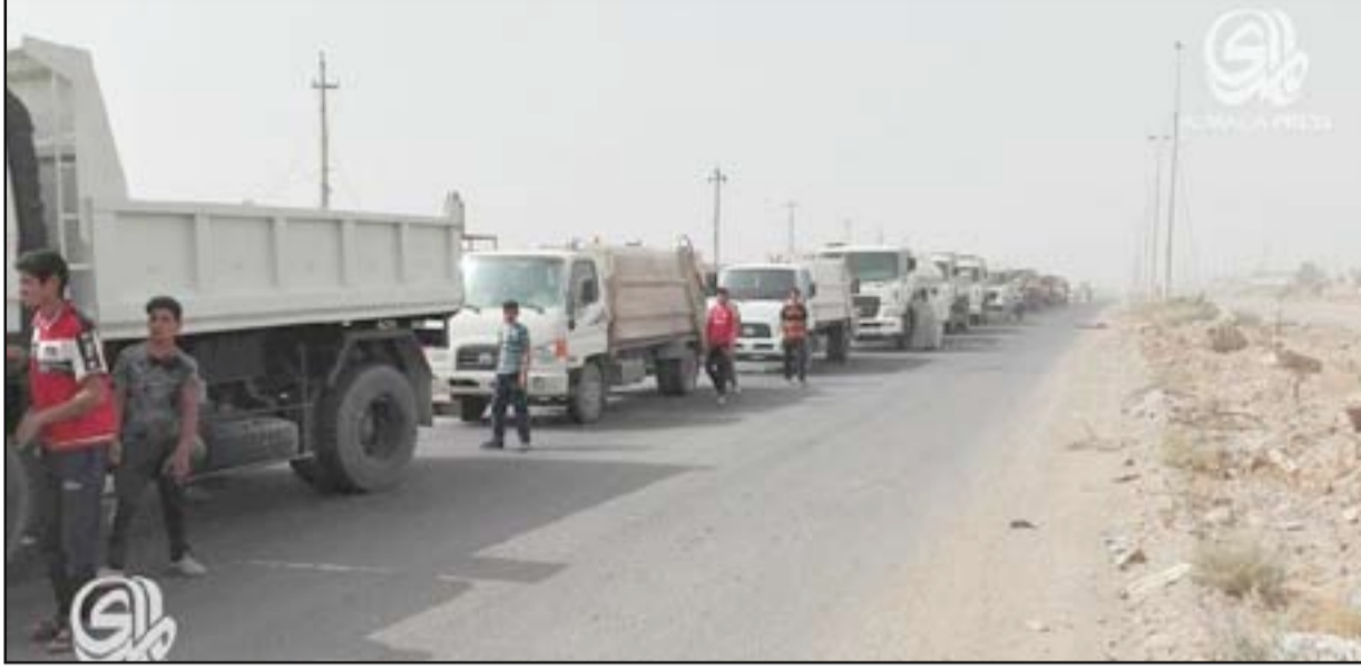
حملة لتنظيف قضاء بيجي، شمالي تكريت، من مخلفات الحرب

أعلن محافظ صلاح الدين أحمد عبد الله الجبوري، يوم أمس الأحد، عن المباشرة بتنظيف قضاء بيجي - شمالي تكريت - من العبوات الناسفة ومخلفات الحرب ضد تنظيم (داعش). وفيما دعا الحكومة المركزية إلى إطلاق الأموال التي خصصتها لإعادة الإعمار، طالب المجتمع الدولي بالمساهمة في إعادة تأهيل القضاء تمهيداً لإعادة النازحين. وقال أحمد عبد الله الجبوري، في حديثه إلى (المدى برس)، إن "إدارة المحافظة باشرت، اليوم، بحملة واسعة لتنظيف مركز قضاء بيجي، (٤٠ كم شمالي تكريت)، من آثار الحرب وما خلفه تنظيم (داعش) من عبوات ناسفة"، مبيناً أن الحملة ترمي إلى تنظيف قضاء