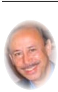
د. قاسم حسين صالح

ومن أخلاقه أنه لم يقصر مصادر فكره ومعارفه على الكتب، بل عد ذلك عادة مضمومة، فراح يتكلم على أيدي كبار المعلمين والعلماء، معتزفاً بفضلهم عليه لا كما يحصل لدينا الآن من جود وكران فعلى من تتلمذنا على أيديهم. ويصف المسعودي مؤلفات الجاحظ بأنها "تلجو صدأ الأذهان، وتكشف واضح البرهان، لأنه نظمه أحسن نظم، ووصفها أحسن وصف، وكساها من كلامه أجزل لفظ، وكان إذا تخوف ملل القارئ وسامة السامع، خرج من جد إلى هزل، ومن حكمة بليغة إلى ساذرة ظريفة"، فقيماً وصفه الطبيب والفيلسوف ثابت بن قرة الصائبي بأن الجاحظ: "حبيب القلوب، ومراح الأرواح، شيخ الأدب ولسان العرب، كتبه رياض زاهرة، ورسائله أفنان مفرحة".