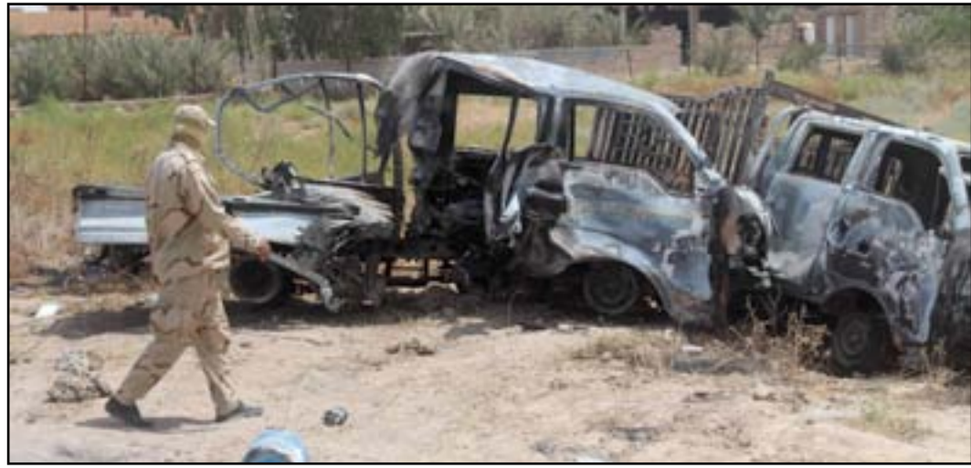
جندي يتفحص بسيارات محطمة لداعش في الفلوجة..