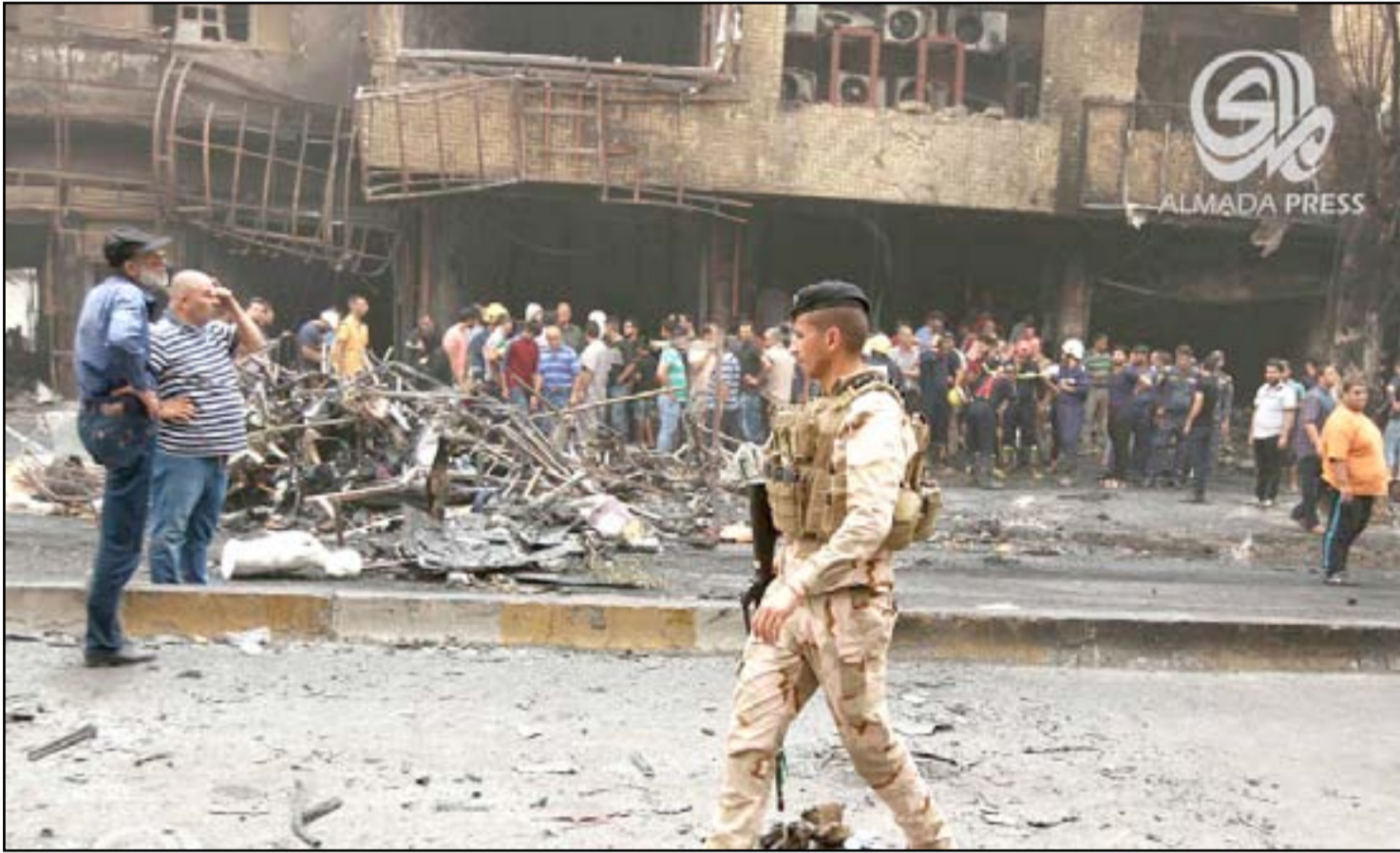
آثار الدمار الذي خلفه تفجير السيارة المفخخة في منطقة الكرامة، وسط بغداد، بعد منتصف ليل الأحد (٣ تموز ٢٠١٦).