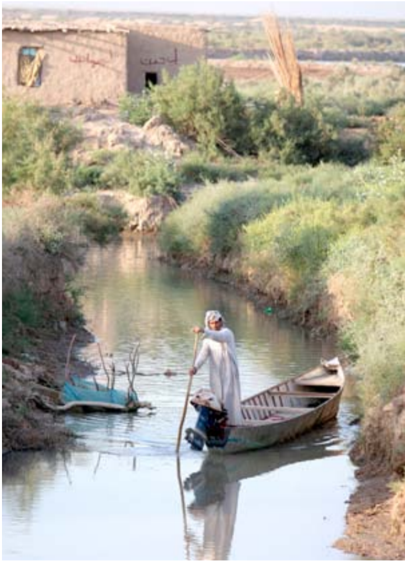
مواطن من أهوار ميسان... أ. ف. ب

أكدت هيئة السياحة، أمس الإثنين، أن العمق التاريخي والفني من أهم المعايير التي أدت إلى ضم الأهوار والمواقع الأثرية فيها للائحة التراث العالمي. وفيما اشارت إلى أن إنعاش المنطقة يتطلب تضامناً من الوزارات والحكومات المحلية ذات الصلة، عدت وزارة الزراعة، قرار اليونسكو انتصاراً لإرادة العراقيين. وقال رئيس الهيئة محمود الزبيدي، في حديث إلى (المدى برس)، إن هناك "معايير دولية لضئ المواقع إلى لائحة التراث العالمي سواء في منظمة الأمم المتحدة للتربية والثقافة والعلوم (اليونسكو) أم في منظمة السياحة العالمية"، مشيراً إلى أن "معياري العمق التاريخي والفني وعدم وجود مشاكل دولية اعتماداً في ضم الأهوار والآثار الموجودة فيها إلى تلك اللائحة، لا سيما أن أصل سكان الأهوار والعديد من عاداتهم وتقاليدهم يرجع إلى السومريين".