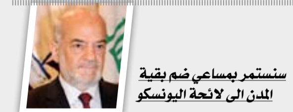
سنستمر بمساعي ضم بقية المدن الى لائحة اليونسكو