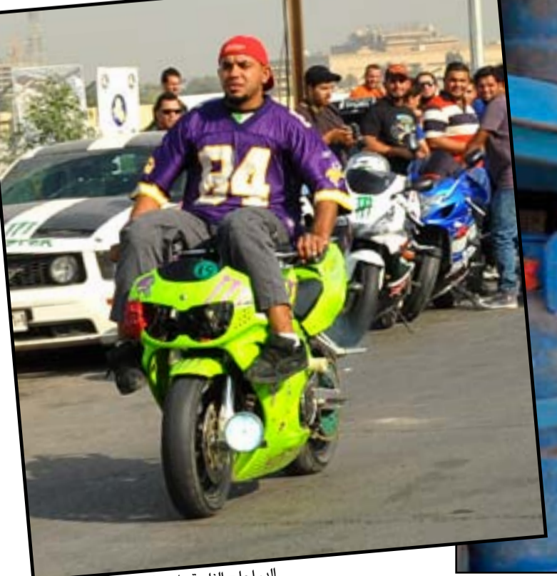
الدراجات النارية واصواتها المرتفعة