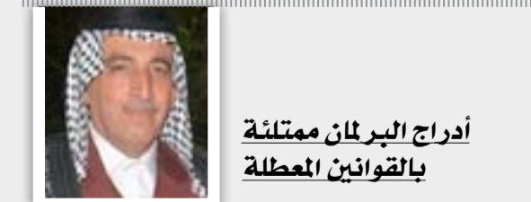
أدراج البرلمان ممثلثة بالقوانين المعطلة