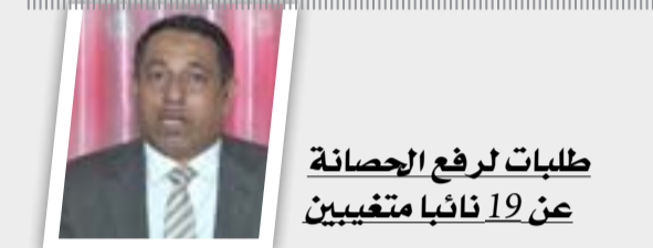
طلبات لرفع الحصانة عن 19 نائباً متغيبين

أكد وزير الخارجية ابراهيم الجعفري ان ادراج الاموار العراقية والاثار التابعة لها ضمن لائحة التراث العالمي سيوفر الحماية لها. وقال الجعفري إن "وزارة الخارجية ومنذ فترة تعمل مع الجهات الحكومية المعنية الاخرى على شمول الاموار والمدن الأثرية التاريخية تحت مظلة اليونسكو وهو ما يعني تأمين الحماية الدولية لها". وأضاف الجعفري أن "الدبلوماسية العراقية استثمرت كل الاجتماعات والحوارات الثنائية مع بلدان العالم المختلفة وكان نتاجهم جيداً إلى أن تكلت بالنجاح وتم التصويت على ادراج المواقع العراقية على لائحة التراث العالمي في ١٧ تموز". وأشار وزير الخارجية الى ان "الدبلوماسية العراقية والجهات المعنية ستواصل جهودها من أجل شمول بقية المدن التاريخية الأخرى وحصولها على الدعم الدولي".