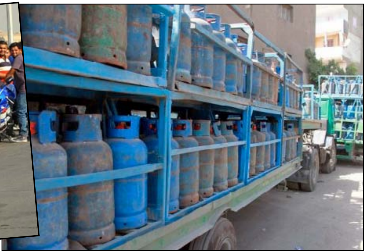
معرفة الغاز الصباحية وازعاجها الدائم