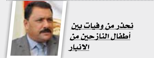
تحذر من وفيات بين أطفال النازحين من الانبار