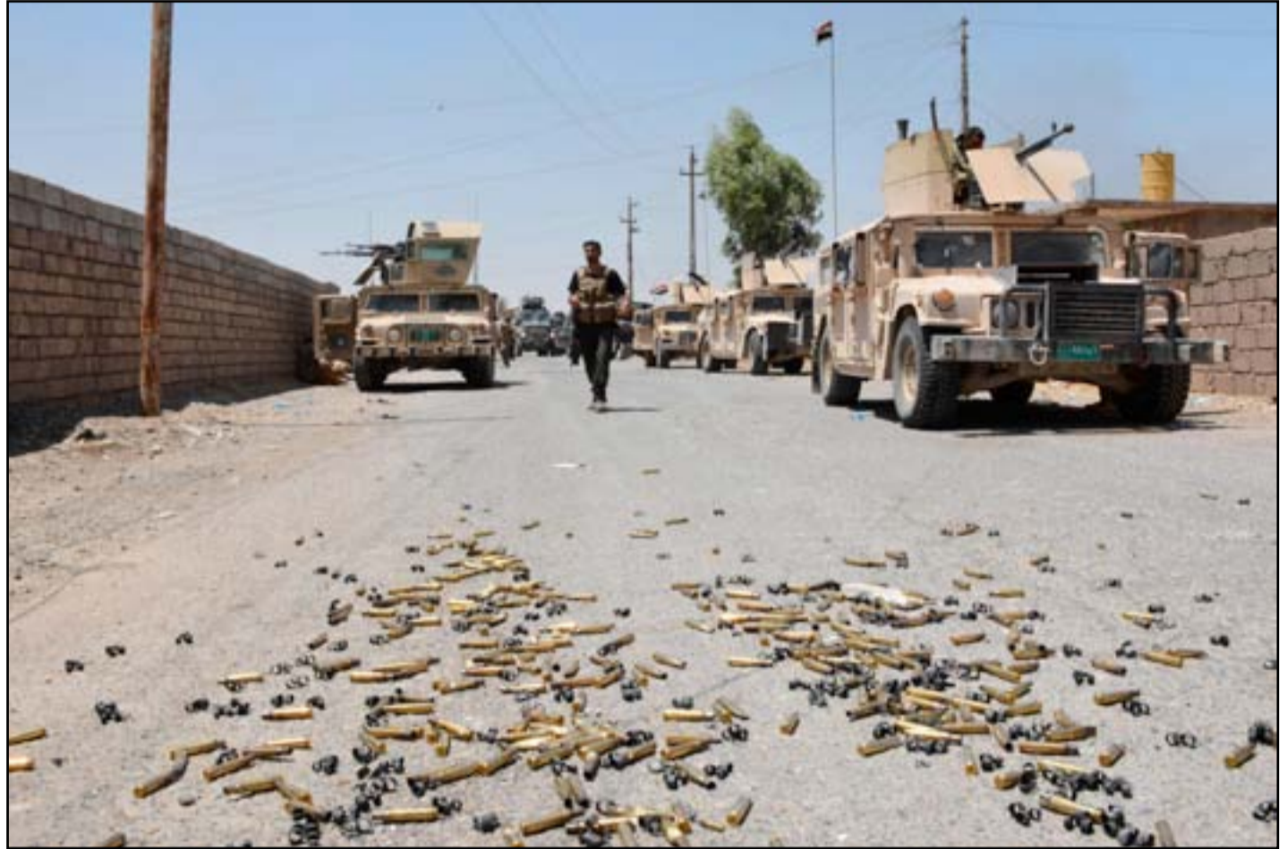
رتل عسكري في القيارة.

حيدر العبادي أعلن، في ٨ من تموز الجاري، تحرير قاعدة القيارة، جنوب الموصل، من سيطرة تنظيم داعش بالكامل. وكانت اللجنة الامنية في مجلس محافظة نينوى، أعلنت في الـ ٩ من تموز ٢٠١٦، دخول القوات المشتركة داخل قاعدة القيارة من دون قتال بعد هروب عناصر التنظيم. وقال اللواء الركن نجم الجبوري، في حديث الى (المدى برس)، إن تحرير ناحية القيارة ابرز معالقل تنظيم داعش يمثل قطع التمويل الوحيد