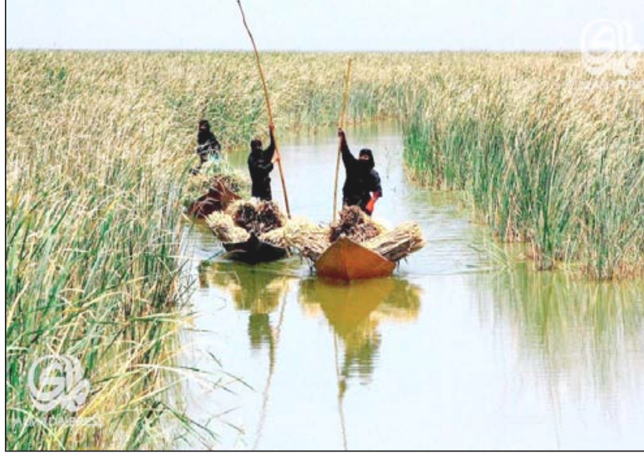
نساء يعملن في مجال الزراعة في أهوار ذي قار.. أرشيف

وأضاف الزبيدي أن "أهم ما لدينا الآن هو مسألة عدم إطلاق المياه للأهوار حيث يشكل ذلك تهديداً لها"، مستدرِكاً "لكن بعد أن أصبحت محمية دولية، فليس من حق العراق حبس