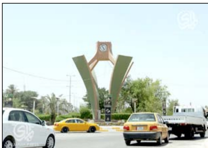
ساحة الساعة وسط مدينة الديوانية مركز المحافظة

□ الديوانية/ المدى برس كشفت محافظ الديوانية سامي الحسنواي، عن عزم الحكومة المحلية تفعيل قانون ٨٠ لسنة ١٩٧٠ لنقل ملكية أراضي وزارة المالية الى مديرية بلديات المحافظة، فيما أشار إلى ان تفعيل القانون سيحصر ملكية الأراضي "الأميرية" ضمن الحدود الإدارية للمحافظة، اكد سعي المحافظة لاستغلال تلك الاراضي عبر النهوض بالواقع العمراني والتنمية في الديوانية.