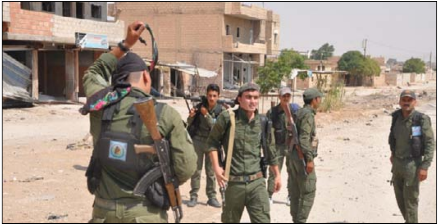
قوات سوريا الديمقراطية في الحسكة

إلى البلدة لطرد داعش منها والسيطرة عليها. واتهمت قوات كردية أمس الجيش التركي بقصف مواقع لهم قرب الحدود، كما اتهموا تركيا باغتيال قائد قوات مجلس جرابلس عبدالستار الجادر بعد ساعات من إعلان تأسيس المجلس. وقالت في بيان: "تابعنا البيان الذي نشر باسم