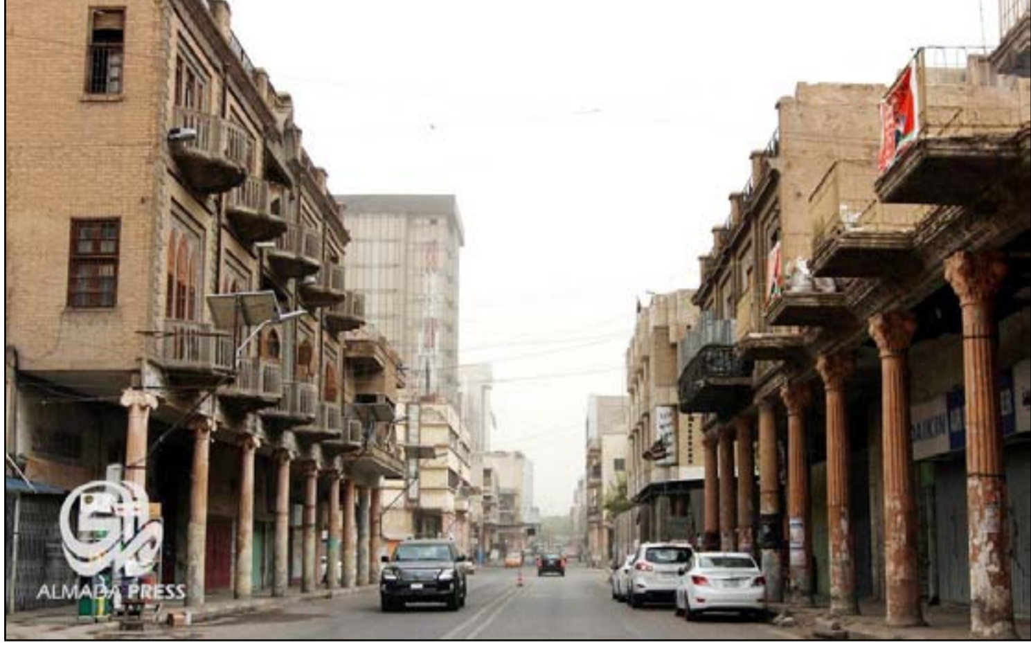
شارع الرشيد أحد أهم معالم بغداد التراثية

وانتمى إلى المدرسة السلطانية في (غلطة) ثم مضى إلى فيينا عاصمة النمسا ودرس في الأكاديمية القنصلية وبعد تخرجه من تلك الأكاديمية سافر إلى برلين ولندن ثم عاد إلى اسطنبول ونال إجازة الحقوق، وعاد في بداية عام ١٩٢٠ إلى بغداد فُعِن كاول وزير مالية للعراق وذلك في حكومة عبدالرحمن النقيب في آذار ١٩٢١. واحتفظ