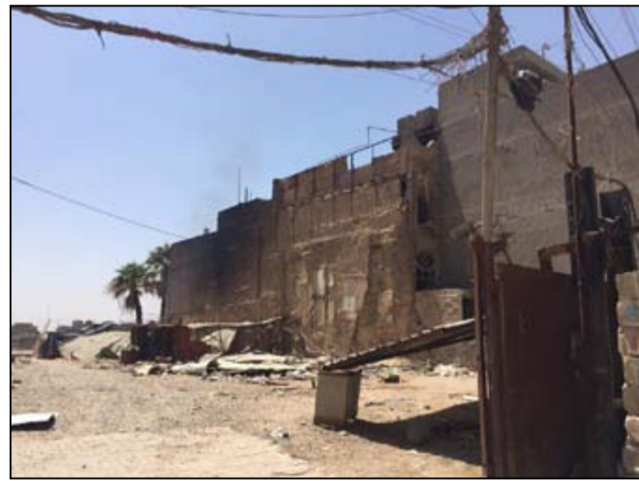
هذا ما تبقى من بيت ساسون حسقييل أول وزير مالية في العراق

يفترض أن من صميم عمل امانة بغداد هو المحافظة على بيوت بغداد التراثية، وفي خطوة أثارت