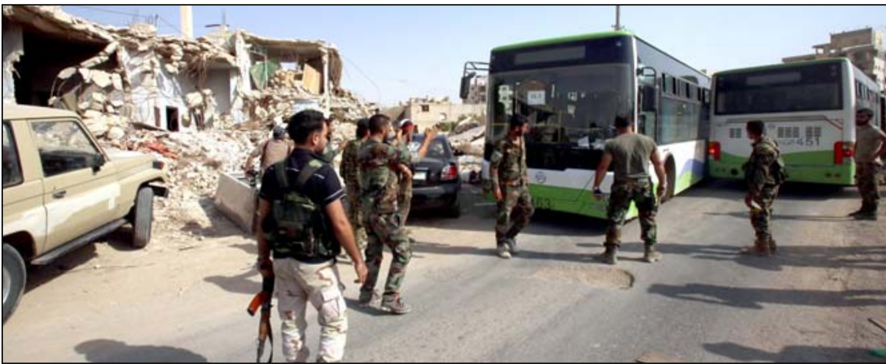
القوات السورية تحرس حافلة تقل الناس وذلك كجزء من عملية الاخلاء من بلدة داريا خارج العاصمة دمشق

وفي ختام محادثات أجراها لافروف مع نظيره الأميركي جون كيري في جنيف، قال الوزير الروسي إن الوثيقة سيتم عرضها على الرأي العام العالمي في وقت قريب. وأكد لافروف أنه ونظيره الأميركي قاما بعدد من الخطوات نحو الامام حول الأزمة السورية، وتوصلا إلى اتفاق حول العمل في اتجاهات محددة وتكثيف الاتصالات الثنائية بهذا الهدف. وجدد الوزير الروسي موقف موسكو القائل إنه لا يمكن ضمان الحفاظ على الهدنة في سوريا دون الفصل