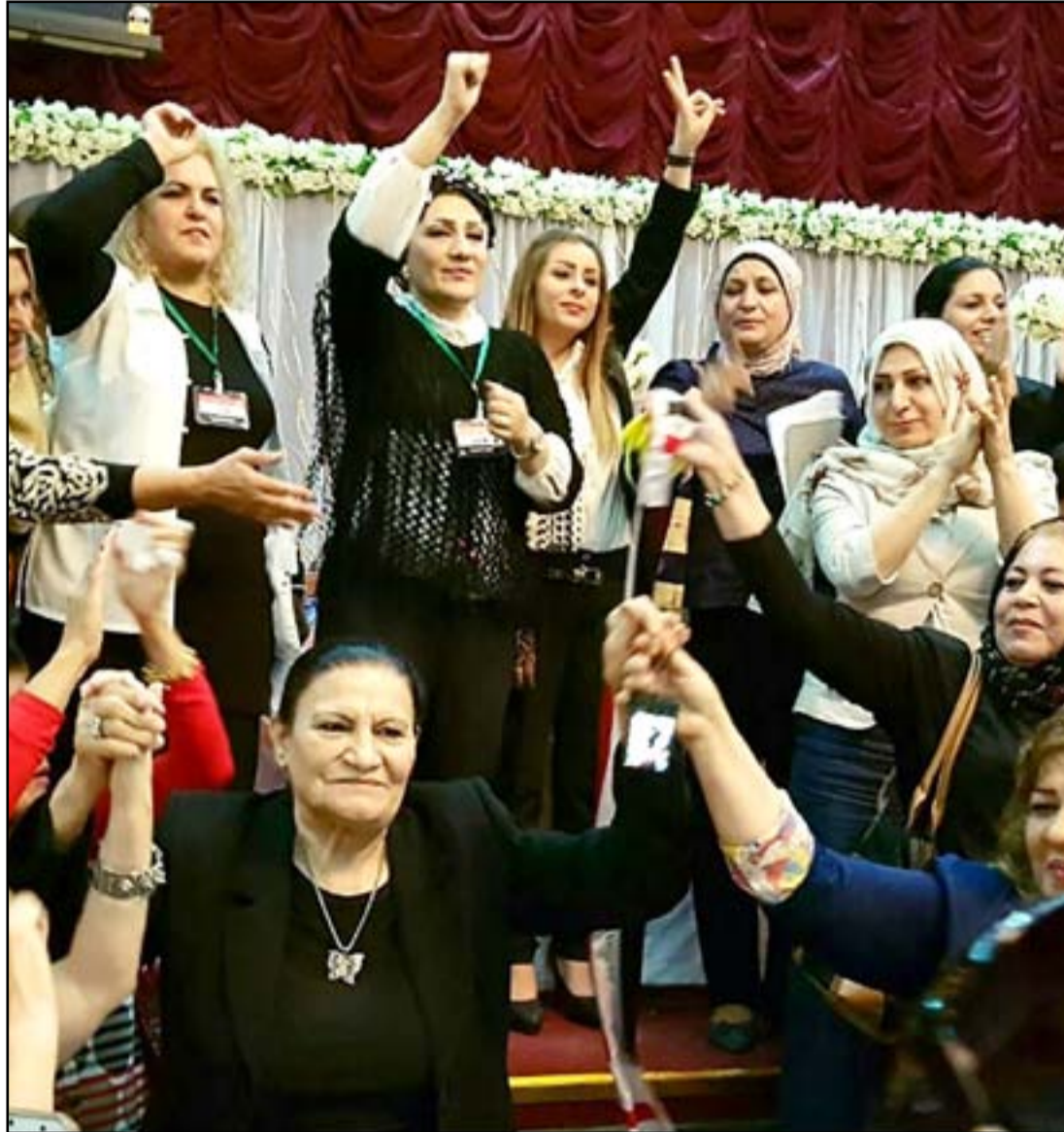
جانب من اختتام مؤتمر النساء المدنيات

أكدت نساء عراقيات رفضهن الواسع لـ "مظاهر تقييد حرية التظاهر والتعبير عن الرأي، فيما طالبن المرأة العراقية بأخذ دور أكبر في الحركات الاحتجاجية التي يشهدها البلد منذ عام. جاء ذلك خلال المؤتمر الأول للنساء المدنيات في بغداد، بحضور نحو 200 ناشطة وأكاديمية وابنة العراق انهضي).