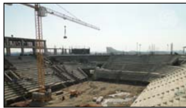
مشروع القاعة الرياضية شرقي بغداد الذي يتم انشائه من قبل شركة تركية

المشاريع الموكلة لهم"، مبيّناً ان "هذا الأمر سيساعد الشركات التركية في مواصلة عملهم في العراق". وأشار