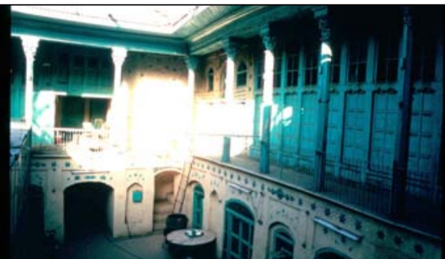
معبد الطائفة البهائية الذي هدم عام ٢٠١٣

مدينتي مثل بغداد تتمتع بكل مواصفات المدن السياحية التي يمكن ان تدر اموالاً لتعيد بناء وترميم وتأهيل كل بناها التحتية تترك للنهب والسلب من قبل هذا. الباحث البغدادي رفعت مرهون الصغار اكد في احدي محاضراته على اهمية بغداد وموقعها واهم الخانات والجوامع والشوارع