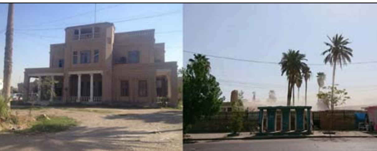
بيت ياسين الهاشمي قبل وبعد الهدم

مدينة مثل بغداد تتمتع بكل مواصفات المدن السياحية التي يمكن ان تدر اموالاً لتعيد بناء وترميم وتأهيل كل بناها التحتية تترك للنهب والسلب من قبل هذا. الباحث البغدادي رفعت مرهون الصغار اكد في احدي محاضراته على اهمية بغداد وموقعها واهم الخانات والجوامع والشوارع