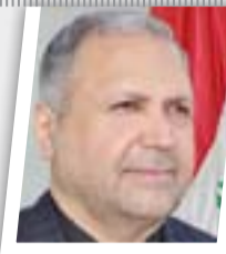
العراقيون يعيشون مؤامرة لا شغالهم عن حياتهم