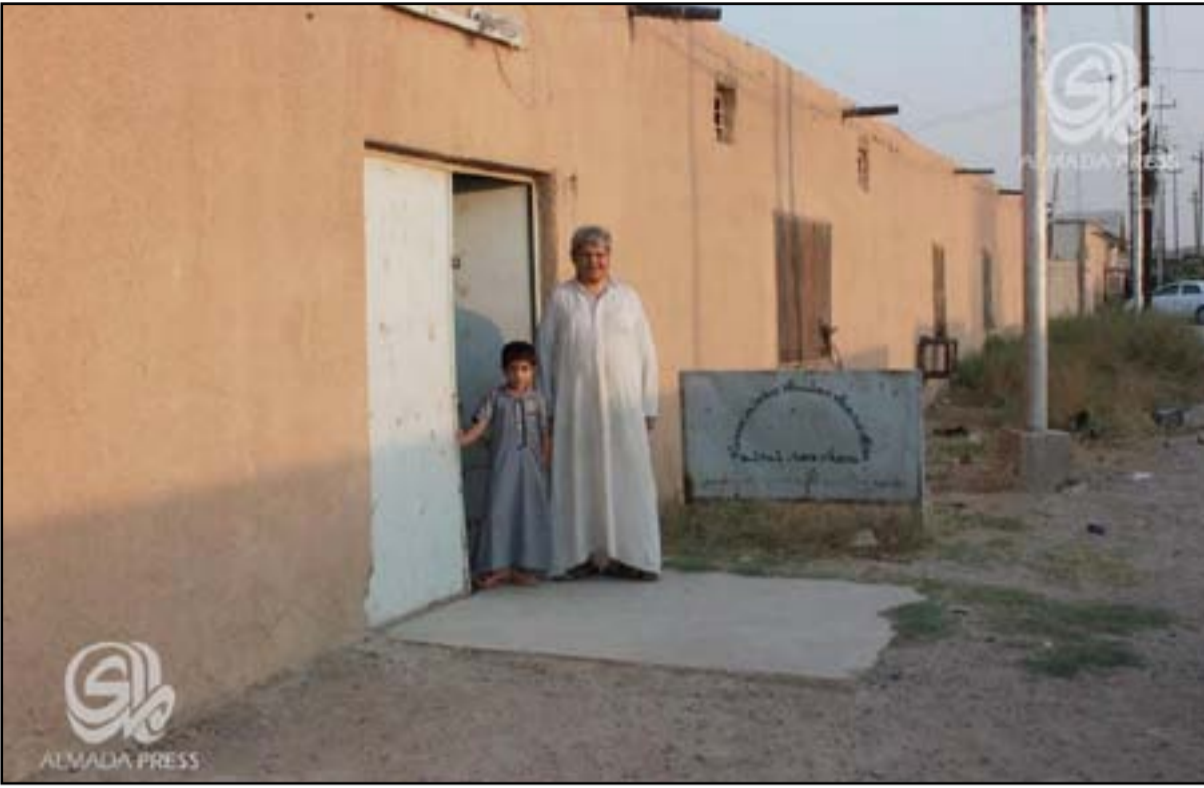
أحد النازحين الساكنين في كنيسة المشرق الأثرية