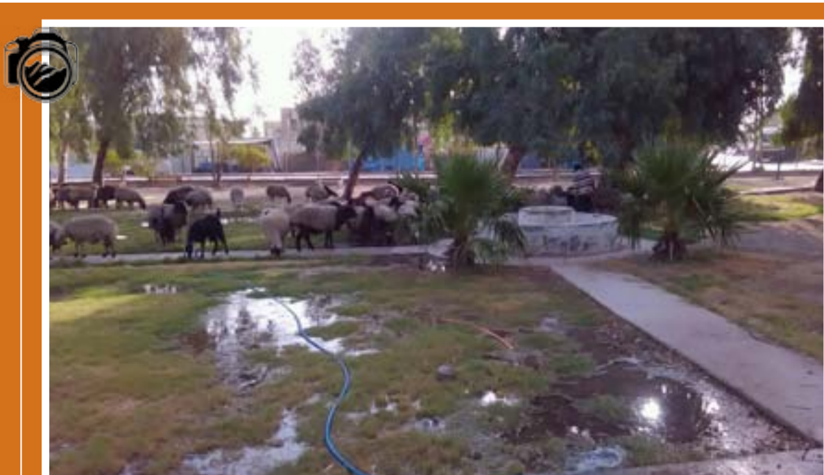
حديقة عامة في منطقة المهديا (الدورة) تتحول الى مرعى للأغنام

تستقبل المدى شكواكم من خلال هذه الزاوية اليومية وذلك على العنوان الالكتروني (Email: info@almadapaper.net) وكذلك على العنوان البريدي "جريدة المدى" - بغداد - شارع السعدون - خلف محطة تعبئة وقود السعدون