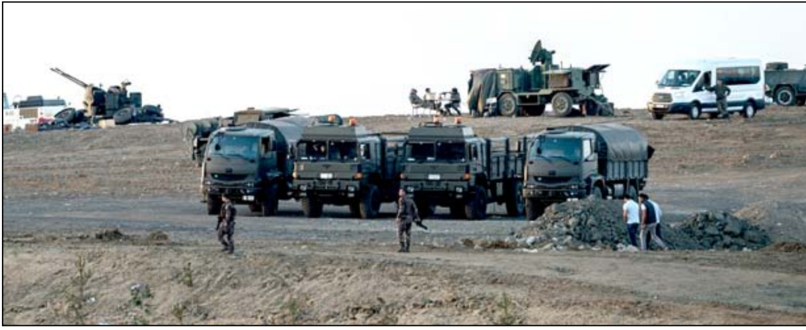
جنود أتراك في المدينة الحدودية السورية... أغلب

تنظيم داعش قبل أيام "عملية إعدام" مجموعة من المقاتلين الأكراد، كانوا في قبضة التنظيم. وحسب دراسة بريطانية نشرت نتائجها في وقت سابق هذا العام، فإن ٥٠ طفلاً بريطانيا يعيشون في المناطق الخاضعة لسيطرة داعش، وصولاً إلى هذه المناطق برفقة ذويهم. ويطلق التنظيم الإرهابي على الأطفال الذين يجندهم للقتال "أشبال الخلافة"، ويخضعهم لأفكاره المتشددة وتدريبات جسدية شاقة تتضمن حمل الأسلحة وإطلاق النار. وظهر على الأقل ١٢ طفلاً "جسداً" في أفلام التنظيم الدعائية التي تضمنت مشاهد إعدام معارضي التنظيم في سوريا والعراق.