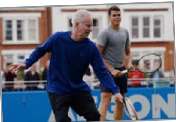
نيويورك / أف ب

فرض الأمريكي جون ماكرو الشراكة مع لاعب التنس الكندي ميلوس راونيتش بعد شهرين من العمل الثاني وفق ما ذكره المصنف الأول سابقاً على مستوى العالم.