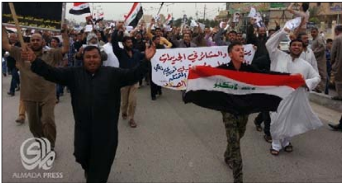
تظاهرة في محافظة النجف.. أرشيف