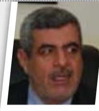
لن نسمح بتخفيض تقاعد اساتذة الجامعات

أعلن النائب عن محافظة ديالى رعد فارس الماس، عن وقف إطلاق النار بشكل كامل في مركز ناحية أبو صيدا بعد إعلان هدنة بين العشائر المتنازعة. وقال الماس إنه "تم وقف إطلاق النار في مركز ناحية أبو صيدا، وتم انتهاء كل المظاهر المسلحة بعد إعلان هدنة بين العشائر المتنازعة من أجل إيجاد حلول منطقية للمشاكل العالقة". وأكد النائب عن ديالى أن القوات المشتركة بدأت بالانتشار في مركز أبو صيدا من أجل بعث رسالة اطمئنان للأهالي وإعادة الحياة إلى مجراها الطبيعي بعد يوم صعب وقاس مروا به بسبب النزاعات العشائرية الدامية. وشهدت ناحية أبو صيدا، مساء الجمعة، اشتباكات عنيفة جدا وسط استنفار أمني شامل بسبب النزاعات العشائرية، فيما طالبت عدد من العشائر مدير الناحية بالاستقالة.