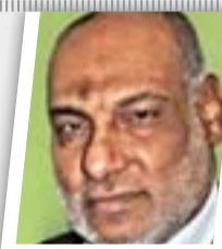
تمت تسوية التوتر العشائري في ناحية (أبو صيدا)

أكدت النائب عن جبهة الإصلاح نهلة الهبائي، أن النواب سيقدمون طعنا بالمادة الثامنة من قانون العفو العام في حال عدم تقديم العبادي الطعن. وقالت الهبائي إنه "من المقرر أن يقدم رئيس الوزراء حيدر العبادي طعنا بالمادة الثامنة من قانون العفو العام". وأضافت أنه "في حال عدم تقديمه للطعن، فإن النواب سوف يقدمونه". وكان الخلاف حول القانون يدور حول المادة 8، التي تسمح بإعادة النظر بملفات المحكومين بالمادة 4 إرهاب، إذا ما ادعوا انتزاع اعترافاتهم بفعل الإكراه أو بسبب المخبر السري. وأبدت أطراف داخل التحالف الوطني مخاوفها من أن تؤدي هذه الخطوة للإفراج عن مدانين بإعمال إرهابية عبر التلاعب بأوراق التحقيق. إلا أن مجلس النواب صوت بعد ذلك على القانون بعد إجراءات طيفية.