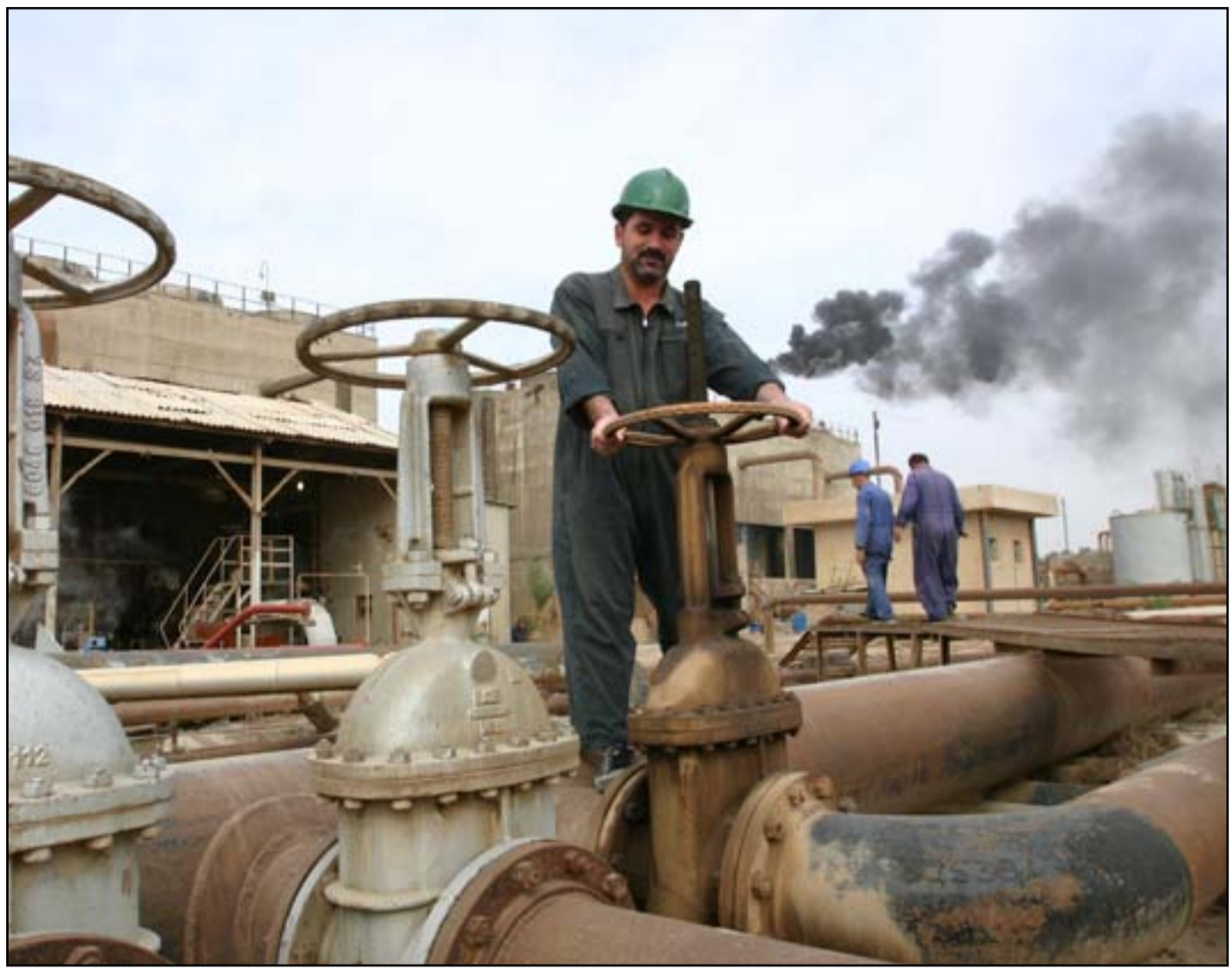
عمال في احد الحقول النفطية

ألف برميل في اليوم من النفط المنتج في محافظة كركوك عبر إيران. وقال مسؤول نفطي رفض ذكر اسمه ان أي إتفاق بين إيران والعراق يمكن ان يعمل بنفس أسلوب مفاوضات النفط بين طهران ودول بحر قزوين، حيث تقوم إيران بتوريد النفط العراقي الى مصافيها وتصدر كمية مساوية لنفطها الخام نيابة عن بغداد من الموانئ الإيرانية على الخليج. العراق لديه موانئ على الخليج لكنها غير مرتبطة بآنايب مع حقول كركوك. خلال الأسبوع الماضي إستأنفت شركة نفط الشمال الحكومية ضخ النفط