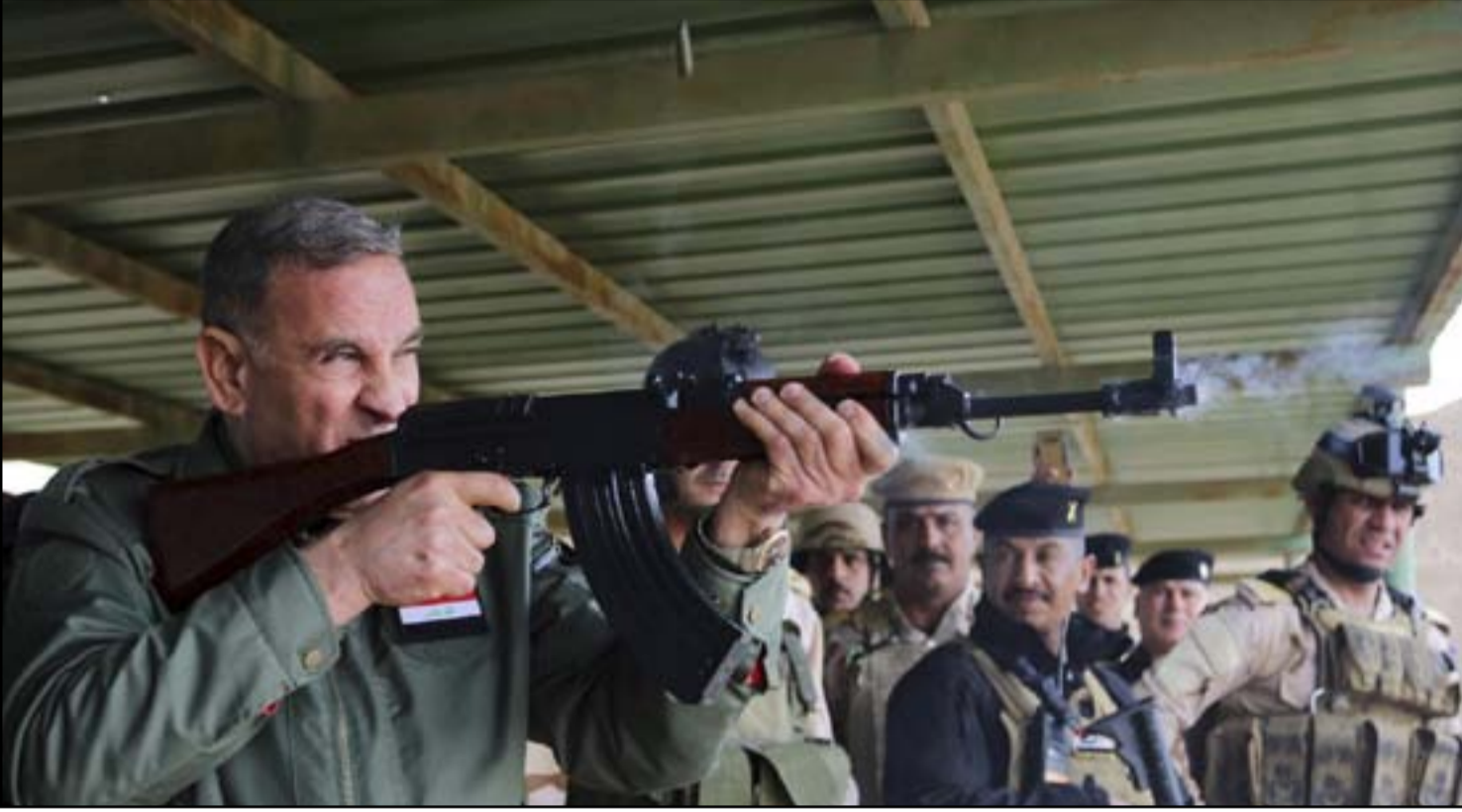
العبيدي خلال زيارته معسكر تحرير نينوى .. أرفيف

قدّم ائتلاف متحدون، أمس، طعنا لدى المحكمة الاتحادية بقرار مجلس النواب الخاص بسحب الثقة من وزير الدفاع خالد العبيدي. وكشفت عن نية رئيس الوزراء العبادي تكليف العبيدي بتولي وزارة الدفاع وكالة لحين تحرير مدينة الموصل.