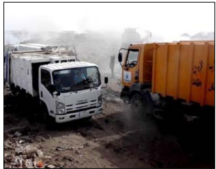
حرق النفايات خطر يهدد أهالي الديوانية