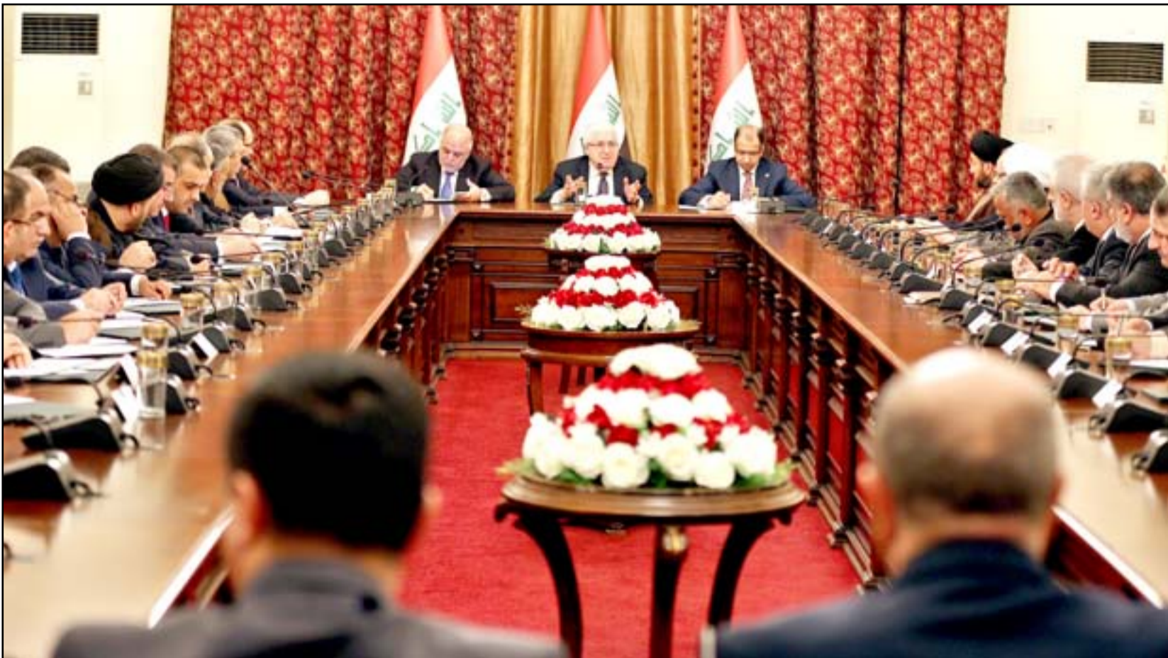
اجتماع الرئاسات الثلاث وقادة الكتل ..ارشيف.

يذكر ان المشروع، الذي طرحه الحكيم في أيلول العام الماضي، تضمن "تشكيل مجلس أعلى للإعمار"، بصلاحيات واسعة لإعادة بناء البلد وفتح آفاق الاستثمار على وفق خطط عملية، ويتم منحه كل الميزانية الاستثنائية.