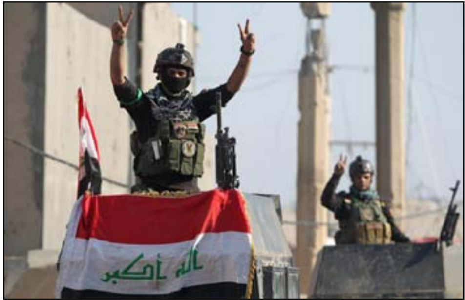
جنود في الرمادي

وقال رئيس الوزراء العبادي، في بيان نشر على موقعه الإلكتروني واطلعت (المدى) عليه، إن "تصراً آخر يتحقق في جزيرة الخالدية بهمة وشجاعة المقاتلين الشجعان وتضحيات الشهداء الابرار والجرى العياري يضاف الى سلسلة الانتصارات الكبيرة التي تحققت هذا العام". وأضاف القائد العام للقوات المسلحة "تلعن أبناء شعبنا الكريم انتهاء عمليات الخالدية بعد تحريرها بالكامل وقتل اعداد كبيرة من الدواعش والحق هزيمة منكرة اخرى بهم استمرارا لهزائمهم المتلاحقة التي كان آخرها في القيارة المحررة". بدوره، أعلنت خلية الاعلام الحربي، تحرير جزيرة الخالدية، شرقي الرمادي بالكامل. وقالت القيادة، في بيان لها، وتسلمت (المدى برس) نسخة منه، "نرف الانتصار الجديد الذي تحقق على أيادي أبطال الشرطة الاتحادية والحشد الشعبي بإسناد الفرق الثامنة والعاشرة والـ١٤ للجيش العراقي، وشرطة الأنبار، فضلاً عن القوة الجوية وطيران الجيش، حيث تم تطهير كامل جزيرة الخالدية"، مؤكداً أن "القوات المشاركة استبسلت في القتال حتى تطهرت كامل مناطقها". وكانت قيادة العمليات المشتركة، قد أعلنت، في ٣٠ من تموز الماضي، عن انطلاق عمليات تحرير جزيرة الخالدية، من سيطرة تنظيم داعش.