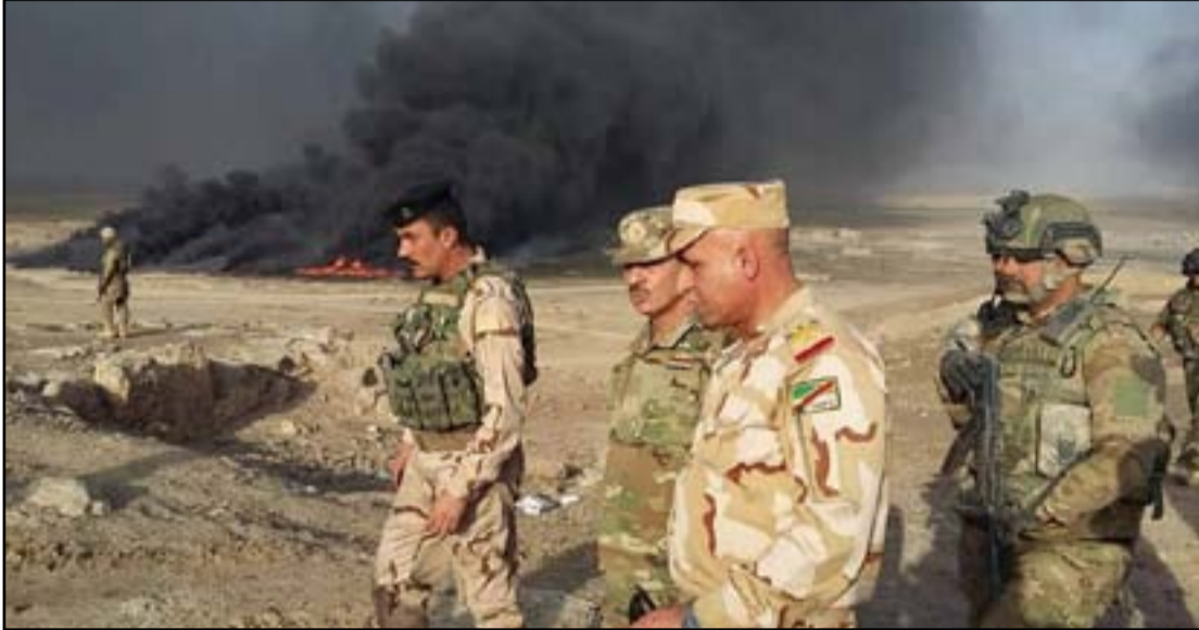
جنود في القيارة...أرشيف.

وتتمكنت القوات العراقية من دخول القيارة بعد قصف عنيف على مركز المدينة استمر ٤٨ ساعة. ورصد مراقبون انتشاراً كثيفاً لجنح مقاتلي داعش في شوارع المدينة، مشيرين إلى ان اغلب القتلى هم من اهالي الناحية.