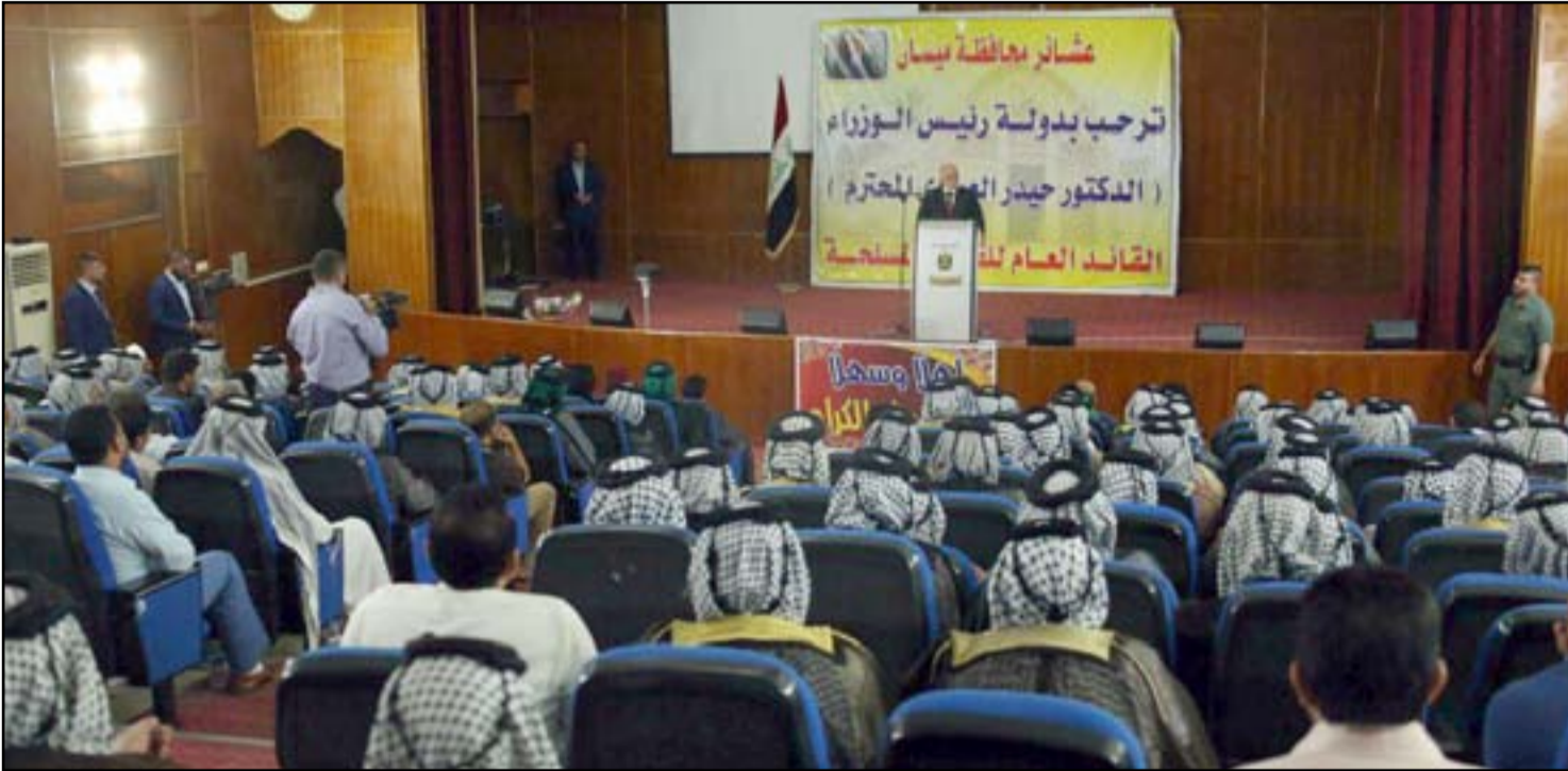
لقاء العبادي بعشائر ميسان أمس

وأدى العبادي، خلال اجتماعه بالحكومة المحلية، استعداده لإرسال قوات إضافية لتعزيز الأجهزة الأمنية في المحافظة. ووصل رئيس الوزراء حيدر العبادي، صباح أمس الأربعاء، إلى محافظة ميسان لمناقشة الملف الأمني والمشروع الاستثمارية في المحافظة مع الحكومة المحلية. وكان في استقبال العبادي كل من رئيس مجلس محافظة ميسان منذر رحيم الشواي وعدد من أعضاء المجلس. وكان وفد من محافظة ميسان ترأسه المحافظ علي دواي، قد زار بغداد، مطلع الشهر الحالي، والتقى رئيس مجلس الوزراء. وضم الوفد الميساني كلا من نائب رئيس مجلس المحافظة، ورئيس لجنة الطاقة/ النفط والغاز، ورئيس اللجنة القانونية، واللجنة العشائرية، والمعاون الفني والمستشار الفني للمحافظ. وناقش الوفد العديد من المواضيع، منها المحوران الأمني والخدمي.