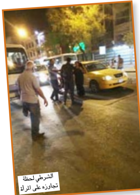
الشرطي لحظة تجاوزه على المرأة

في تمام الساعة ١٠:٢٥ من يوم الجمعة الماضي الموافق ٢٠١٦/٩/٢ كان طابور السيارات قد امتد لعشرات الأمتار لتجاوز سيطرة الراهبات بعد الخضوع للتفتيش المفرط، وسط الطابور كانت ثمة امرأة رضى بها الزمن ان لا تستعطي من السيارات المارة، على مقربة منها منتصب أمني في السيطرة، يطلب منها ان تعاد الحديث معه لكنها ترفض، عاود الأمر عليها فرفضت ايضا وسط انتباه المارة وراكبي السيارات، وفي لحظة خاطفة قام المنتصب بسحب المرأة التي تدفع عربة بداخلها طفل، فما كان منها إلا ان نهزت ودفعت يده عنها، وأمام مرأى الجميع قام المنتصب بضرب