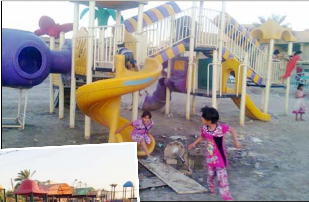
ملاعب أطفال مهملة