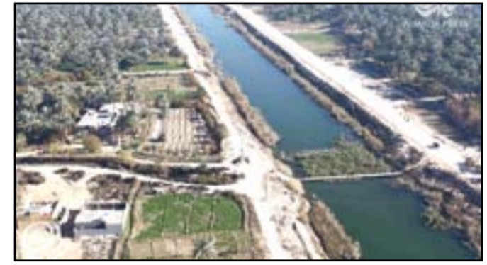
مناطق زراعية تقع بالقرب من مدينة الحلة

المشاريع وتقديم الخدمات الضرورية في المحافظة، مركزها الحلة، وأشارت إلى أن وزارة المالية لم تصدق موافقتها حتى الآن على فتح أقسام مالية لل إيرادات برغم الزامها بذلك من قبل رئيس مجلس الوزراء حيدر العبادي،