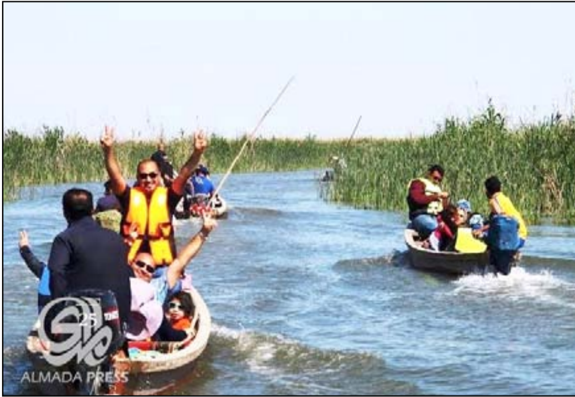
مجموعة من السياح في أهوار الجبايش في محافظة ذي قار

متخصصون يدعون لتوفير الأموال لموازنة 2017 لتطوير الواقع الخدمي في الأماكن السياحية