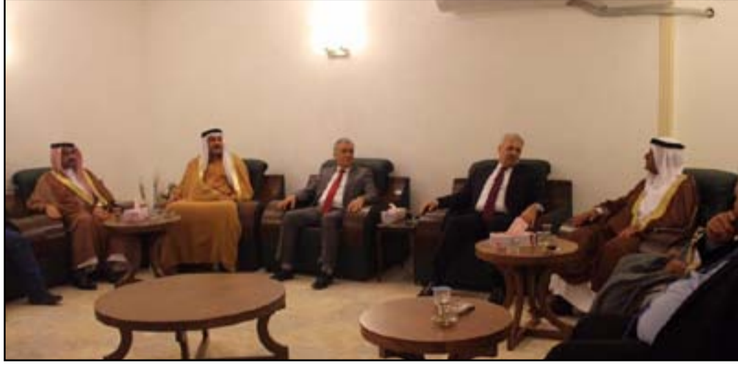
اجتماع النجيفي ووفد من عشائر نينوى

وفي سياق آخر، بحث النجيفي مع وفد من شبوح عشائر غرب الموصل معركة