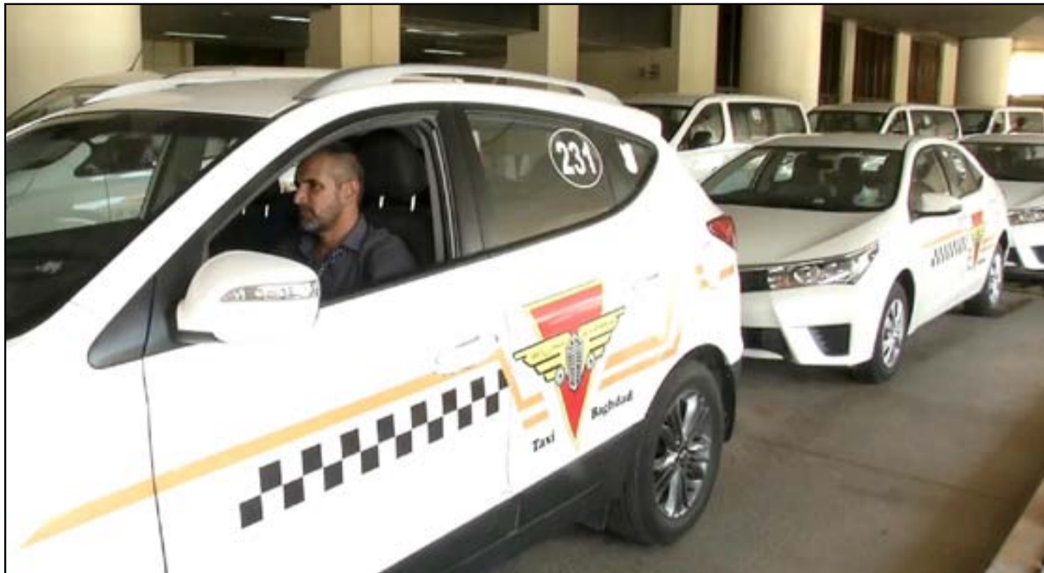
سيارات ضمن تكسي بغداد الخاص بنقل المسافرين من وإلى مطار بغداد الدولي

وأكد وزير النقل، أن "وزارة النقل لا تقف بوجه المستثمر ولا تريد الإضرار بمصالحه الشخصية، لكنها لا تسمح لأي كان باستغلال ظروف المواطن العراقي لصالحه"، لافتا الى، أن "الوزارة ترى ان الغاية الوطنية توجب على الجميع تقديم أفضل الخدمات وأبسط التسهيلات للمواطنين".