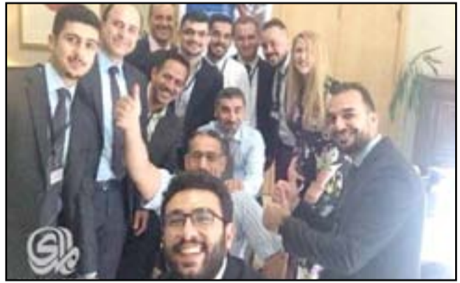
مجموعة من الطلبة العراقيين المقبولين ضمن برنامج تشفينغ البريطاني

تنافسوا مع مقدمين آخرين من جميع انحاء العراق من اجل الحصول على تشفينغ، والذي يتيح للمقبولين العيش والدراسة في المملكة المتحدة لمدة عام". وأضافت ان "طلاب تشفينغ لهذا العام