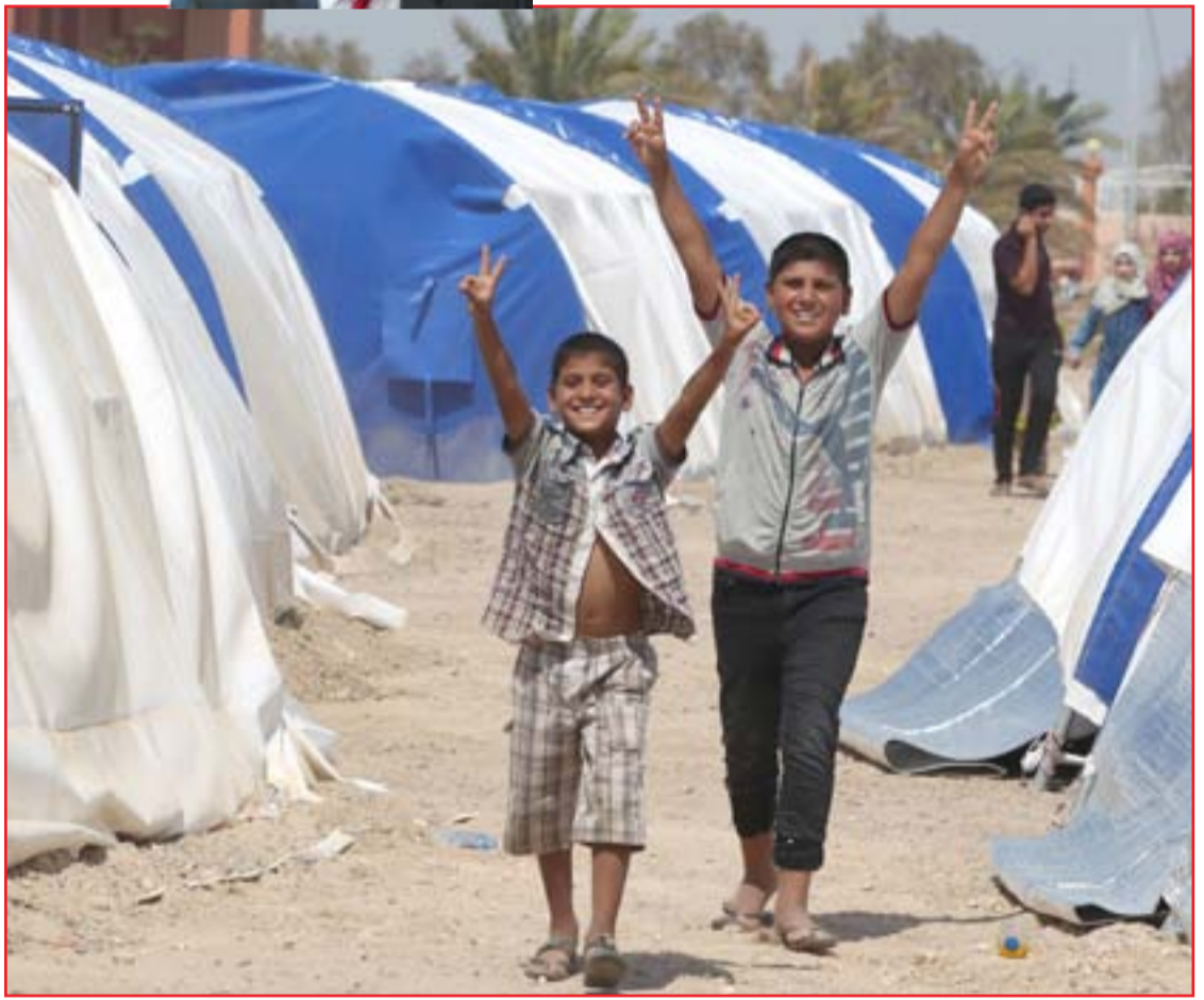
نازحون من الفلوجة في مخيم عامرية الفلوجة.. أ.ف.ب