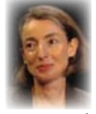
تأليف: إيما سكاى