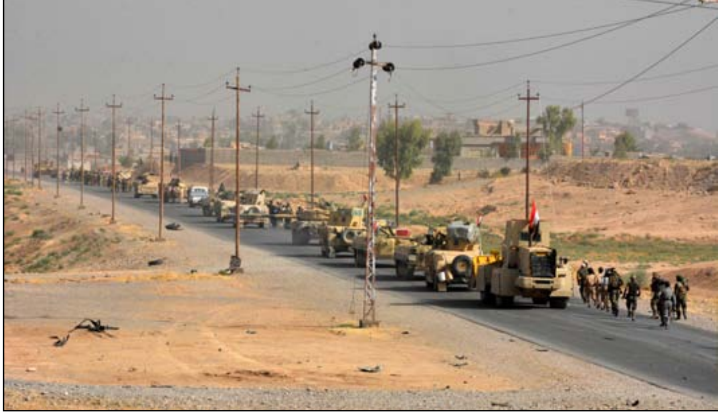
رتل عسكري جنوب الموصل..

إذا تمت استعادة الموصل، فإن ذلك سيكون بمثابة تحول كبير في الحرب