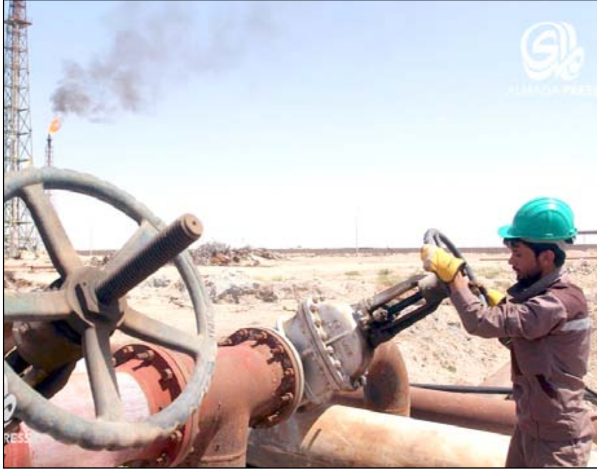
توقعات بارتفاع أسعار النفط العالمية

وتابعت الـ وول ستريت، أن "أسعار النفط كانت قد هيبت بنسبة ٤ بالمئة الجمعة الماضية (٢٣ أيلول الحالي) بحسب بورصة نيويورك، وذلك بعد أن صرحت السعودية بأنها لا تتوقع توصل أعضاء أوبك والدول الأخرى المنتجة للنفط، مثل روسيا، إلى اتفاق لتجميد معدلات الإنتاج عند اجتماعهم، يوم غد الأربعاء، على هامش أعمال منتدى الطاقة الدولي المنعقد في الجزائر".