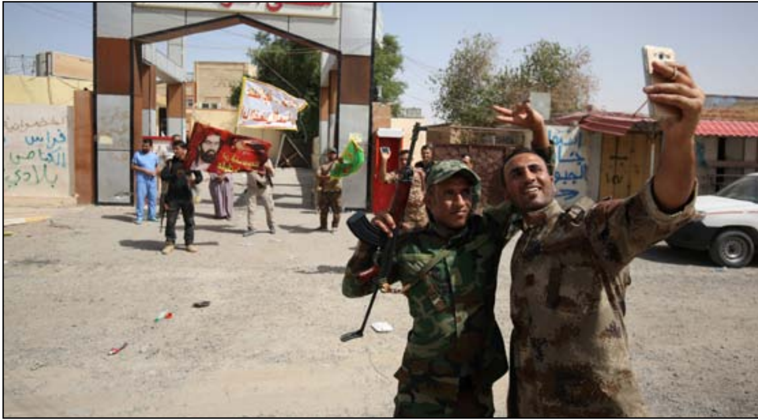
جند يحتفلون أمام مستشفى الشراف...