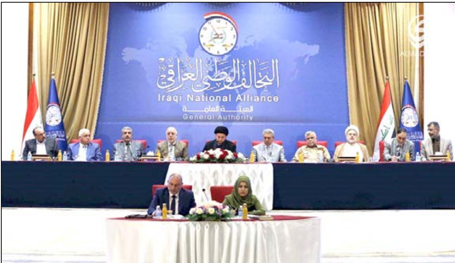
اجتماع قادة التحالف الوطني

وخلال كلمته أمام الهيئة العامة للتحالف الوطني، ذكر الحكيم بأن "التحالف يعتبر الكتلة الأكبر"، مشدداً على أهمية "تحويل الأغلبية العديدة إلى أغلبية قرار". وأشارت هذه التصريحات أمام تحالف القوى، معتبرة إياها استبدالاً لـ "الشراكة الوطنية" بدكتاتورية الأغلبية، وطالب الأخير بتوضيح موقفه. وذكر بيان لمكتب رئيس التحالف الوطني، تلقت (المدى) نسخة منه أمس الإثنين، أن الأخير أكد خلال ترؤسه اجتماع الهيئة العامة للتحالف، التي حضرها نواب التحالف الوطني في مجلس النواب والوزراء والمحافظون،