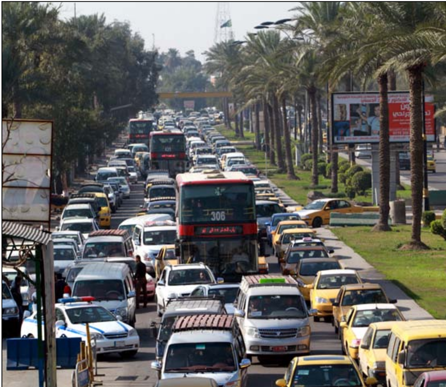
ازحامات تملأ شوارع العاصمة

عزت مديرية المرور العامة، أمس الاثنين، الاختناقات المرورية التي تشهدها العاصمة منذ يومين الى وجود "خطر" يهدد امن المواطنين وقدم شبكة الطرق فيها، وفيما أكدت أن تلك الاختناقات "الطبيعية" مستمرة لحين ورود معلومات تؤكد "زوال الخطر" عن العاصمة، كشفت عن عزم قيادة العمليات تنفيذ "خطة جديدة" لتخفيف الزخم عن جسر الجادرية.