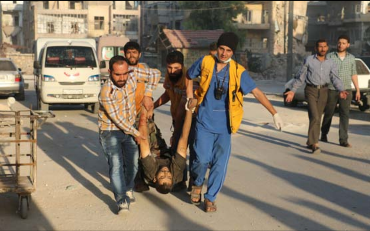
عمال الانقاذ يحملون جثمان ضحية بعد الغارة الجوية التي أعلن عنها في حلب...

الكركملين يرفض تصريحات واشنطن ولندن حول سوريا ويحذر: "داعش" يُنظم صفوفه المعلم: وقف إطلاق النار قابل للتنفيذ وروسيا تؤكد: الغرب لا يضي بالتزاماته