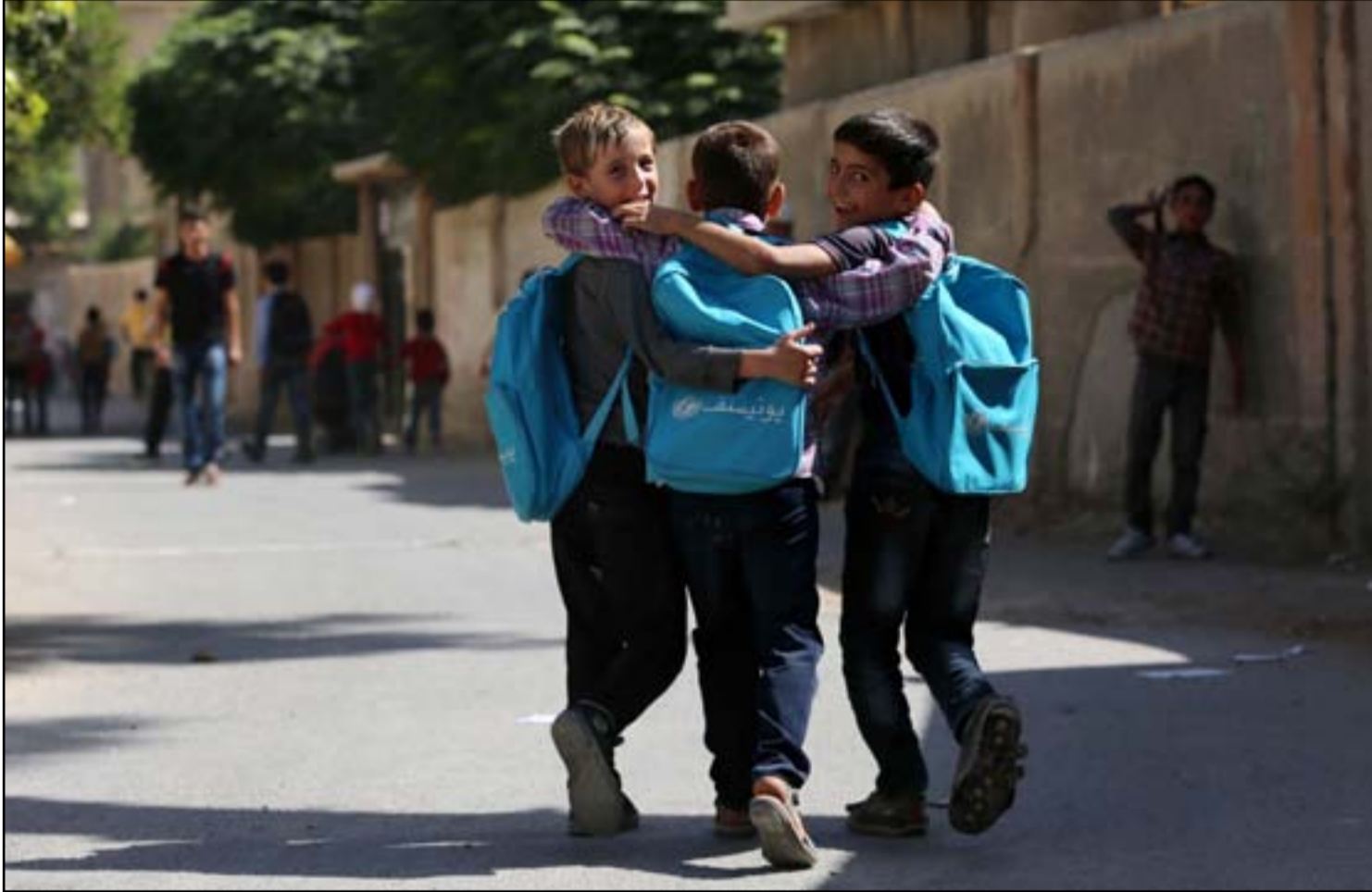
أطفال سوريون في طريقهم إلى المدرسة بعد توزيع القتراسية المدرسية شرق الغوطة، على مشارف العاصمة دمشق..

روسيا: أميركا مستعدة لعقد صفقة مع الشيطان لإسقاط الأسد