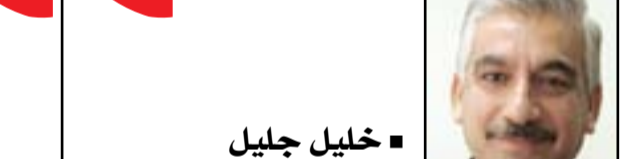
■ خليل جليل