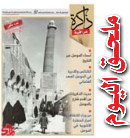
أسماء الموصل عبر التاريخ