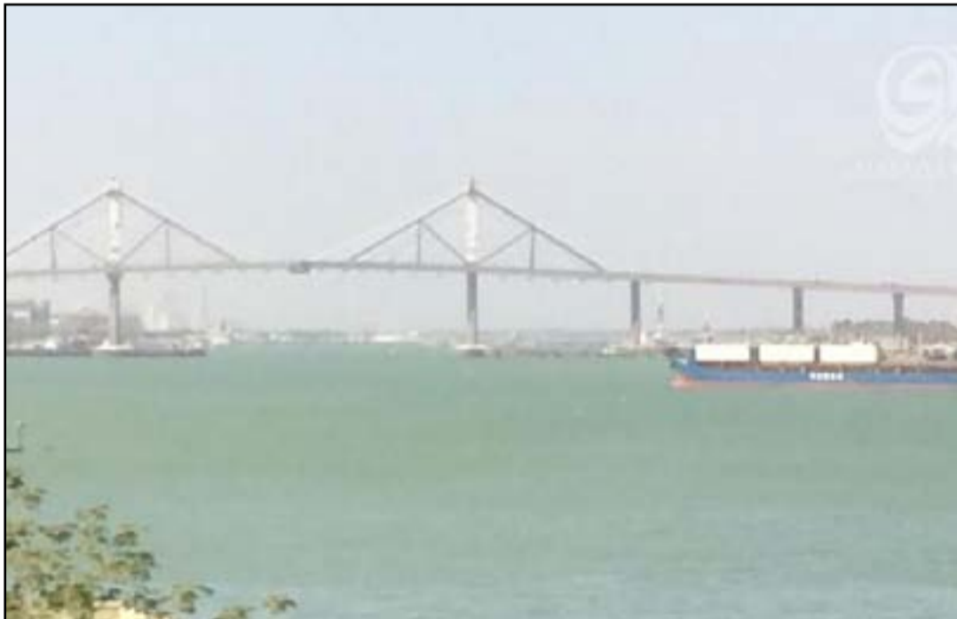
جسر محمد الصدر على شط العرب

الدخول كونهما ضمن الجهات المعنية المرتبطة بالعاصمة، لتسهيل الإجراءات للمستثمرين وتشجيعهم". ووقعت هيئة استثمار البصرة، نهاية أيلول 2016، خمسة عقود استثمارية بقيمة 64 مليون دولار تشمل عدة قطاعات. من جهتها، وصفت لجنة الإعمار في مجلس المحافظة، الجسر المعلق على شط العرب أنه "الأطول والأعلى" في العراق، والثاني