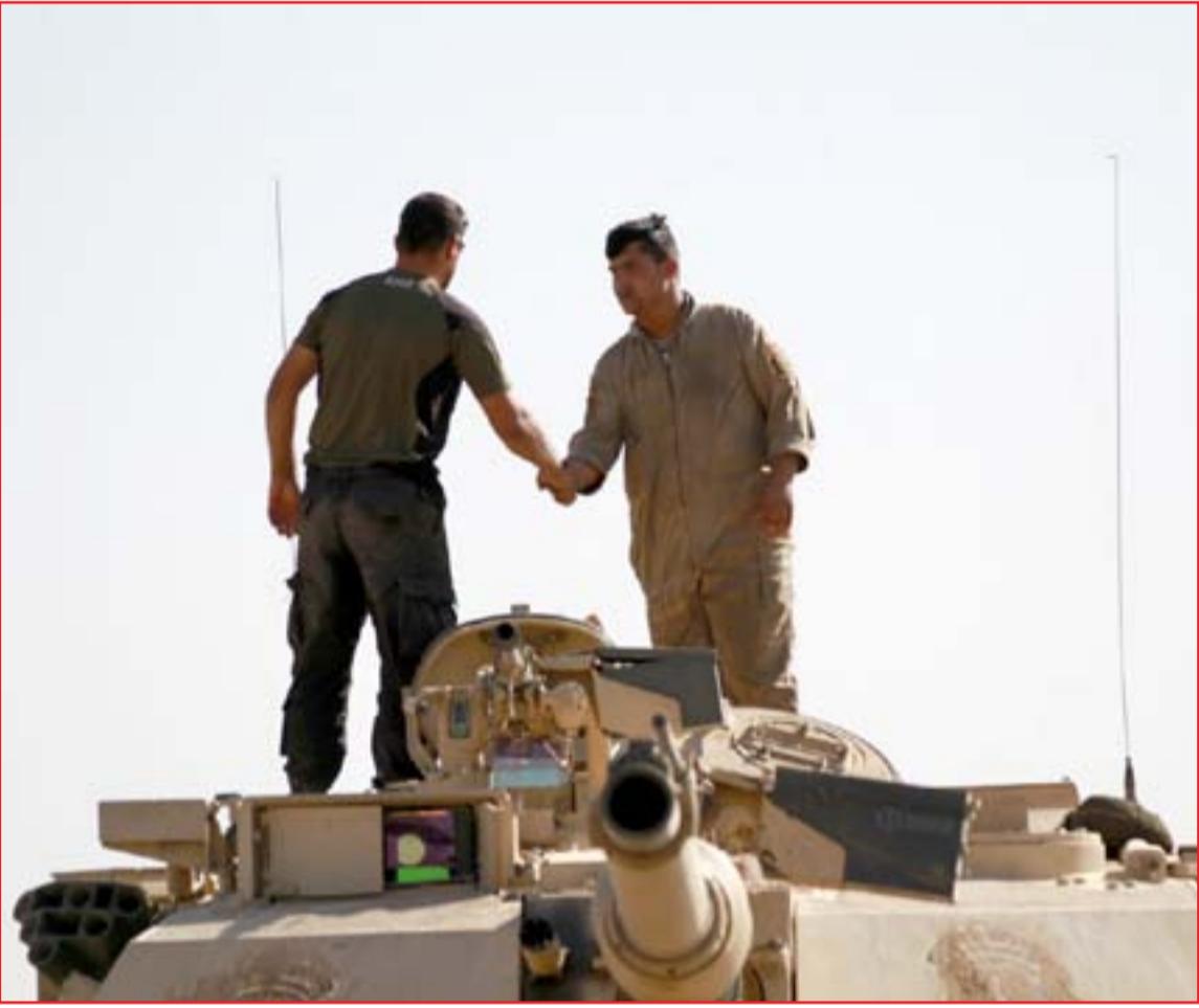
جنديان يتصافحان بعد الانتهاء من تحرير برطلة

داعش تضرب في الرطبة.. والأنبار تطلب تعزيزات فورية من بغداد