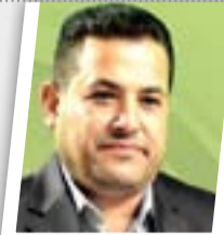
داعش يهاجم الرطبة لاريك عمليات الموصل