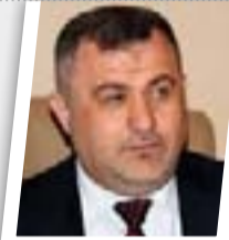
منع الخمر سيدخل العراق في عزلة دولية

اعتبر رئيس كتلة بدر النيابية قاسم الأعرجي هجوم "داعش" على قضاء الرطبة بأنه خطة أصبحت مكشوفة لعرقلة تحرير الموصل، مؤكداً ضرورة إرسال تعزيزات للقضاء. وقال الأعرجي إن "هجوم تنظيم داعش على قضاء الرطبة من ثلاث محاور خطة أصبحت مكشوفة لعرقلة تحرير الموصل"، مشدداً على "ضرورة الاستمرار في تنفيذ خطة تحرير الموصل وإعطائها الأولوية وعدم التأثر بالهجمات الإرهابية على بعض الأحياء والنواحي في المحافظات الأخرى". وأكد رئيس كتلة بدر "أهمية إرسال تعزيزات إلى قضاء الرطبة والقضاء على كافة العناصر الإرهابية هناك، مشيداً بالنضحيات الجسيمة التي يقدمها أبطال الأجهزة الأمنية وتقديم قوافل من الشهداء في سبيل حرية ووحدة وكرامة العراق".