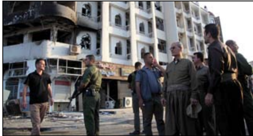
محافظ كركوك يتجول وسط المدينة...

وقال نجم الدين كريم لـ(المدى برس) أن "الوضع الأمني في كركوك أصبح مستقرًا جداً وتم القضاء على معظم عناصر داعش في مركز مدينة كركوك وتمت معالجة اللقطة القليلة المتبقية في الأحياء الجنوبية". وكشف كريم عن وجود ٦٠ جثة لعناصر داعش بالطب العدلي فيما توجد الكثير من الجثث في المناطق التي حصلت فيها اشتباكات مع عناصر داعش، مشدداً على أن "الحياة ستعود إلى طبيعتها خلال ساعات وسيتم فتح جميع السيطرات التي تضر بكركوك مع بغداد".