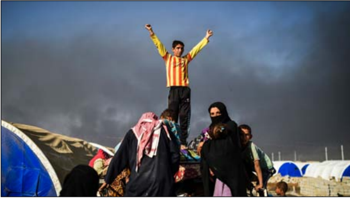
عوائل نازحة في القيارة... أ.ف.ب

وأضاف الزملي أن "محاور الشورة والقيارة تم تطويقها بشكل كامل إضافة إلى محور مخمور، وهناك تقدم كامل للقطعات وهي كافية لمسك الأرض كما تم تحديد القطعات التي ستسلك الأرض بعد التحرير"، مؤكداً أن "معركة الموصل محسومة مبدئياً". وتابع رئيس لجنة الأمن البرلمانية إن "قطعات البيشمركة باشرت الدخول إلى بعشيقية وسيتم إعلان تحريرها خلال يومين"، لافتاً