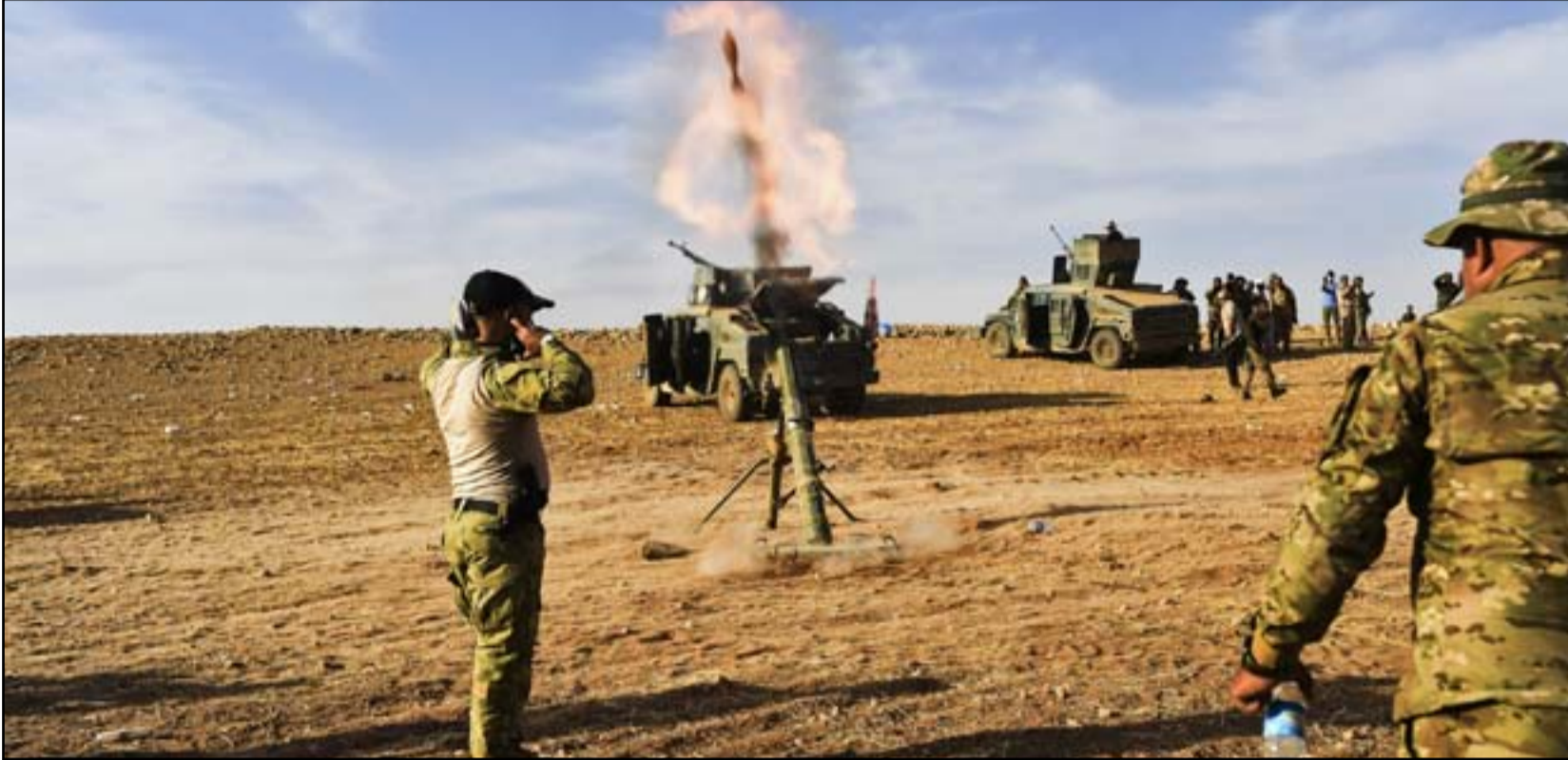
قوة عسكرية جنوب الموصل..