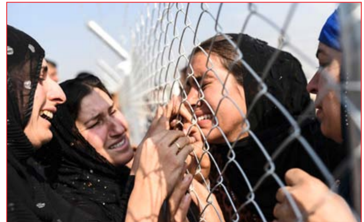
موصليات يلتقن بأقاربهن النازحات الى معسكر الخازر...