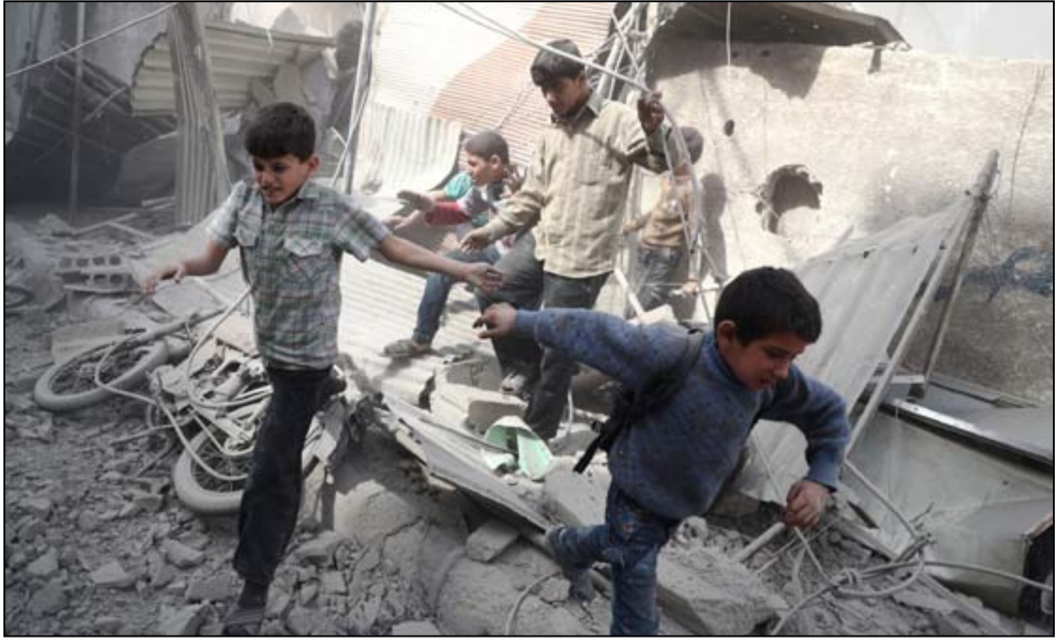
هروب أطفال سوريين عقب الضربات الجوية في العاصمة السورية دمشق.. أ.ف.ب

المتحدة لتحرير الموصل من "داعش" قد تؤثر كثيرا على ميزان القوى في سوريا. واعتبر الوزير الروسي أن فرض عقوبات غير مشروعة على سوريا سيضر السكان المدنيين، مشيراً إلى أنه "لا بد من الحل السياسي للحرب السورية، وشدد على أن سلاح الجو الروسي لم يشن ضربات جوية في حلب خلال الأيام العشرة الماضية. من جهة أخرى، قال وزير الخارجية السوري وليد المعلم، إن التحالف الدولي بقيادة الولايات المتحدة يشجع مسلحي تنظيم "داعش" على الانتقال من العراق إلى سوريا.