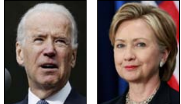
المحتملة التي كانت هي نفسها وزير للخارجية، ولم تخبر الخيار الأكثر أهمية للرئيسة الفوز بالانتخابات، وربما يكون

كلينتون أو مساعدها بايدن بالترشيح بعد. ووفقاً للصحيفة، فإن الاستراتيجية الحالية هي كيفية تقديم هذا الطرح لبايدن الذي كان على وشك أن يترشح هو نفسه لمنافسة هيلاري كلينتون في السباق التمهيدى للحزب الديمقراطي. وقال مصدر بحملة هيلاري للصحيفة، أن بايدن سيكون عظيمًا في المنصب، وهم يقضون وقتاً طويلاً لاستكشاف أفضل الطرق لمحاولة إقناعه بالمنصب في حال فوزها.