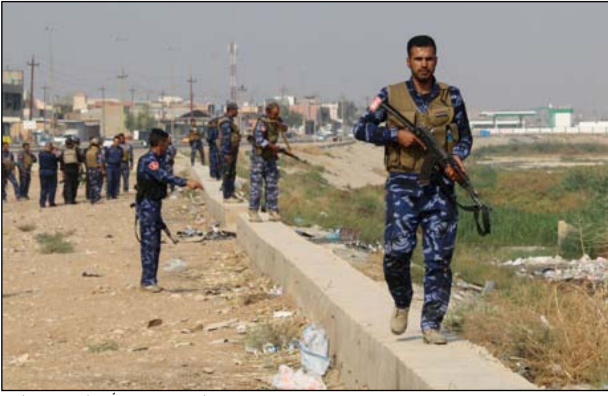
امن كركوك يلاحقون المسلحين الأسبوع الماضي.. أغلب

يذكر أن قائممقام قضاء داقوق أعلن، الجمعة قبل الماضية، مقتل واصابة ٦٥ امرأة بـ"قصف مقاتلات عراقية" لمجلس عزاء حسيني داخل إحدى الحسينيات. ووصل وفد من التيار الصدري، امس إلى كركوك، بعد اسبوع من تعرض المدينة الى هجوم شرس شنه المئات من عناصر داعش. وقال صلاح العبيدي، رئيس الوفد والمتحدث باسم زعيم التيار الصدري، إن "زعيم التيار الصدري مقتدى الصدر حملنا سلامه وتحياته لمواطني وادارة كركوك وبيلغكم تعازيه لعوائل الشهداء وحيّاً موقف اهالي كركوك البطولي