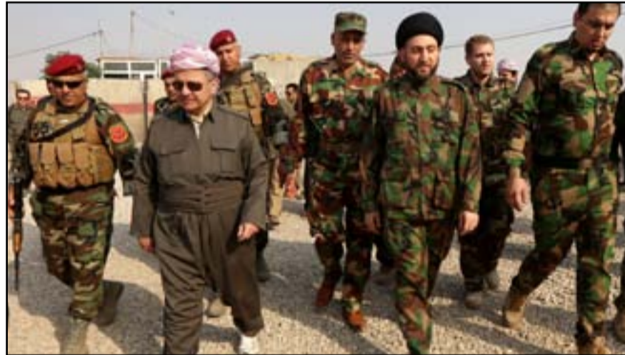
بارزاني والحكيم في محور الخازر

أكد رئيس إقليم كردستان مسعود بارزاني أن قوات البيشمركة لن تدخل مدينة الموصل. وفيما أشار الى أن قوات البيشمركة المتواجدة في الجبهة كافية لسد الحاجة، أكد أن الهجوم الذي شنّه عناصر تنظيم داعش على مدينة كركوك جاء لتغطية فشله وهزيمته في المعركة الكبرى. وقال بارزاني، خلال مؤتمر صحافي مشترك مع رئيس التحالف الوطني عماد الحكيم عقده في محور الخازر، وتابعته (المدى برس)، إن "قوات البيشمركة لن تدخل مدينة الموصل".