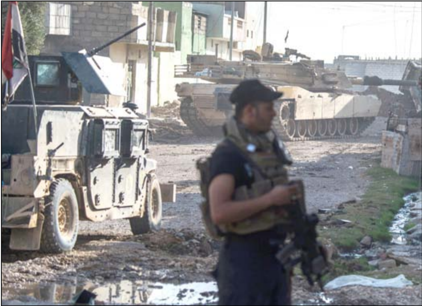
قطعات تابعة لمكافحة الإرهاب في أحياء الموصل الشرقية.

واقترح مجلس نينوى وقتها الاستعانة بطائرات "الأباتشي" لتوجيه ضربات دقيقة لأهداف داعش داخل الأحياء السكنية أو زج قوات النخبة الأميركية بدلا عن تجريد العمليات. ويخشى المسؤولون المحليون من تعرض جهاز مكافحة الإرهاب، صاحب النقل الأكبر في عمليات الساحل الأيسر، الى استنزاف قوته في حال استمرت العمليات لفترة أطول من المتوقع، كما حدث مع الفرقة التاسعة خلال عملية