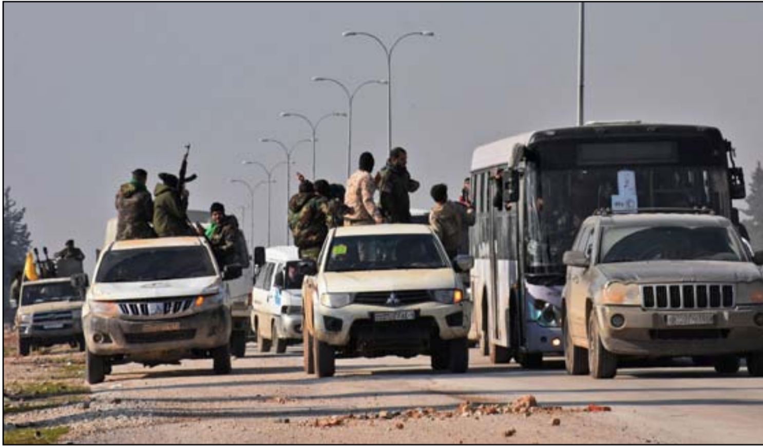
السوريون الذين تم إجلاؤهم من الفوعة وكفريا...

روسيا وإيران وتركيا تجري محادثات اليوم الثلاثاء بشأن سوريا