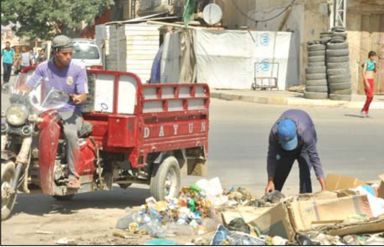
عمال بلدية في احد شوارع العاصمة

ويشكو مواطنون من انتشار النفايات في العديد من المناطق بالرغم من الجهد التي تقوم به امانة بغداد والدوائر الخدمية في المحافظات.