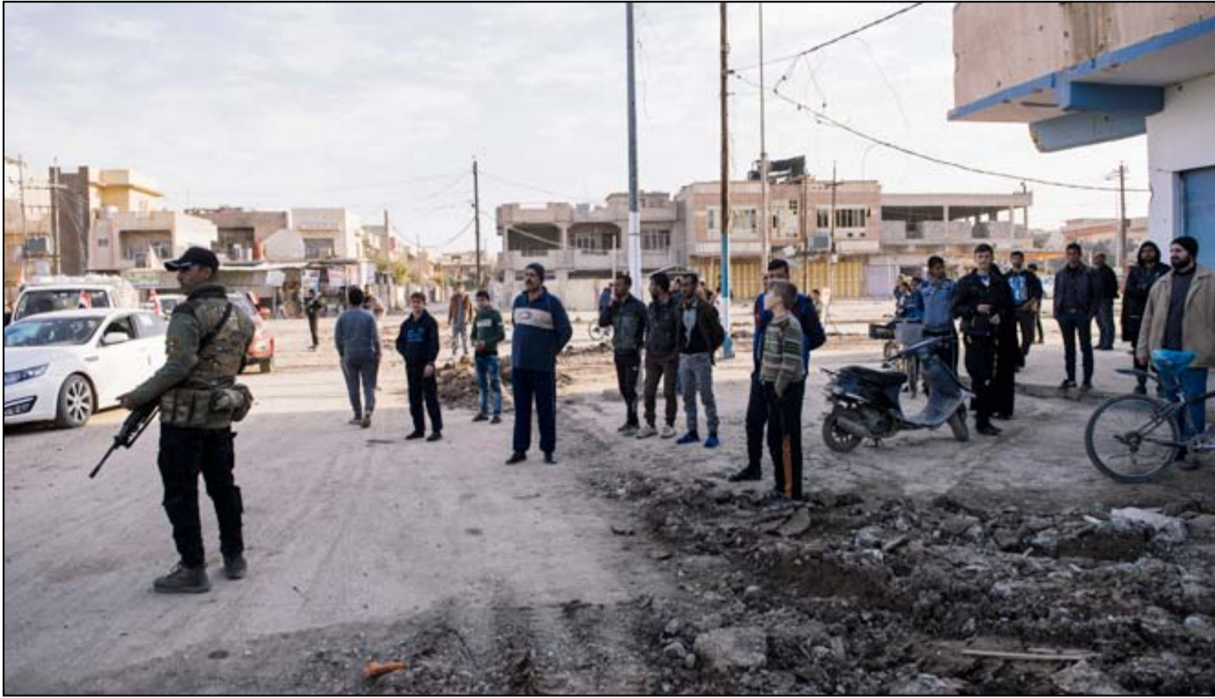
جندي يقف بالقرب من مجموعة موصليين في حي الزهراء...

بدأت القوات العراقية هجومها على مجمع الحدباء السكني في وقت مبكر من يوم الجمعة وهو ما أدخلها الحدود الشمالية للمدينة للمرة الأولى منذ بدء الحملة لاستعادة آخر معقل كبير للمسلحين في العراق قبل نحو ثلاثة أشهر.