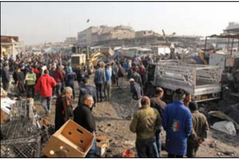
دمار خلفه تفجير جميلة...