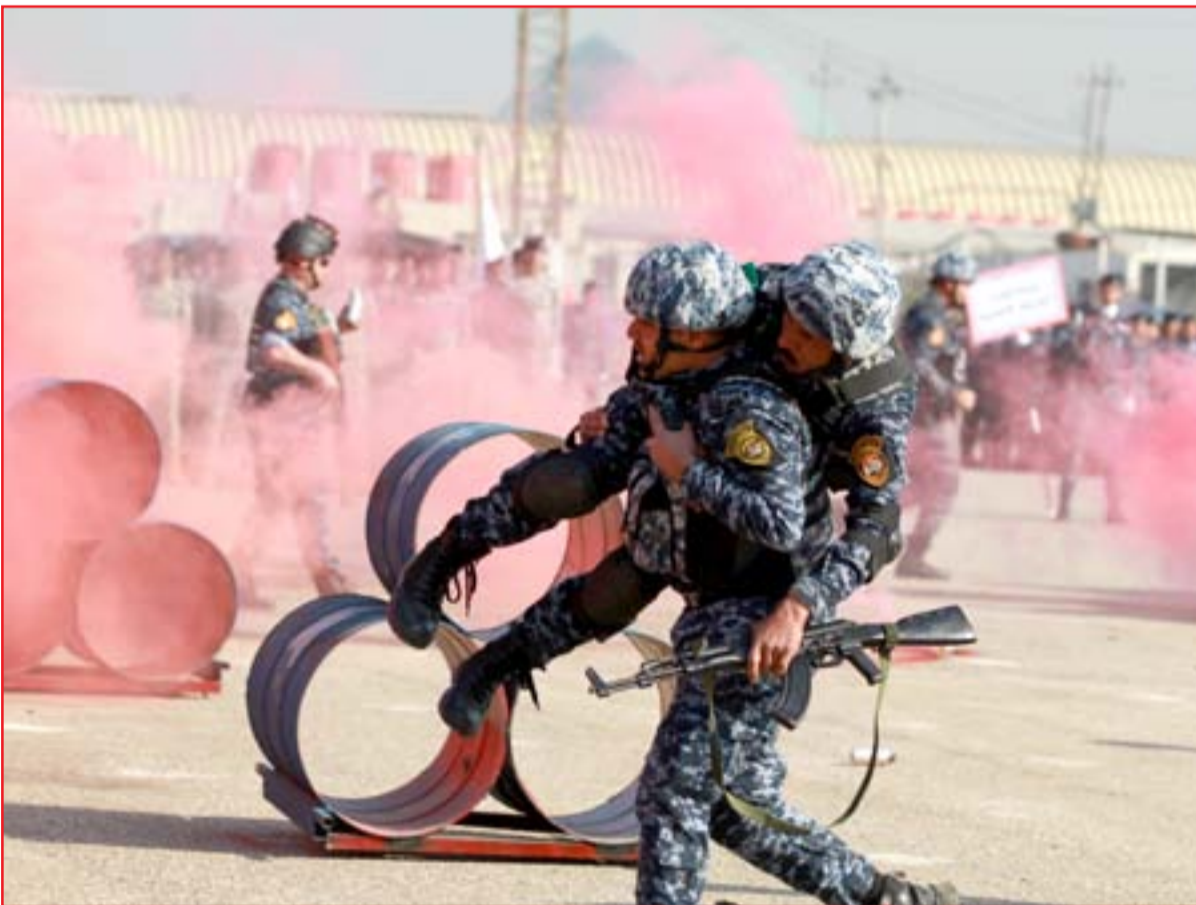
جانب من فعاليات الاحتفال بعيد الشرطة..