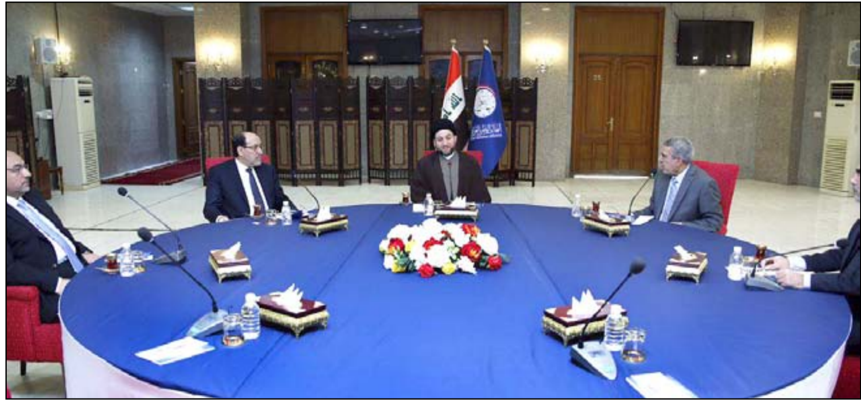
الهيئة القيادية للتحالف الوطني خلال الاجتماع