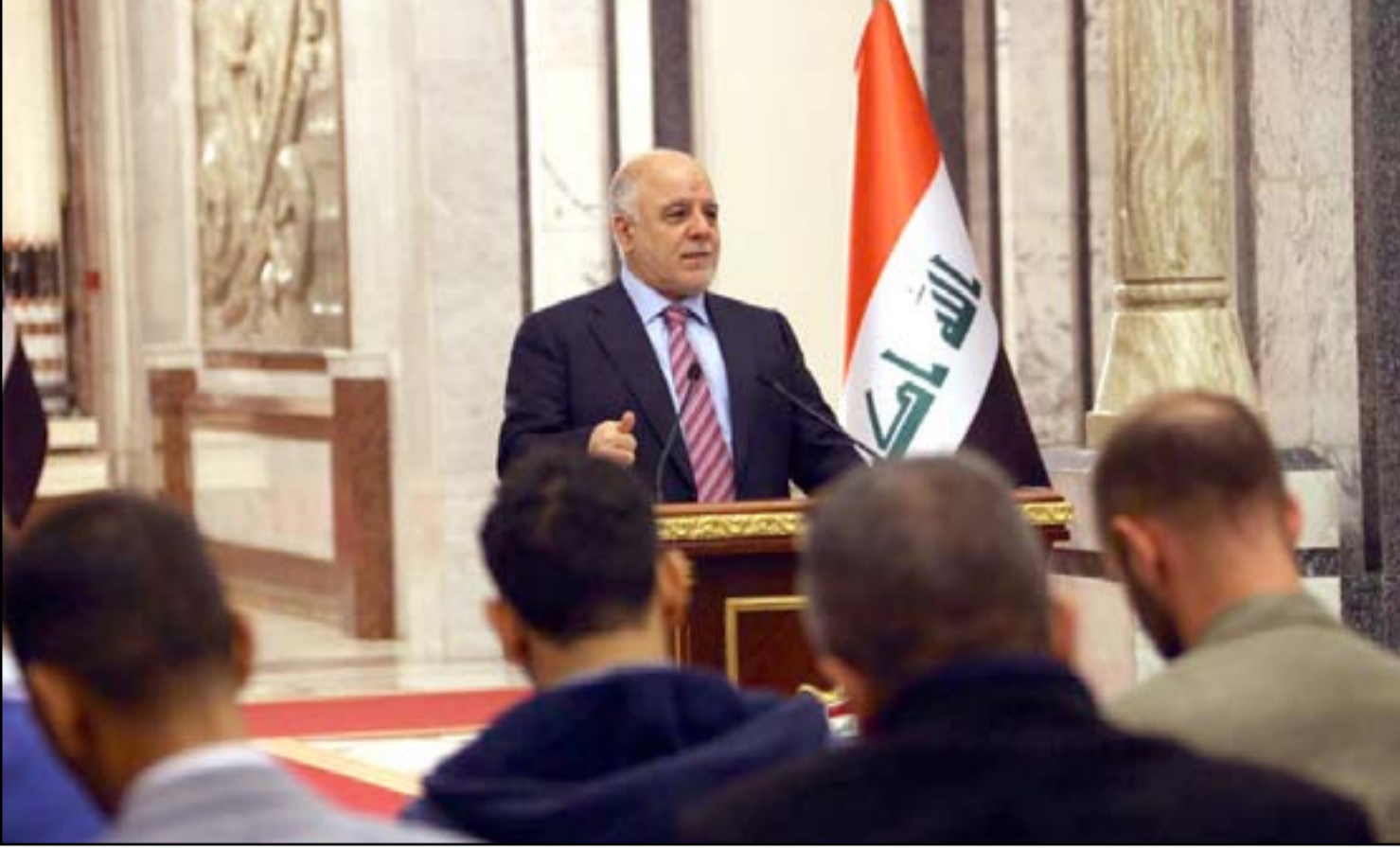
العبادي خلال مؤتمر صحفي

وبشأن التطورات العسكرية في الموصل، قال العبادي إن "قيام عصابات داعش الإرهابية بتفجير جسور الموصل لن يمنعنا من تحريرها"، مؤكداً أن "الحكومة تولى اهتماما كبيرا بمعالجة جرحى القوات الأمنية". وشدد على أن "الحكومة