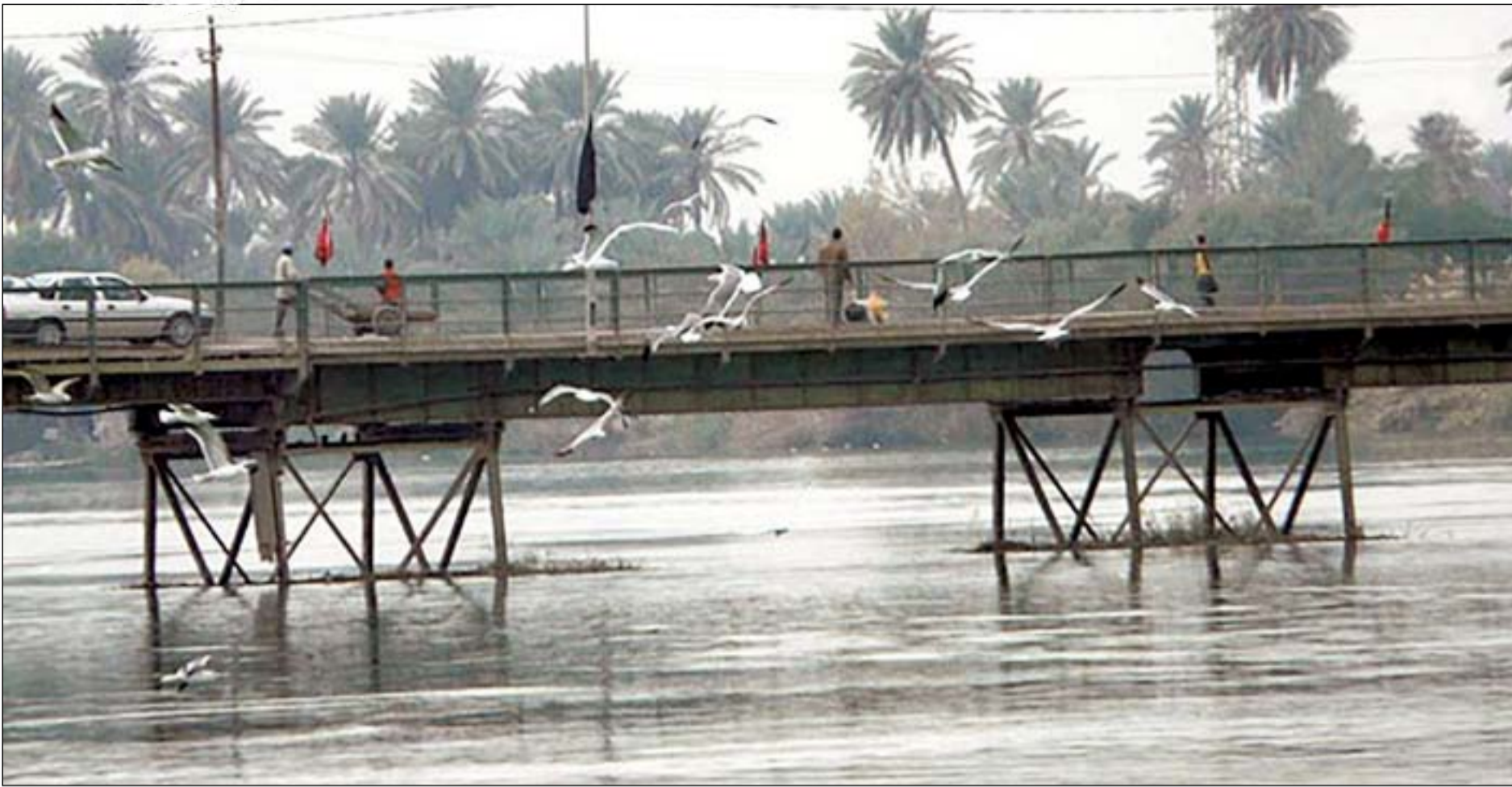
جسر المسيب أحد معالم المدينة