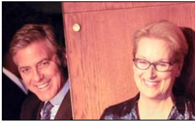
سوريا وهو الذي حصل كلوني حديث كلوني جاء خلال حفل بروي حياة متطوعين لإنقاذ الضحايا في "أظننا انتحسنا أكثر الآن".

* تفاعل الآلاف مع الفنانة اللبنانية نجوى كرم في أولى حفلاتها لعام ٢٠١٧ التي بدأتها من فرنسا، لتقف لأول مرة على مسرح الأولمبيا في باريس. * نشر الفنان شريف سلامة بوسترات البرنامج التلفزيوني الجديد "قعدة رجالة" الذي يقدمه مع مكسيم خليل وإياد نصار، ويبدأ عرضه على إحدى الفضائيات المصرية قريباً.