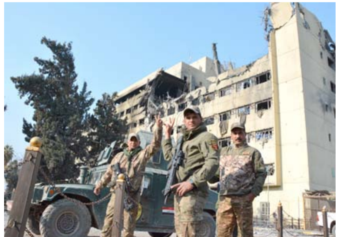
جنود يحتفلون بالسيطرة على مستشفى السلام شرق الموصل... أ.ف.ب

رئيس الجمهورية يصادق على موازنة 2017 بعد شهر من إقرارها