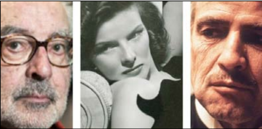
كاثرين هيورن: أرملة الكاتب دودلي نيكولاس، التي رفضت الجائزة في عام ١٩٣٥. ووداي آلان: ممثل هوليوود، الذي رفض الجائزة في عام ١٩٧٣. ومارلون براندو: ممثل هوليوود، الذي رفض الجائزة في عام ١٩٧٣.

أربع منها. ولم تخضر هيورن حفلات "الأوسكار"، إذ لم تكن من المعجبين بمراسم توزيع الجائزة، لكنها كسرت هذا الحظر عام ١٩٧٤، لتقدم جائزة نورمان التكريمي وفقاً له.