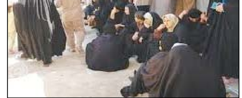
مشمولون بالرعاية الاجتماعية في كربلاء