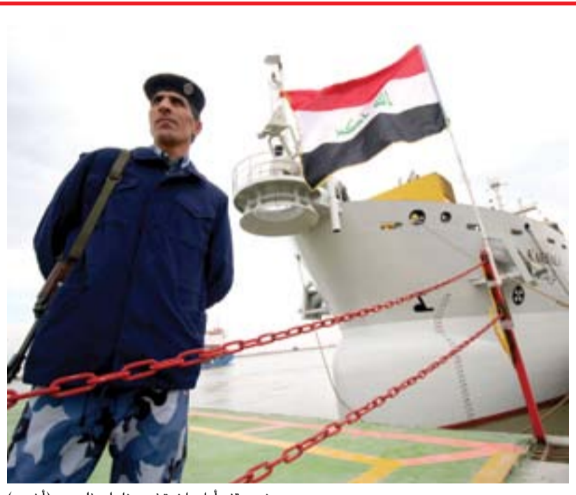
جندي يقف أمام باخرة في ميناء أبو فلوس..

المستوردة على حساب المنتج الوطني"، مبيناً أننا "أكدنا في وقت سابق أن هذا المنتج هو بمواصفات ونوعية معتمدة ولا نسوق أو نروج لمنتجات رديئة".