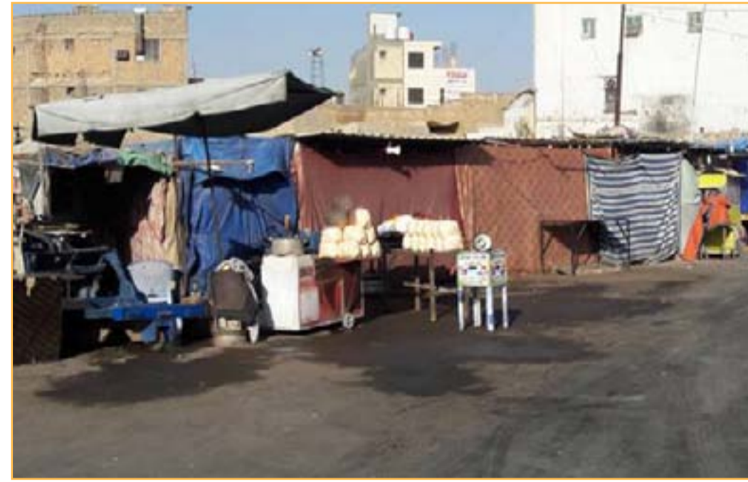
شاشيل ودور تراثية