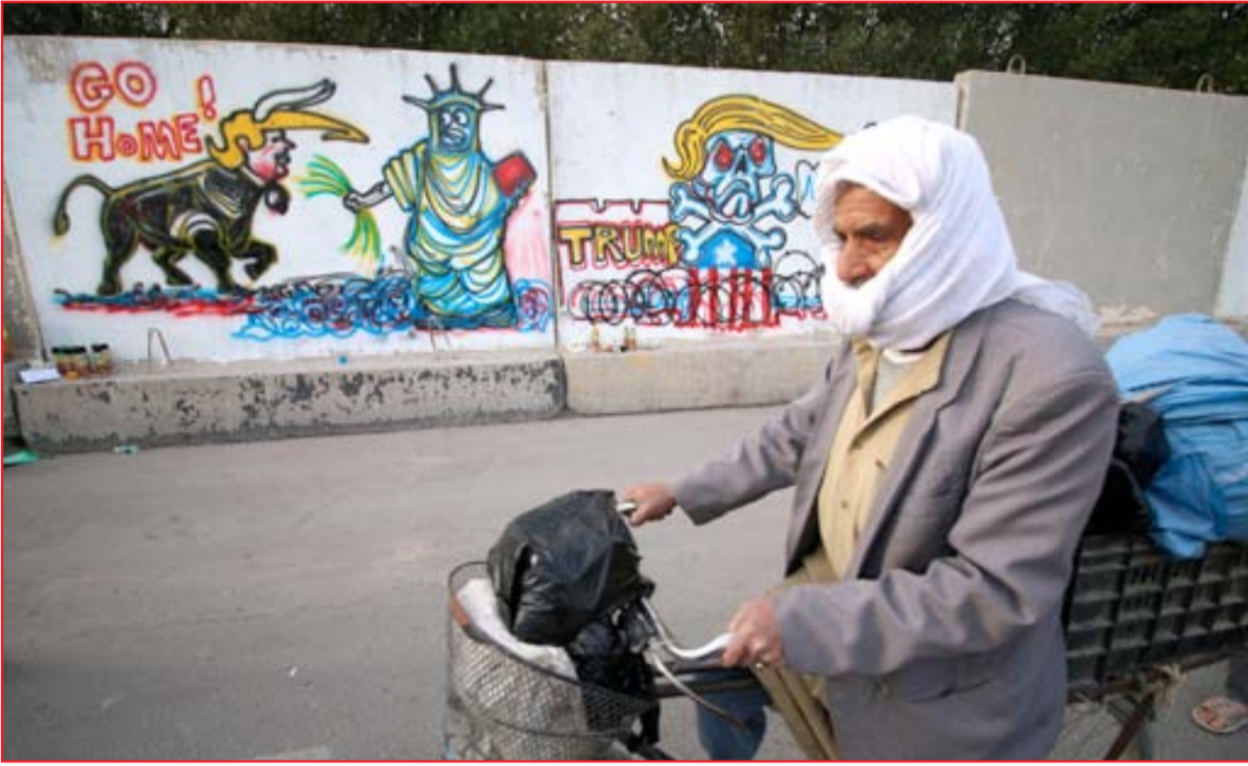
عراقي يمر من أمام "غرافيتي" مناهض لترامب في أحد شوارع البصرة