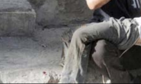
جندي يحمل طفلاً جريحاً شرقي الموصل... (أرشيف)