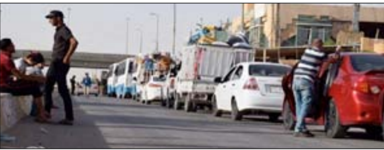
اسر نازحة خلال عودتها الى الفلوجة..ارشيف.

الشرطة تسترعى خلال الأسبوع المقبل، بعملية انخزال الأسر النازحة بعد تدقيق معلوماتها بشكل كامل ونقلهم الى مناطقهم من قبل الجهات الحكومية المختصة".