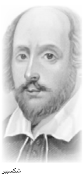
شكسبير ابن خلدون إزرا باوند

وماذا عن كلمة ضيزى في الآية الكريمة: "الكم الذكّر وله الأنثى. تلك إذن قسمة ضيزى"