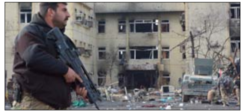
قوة عسكرية في حي السلام شرقي الموصل..ارشيف.