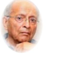
د. رفعت السعيد

شديد من الشرطة الفرنسية فترك بيروت إلى فلسطين ليرأس تحرير صحيفة فلسطين لصاحبها عيسى العيسى وليواصل على صفحاتها الهجوم على الاحتلال البريطاني، ولم تمض سوى بضعة أشهر حتى بلغ اهله نبأ وفاته إثر جراحة بسيطة أجريت له في المستشفى الفرنسي بيفاف. وقيل أن المخابرات البريطانية قد دبرت قتله، وتأييد هذا الشك عندما اصرت السلطات