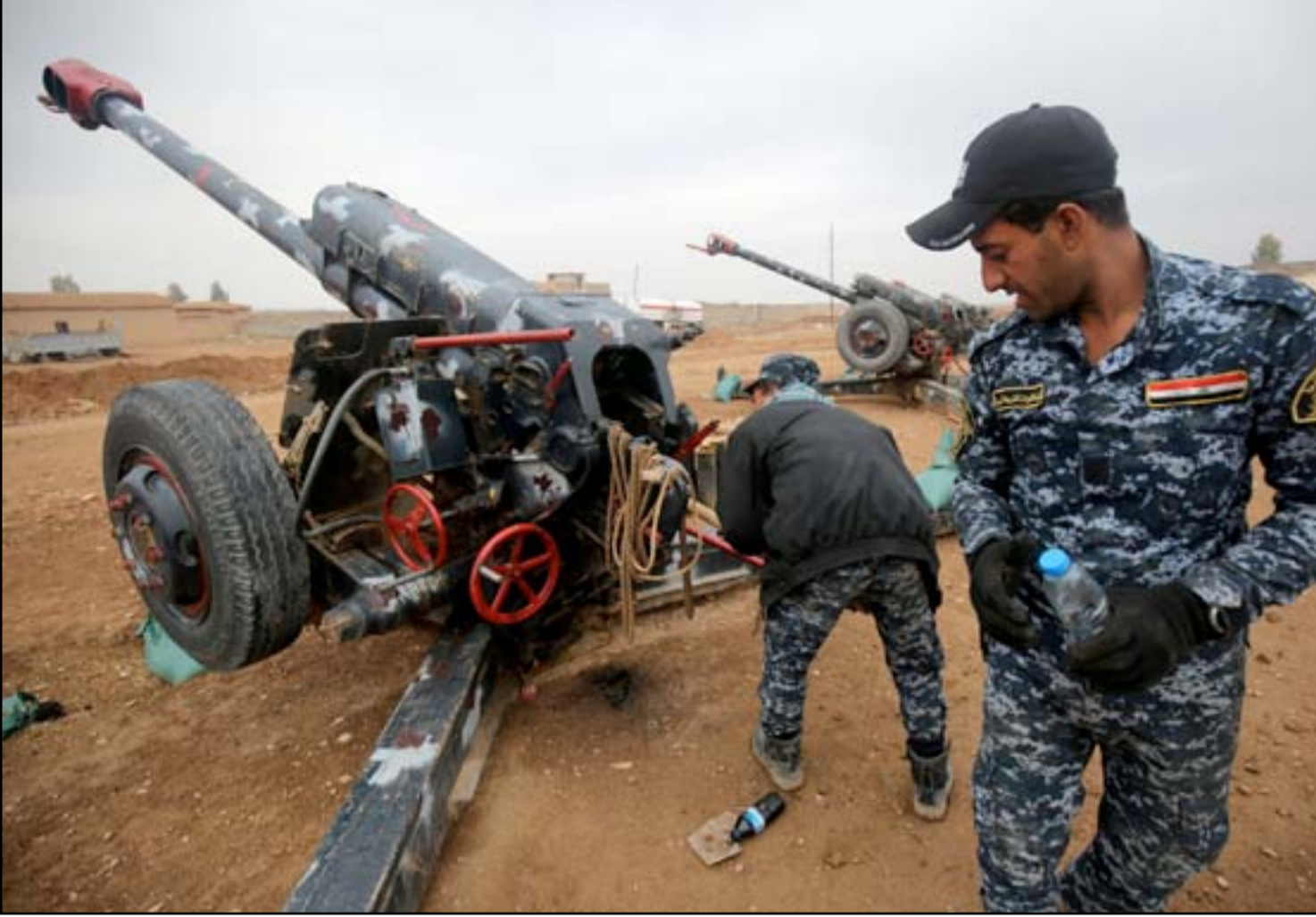
مقاتلو الشرطة الاتحادية يقصفون مواقع داعش جنوبي الموصل..ارشيف.

وفي سياق متصل، أعلن قائد الشرطة الاتحادية الفريق رائد شاكر جودت، عن تمركز قواته بكامل جاهزيتها جنوب مدينة الموصل. وقال جودت، في بيان مقتضب تلقت (المدى برس) نسخة منه، إن "قطعات الشرطة الاتحادية، تمركزت جنوب الموصل بكامل جاهزيتها، والعدو يفقد السيطرة على عناصره في الجانب الأيمن". إلى ذلك، قال مصدر أمنى لـ (المدى برس)، إن "القوات العراقية والتحالف الدولي شنّت قصفاً مدفعياً وغارات جوية مكثفة على الجانب الغربي من الموصل، في خطوة تمهد لاقتحام هذا الجانب برياً".