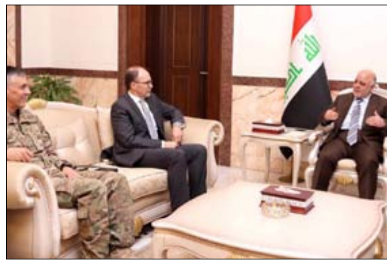
اجتماع العبادي والسفير الامريكى

وفي سياق متصل، تناول مندوب العراق الدائم لدى الأمم المتحدة محمد علي الحكيم، في اجتماع مجلس الأمن الذي عقد لمناقشة اوضاع العراق، قرار الرئيس الأميركي دونالد ترامب.