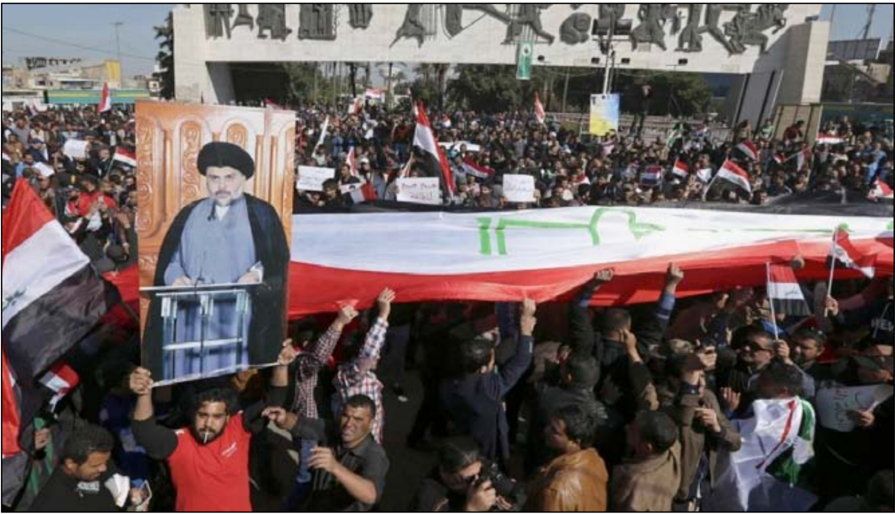
مظاهرات التيار الصدري في ساحة التحرير

وأضافت الطائي، في تصريح لـ(المدى)، أن "هذه الاحتجاجات سترفع شعارات لتغيير المفوضية العليا للانتخابات التي نعتبرها، نحن الصدريون، غير مستقلة لأنها أنت بطرق غير ديمقراطية بعد تبنيها من قبل كتل