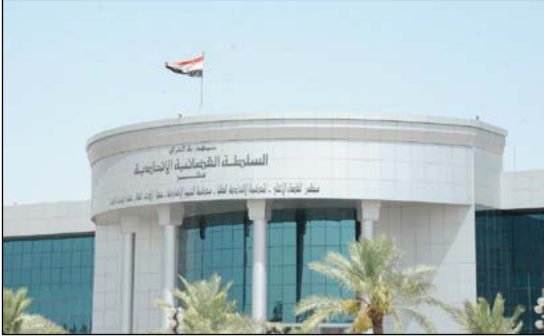
بنابة المحكمة الاتحادية

إلى ذلك، قال عضو مجلس القضاء الأعلى القاضي طالب حربي في تصريح إلى صحيفة "القضاء"، إن "المحاكم تناقش باستمرار ظاهرة العنف ضد المرأة وتحاول وضع الحلول لها بعد تحديد الأسباب". وتابع حربي أن "العنف وفقاً للقانون هو سلوك أو فعل إنساني يتم بالقوة والإكراه والعدوانية، صادر من طرف يكون فرداً أو جماعة أو دولة موجه ضد آخر، محمداً الغرض منه "هو إخضاع المستهدف منه أو استغلاله مما يتسبب في إحداث أضرار مادية أو معنوية". أما العنف ضد المرأة، براه حربي "سلوكاً أو فعلاً موجه إلى المرأة يقوم على القوة والشدّة والإكراه، ويخذ أشكالاً متعددة نفسية وجسدية متنوعة الأضرار".