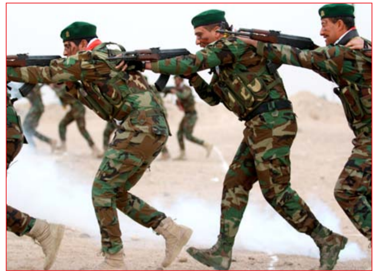
متطوعون في الحشد يتلقون تدريباتهم في أحد معسكرات البصرة ... أ.ف.ب