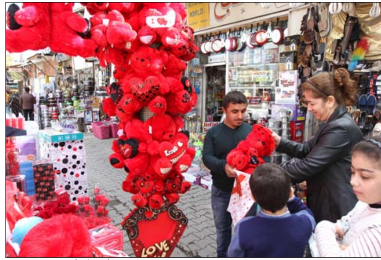
محل لبيع هدايا عيد الحب...