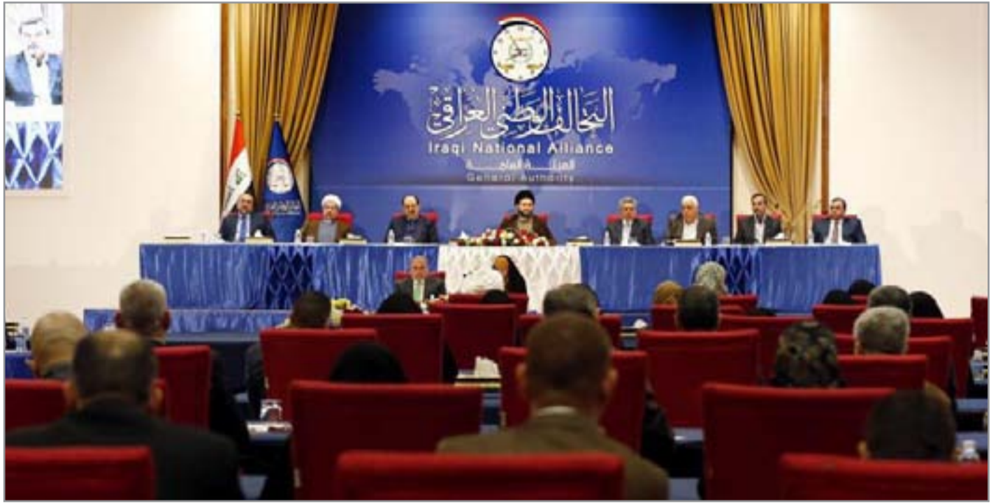
اجتماع سابق للتحالف الوطني.. إرشيف

لكن رئيس التحالف الوطني يواصل جولاته الإقليمية والداخلية لإقناع القوى السياسية بمشروع "التسوية