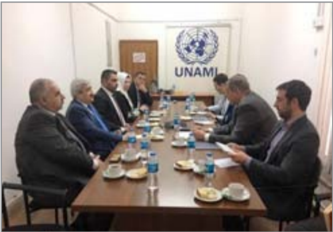
لقاء المفوضية مع ممثل الأمم المتحدة

وأعرب المجتمعون عن أسفهم وحنينهم للأحداث التي رافقت تظاهرات يوم السبت الماضي وتزجمت على أرواح الضحايا من قوائنا الأمنية والمدنيين، مؤكداً أن "التظاهر حرق كفله الدستور العراقي". ودعا المجتمعون، بحسب البيان،