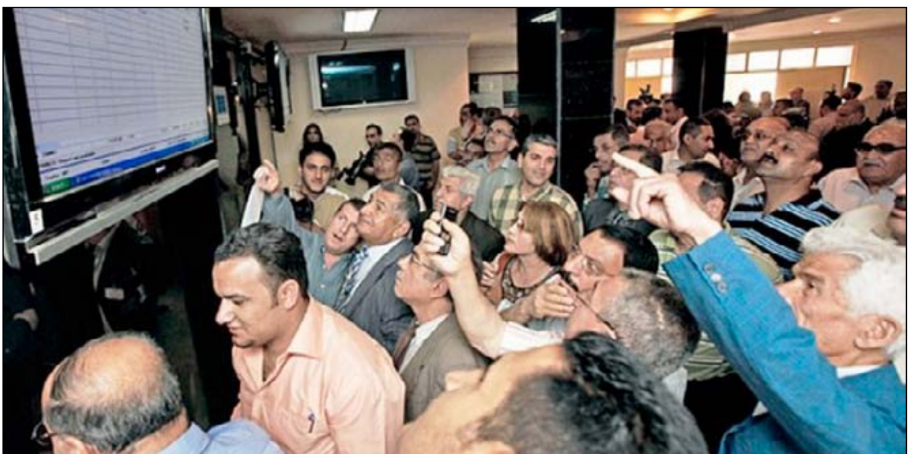
سوق العراق للأوراق المالية.. (أرشيف)

ويعد السوق مؤسسة منظمة تنظيماً ذاتياً مستقلة إدارياً ومالياً، لا يهدف إلى الربح وتعود ملكيته للأعضاء، ويدار من قبل مجلس المحافظين، وله الحق في تمكّل الأموال المنقولة وغير المنقولة، وبضمنها العقارات، كما يلتزم بتعليمات هيئة الأوراق المالية طبقاً لقانون الأوراق المالية المؤقت.