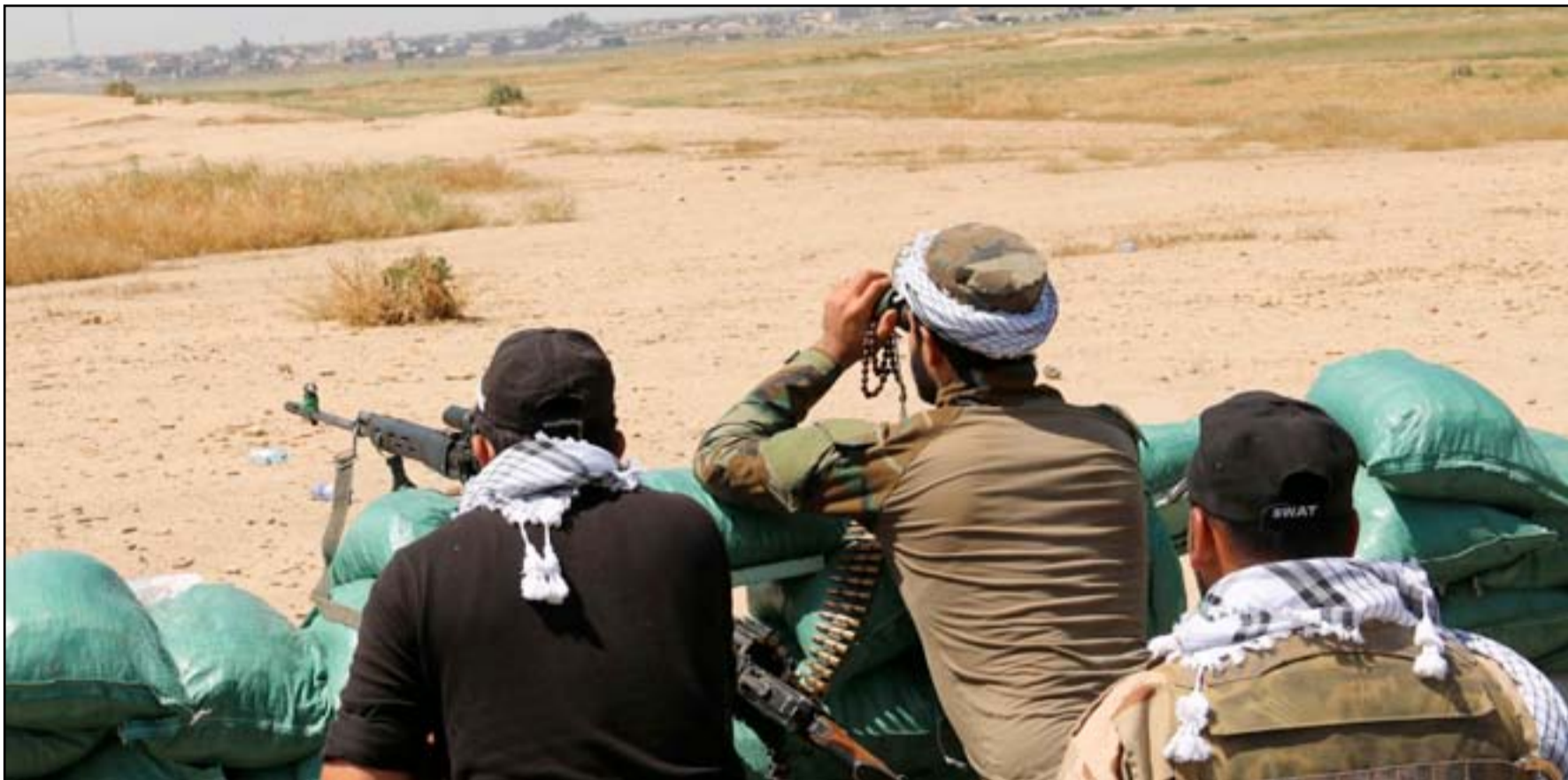
مقاتلون من حشد الحويجة شرقي كركوك.. (أرشيف)

وزارة الدفاع، لا يفي بمتطلبات المعركة، فضلا عن كونه قليلا جدا، مما دفعنا الى شراء بعض الاسلحة بالاعتماد على النثرية الخاصة بالحشد". وأوضح ان "الاسلحة التي وصلتنا