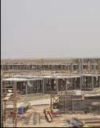
توقف المشاريع في الناصرية