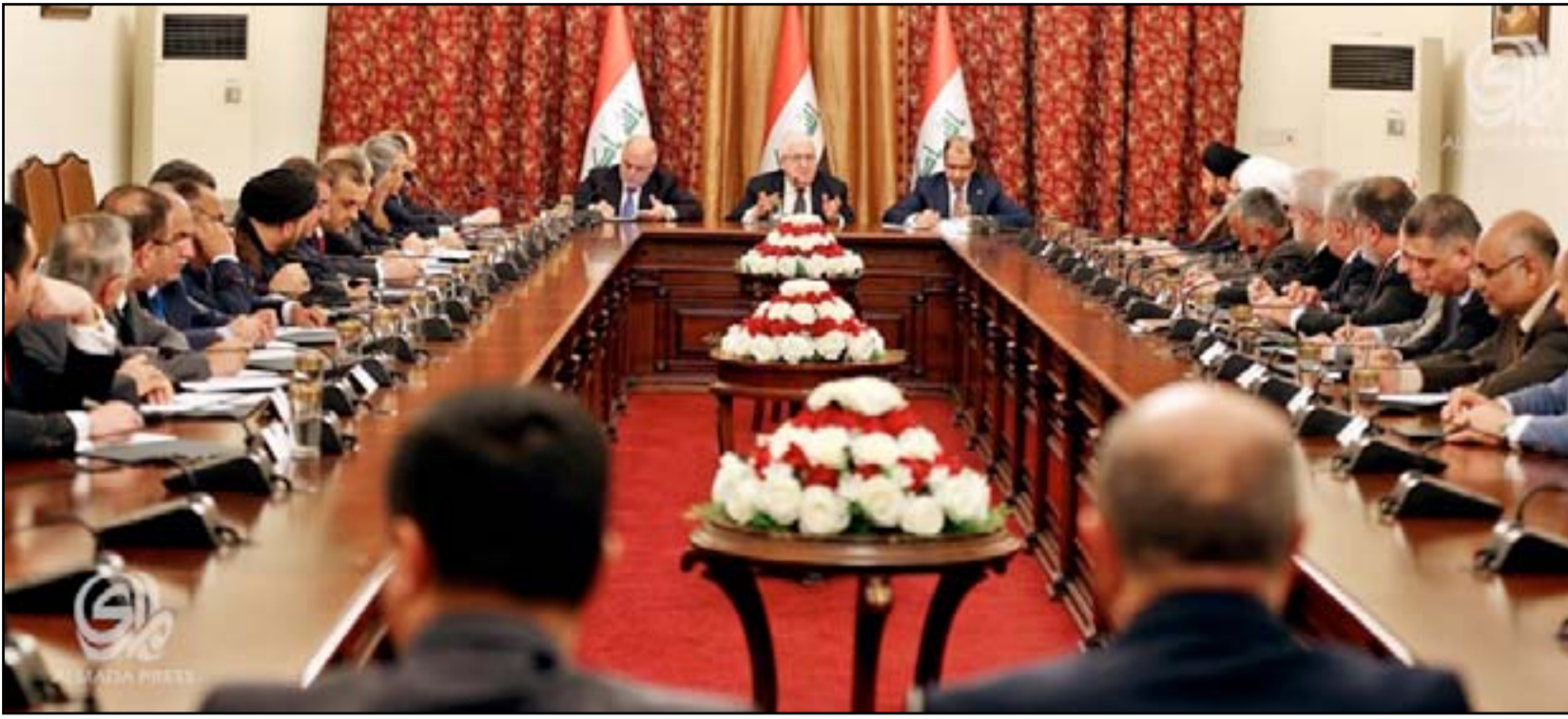
اجتماع الرئاسات الثلاث والكتل السياسية.. أريشيف

استخدام المقار الحكومية وأموالها لصالح جهة انتخابية. ويتزامن انطلاق هذا المشروع مع جهود بيدلها رئيس التحالف الوطني عمار الحكيم لتسويق مشروع "التسوية السياسية" بدعم أممي أيضا. ورغم الخلافات الأخيرة بين المجلس الأعلى وحزب الدعوة حول تداول رئاسة التحالف الوطني، فإن السياسي الشيعي يقول إن الطرفين يعلمان على التخليص من مسودة رئاسة الجمهورية للانتخابات البرلمانية. وتكشف القيادي في التحالف الوطني عن مشاورات واتصالات تجري مع قوى كردية وسنية بهدف التحشيد لإسقاط القانون ورفضه من حيث المبدأ داخل مجلس النواب الذي يستعد لمناقشة المسودة خلال جلسة اليوم الإثنين.