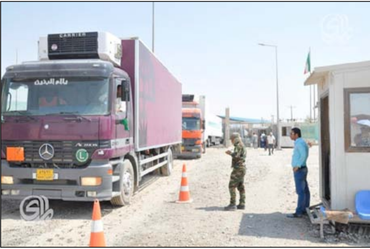
دخول شاحنات تجارية عبر منفذ زرباطية الحدودي مع إيران.. (أرشيف)

تظاهر العشرات من أصحاب الشاحنات، أمس الأحد، عند منفذ زرباطية الحدودي احتجاجاً على الإجراءات الادارية المتبعة فيه، مطالبين بتخفيض الرسوم الضريبية على شاحناتهم وإلغاء كتب "تسهيل المهمة" والمنفيسات الإيرانية غير الرسمي، فيما أكدت ادارة قضاء بكرة أنها ستعمل على إيصال مطالب هذه الشريحة الى الجهات المعنية.