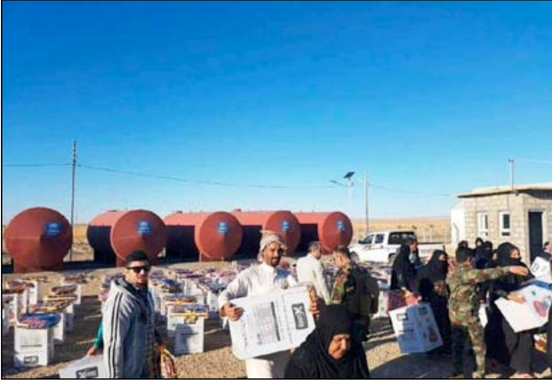
نازحون يتسلمون مساعدات اغاثية في ذي قار

للتشاور مع هيئة الحشد الشعبي، لمشاركتها في المكتب الخاص، مؤكداً أن محافظة ذي قار كانت ولا تزال تقدم عبر رجالها وبناتها التضحيات التي تزيّننا إصراراً على الانتصار بالعبادة ضد الإرهاب. ومن جانبه قال رئيس هيئة الحشد فالح الفياض خلال المؤتمر، إن ذي قار تشكل رافداً أساسياً للحشد الشعبي، فضلاً عن كونها ركناً أساسياً في المنظومة العسكرية العراقية، وترقد كل قواتنا بالمقاتلين وتقدم التضحيات الكبيرة. وتابع الفياض، أن الحشد الشعبي من القوى الأساسية والمهمة المشاركة في عمليات تحرير محافظة نينوى ويتولى مسؤولية قاطع مهم وأساسي وهو القطاع الغربي، لافتاً إلى حوض مقاتلي الحشد معارك مهمة في محيط تلغرف وقرب الحدود العراقية السورية. وأضاف الفياض، أن الحشد سيكون حاضراً وجاهزاً في كل المناسبات القادمة التي تتطلب حفظ الحدود وتطهير الصحراء وضواحي الموصل، مبيّناً أن "المعركة في الموصل تدار من قبل رئيس الوزراء وقيادة العمليات المشتركة، وأن الخطط الموضوعية أثبتت نجاحها وكفاءتها في تحرير الساحل الأيسر"، مؤكداً تحقيق تقدم كبير في تحرير قرى في الساحل الأيمن. وكان أكثر من ١٥ ألف متطوع من أبناء محافظة ذي قار، مركزها مدينة الناصرية (٢٧٥ كم جنوب بغداد)، قد تطوعوا ضمن الحشد الشعبي خلال الأشهر الماضية، لدعم القوات المسلحة في قتال التنظيمات والمجموعات الإرهابية، كما يشارك عشرات الآلاف من أبناء المحافظة في تنفيذ مهام قتالية ضمن القوات المسلحة والقوات الأمنية.